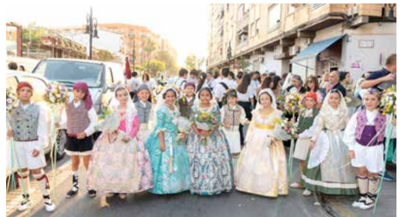
Ofrena de flors