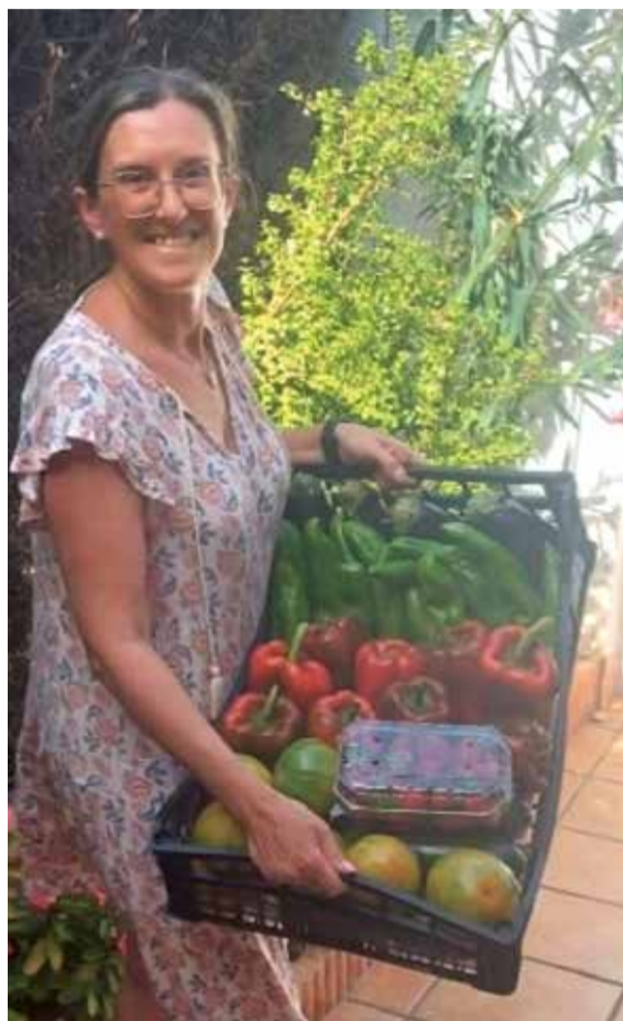
Guanyadora de l'últim sorteig

EL MERIDIANO REGALA CADA MES UNA CAIXA AMB PRODUCTES DE TEMPORADA ALS SEUS SEGUIDORS D'INSTAGRAM