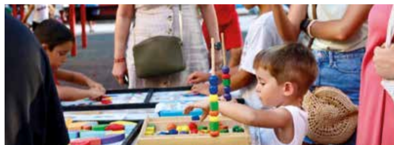
Jocs infantils durante les festes

música també ha jugat un paper fonamental amb activitats com el tradicional Concert de Bandes Simfòniques locals, el festival i tributs. Com sempre fes festes dels Moros i Cristians van ser la gran protagonista.