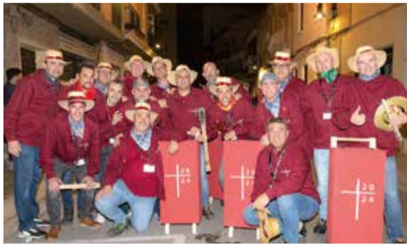
El foc sempre present a la Baixà del Crist