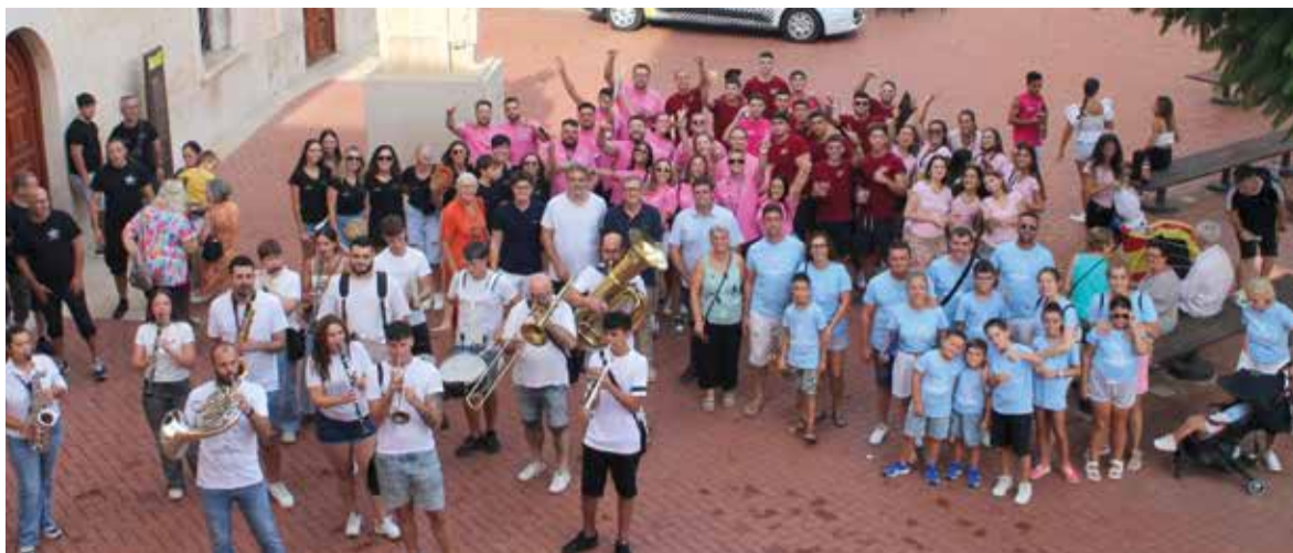
Imatge dels festers i la corporació municipal, moments abans del pregó d'inici de les festes