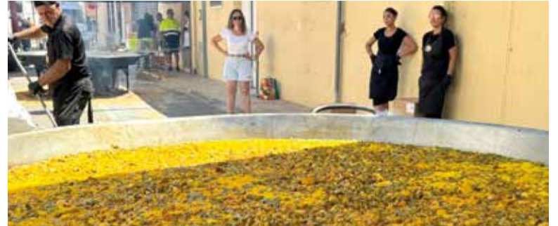
Paella gegant a Museros