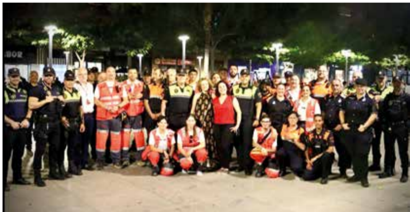
Efectius de festes junt a la alcaldessa i regidora