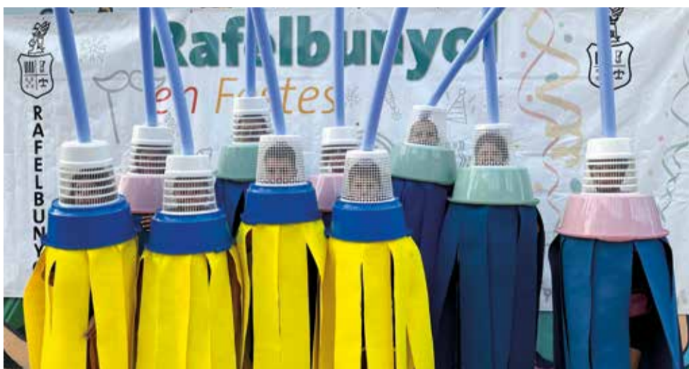
Festa de disfresses

El dissabte 7 arriba el torn dels bous al carrer, jornada amb la qual conclouen les festes populars, deixant tres dies per davant de festes patronals en honor a la Mare de Déu del Miracle i als Sants de la Pedra, que finalitzaran amb els actes del Clavaris i Clavariesses de la Mare de Déu del Miracle.