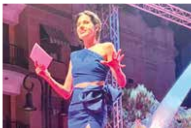
L'ACODA FASHION NIGHT D'ALDAIA OMPLI LA PASSAREL·LA

El passat dimecres 26 de juliol, Aldaia va viure una nit màgica amb la celebració de l'ACODA Fashion Night 2024. Més de 2000 persones es van reunir a la plaça de la Constitució per gaudir de les desfilades de moda dels comerços locals, que van omplir la passarel·la amb estil i elegància. Amb 1600 cadires i molts espectadors en peu, l'esdeveniment va demostrar ser un gran èxit de convocatòria.