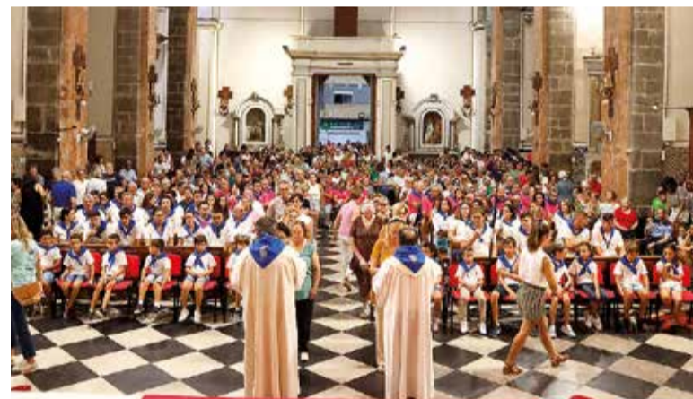
Romeria al Cabeçol