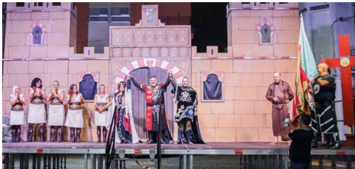
Ambaixades de Catarroja en 2023

Com explica Dolors Gimeno "Estellés és una figura importantíssima per al País Valencià, i mereixia que l'aniversari del seu naixement es celebrara d'una manera digna, però el nou govern de la Generalitat Valenciana ha decidit invisibilitzar-ho, així que, des d'altres administracions i sobretot, des del món de la cultura hem treballat i treballarem perquè el fill del forner siga homenatjat com es mereix".