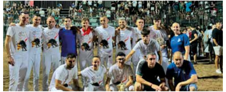
XXIV Setmana Taurina