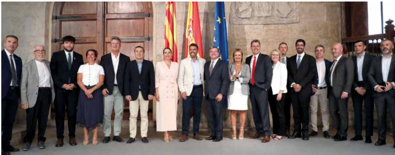
Presentació del projecte al Palau de la Generalitat