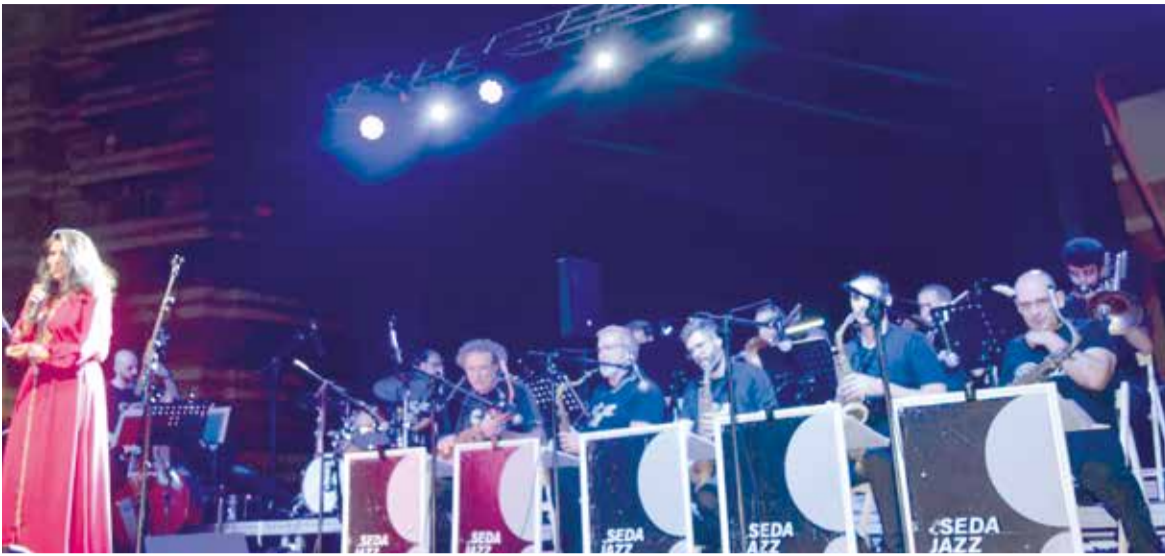
Concert en festes 2023