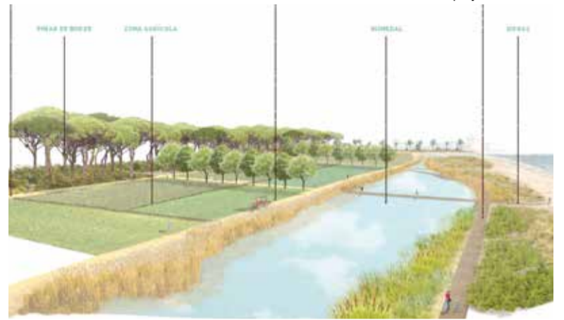
Recreació de Peixets