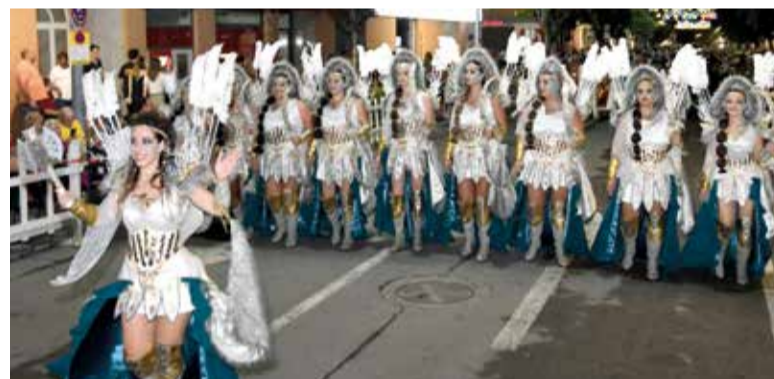
Desfilada dels moros i cristians

També uns dels moments més destacats va ser el desfilada de les comparses que van congregat a una multitud al llarg del seu recorregut pels carrers del poble, acompanyats de la música, balls, animació i els seus espectaculars vestits.