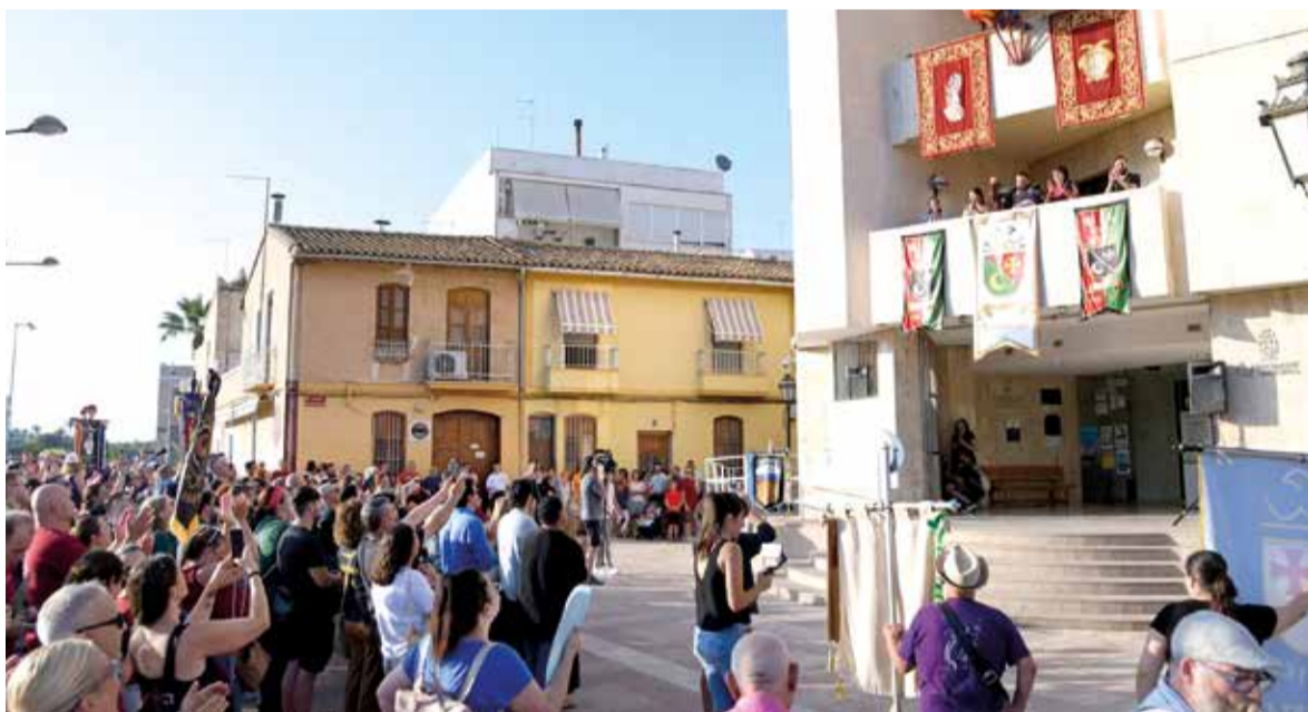
Pregó de l'inici de festes