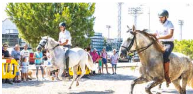
Carreres de joies