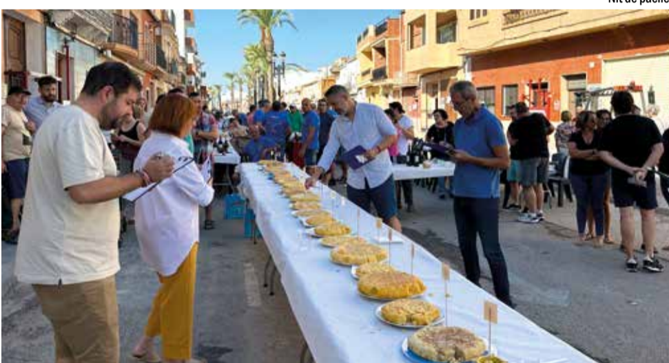
Concurs de truites