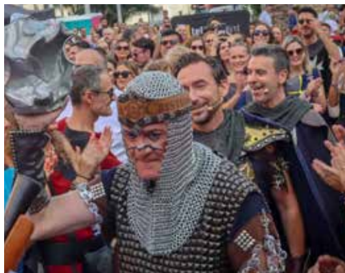
Bàndol cristià, arribant a la Torre