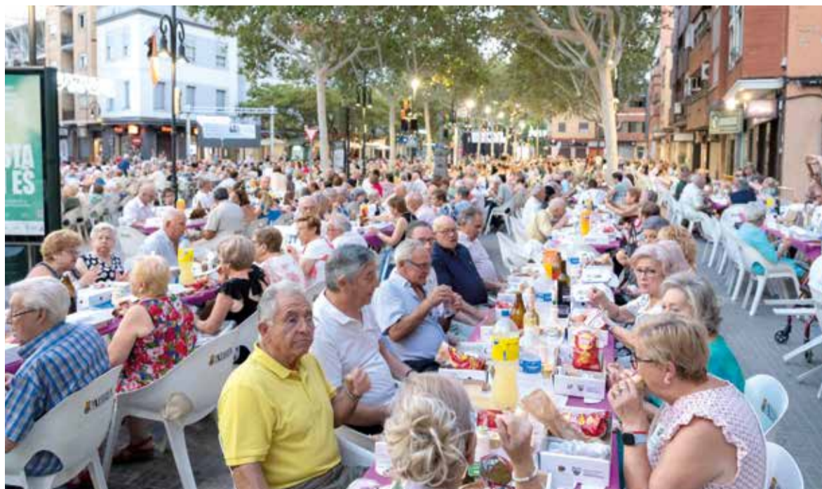
Sopar dels Majors