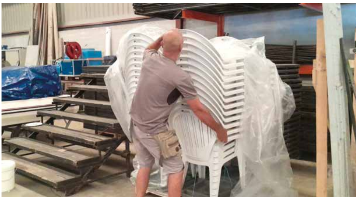
Repartiment de cadires