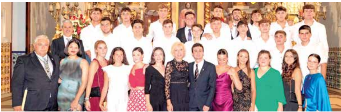
Festeres i festers 2024, junt a l'alcaldessa i regidors