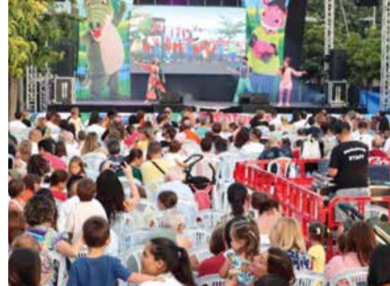
Cantajuego i les Aventures de Coco i Pepe