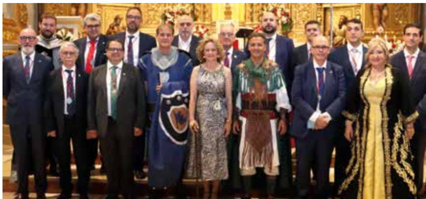
Solemne Missa Major i la Processó en honor als Sants Patrons, Abdón i Senén