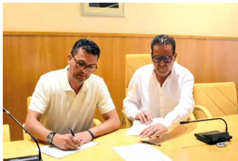
Alcaldes d'Alfafar i Sedaví

El soterrament de les vies de Sedaví, Alfafar i Benetússer és una