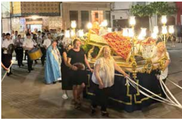
Celebració a la Mare de Déu de l'Assumpció