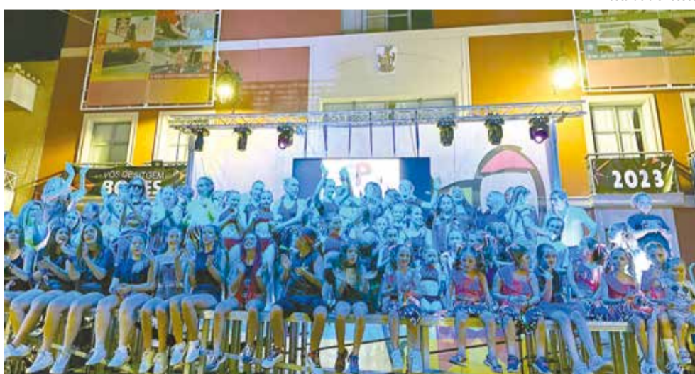
Nit de playbacks