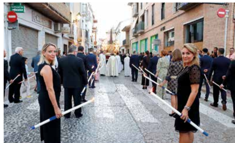
Alcaldessa junt a la vicepresidenta i consellera de la Generalitat durant la processó