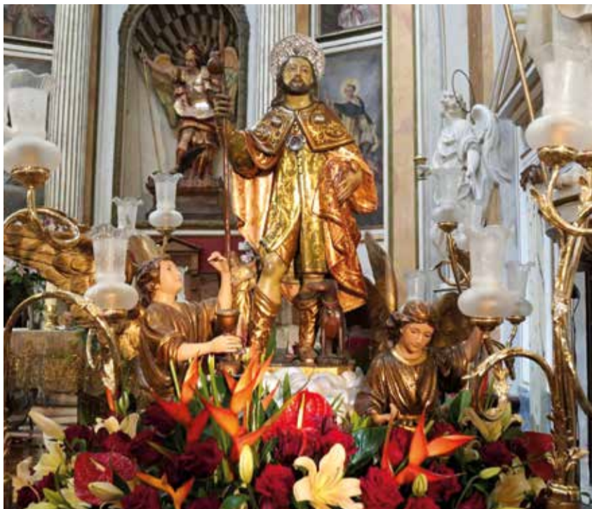
Sant Roc, patró de Burjassot