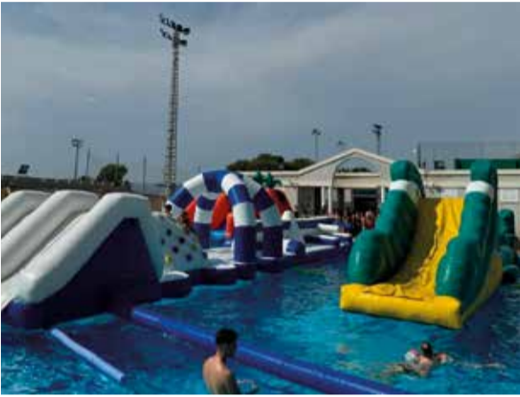
Dia dels xiquets i les xiquetes