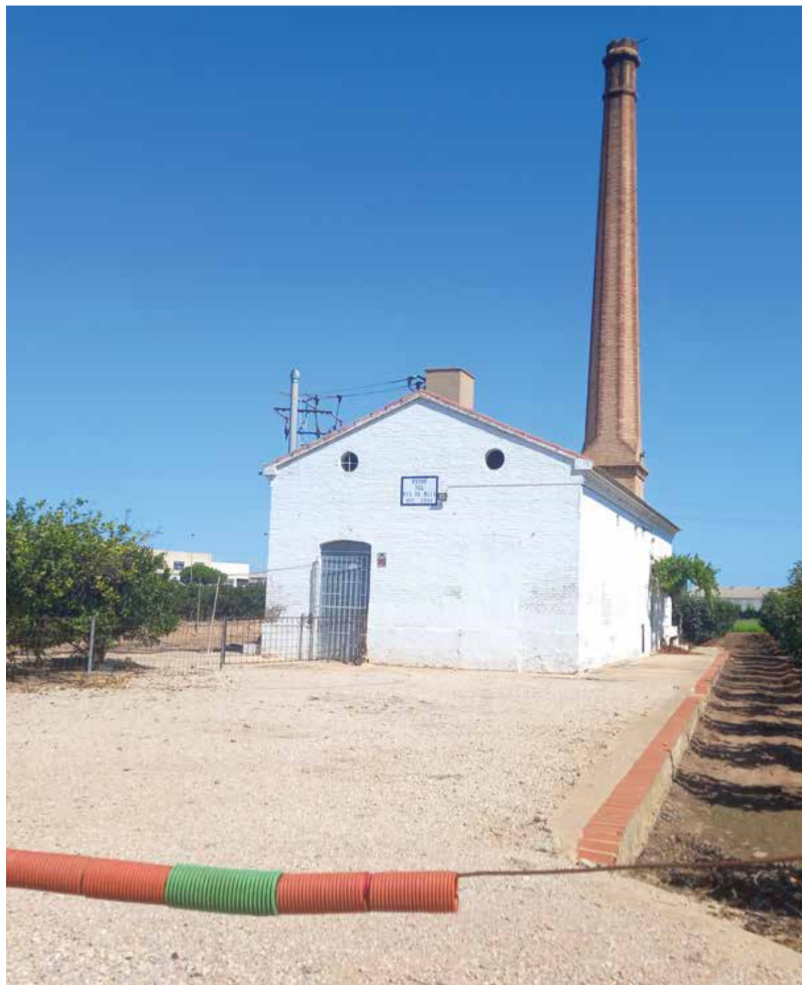
Motor del Mas de Baix de Silla, un dels afectats.