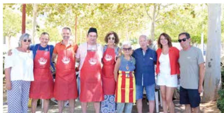
Concurs de Guisat de Sant Roc