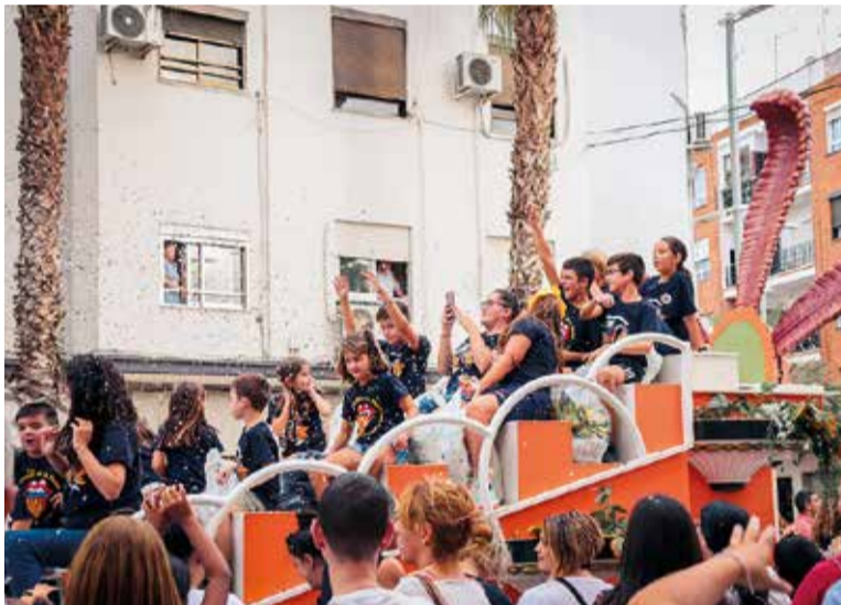
Cavalcada de Sant Miquel

Ja s'han revelat algunes de les sorpreses preparades per l'Ajuntament de Catarroja per a esta festivitat, com el concert del grup valencià La Fúmiga el pròxim 13 de setembre. Esta, al costat d'altres actuacions d'artistes locals i valencians, com Miquel Gil o l'Orquestra Montecarlo, i del territori nacional,