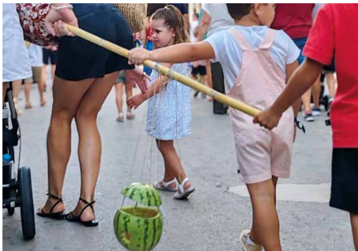
Passacarrers del melonet