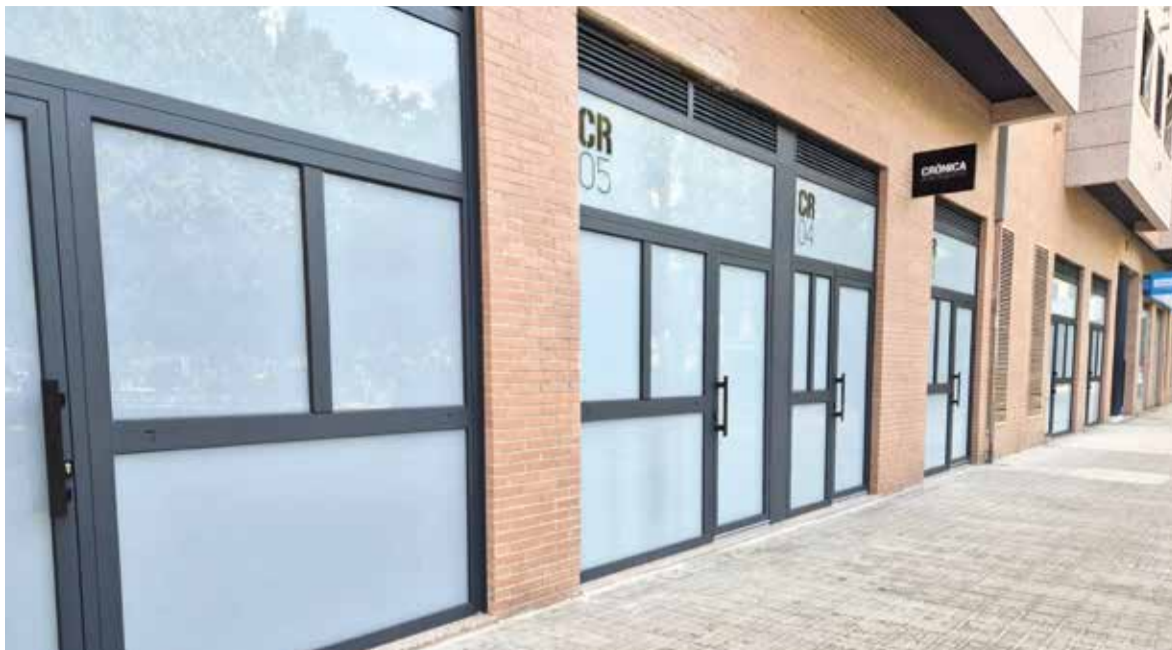
Pisos turístics a València