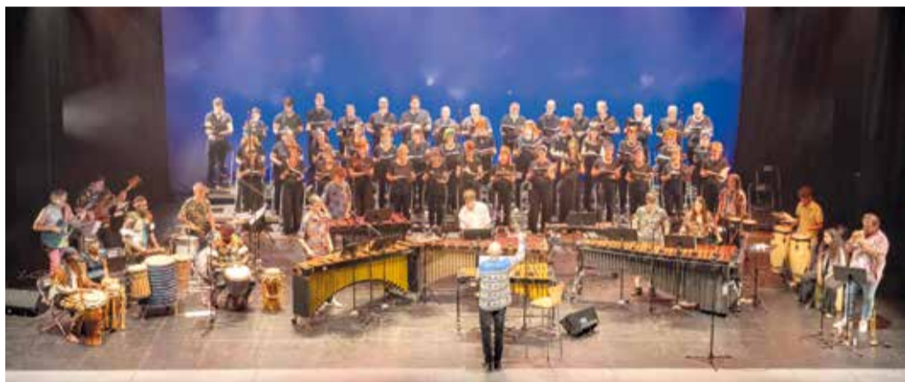
Imatge del concert