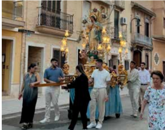
Festa en honor a la Immaculada Concepció.