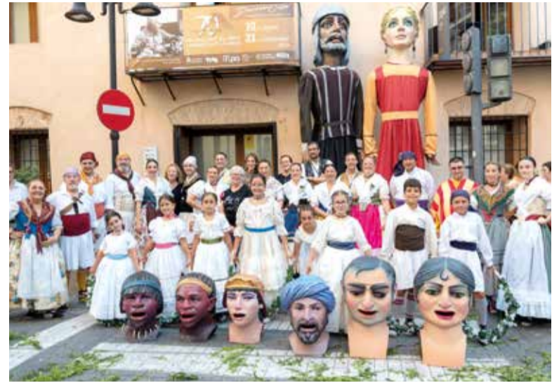
Processó del Crist