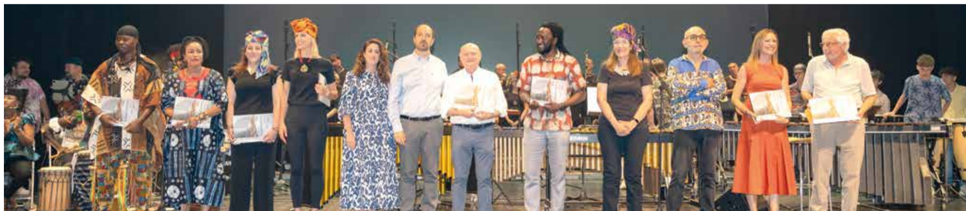
Alcalde i regidora, junt a l'Orfeó d'Aldaia

La moció conclou afirmant que "mentre l'escala administrativa i nous responsables s'acoblen a un àmbit i funcionaments del sector que (potser) no coneixen, poden beneficiar-se del treball provat, rigorós i perfil durant més de 30 anys, poden ajudar-se del sector professional, ajuntaments i gestors culturals amb un model com l'anterior que pot resoldre l'exercici de 2024 sense ansietats i daltabaixos i servir de partida de cara a un de nou".