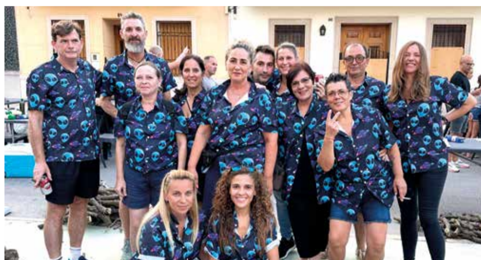
Nit de paelles