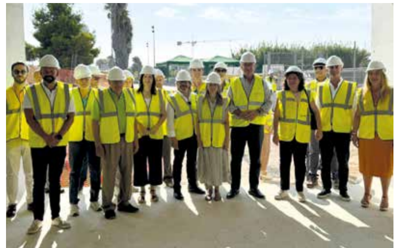
Visita a les obres

La Direcció General d'Infraestructures ha intensificat els treballs durant l'època estival, amb menys intensitat de trànsit. En este sentit, s'està duent a terme l'execució del pas de l'itinerari per a ciclistes i vianants de l'anell verd davall la CV-400. L'actuació s'està executant en dos mitats, de manera que una de les dos calçades estiga oberta i per esta discórrega el trànsit en sentit nord (València/V-30) cap al sud (Albal), amb les limitacions de velocitat corresponents.