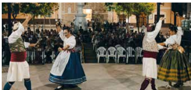
Concert GC Bastonots