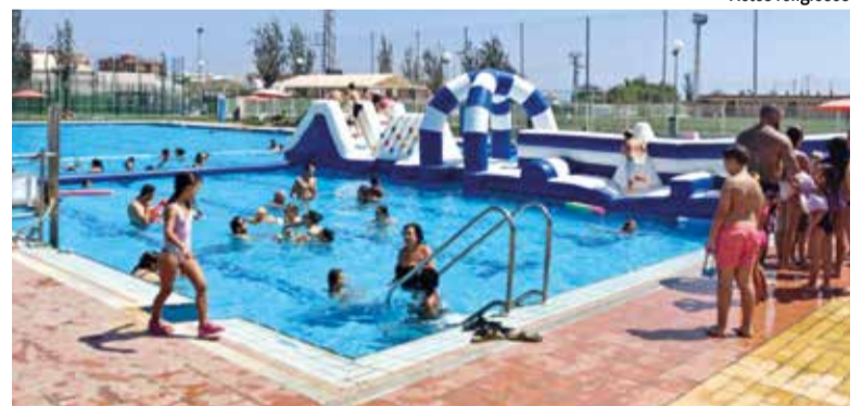
Dia de la piscina