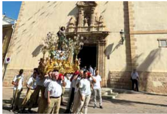
Celebració en honor al patró, Sant Roc, amb el trasllat de la imatge a l'ermita