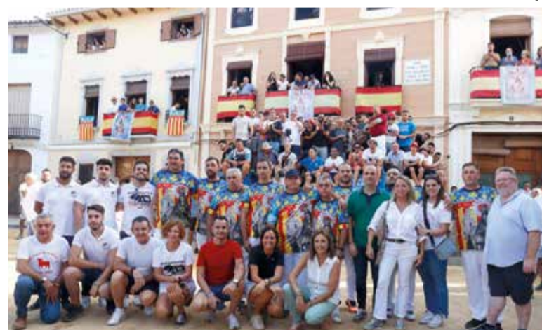
Vesprada del 7 de setembre