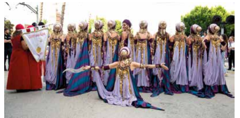
Moros i cristians