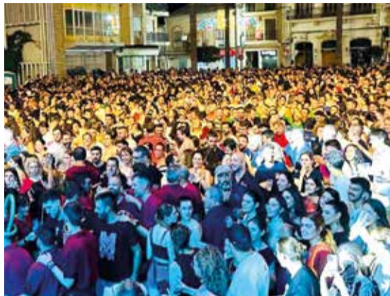
Concerts als peus de la Torre