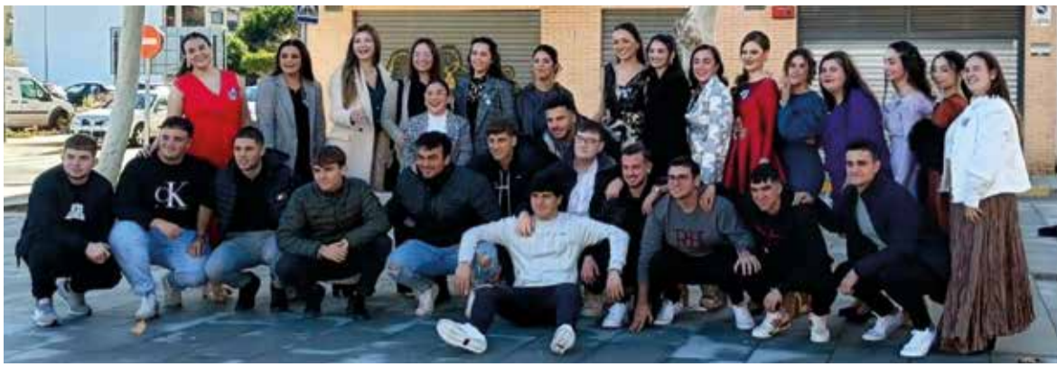
Festers de Sant Francesc i Filles de Maria 2024