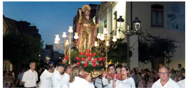
Processó Sant Jaume

La programació també inclou les ja clàssiques activitats infantils, així com el mercat medieval, els moros i cristians, les cercaviles o les jornades gastronòmiques; tot això sense deixar de costat l'Ofrena i els actes en honor a la Verge dels Desemparats, Santa Bàrbara i Sant Jaume Apòstol. Les festes culminaran com és habitual el dimarts 10 de setembre amb el castell de focs artificials.