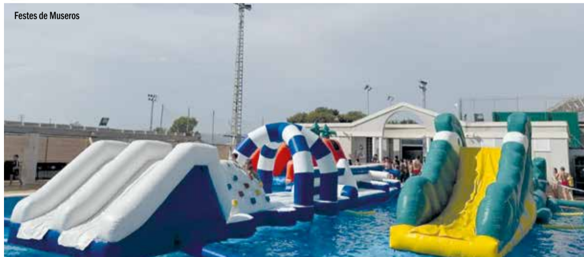
Festes de Museros