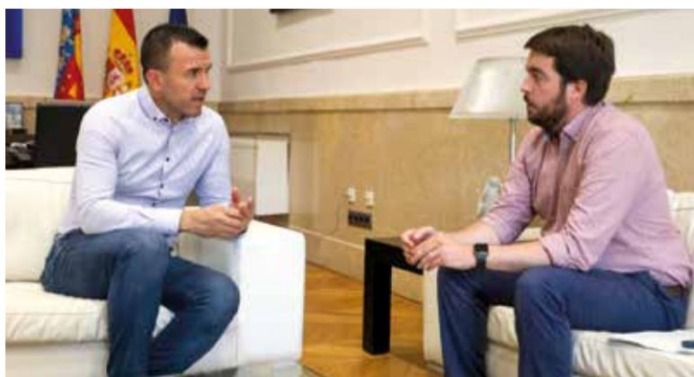
El president de la Diputació, junt a l'alcalde d'Almàssera

La subvenció ascendirà a 150.000 euros i es concedirà en forma de subvenció. El Pla Director del Castell detalla 10 àrees d'intervenció i un complet programa d'actuacions arqueològiques i constructives. Per a l'any 2024, El Puig ha reservat també una partida pressupostària que s'incrementarà amb la contribució de la Diputació.