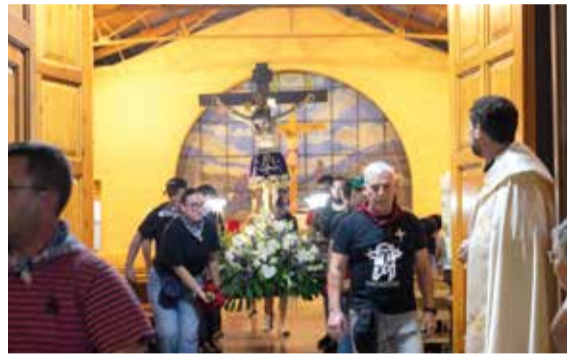
Baixà del Crist