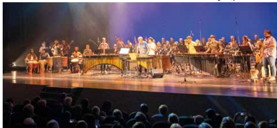
Imatge del concert