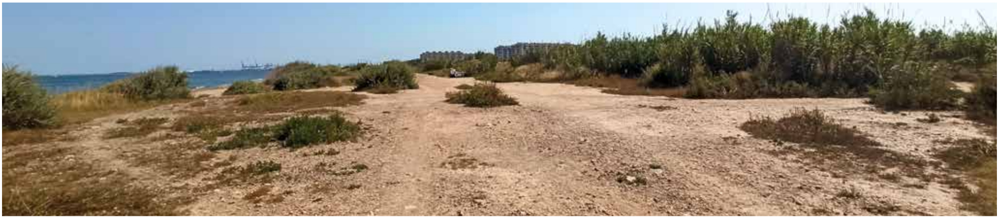
La platja en l'actualitat