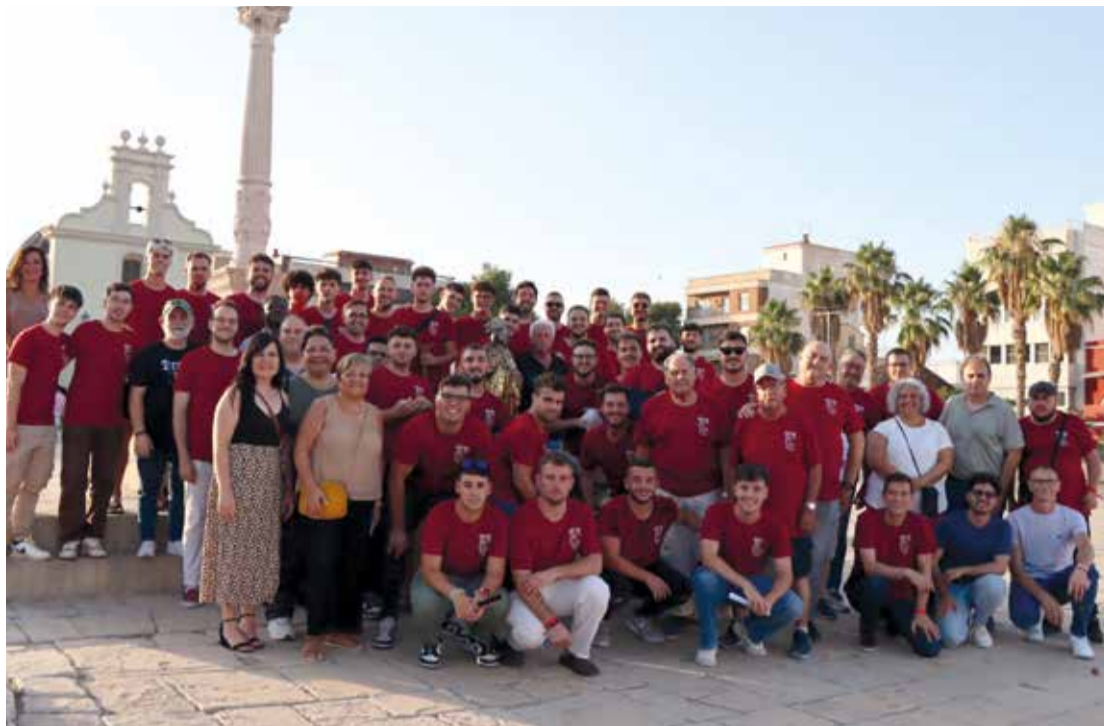
Clavaria de Sant Roc