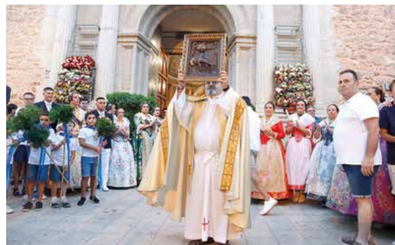
Entrà de la Murta