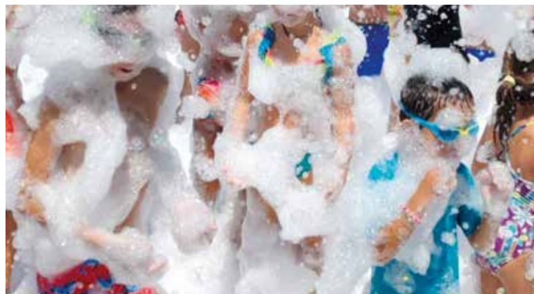
Dia dels unflables

En definitiva, han sigut unes festes per al record.