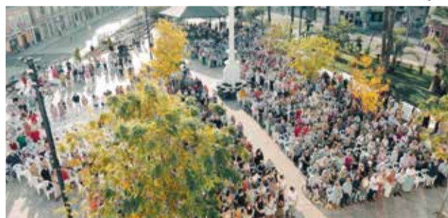
Foto missa de campanya