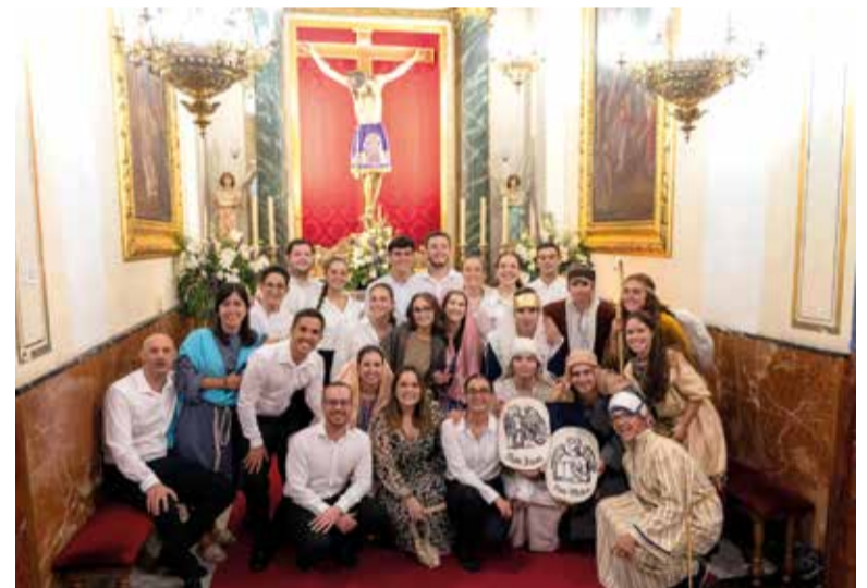
Processó del Crist