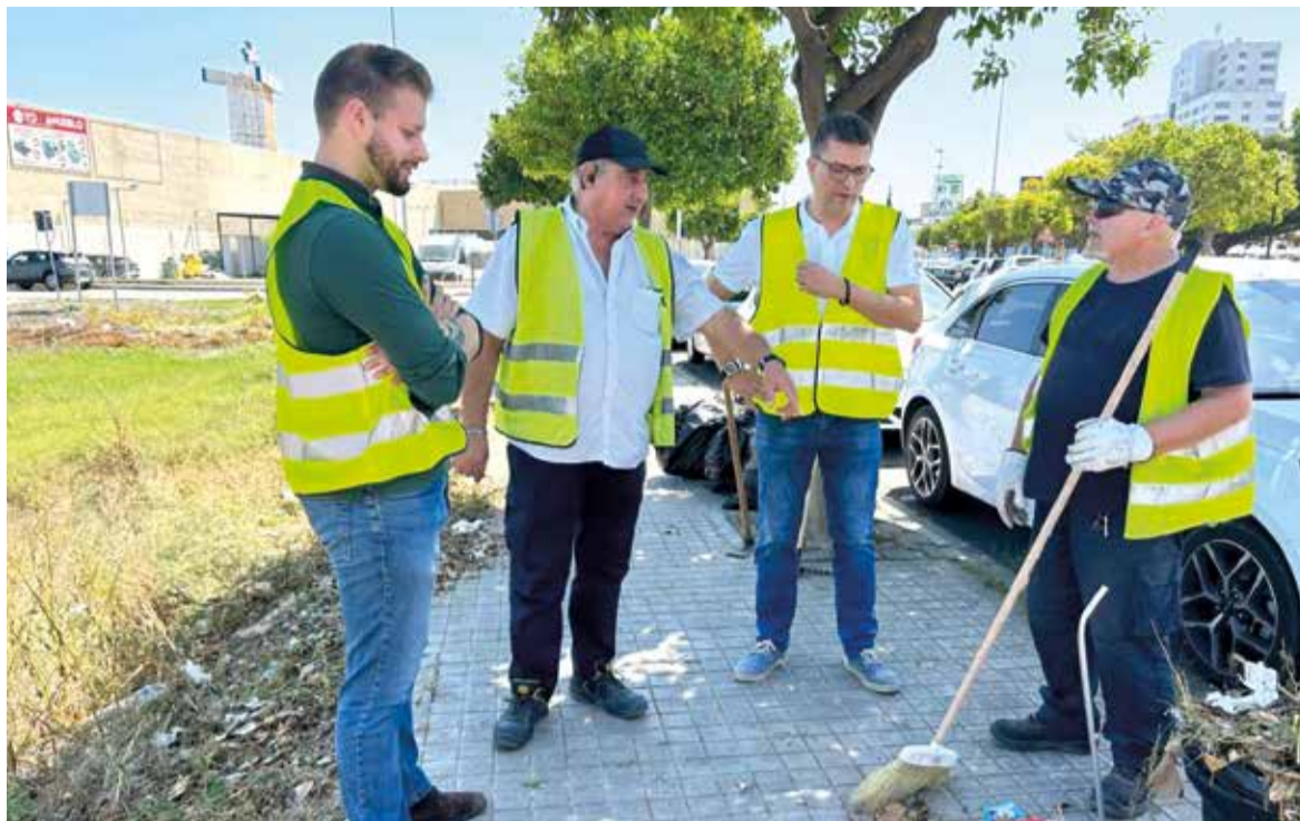
Treballs de neteja a Alfafar