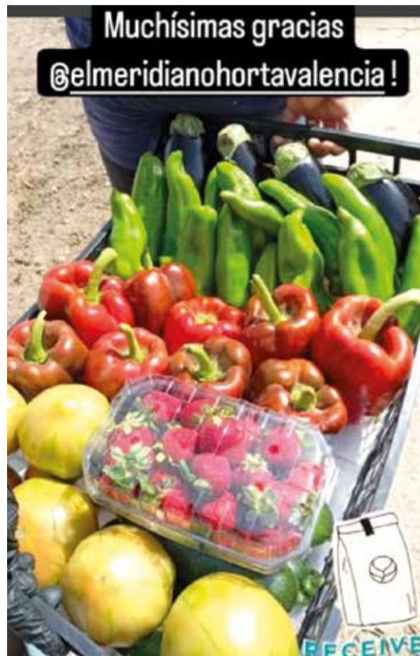
Els productes, km0, estan cultivats en l'horta de la comarca

Participar és molt fàcil, només cal seguir el compte i comentar en el post del sorteig que vols participar nomenant també un amic o amiga.