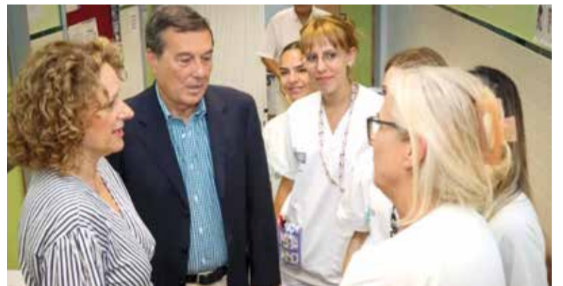
El conseller visita junt a l'alcalde el centre sanitari