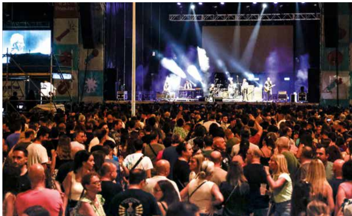
Molt d'ambient en els concerts de Mislata, imatges de l'any passat

Ajuntament de Mislata i Clavaries han preparat una extensa i completa programació per a les primeres setmanes de les festes, que tindran lloc del 24 d'agost al 7 de setembre