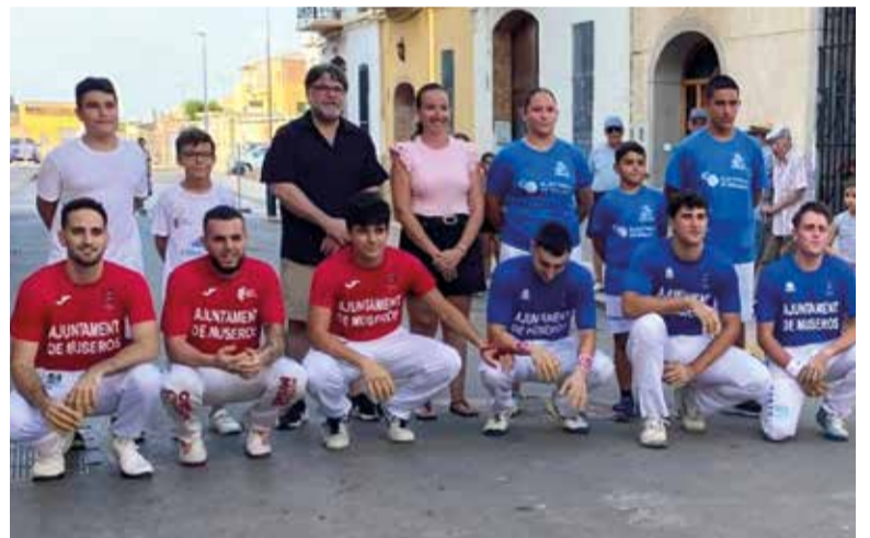
Trofeu de Festes de galotxa al carrer Palleter