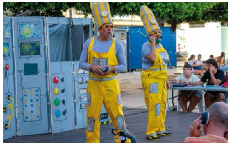
Activitats per a tots els públics

La programació d'estes festes, així com l'accés a esta enquesta, està disponible en el SAC de l'Ajuntament i del Barri Orba, així com en les diferents xarxes socials municipals i en la pàgina web.