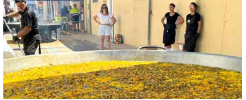
Paella gegant a Museros