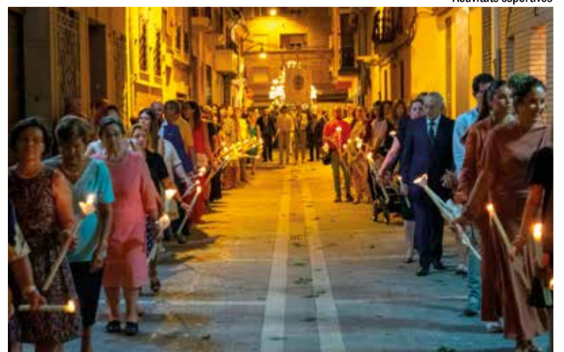
Solemne processó pels carrers d'Alfatar