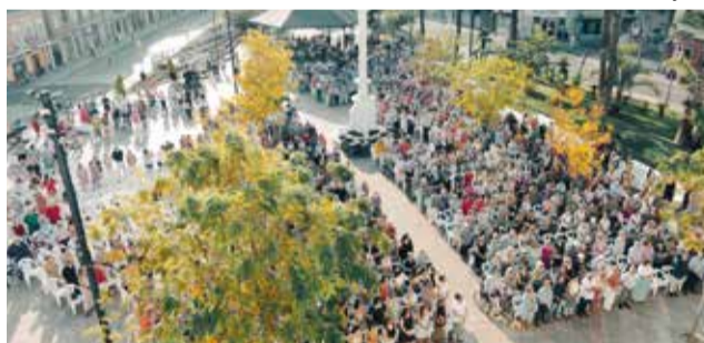
Foto missa de campanya