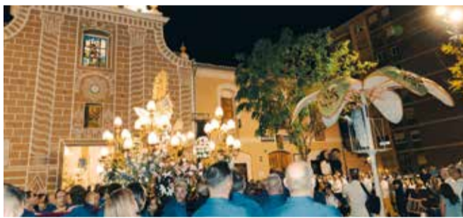
Cant de la Carxofa