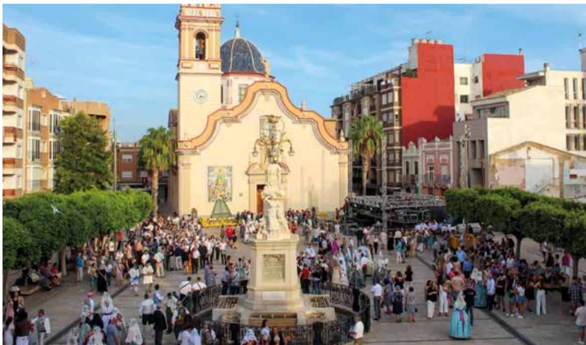
Actes en honor a la Patrona