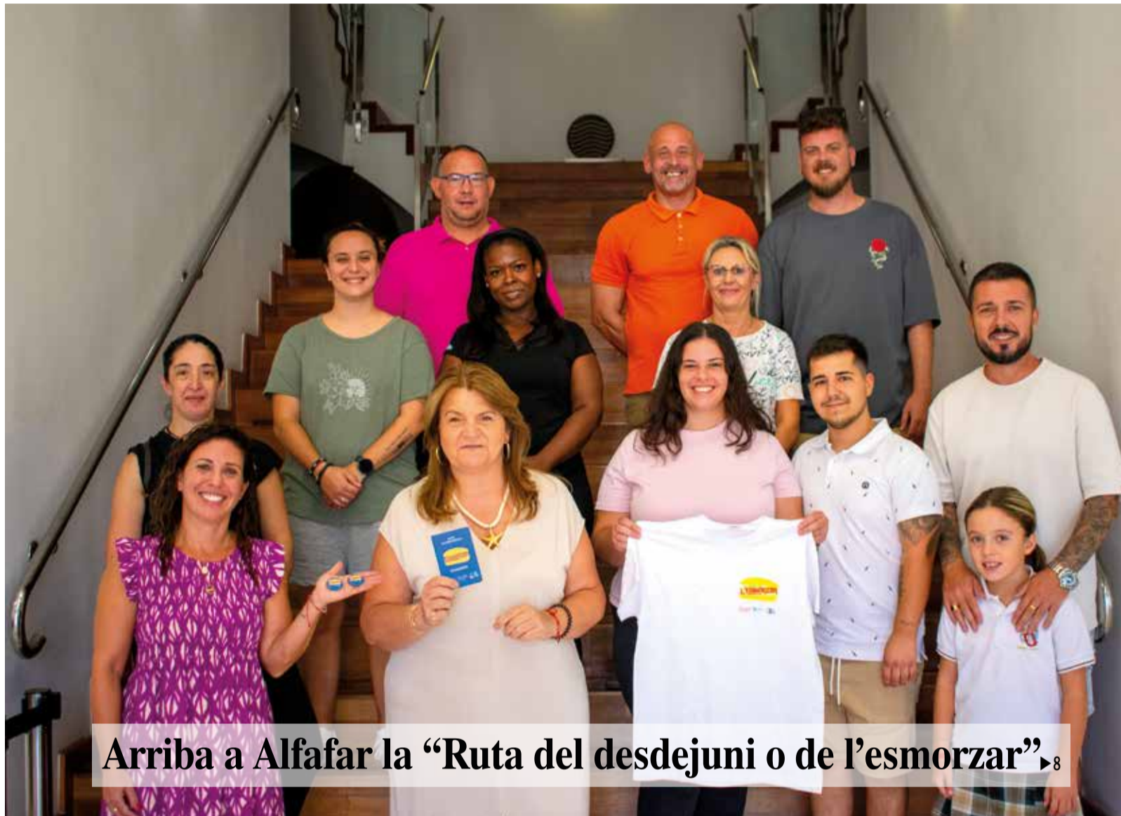
Arriba a Alfafar la “Ruta del desdejuni o de l’esmorzar” 8

SETEMBRE 2024 · Periòdic gratuït. Depòsit legal V-3779-2022