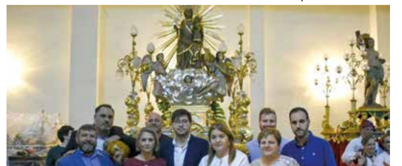
Regidors durant els actes patronals

Les festes de la població també es van desplaçar a l'Albufera, el barri d'Alfatar, per a gaudir de la naturals i de les seues embarcacions més tradicionals.