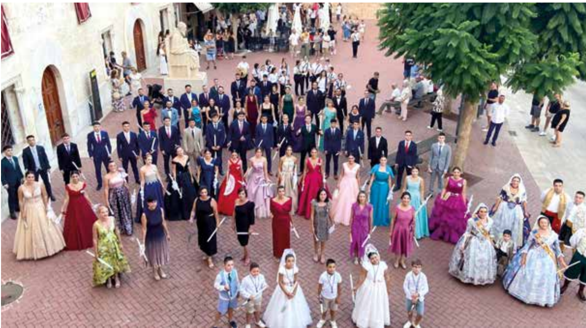
Processó de les Festes d'Alfara del Patriarca en honor a Sant Bertomeu.