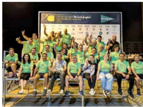
Fons Nocturn, Ruta Cicloturista