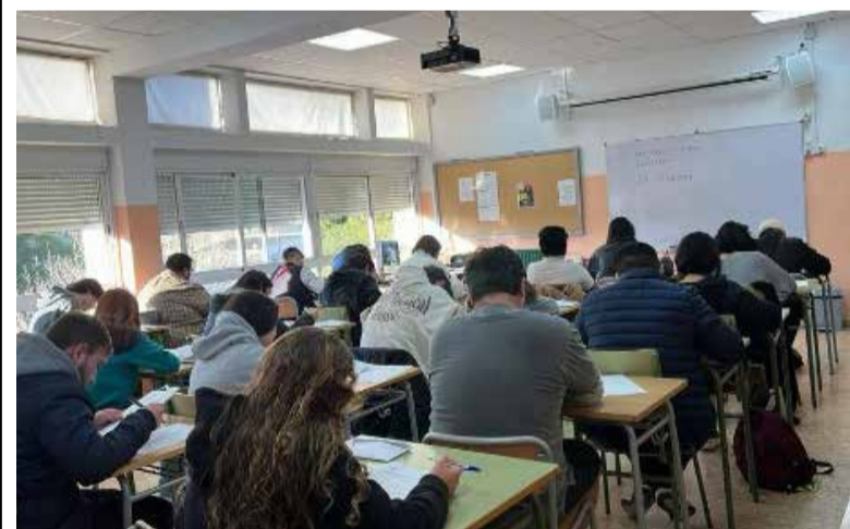
Centre de formació