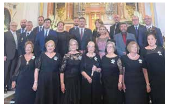
Actes per la Mare de Déu del Do