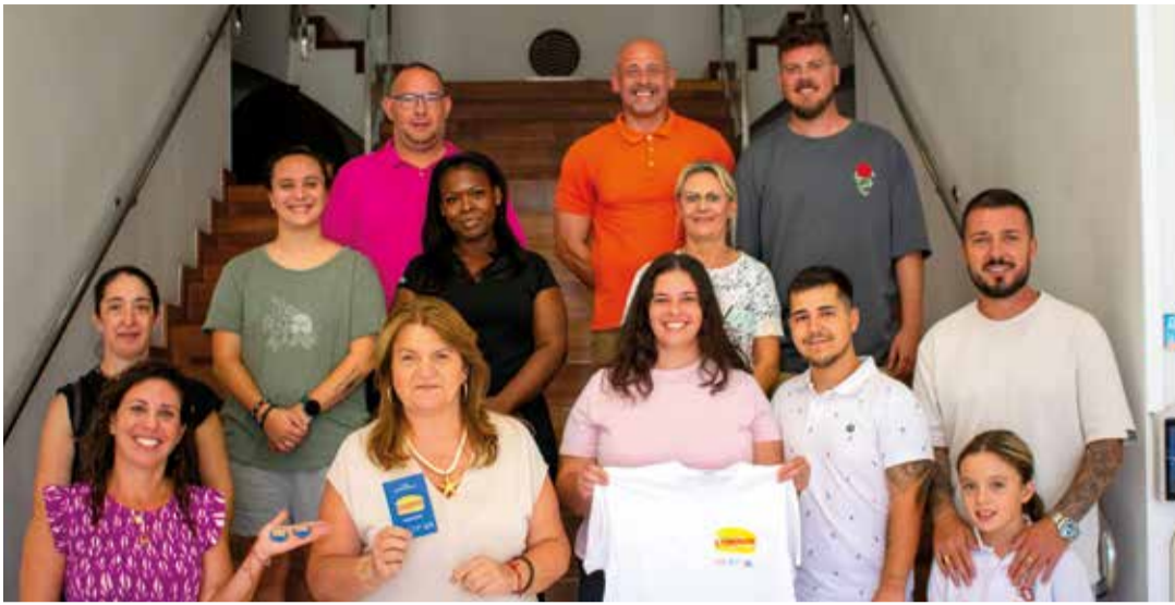
Presentació de la ruta