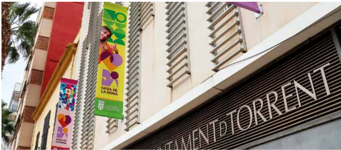
Casa de la Dona