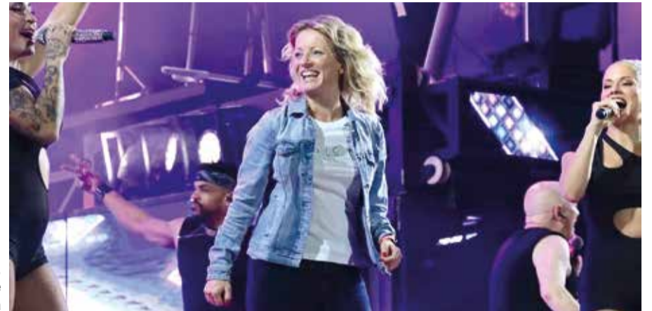
Paqui Bartual, alcaldessa de Xirivella