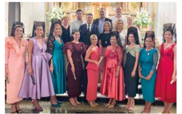
Actes per la Mare de Déu del Do