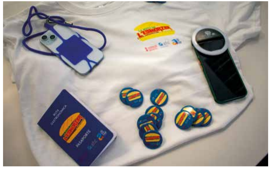
Els comensals rebran premis com a samarretes o 60 euros en vals