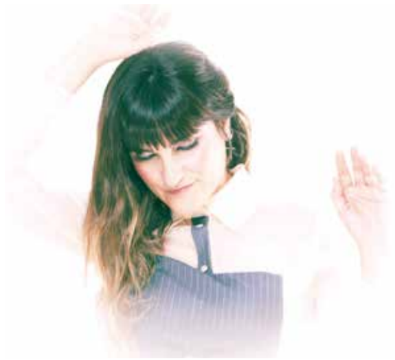
Rozalén actuarà a la població