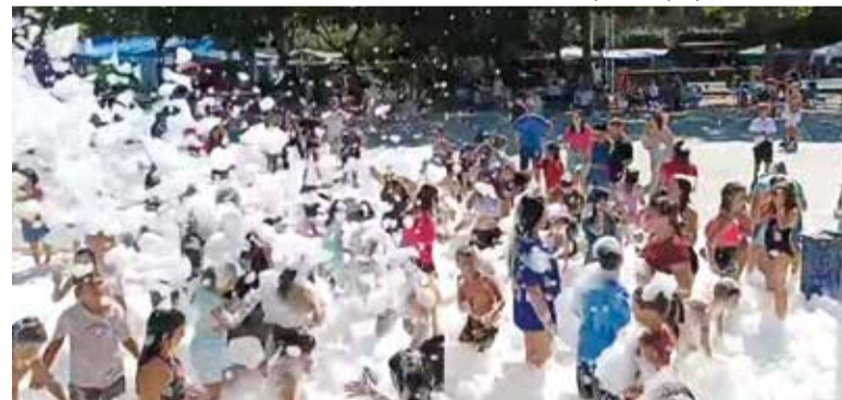
Festa de l'espuma