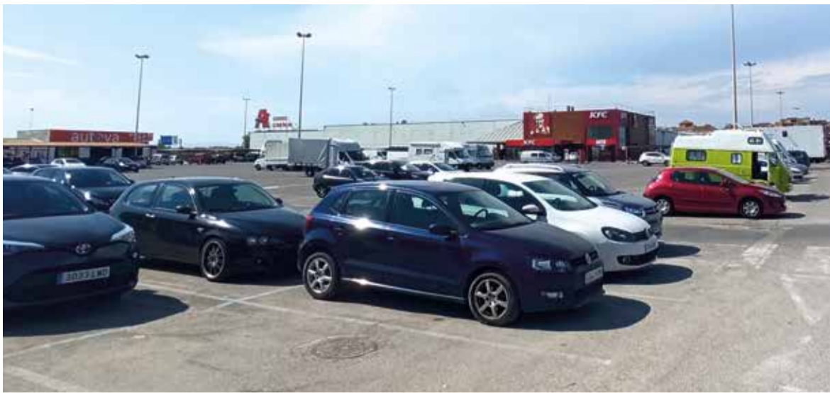
Pàrquing de Port Saplaya, terrenys del deute d'Egusa