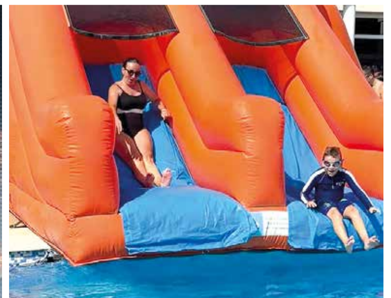
Cristina Civera, alcaldessa de Museros