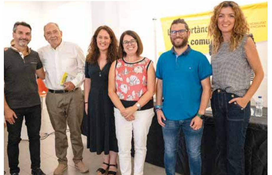
La jornada a Rafelbunyol va comptar amb ponents tècnics, polítics, d'associacions i també de mitjans de comunicació de València i gabinets de premsa de entitats que treballen amb els majors