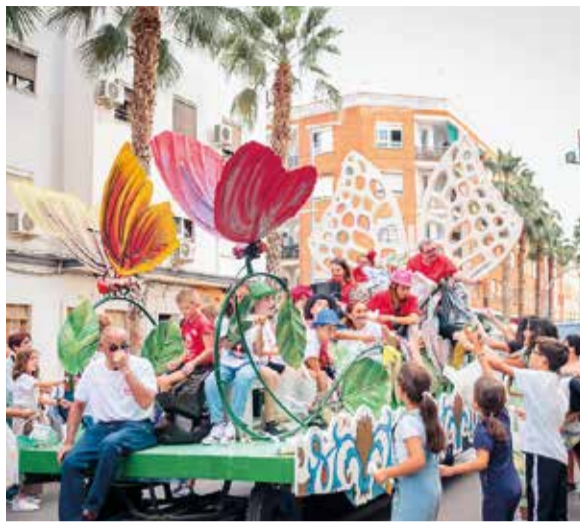
Cavalcada Sant Miquel