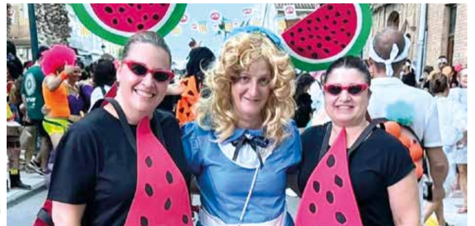
Marta Ruiz, alcaldessa d'Albuixech