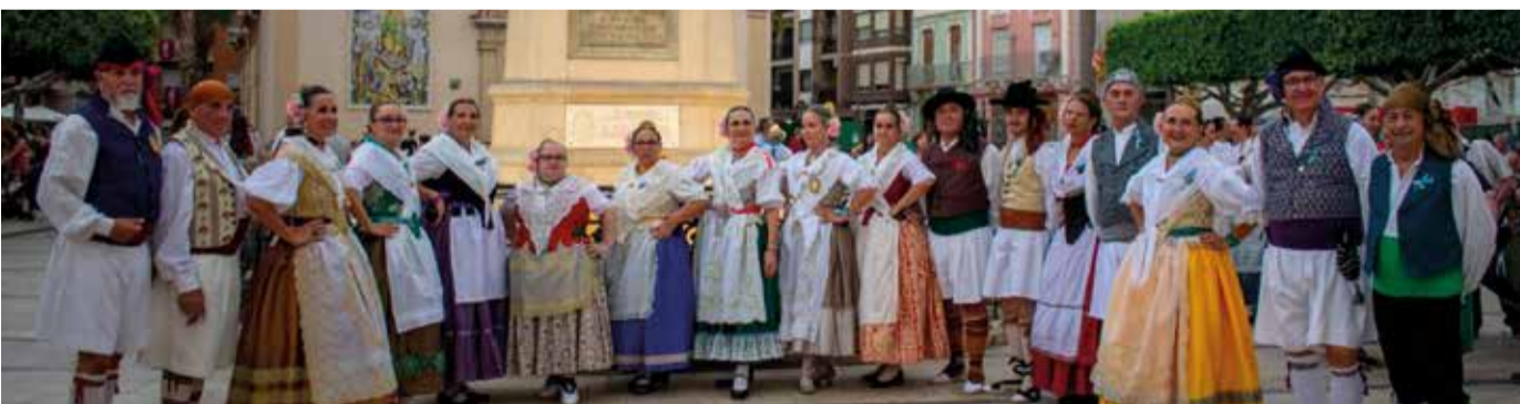
Festa de la Font