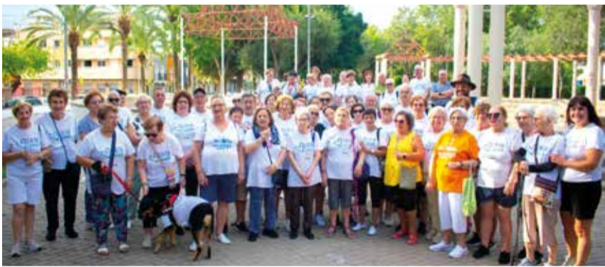
Alfatar Camina ja està activa

L'Ajuntament d'Alfatar convida a tota la ciutadania a unir-se a esta iniciativa. La Ruta del desdjejuni o de l'esmorzar no sols celebra la tradició culinària d'Alfatar, sinó que també obri la porta a noves experiències i sabors.