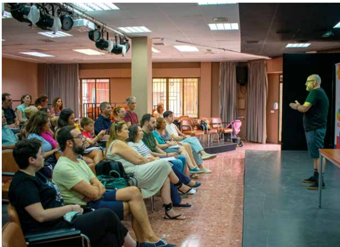
Imatge de la presentació de la nova activitat

EL SEU OBJECTIU ÉS FORMAR EN LES ARTS ESCÈNIQUES TANT A LA POBLACIÓ INFANTIL COM A LA JUVENIL I PERSONES ADULTES