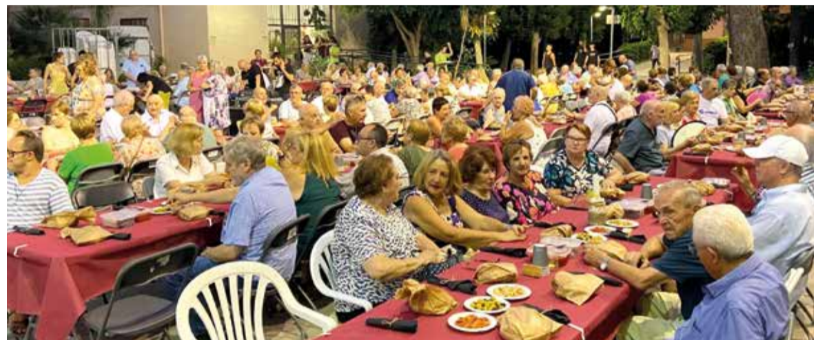
Sopar de Majors d'Alfara del Patriarca

A més, Alfara coincidint amb les festes també ha celebrat el Trofeu a Llargues d'Alfara del Patriarca i partides al carrer, és un dels actes que més afició trau al carrer i gaudixen d'unes bones partides. A més, han tingut lloc actes dirigits a totes les poblacions. Els majors van tindre els seus sopars i els xicotets van gaudir d'activitats per a ells.