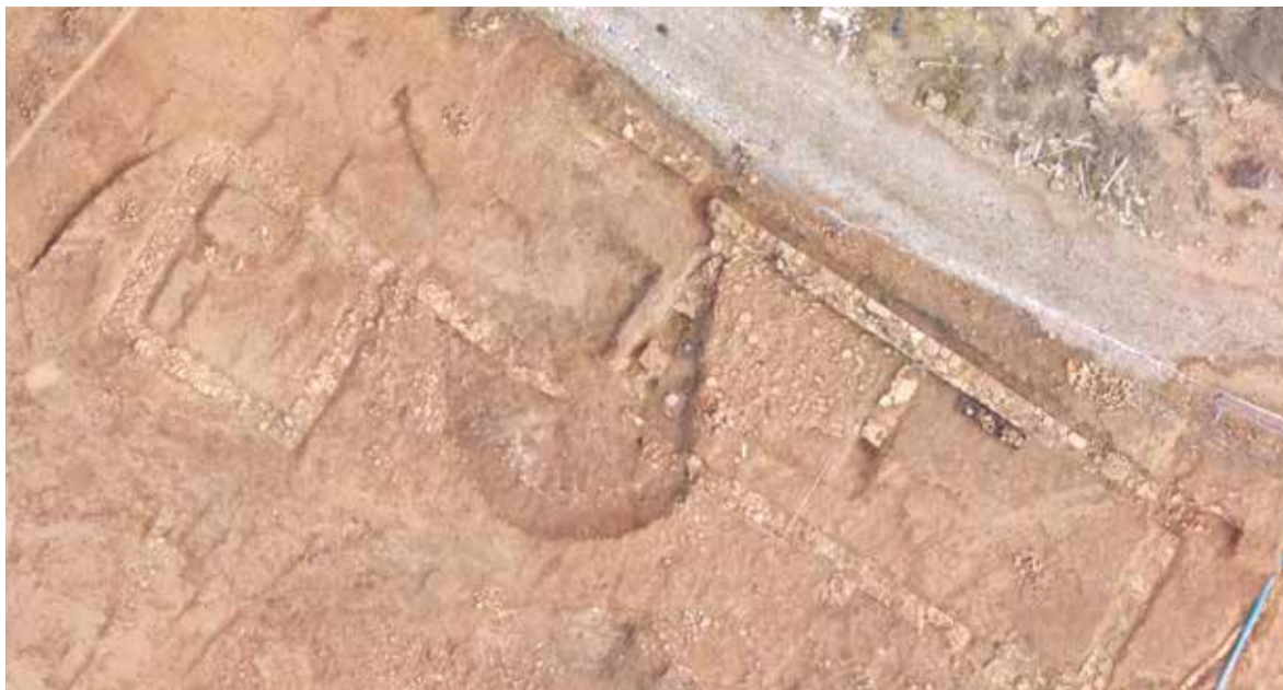
Imatge del Pouatxo