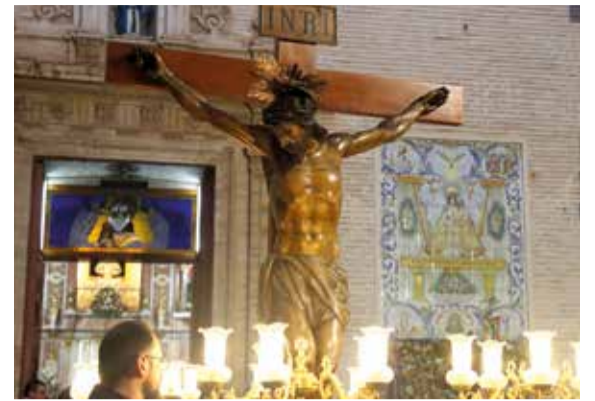
Processó Crist de la Llum