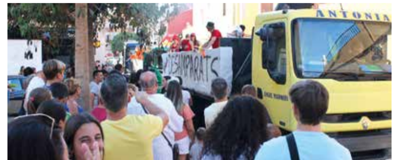
La globotà i la tradicional cavalcada