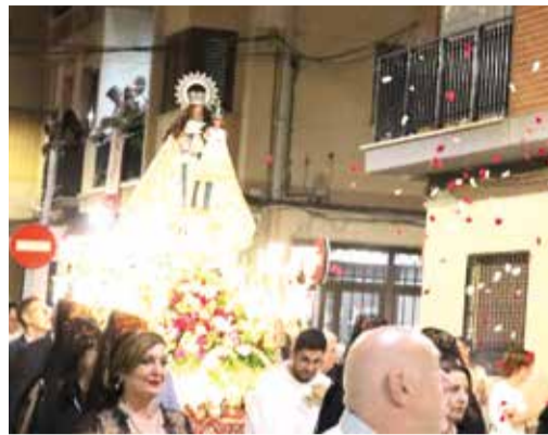
Processó a la Mare de Déu de la Salut, patrona de la població