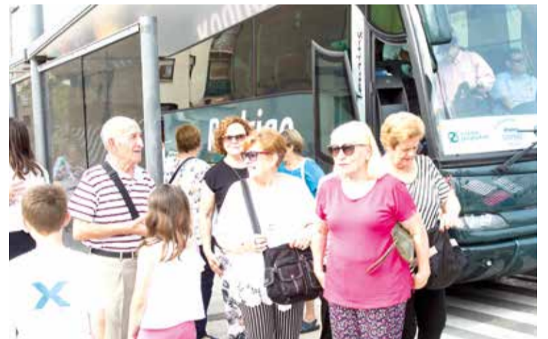
Un bus arrega a als veïns i els porta al municipi de destí