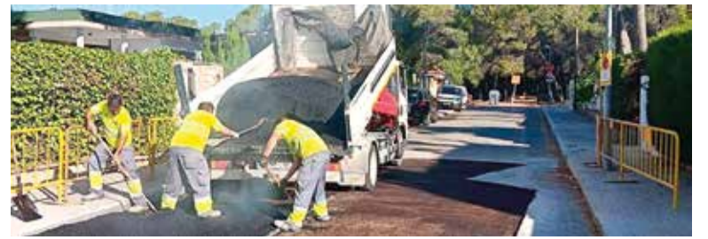
Obres a La Canyada