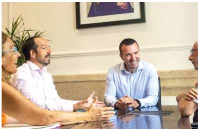
Alcalde, regidora i diputada, junt al president de la Diputació

El futur Parc Empresarial Pont dels Cavalls d'Aldaia tindrà una