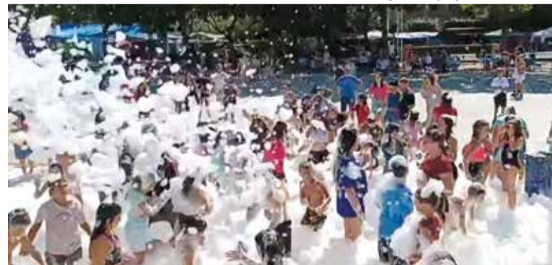
Festa de l'espuma