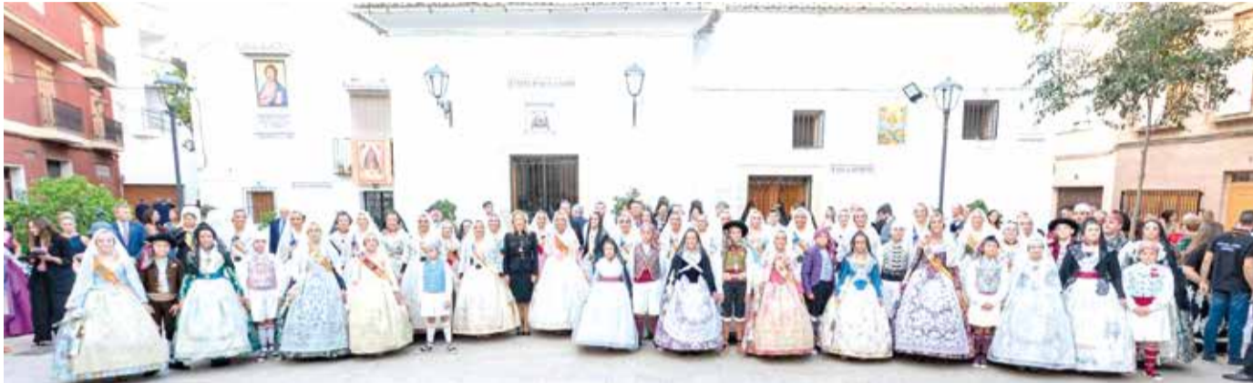
Fallers i falleres durant la processó de la Patrona