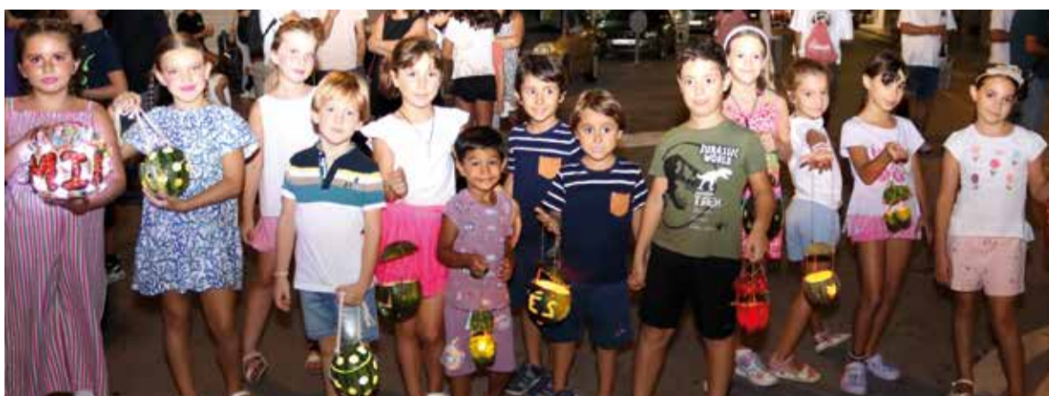
Nit dels ferolets