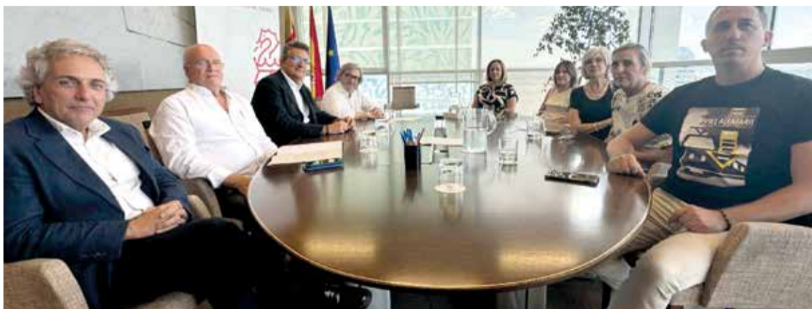
Reunió del conseller amb membres de la plataforma d'afectats (GVA).