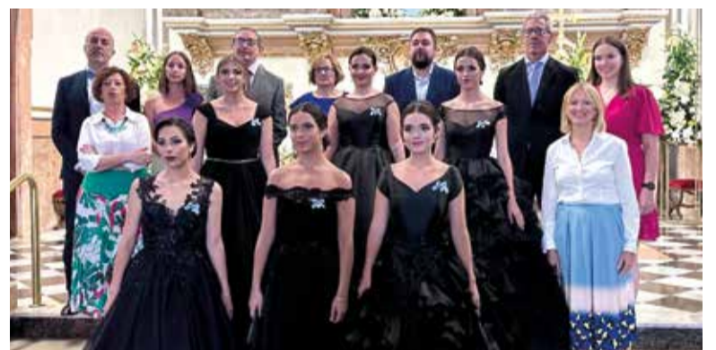
Clavariesses i coporració municipal durant els actes religiosos