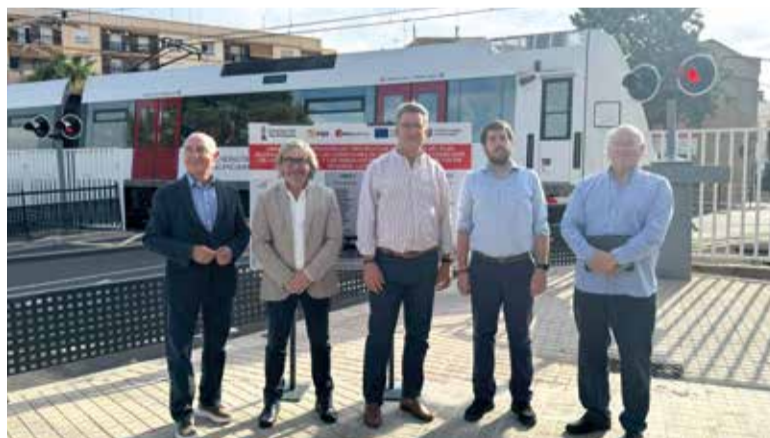
Visita a Almàssera

"Les obres incloses en el pla, el desenvolupament del qual ha sigut supervisat per l'Agència Valenciana de la Seguretat Ferroviària, comprenen diverses solucions com el trasllat dels passos a punts més accessibles i assegurances, la incorporació de nous elements i proteccions i actuacions complementàries per a la dotació de nous equipaments de senyalització o enllumenat", ha explicat el conseller