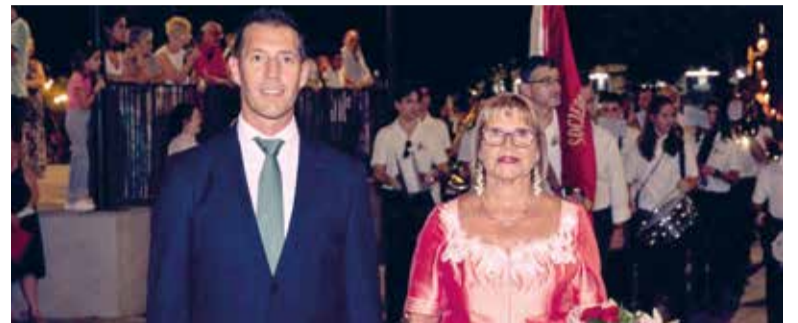
Ofrena de flors