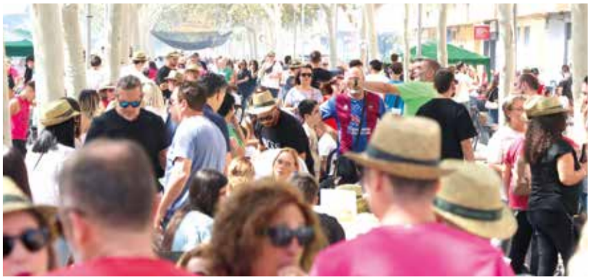
Dia de paelles en la població