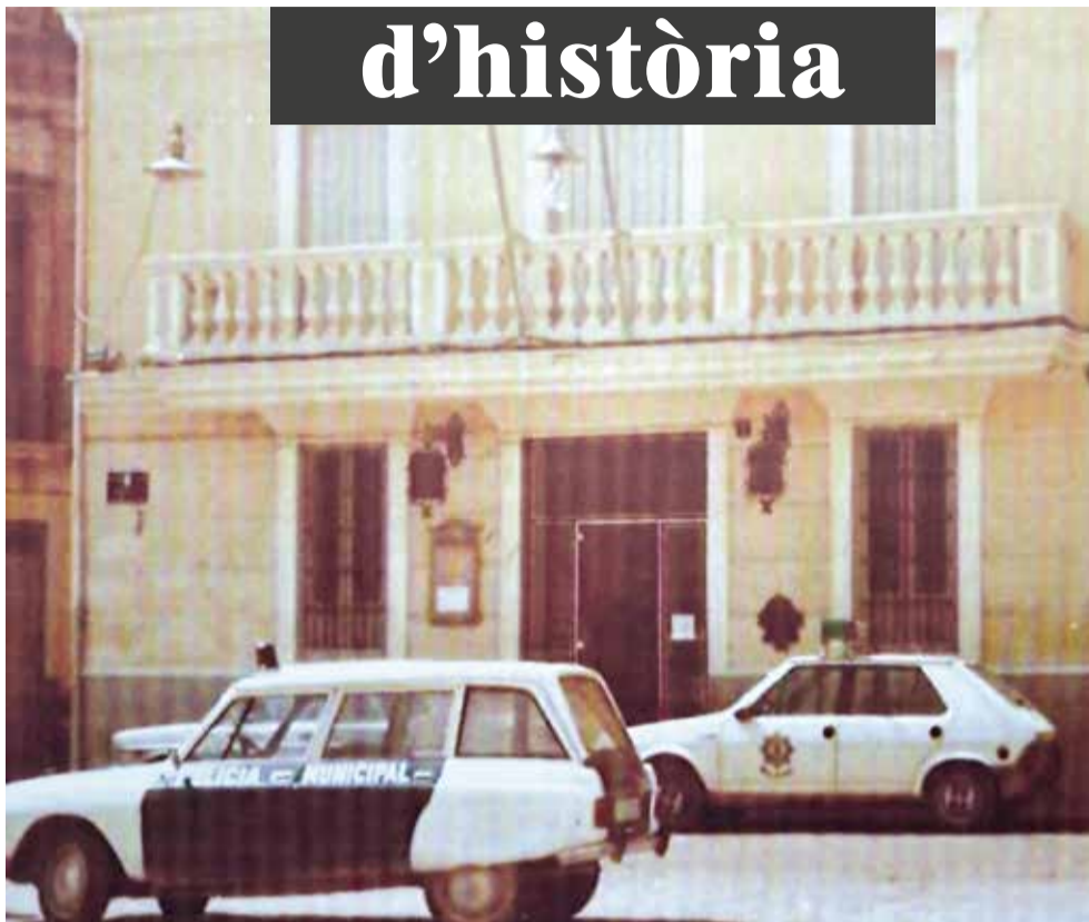
Primers cotxes de policia a Meliana