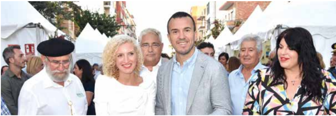
Alcaldesa y concejala de FIMEL junto al presidente de la Diputación de Valencia, el año pasado, y el diputado de Turismo y concejal de Meliana