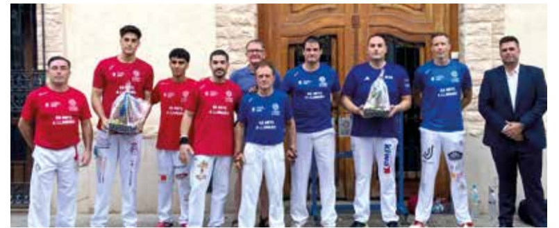
Trofeu a Llargues d'Alfara del Patriarca