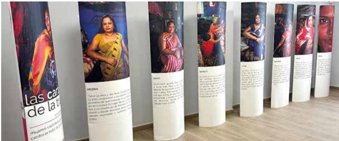
Exposició fotogràfica "Les Cares del Tràfic de persones", es podrà visitar fins al 3 d'octubre a la Casa de la Dona