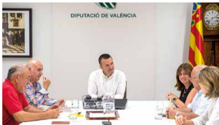
Reunió a la Diputació de València

D'altra banda, li han traslladat que estan treballant perquè es declare el Tribunal de Comuner Patrimoni Immaterial Cultural per