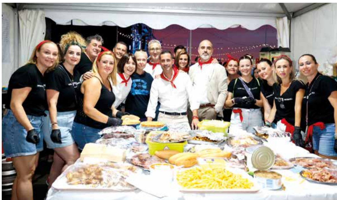
Alcalde, ministra junt a regidors i associacions