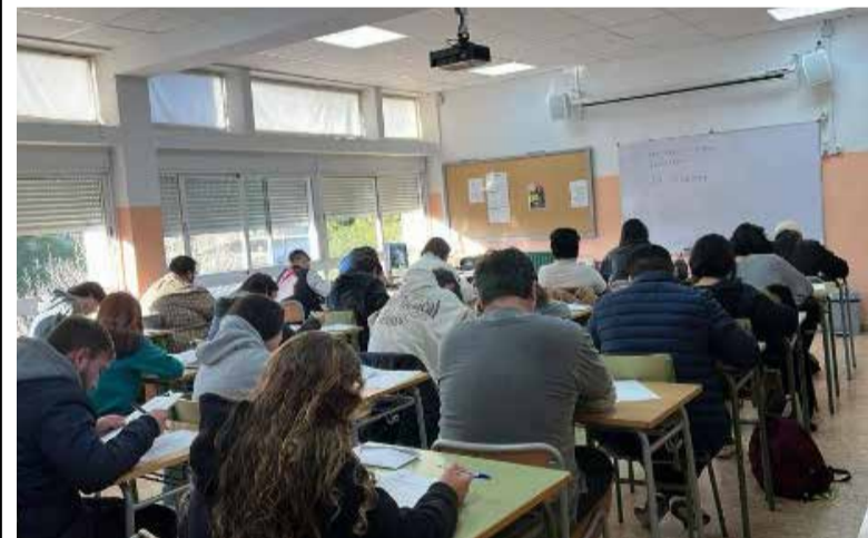
Centre de formació