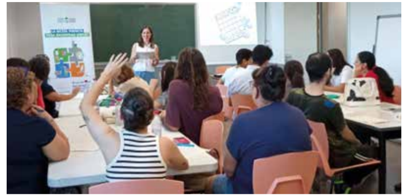
Inici de curs

Com a contrapunt, Alboraia es va llevar de damunt recentment el deute d'Egusa, que ascendia ja a 35 milions d'euros després de la sentència d'un jutge que va sumar el pagament de la constructora de la fallida nova marina de Port Saplaya i els interessos generats posteriorment davant la falta d'un acord entre tots els grups polítics municipals.