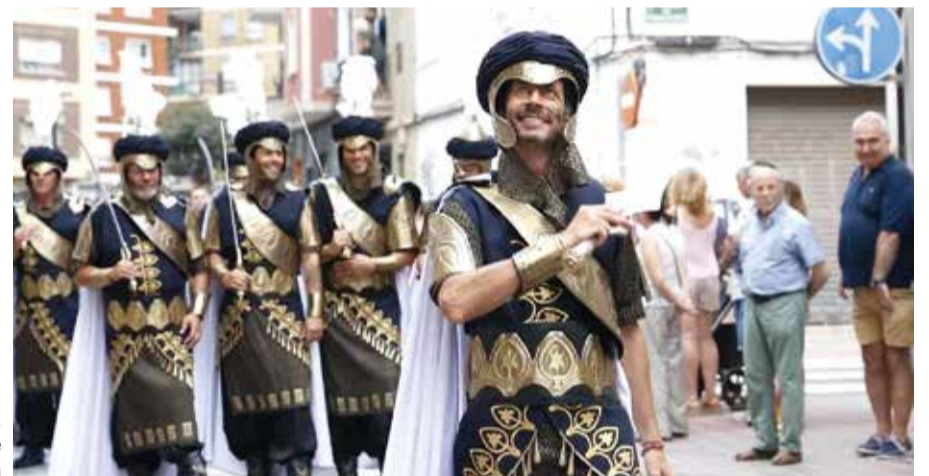
Carlos Bielsa, alcalde de Mislata