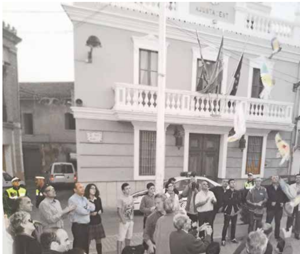
Policia present ja en els actes municipals

Tanta evolució que, 30 anys de diferència, ens sembla quasi una eternitat.