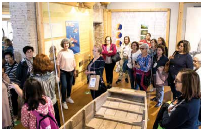
Visita a Alfafar