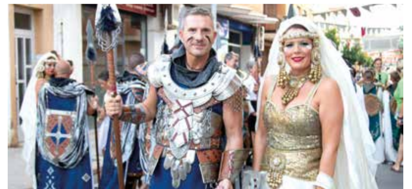
L'alcaldessa i regidor també van participar en les festes