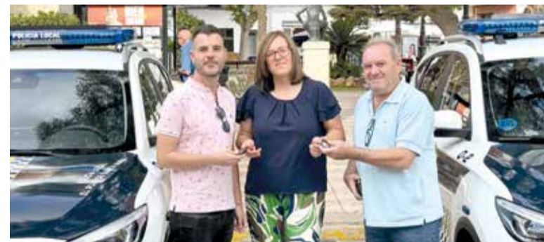
Alcalde i regidor

El projecte ha suposat la resolució d'una situació complexa que es remunta a la dècada de 1990, quan es va projectar inicialment la connexió viària. La presència de dos edificacions declarades en ruïna imminent havia impedit fins ara l'execució de l'obra. Amb esta actuació, l'Ajuntament afirma haver regularitzat una situació urbanística irregular de llarga duració, al mateix temps que millora la seguretat i la mobilitat en el municipi.