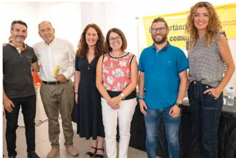
La jornada a Rafelbunyol va comptar amb ponents tècnics, polítics, d'associacions i també de mitjans de comunicació de València i gabinets de premsa de entitats que treballen amb els majors