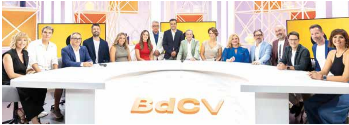
Presentació de la nova temporada

EL 9 DE SETEMBRE VA COMENÇAR LA NOVA TEMPORADA AMB UNA NOVA OFERTA TELEVISIVA