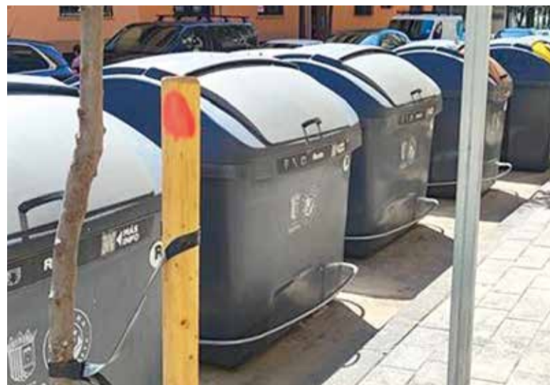
Contenidors a Paterna