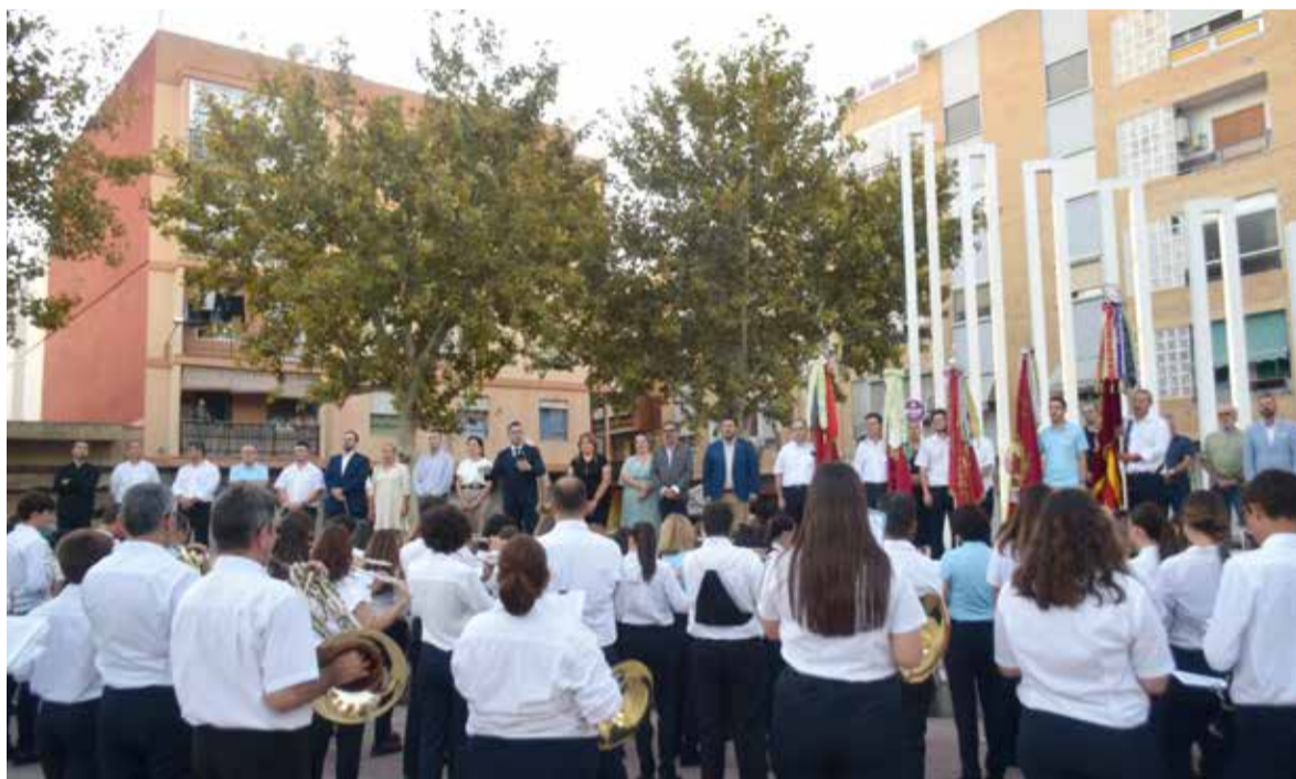
Bandes a Sedaví

festes de espuma, activitats infantils, per als més majors, nit de paelles, disfresses i música. Actes multitudinaris que han comptat també amb punts violeta.