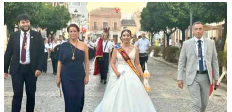
Processó a Montcada