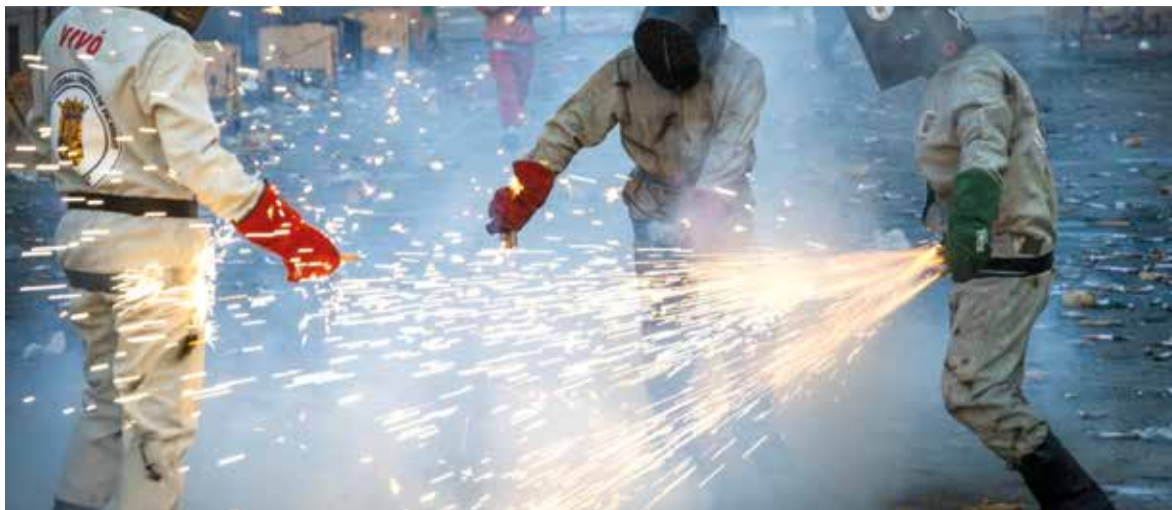
Celebració en homenatge a l'ermita