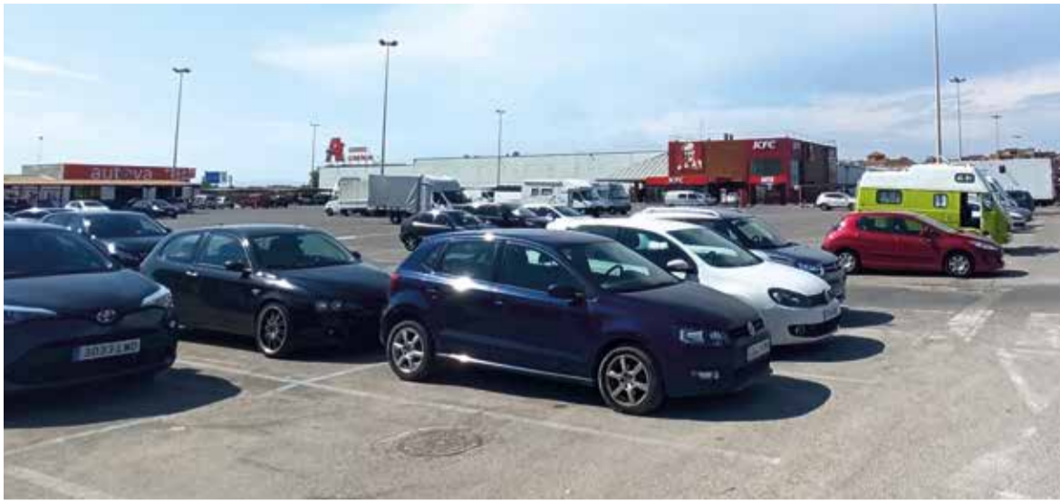
Pàrquing de Port Saplaya, terrenys del deute d'Egusa