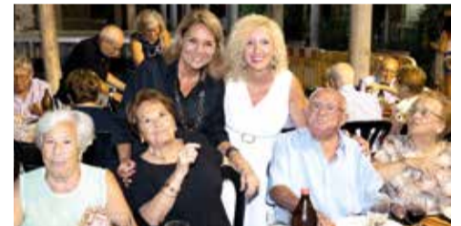
La consellera va visitar als majors durant la festes