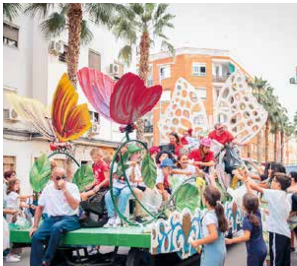
Cavalcada Sant Miquel