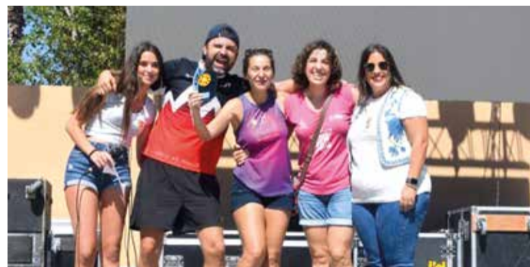
L'esport, sempre present en les festes

fins que el cos aguante, Mònaco Party. El diumenge 22, últim dia de les festes, començarà amb la Missa solemne en honor a la Verge del Rosari. A les 14 h. mascletà en la C/ Pintor Sabater i a boca de nit processó en honor als patrons Sant Torquat i la Verge del Rosari, que finalitzarà amb una Mascletà Mixta en la C/ Pintor Sabater.