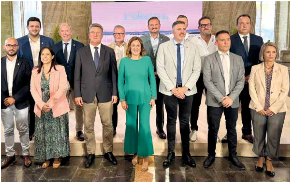
Alcaldes i alcaldesses de les poblacions amb terme a l'Albufera