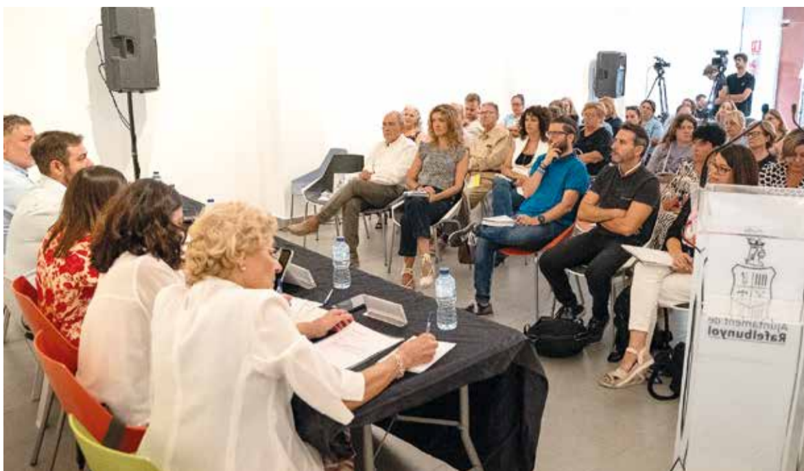
Veïns i entitats de la comarca van assistir a la trobada

les emissions van decidir llançar un programa d'acompanyament on es podien enviar missatges d'alé i carinyo, i dedicar cançons.