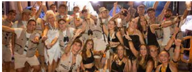
Nit de disfresses