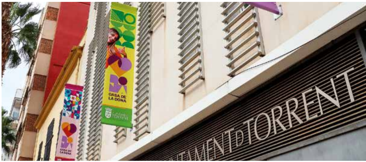
Casa de la Dona