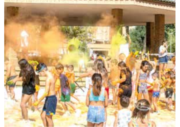
Festa de colors a Xirivella