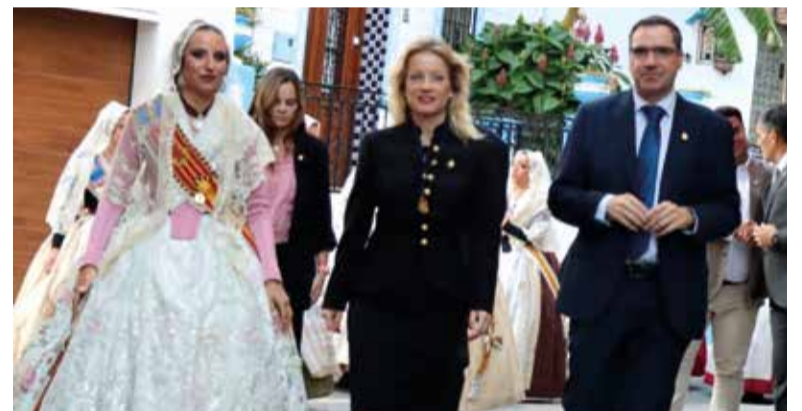
La Fallera Major de València junt a l'alcaldeessa i el regidor

El ritme musical per a totes les edats també ha sigut una constant en estes festes.