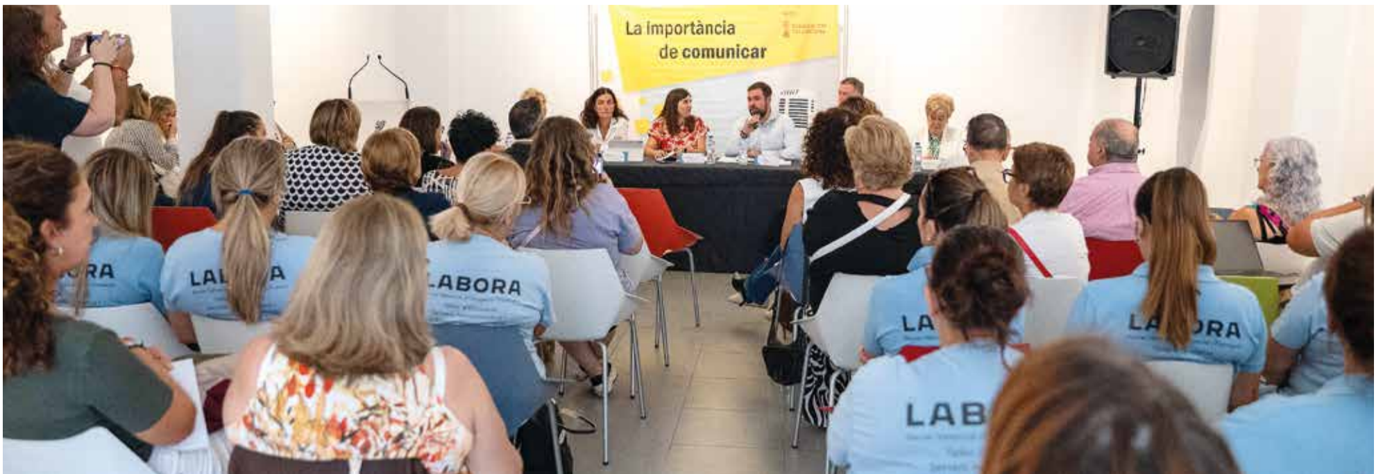
La Casa de la Cultura de Rafelbunyol va acollir l'encontre

destacar que per a ells els tràmits amb l'administració o altres entitats són un malson pel farragós que són i que s'haurien de facilitar.