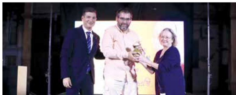
Alcalde i regidora donant el premi al poeta

"Ara és una bona ocasió per a reclamar un tracte digne al mosaic que roman en un magatzem del Museu de Belles Arts de València sense possibilitat de poder ser visitat i que a Moncada podria estar exposat de manera permanent al públic".