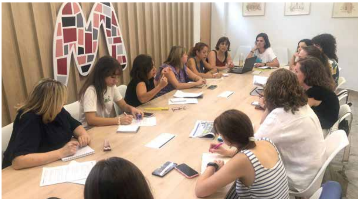
Reunió en la Mancomunitat per a l'organització de la marxa dels municipis de l'Horta Sud contra la violència masclista