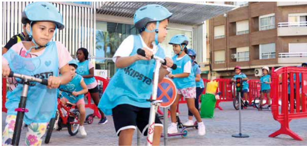
Inauguració de la Setmana Europea de Mobilitat

Torrent va presentar en la Fira Internacional de Turisme (FITUR) el seu xocolate més típic: el bollet torrentí. Una aposta turística que la localitat va portar fins a FITUR com a mostra del seu compromís amb la promoció d'un dels productes locals més tradicionals. Un producte artesanal amb arrelada tradició a Torrent, que forma part de la identitat del municipi.