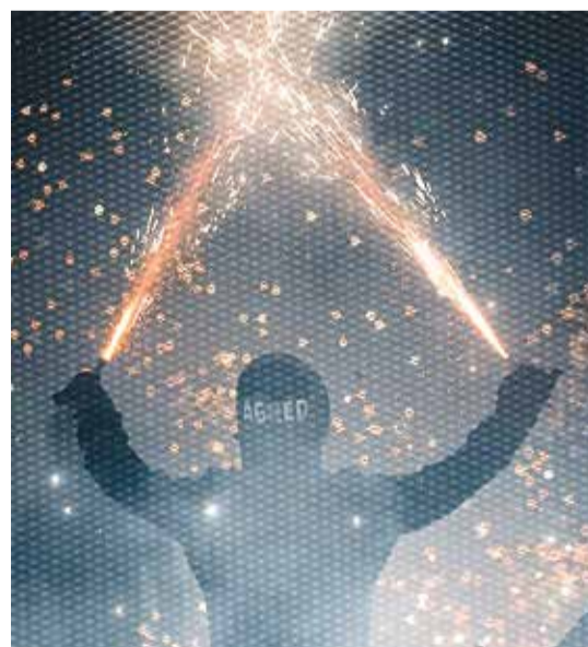
Sagredo, alcalde de Paterna