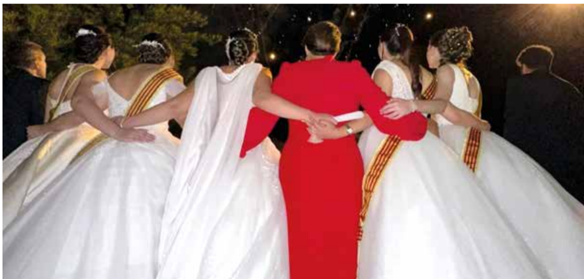
Alcaldessa de Montcada junt a les festeres d'enguany