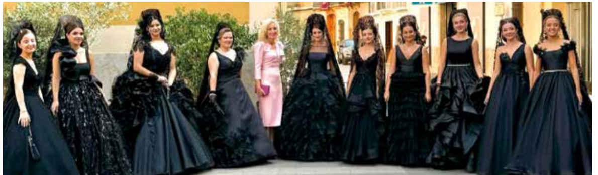
Clavariesses junt a l'alcaldessa