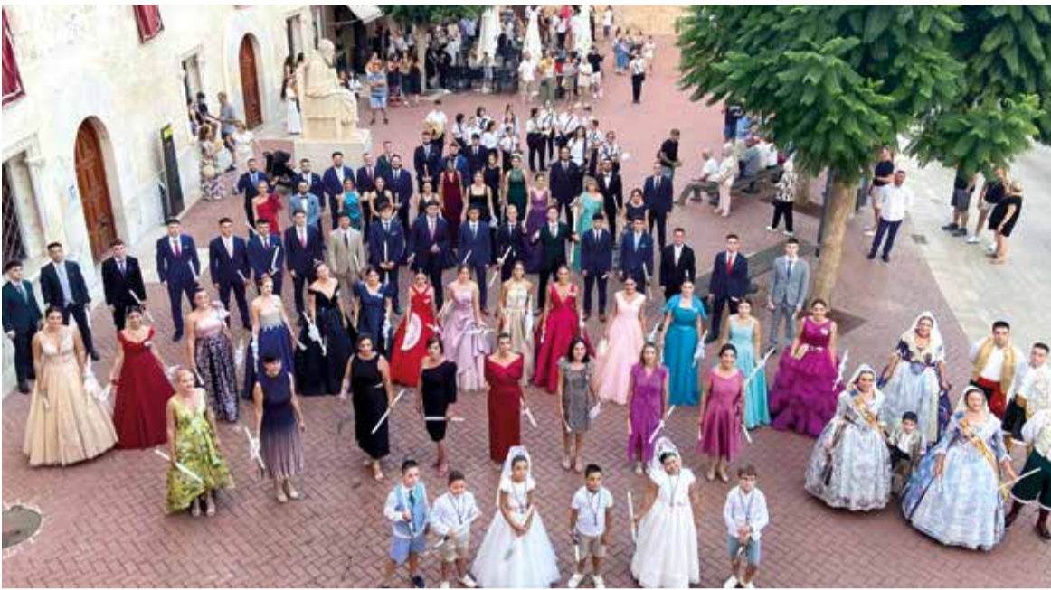
Processó de les Festes d'Alfara del Patriarca en honor a Sant Bertomeu.