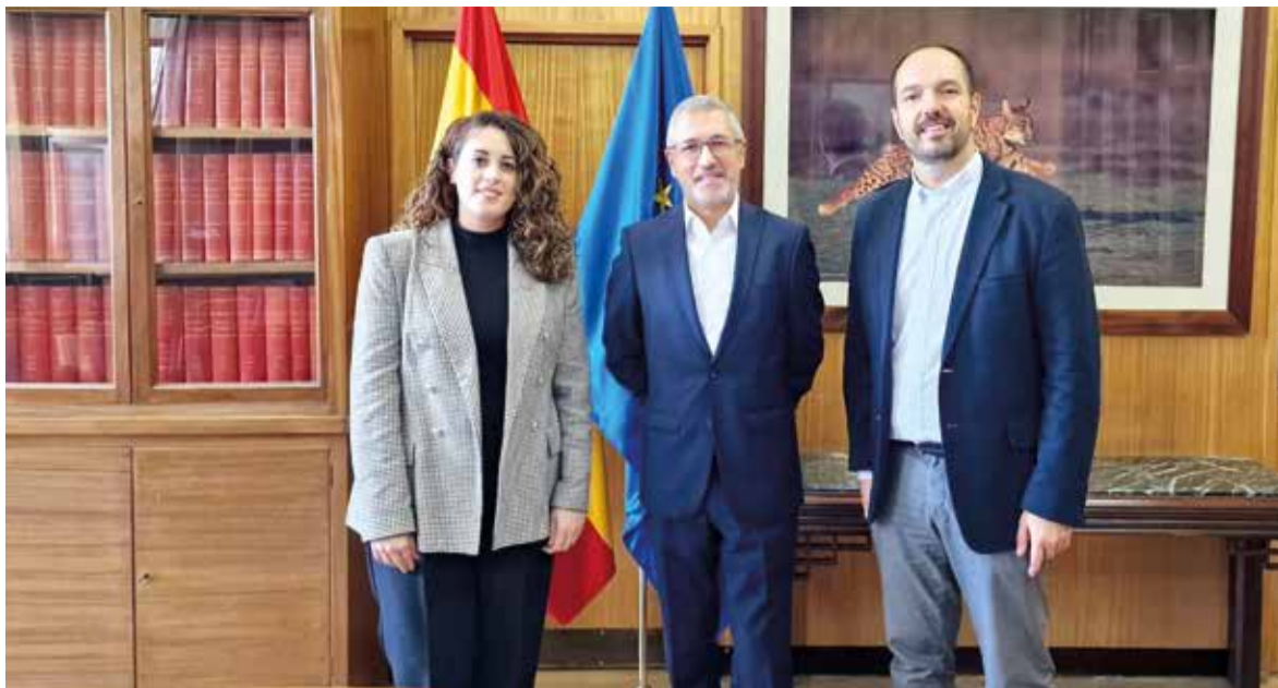
Reunió de l'alcalde i regidora en el Ministeri