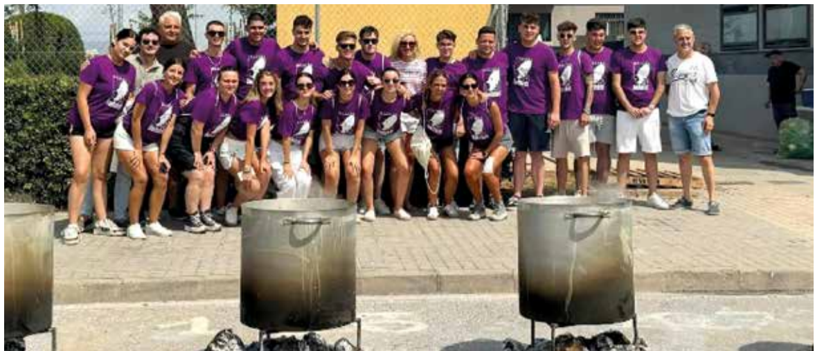
Alcaldessa, regidors i clavaris i clavariesses durant les calderes

Durant dies les processons, cercaviles, sopars al carrer, nit de disfresses, orquestra i com no, l'homenatge als majors de la població s'han celebrat a Meliana.