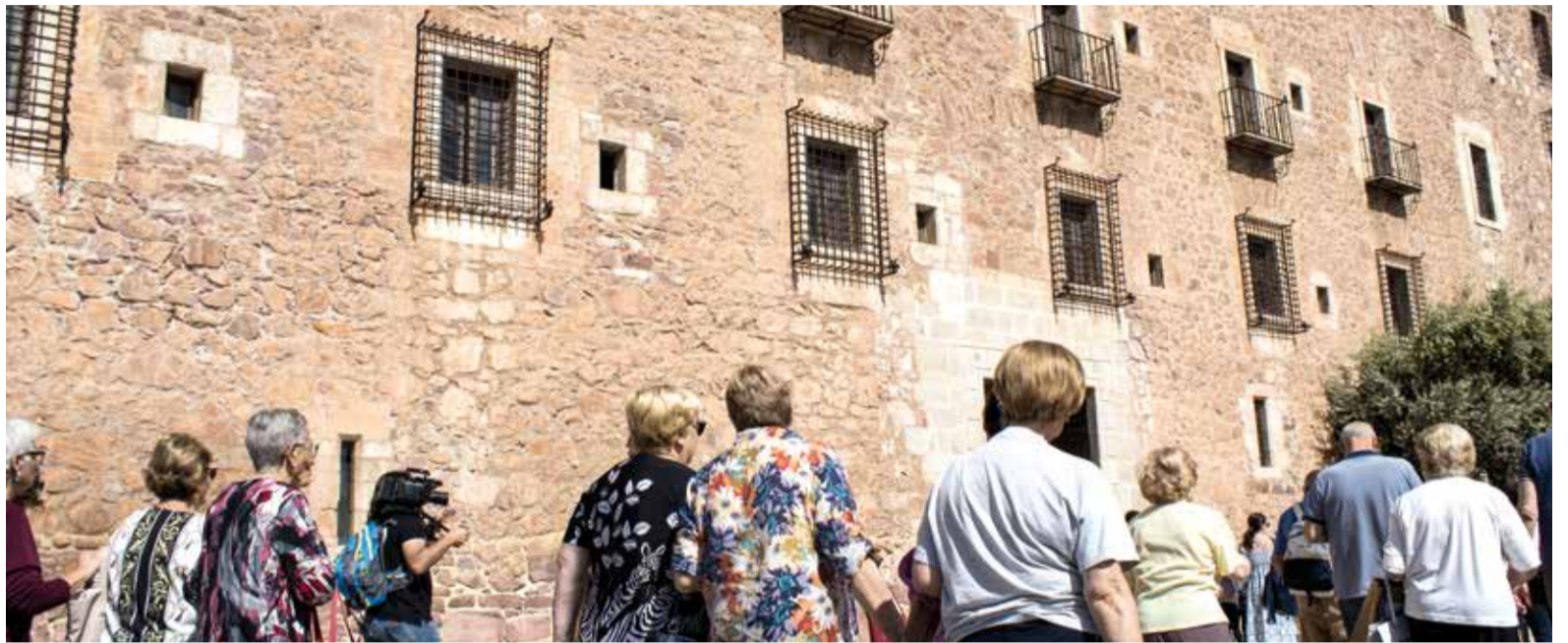
L'any passat també van visitar el Monestir

LA PRÒXIMA ESCAPADA SERÀ EL DIA 26 DE SETEMBRE, ON ELS LECTORS I LECTORES DEL PERIÒDIC VISITARAN EL MONESTIR DEL PUIG I LES RESTES DEL CASTELL DE JAIME I A LA POBLACIÓ