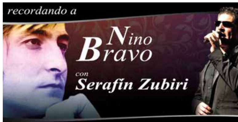
La població acollirà un concert de Serafín Zubiri este cap de setmana