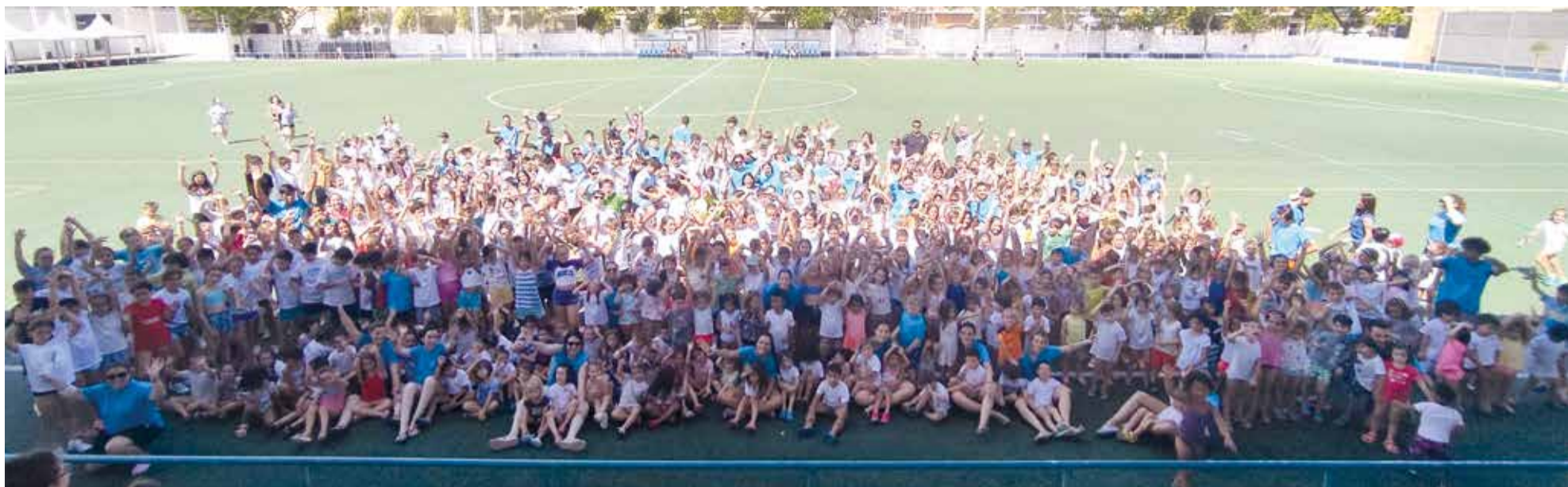
Participants en el Campus d'Estiu a Aldaia