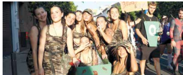
Nit de disfresses