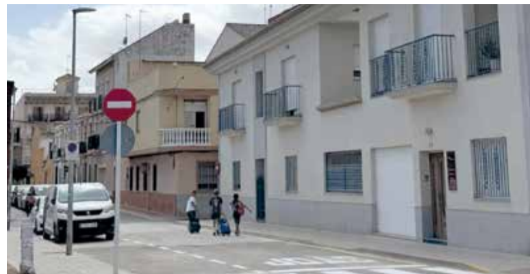
El carrer ja està obert