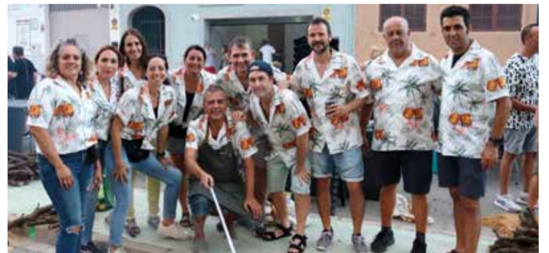
Paelles a Rafelbunyol