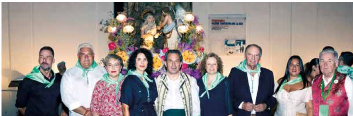
Alcaldesa, clavaria, regidors, diputats i alcaldes en els actes en honor a Sant Onofre