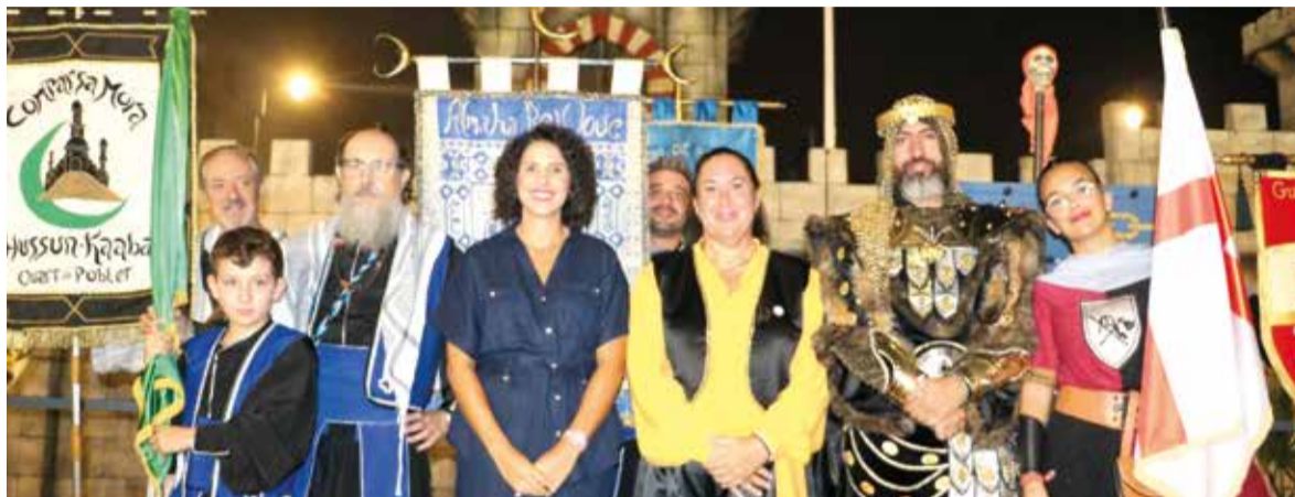
Tradició mora i cristiana a Quart de Poblet