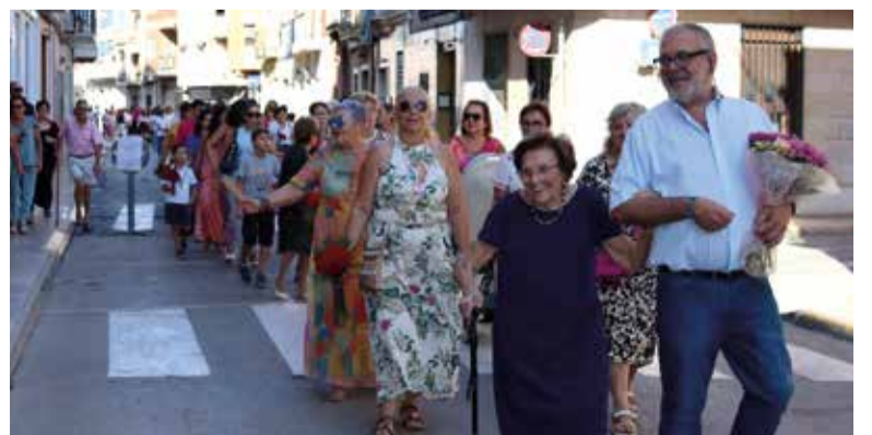
Molta participació en l'Ofrena de Flors

acolliment. Els actes lúdics s'han succeït al costat dels religiosos on la població ha eixit al carrer a participar dels actes més tradicionals.