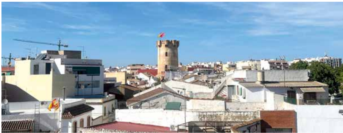
Imatge de Paterna