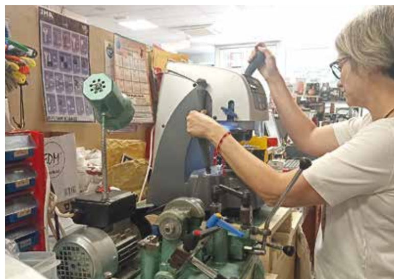
Ferreteria Bendicho, treballant tres generacions