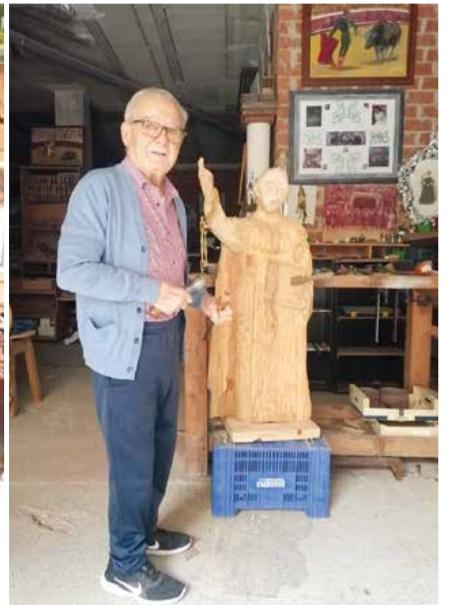
Tallant una de les seues escultures