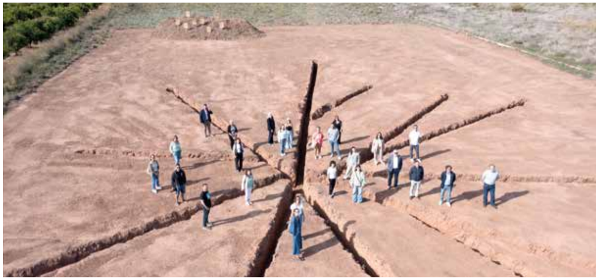
Artistes i representants de municipis de Turisme Carraixet en una de les obres del festival

ESCULTURES EFÍMERES I NOMBRESES ACTIVITATS PER A CONSCIENCIAR SOBRE LA IMPORTÀNCIA DE L'HORTA, EL CONSUM DE KMO I L'ATRACTIU TURÍSTIC DE L'HORTA NORD