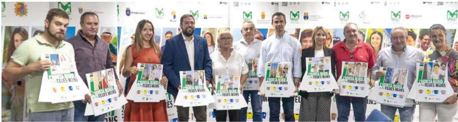
Els alcaldes i alcaldesses de les poblacions de la Mancomunitat durant la presentació de la nova campanya