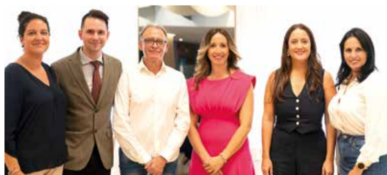
Alcaldesa junt als regidors i regidores de l'Ajuntament

La visita i l'entrevista ha donat els seus fruits positius i els tècnics municipals de tots dos Ajuntaments implicats ja estan treballant en la redacció d'un nou text municipal per al conveni que siga assumible per totes dues administracions, Burjassot i València, la redacció d'un protocol d'actuació que siga més fluid, i una memòria valorada de les accions més urgents a realitzar.