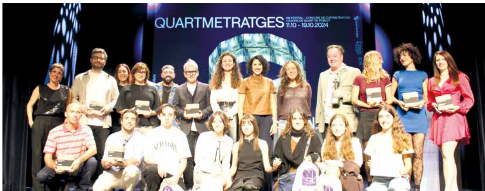
Premiats d'enguany junt a l'alcaldesa