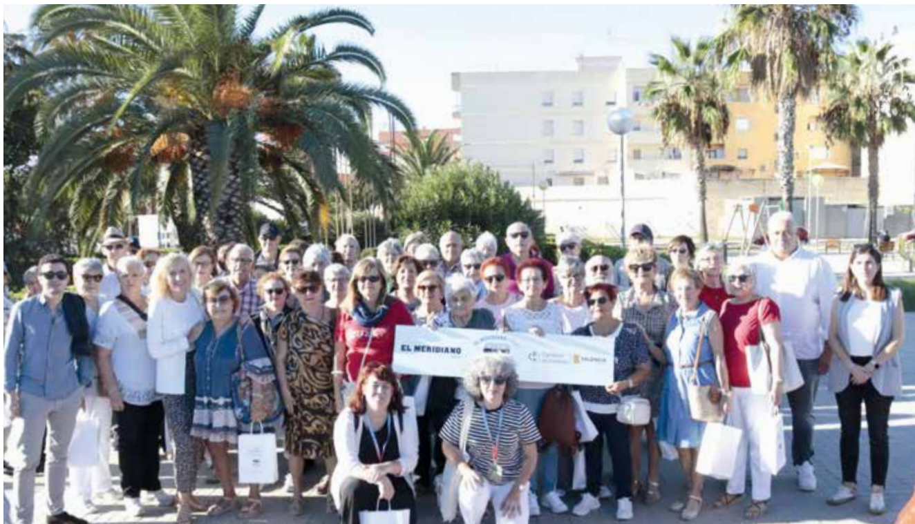
L'alcalde de Meliana, el diputat de turisme i regidor de Meliana, i també el regidor de festes van acomiadar al grup abans d'anar-se de Meliana a Aldaia