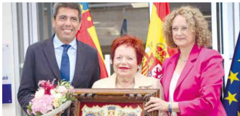
Encarna Borràs va estar present a la inauguració junt a Mazón, Camarero i Folgado

Les ajudes estan dirigides a famílies monoparentals que compten amb el títol oficial expedit.