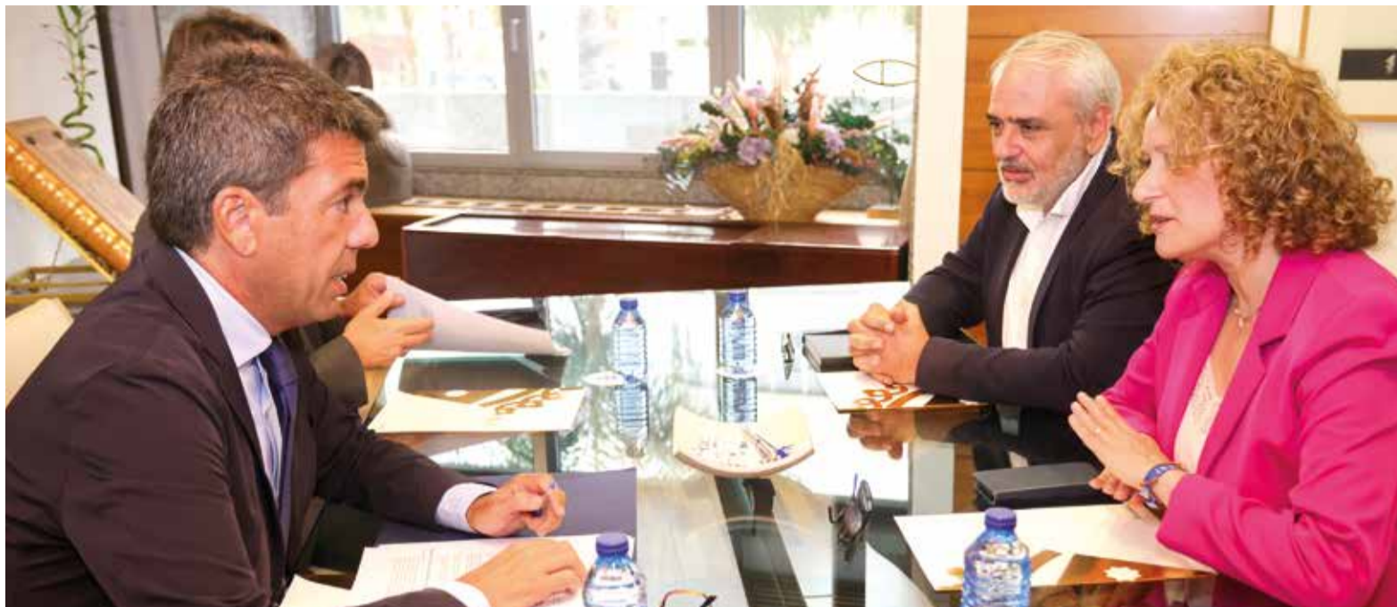
Mazón va anunciar un nou soterrament del metre durant la seua visita a Torrent