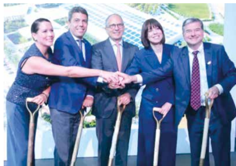
El President de la Generalitat i l'alcalde van assistir a l'acte inici de les obres

D'esta manera, ha assegurat que esta instal·lació d'Edwards convertirà al polígon industrial Moncada III, que va estar paralitzat durant vint anys, "en un autèntic