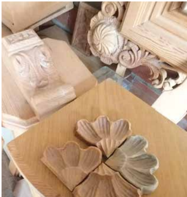
Darrere de cada peça hi ha moltes hores de treball

Els seus dibuixos a carbonet, escultures, marcs d'espills amb mil flors, amb fusta de la de veritat, i el més tendre és veure-ho agafar les ferramentes, perfectament col·locades en la seua taula de treball, òbviament de fusta; els seus motes, i veure les seues mans elaborant art minucios és ara com ara un dels regals de la història que es pot compartir, veure i gaudir en la localitat de Foios.