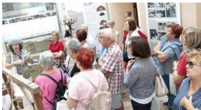
Van visitar un taller artesà de palmitos