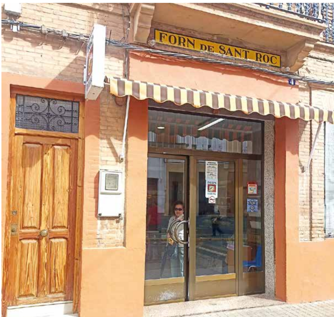
Forn a Meliana