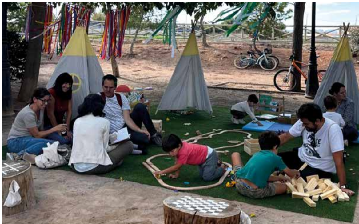
El festival inclou nombroses activitats dirigides a tots els públics

de València (UPV) com de la Universitat CEU Cardenal Herrera.