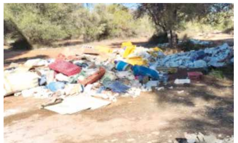
Abocaments a Manises

La campanya 'Torna a l'escola amb el comerç de Paiporta' es reprendrà el pròxim estiu per a continuar promovent les compres relacionades amb l'entrada en el nou curs en els comerços de barri.