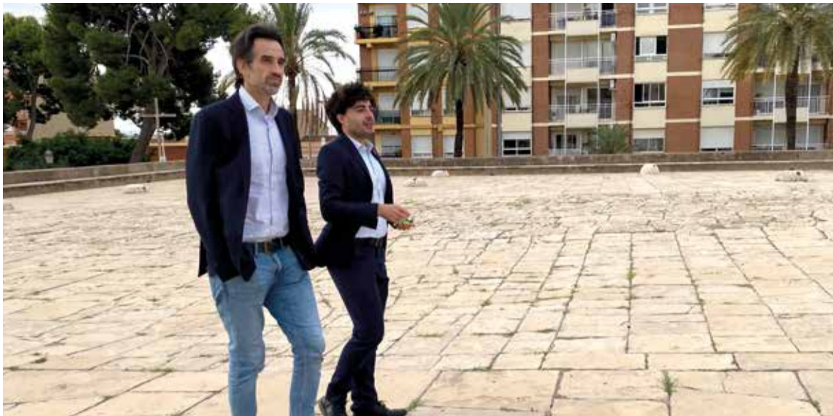
Regidors de Burjassot i València