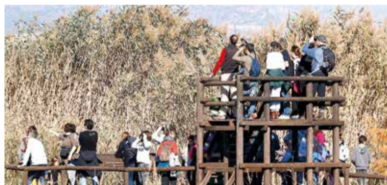
Marjals dels Moros