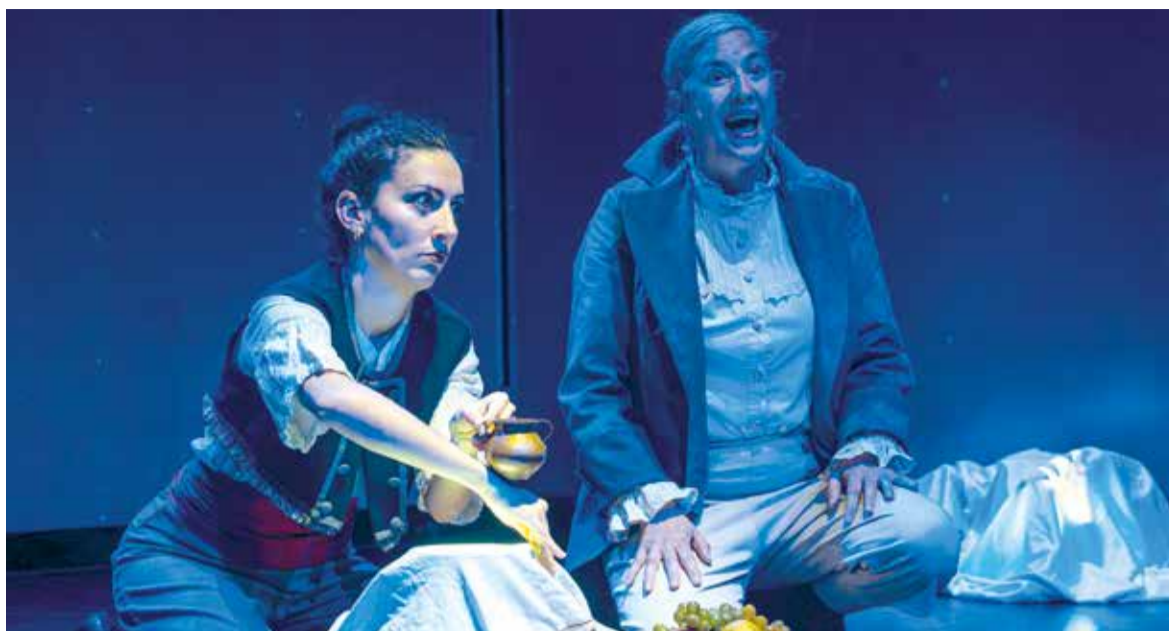
Representació d'una de les obres previstes a la comarca