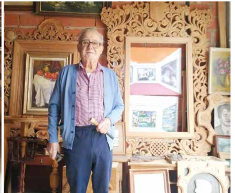
El treball sempre va ser també la seua afició, ara jubilat la continua disfrutant