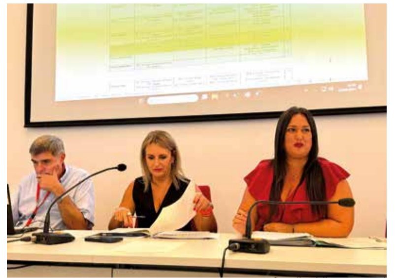
Consellera i directora general

Estes iniciatives compten amb la implicació i col·laboració del teixit associatiu comarcal, de l'Ajuntament d'Alboraià i amb el cofinançament de la Direcció General de Comerç -Xarxa AFIC i Caixa Popular.