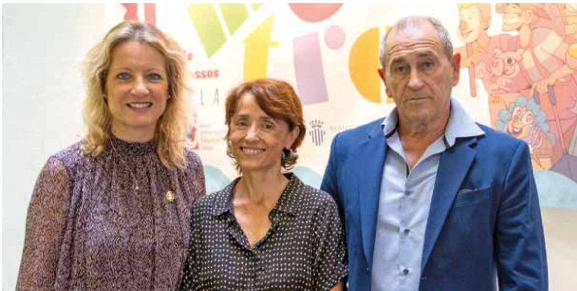
L'alcalde de Xirivella junt al regidor i la directora de la Mostra

L'Ajuntament d'Aldaia compta amb un servici d'atenció i seguiment per a persones amb malaltia mental, la finalitat de la qual és la detecció i remissió precoç dels possibles casos greus, la prevenció de les crisis i promoció de la salut i oferir suport per a fomentar o millorar la vinculació de les persones amb malaltia mental greu amb els servicis socials i sanitaris.