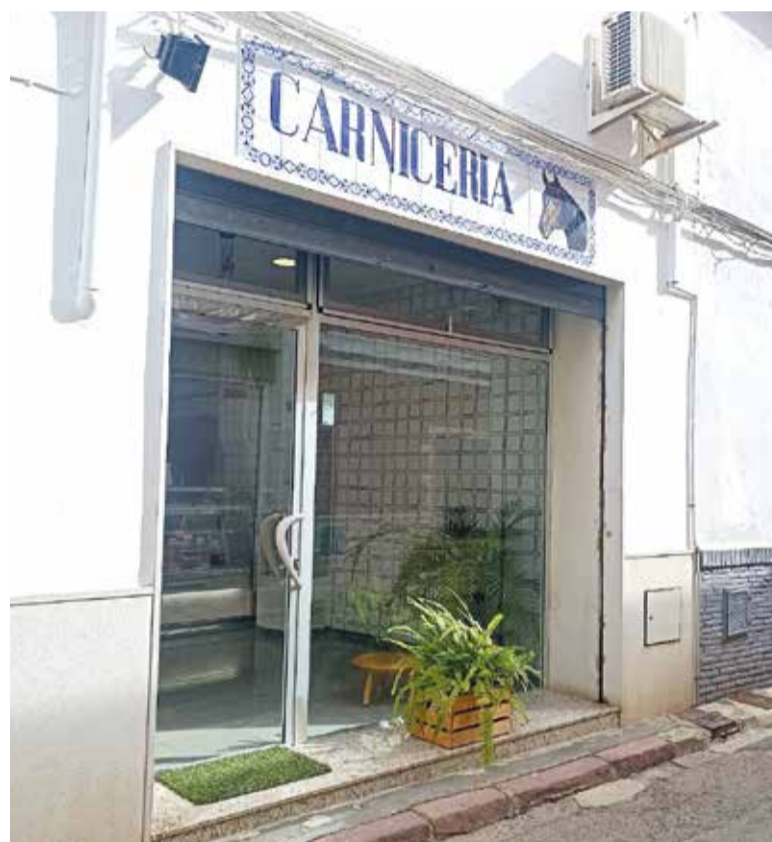
Comerç tradicional a la comarca