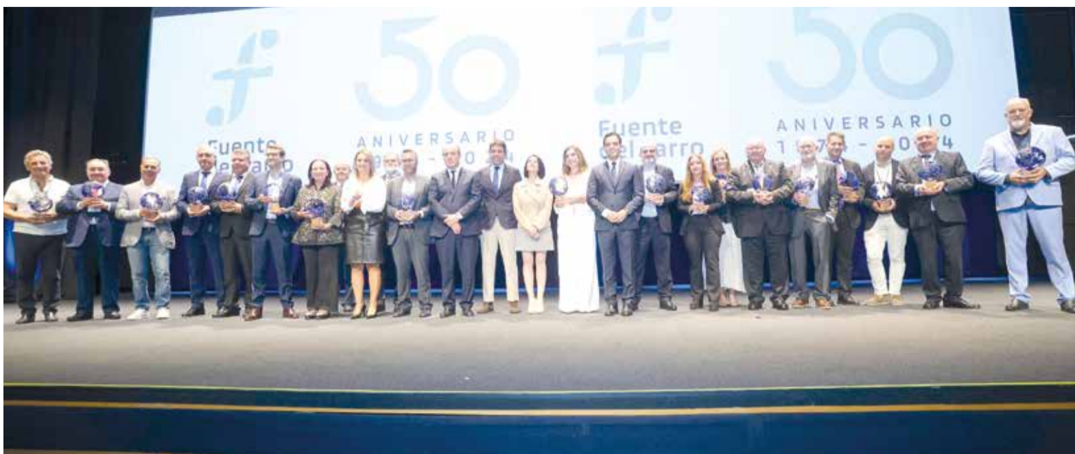
El President de la Generalitat i l'alcalde de Paterna junts als premis d'emgumay