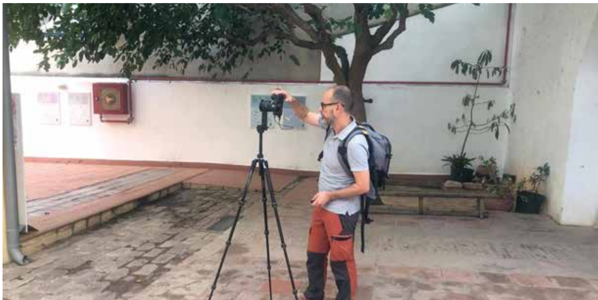
Gràcies a la tecnologia ja és possible acostar els museus a les cases sense necessitat de desplaçar-se