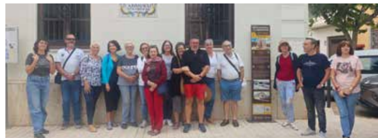
Participants en una de les excursions realitzades per la Mancomunitat