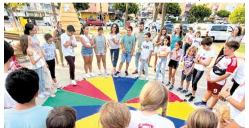
També va ser un dia de jocs

era obtenir un resultat concret d'aquest dia, que es va materialitzar en un manifest sobre els seus drets (en adjunt), i especialment, en la creació d'unes rajoles que quedarien de manera permanent en l'espai públic de la ciutat.