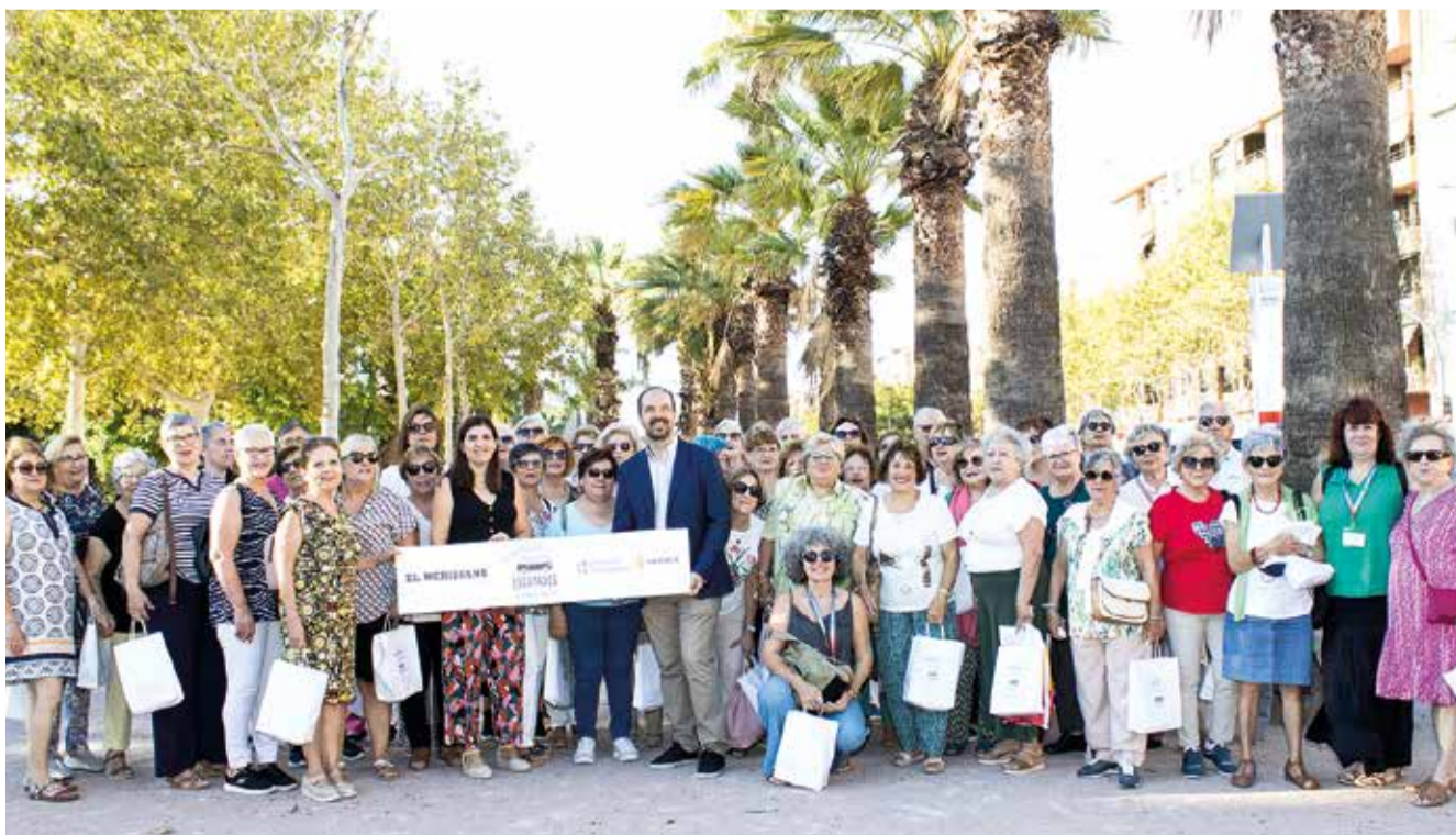
L'alcalde d'Aldaia va acudir al punt de trobada dels seus veïns i els va desitjar un bon viatge, al mateix temps que va agrair la iniciativa del periòdic