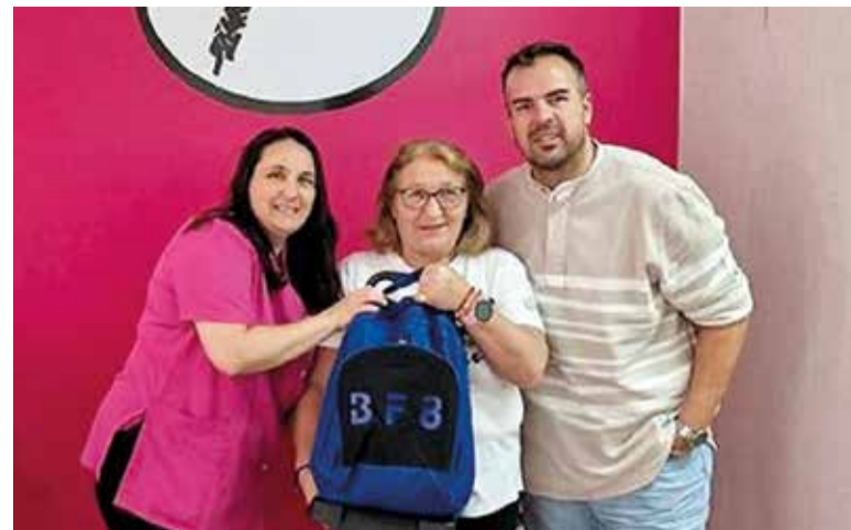
Premis a Paterna

D'aquesta manera, els propietaris d'un habitatge a Alacant abonen una mitjana de 773 euros en el rebut de la contribució, a València uns 500 euros, a Benidorm paguen una taxa de 683 euros o en altres localitats d'Espanya com Saragossa amb una càrrega impositiva de 0,64, els ciutadans desemborsen per exemple la quantitat de 540 euros de mitjana en aquest rebut.