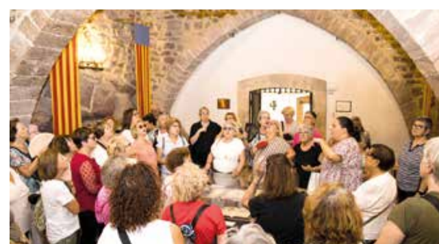
Visita pel Monestir del Puig