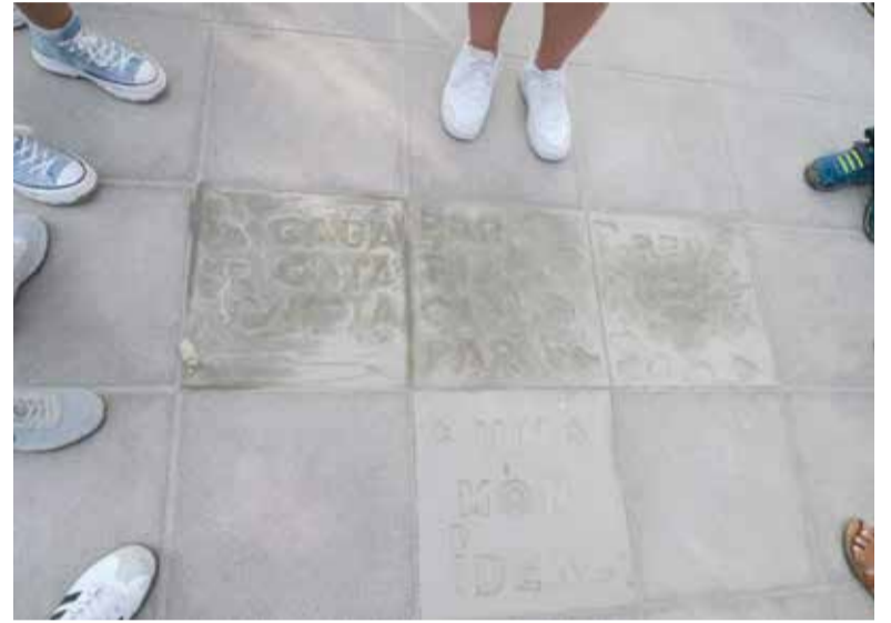
Noves rajoles a la Plaça Corts Valencianes

La trobada, que va ser dissenyada pels propis xiquets i xiquetes participants, va girar al voltant del dret al joc i els seus vincles amb la protecció de la infància front a la violència, la no discriminació i la lluita contra el canvi climàtic. La intenció dels organitzadors