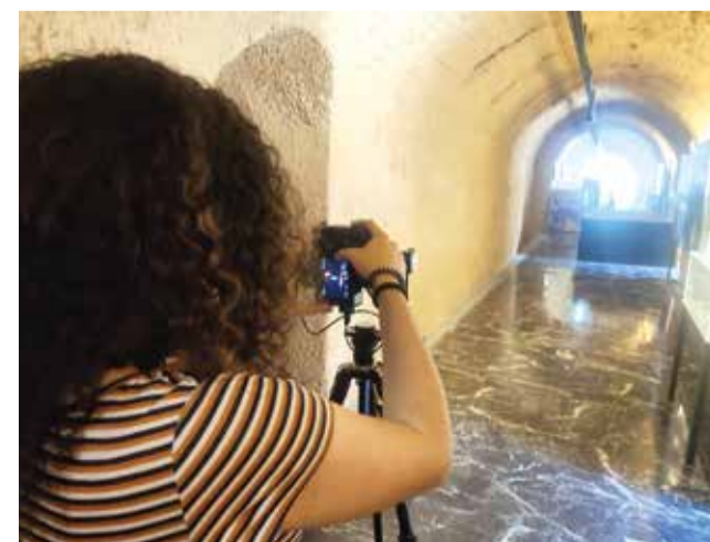
Les imatges es van tomar pocs dies abans de la DANA