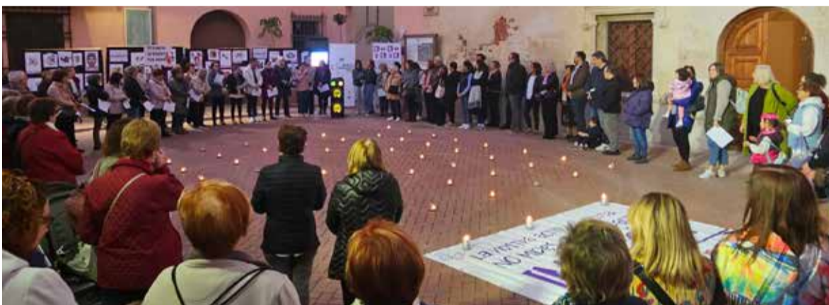
Concentració a Alfara del Patriarca

“Front al masclisme, Educació”, és el lema que ha triat aquest any la Mancomunitat del Carraixet per al 25N