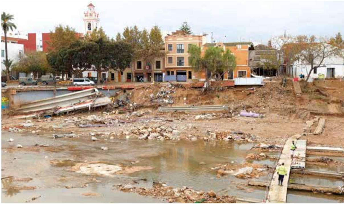
Picanya, 19 dies després de la riuada.

Els danys econòmics provocats pel desbordament dels barrancs són incalculables. S'han perdut milers de vivendes i comerços, es calcula que més de 100.000 vehicles s'han vist afectats per la Dana. També equipaments esportius municipals, auditoris, cases de cultura, centres escolars, carreteres, ponts, gran part de l'entramat de les vies del metre i també del tren al seu pas per Alfafar, Benetússer i Sedaví. La pèrdua de vivendes continua després de la Dana. Nombroses finques de Catarroja o Paiporta s'han vist afectades pel volum i força de l'aigua. S'estan produint desallotjaments i precintant edificis per seguretat.