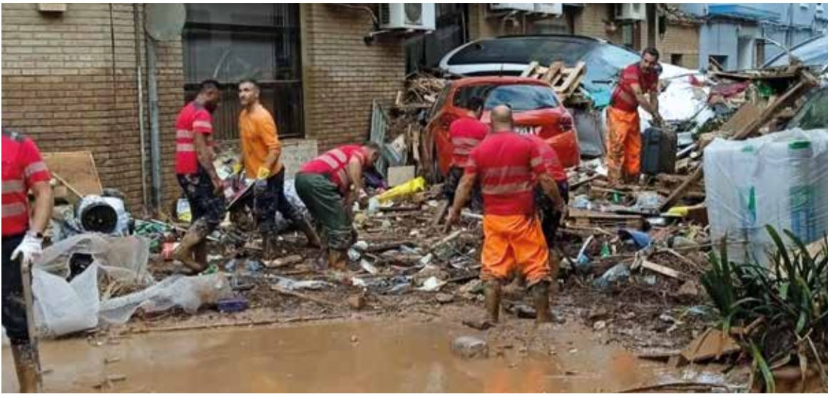
Ajutant als pobles afectats