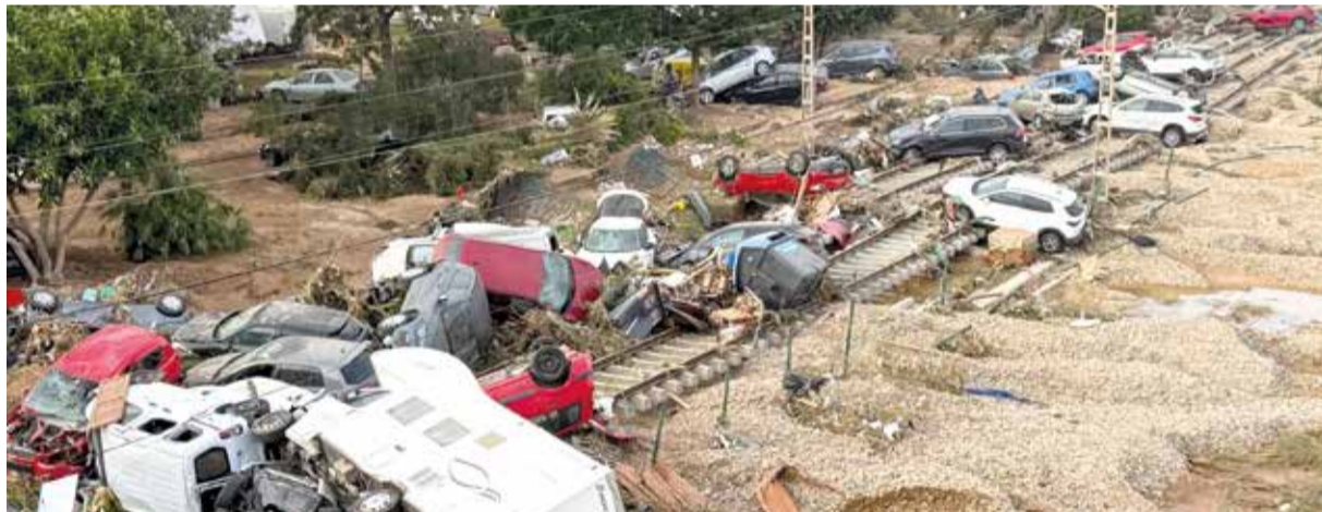
Vies de tren al seu pas per Alfafar i Benetússer.