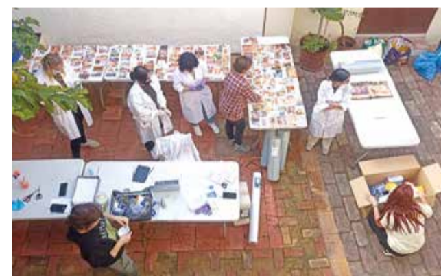
Les fotografies arriben a la seu del Museu Comarcal