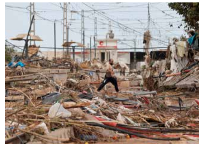
Metro a Paiporta.

Fins a la data, la Generalitat ha restablert la circulació en quasi la totalitat de les 18 carreteres que es van veure afectades, in-