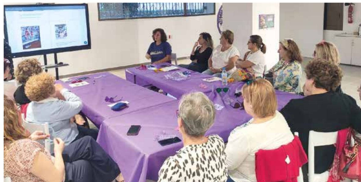
Jornades de formació a la Casa Violeta

Per iniciativa de les pròpies associacions participants, allò recaudat anirà destinat a les persones afectades per la recent DANA que patixquen càncer, a través de l'Associació Espanyola Contra el Càncer (AECC). Eixe mateix dia, a les 12 hores, a Casa Violeta es realitzarà una explicació de l'exposició 'Fotovoz: Un click per la igualtat'. I a continuació, a les 12.30 hores, tindrà lloc el contacontes amb titelles 'El cofre de la igualtat'.