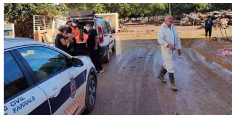
Protecció Civil i Policia Local de La Pobla de Farnals als pobles afectats per la Dana

Amb aquesta mena d'iniciatives, la Policia Local cerca no sols prevenir conductes de risc, sinó també fomentar un ús responsable i segur de les xarxes socials entre l'alumnat del centre educatiu.