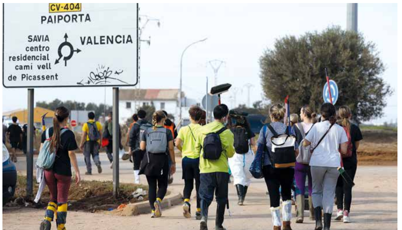
Voluntaris caminen cap als pobles afectats.

Molts voluntaris van acudir fins a les zones en els seus propis cotxes deixant-los als afores de les poblacions, també