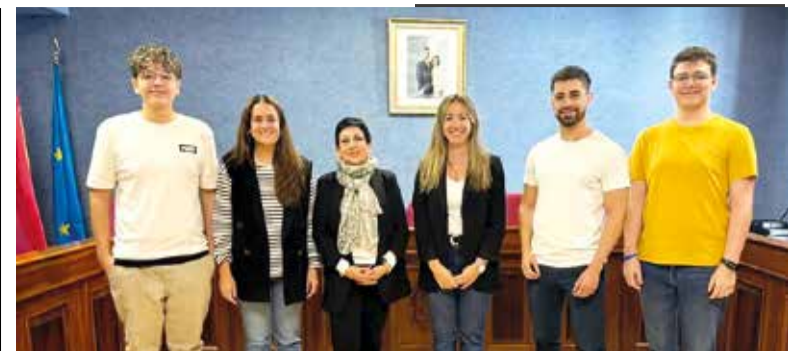
Nous treballadors municipals

Finalment, el 9 de desembre, a les 19 hores, en el Saló de Plens de l'Ajuntament, serà el lliurament dels premis del concurs contra la violència de gènere.