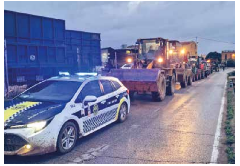
Ajutant als pobles afectats