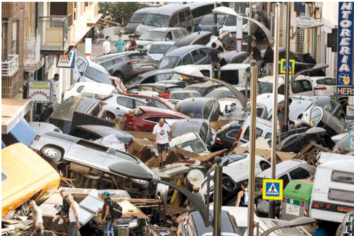
Carrer a Alfafar.

El dia 30 les dimensions de la tragèdia eren ja evidents. El Meridiano va parlar eixe dia amb els alcaldes i alcaldesses de les poblacions afectades, encara en estat de xoc, demanaven ajuda que no arribava. Reclamaven a la UME, a més efectius de Bombers, ambulàncies, però eixa ajuda no arribava. L'organització dels veïns en bon estat va ser crucial per a salvar vides de veïns atrapats en cotxes, en cases o fins i tot en arbres. Es van viure moments de molta tensió on era prioritari traslladar a malats oncològics o de diàlisi als seus tractaments periòdics, així com dotar a la població de medicació pautaada i totalment imprescindible. A més, les comunicacions seguien caigudes, sense connexió a internet, el que va provocar nombrosa falta de desinformació per als veïns afectats.