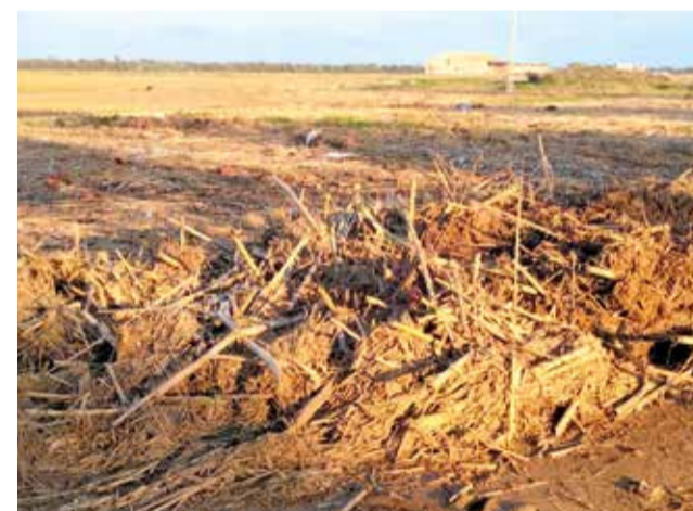
Canyes en la marjal

Per això, es pregunta "com és possible que en aquella època, que només hi havia uns quants agutzils i uns pocs telèfons, i anaven quasi tots a peu o amb bicicleta, es va avisar primer a l'Ajuntament des d'on fora i després a tot el poble, i no va haver-hi ací víctimes que jo sàpia, mentre que ara no ha sigut així".