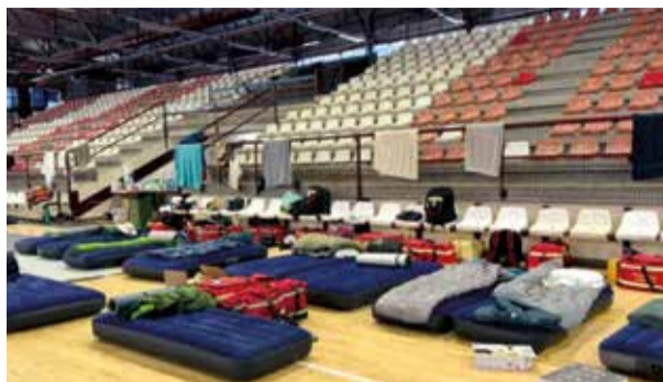
Poliesportiu de Paterna

PATERNA ACULL A 200 BOMBERS DE TOTS ELS PUNTS D'ESPANYA