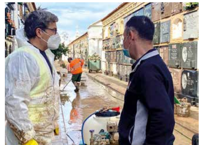
Cementeri de Catarroja

La Dana va arrasar amb gran part del comerç local. Un comerç que feia un paper fonamental i integrador de les poblacions. La seua obertura de forma molt progressiva és anunciada pels Ajuntaments a través de les xarxes socials, informant de les obertures dels comerços quan es van produint.