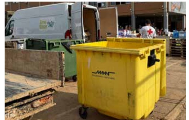
Contenidors de l'Horta Nord als pobles afectats

La Mancomunitat l'Horta Nord també ha mobilitzat els seus mitjans tècnics i humans des del primer moment per a donar suport a la població dels municipis afectats per la DANA a la comarca veïna de l'Horta Sud. La Mancomunitat l'Horta Nord continua en constant comunicació amb els municipis per a adaptar-se a les necessitats emergents, coordinar el relleu dels equips desplegats i planificar la incorporació de nous perfils professionals a partir de la setmana vinent, entre els quals es