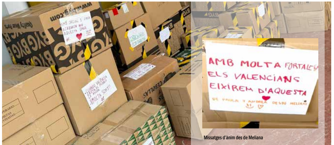
Missatges d'ànim des de Meliana

Estes imàgens de solidaritat han alluminat els dies més obscurs que acabem de viure. En especial, vullc destacar el paper dels jóvens, que, llunt de ser una "generació de cristal" han respost en determinació. Els jóvens nos han donat una lliçó a les generacions més majors. I hem descobert que són sacrificats, generosos i treballadors. Són valors que associàvem a les generacions que nos varen precedir, i que, per sort, han here-