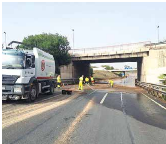
Maquinària i personal de Mislata als pobles afectats