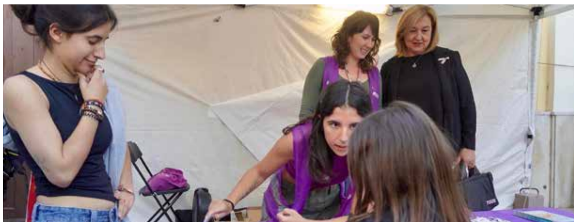
Punt Violeta al Mercat Medieval