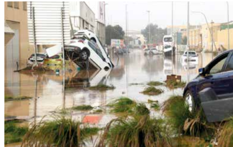
Polígon industrial a Sedaví.