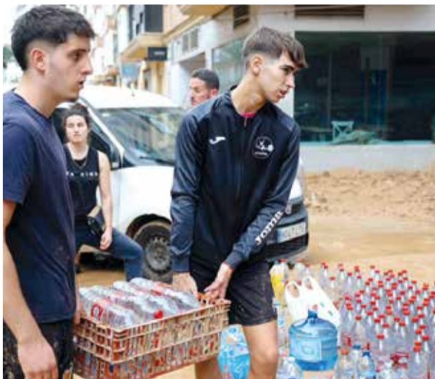
Voluntaris portant aigua.

Moncada a més es va convertir en Punt de Comandament de Protecció Civil amb més de 400 voluntaris de tota Espanya la primera setmana de la catàstrofe pujant a més de 800 voluntaris els següents dies. Tota la comarca treballant a una, Horta Nord i Horta Sud.