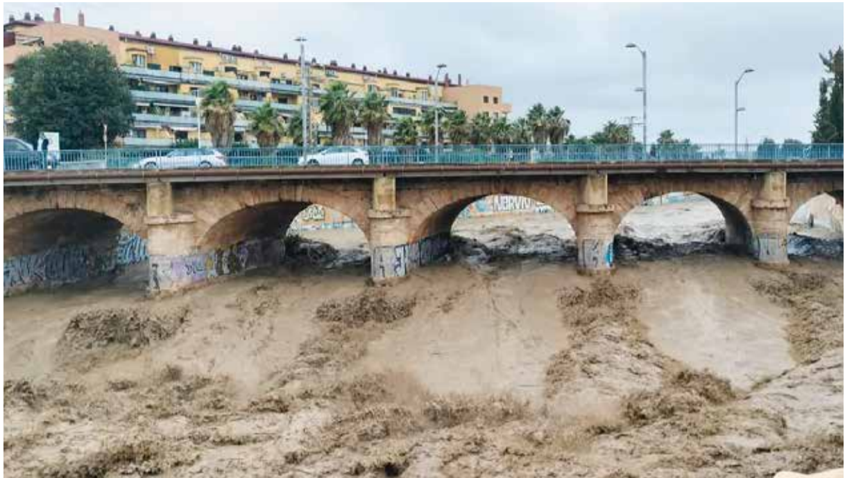
Barranc de Catarroja a mig dia

Els mitjans de comunicació van arribar prompte, l'ajuda va tardar molt més a arribar. Una catàstrofe de dimensions incalculables no sols a la comarca sinó a tota la província. I és quan ací va començar a escriure's la nova història en Horta Sud quan la vida social, cultural i esportiva desapareix per a només intentar sobreviure.