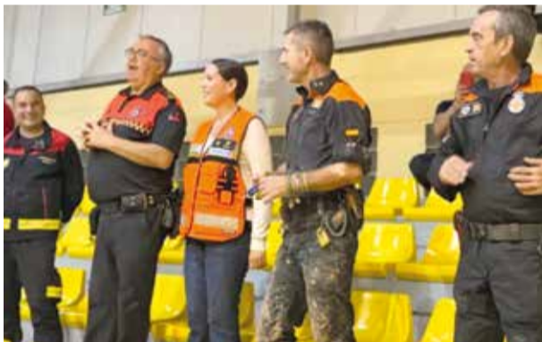
Protecció Civil a Montcada

L'operatiu de Protecció Civil situat a Moncada va ajudar en les labors de rescat d'una víctima de la riuada a Benetússer. La dona portava tres dies tancada en el seu vehicle en ple carrer dins del nucli poblacional. Quan van començar a retirar-se els vehicles que obstruïen la zona, l'operatiu de Protecció Civil va sentir els crits d'auxili. La dona va ser rescatada amb vida i derivada per al seu tractament als serveis sanitaris. La dona portava tres dies dins del cotxe des que va ser sorpresa per la riuada. Sobre el seu vehicle hi havia molts més cotxes.