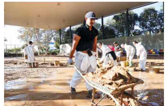
Camp de futbol a Massanassa.