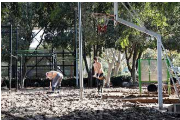
Parc a Massanassa