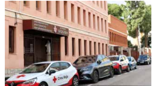
Centre municipal de Burjassot

Burjassot alberga en el Centre d'Atenció Temporal de la Llar Sequera quasi un centenar de persones desplaçades de municipis de l'Horta Sud que s'han vist afectades per la DANA del passat 29 d'octubre. El centre es va posar en marxa gestionat per la Generalitat i la Creu Roja, i l'Ajuntament amb tots els seus serveis municipals s'ha posat a la disposició de les persones desplaçades al Centre per al que siga necessari.