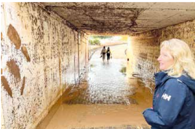
Pas subterrani a Xirivella