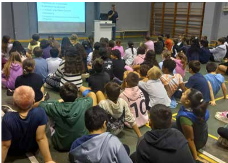
Xarrada sobre xarxes socials al CEIP

gut possibles gràcies a una subvenció de 47.574 euros concedida a l'Ajuntament de La Pobla de Farnals per la Generalitat Valenciana i també la Conselleria d'Economia Sostenible, Sectors Productius, Comerç i Treball, a través de LA-BORA.