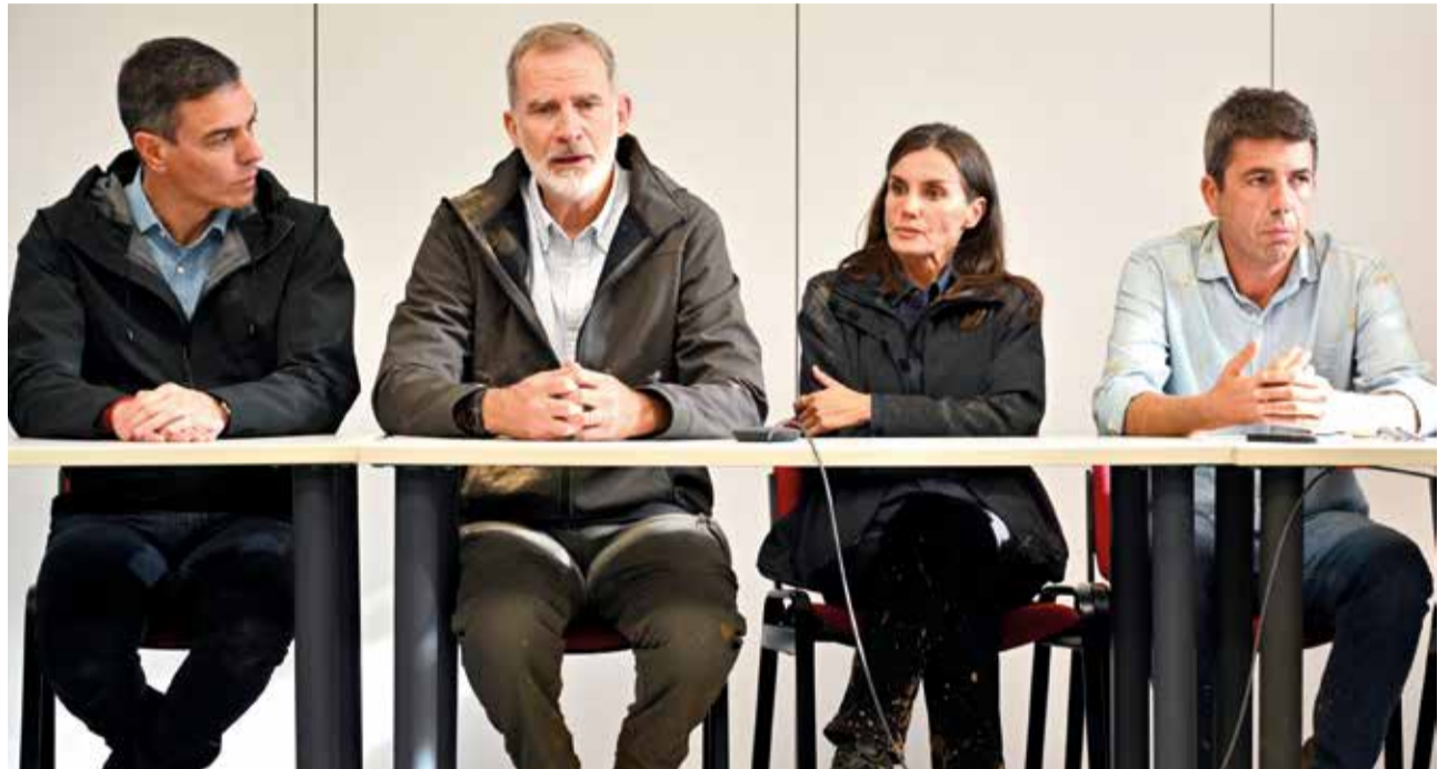
Pedro Sánchez, el Rei i la Reina i Carlos Mazón en el centre d'emergències de l'Eliana.

Per part seua, el ministre de l'Interior, Fernando Grande-Marlaska, ha parlat sobre aquest tema, ja que fins al 27 de novembre no ho farà el president del Govern, Pedro Sánchez, el