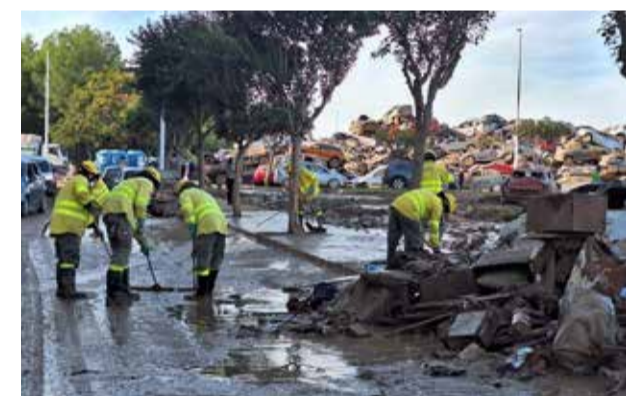
Bombers andalusos a Catarroja (Foto: Infoca)

D'apagar focs en les muntanyes andaluses a lluitar contra el fang a Catarroja i Albal. El Pla Infoca del Servei d'Extinció d'Incendis Forestals d'Andalusia ha desplegat, en més de dos setmanes que porten actuant en estes dos poblacions afectades per les inundacions, 1.194 efectius en diferents relleus, 30 autobombes, 50 vehicles lleugers i 4 màquines pesades. 'Els de groc', com els anomenen popularment, estan treballant intensament en la neteja de carrers i rebent l'agraïment i la simpatia de la població (Foto: Infoca).