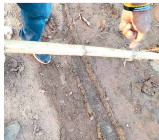
Canyes brollant en la marjal