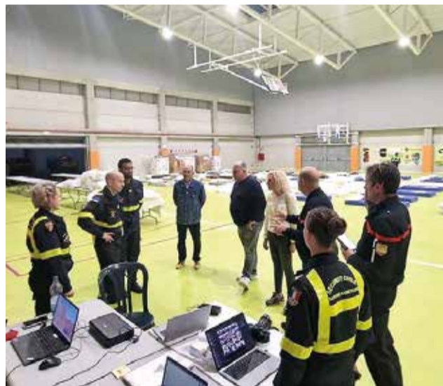
El poliesportiu de Meliana també s'ha cedit com a allotjament