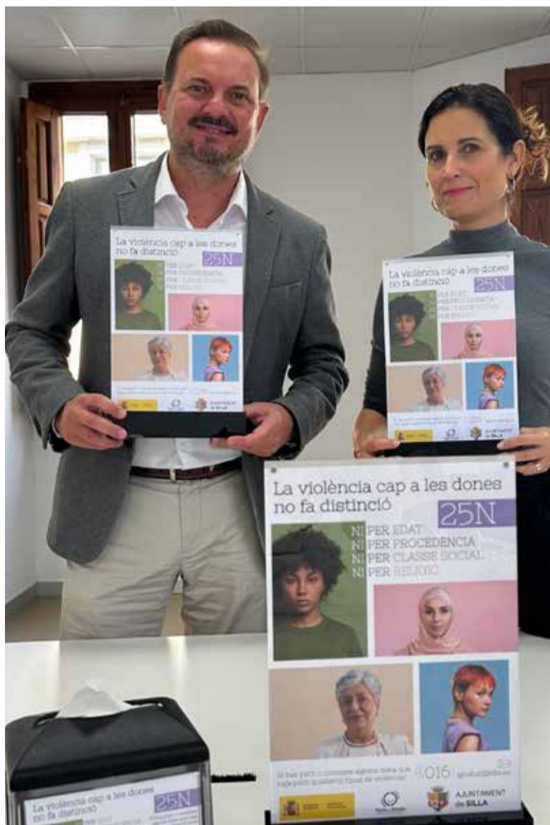
L'ajuntament farà activitats amb motiu del 25N