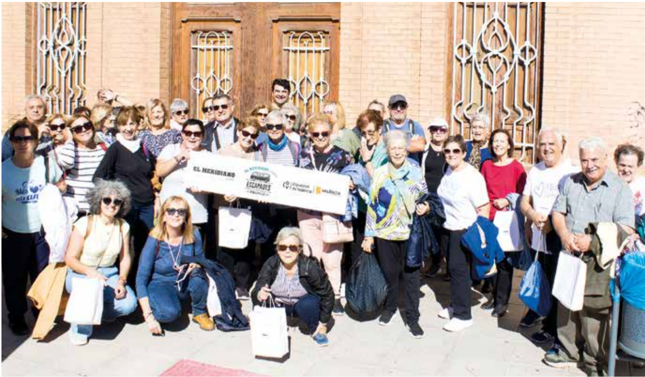
Grup d'Alfafa a Foios. inici de l'Escapada Comarcal El Meridiano