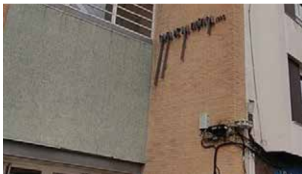
Cada de la Música a Aldaia

LA RIUADA ARRASA EL PATRIMONI DE LA CASA DE LA MÚSICA D'ALDAIA