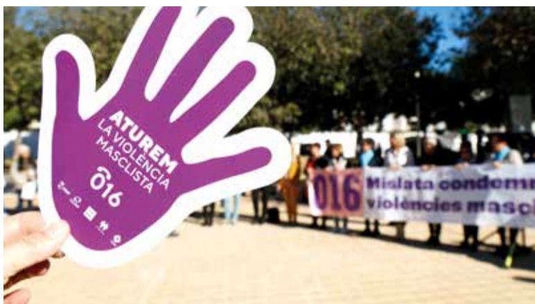
Activitats del 25N a Mislata any passat