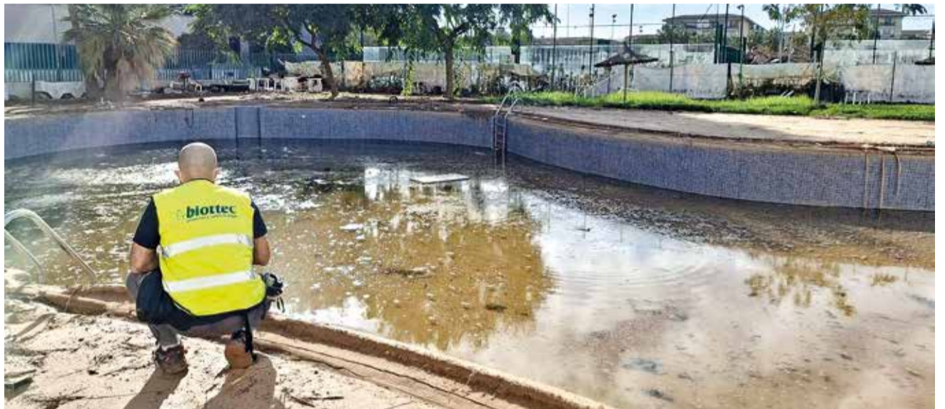
Piscina de Benetússer.

Quinze dies després de la tragèdia i amb una gran faena per davant, les poblacions lluiten per recuperar una mica de normalitat.