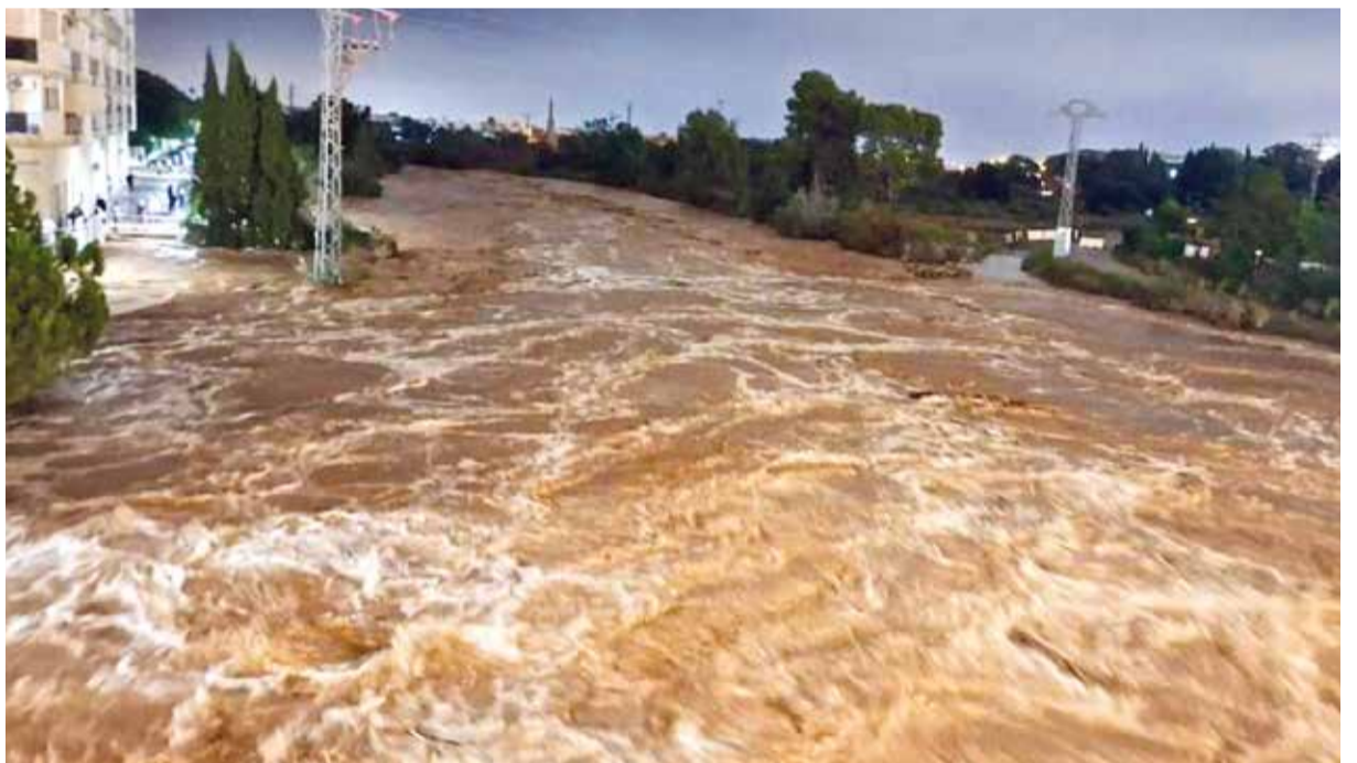
Barranc de Picassent per la vesprada