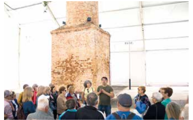
Van conèixer la fàbrica de la seda