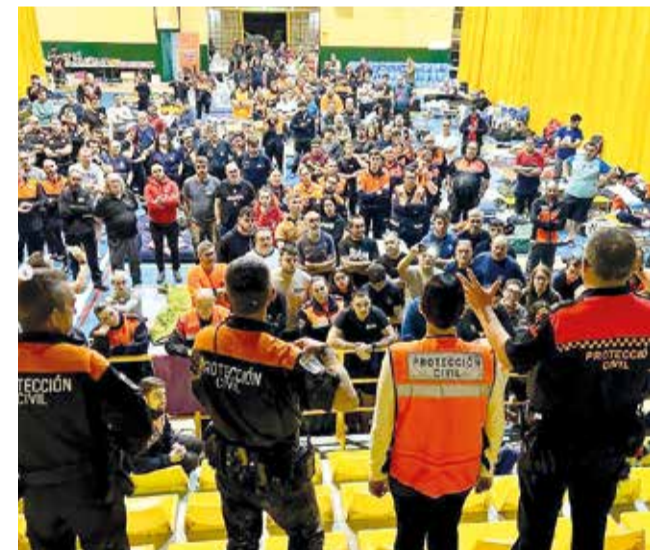
Més de 800 voluntaris de Protecció Civil s'ha coordinat des de Moncada