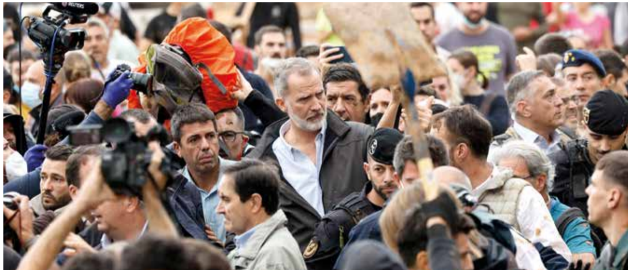
Moments de tensió durant la visita a Paiporta.

ministre ha negat que el 29 d'octubre, el dia de la Dana a la província de València, hi haguera cap "apagada informativa" per part del Govern en relació a la crescuda del barranc del Poyo. "Van haver avisos necessaris i precisos i de manera permanent. Va ser una comunicació permanent i en cap moment, va haver-hi cap apagada, sinó la informació oportuna, necessària i precisa i continuada en el temps", ha afirmat el ministre.