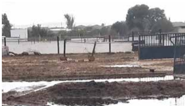
Hípica a Aldaia

L'HÍPICA RABEL D'ALDAIA NECESSITA UN MECÀNIC I UN TRACTOR