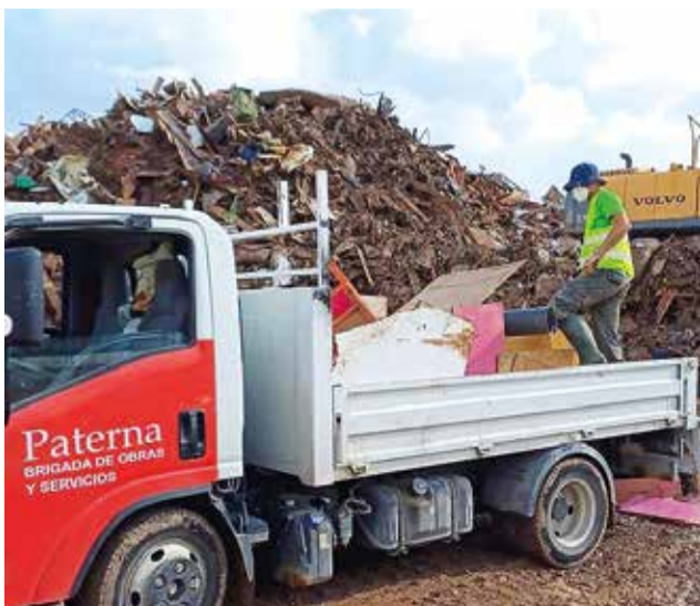
Operaris de Paterna als pobles afectats