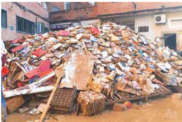
Els llibres de la biblioteca d'Aldaia