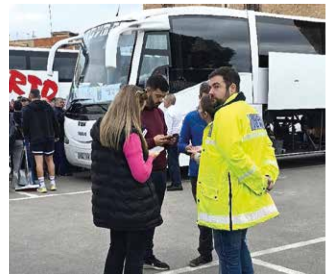
La Mancomunitat de l'Horta Nord ha organitzat autobusos amb voluntaris