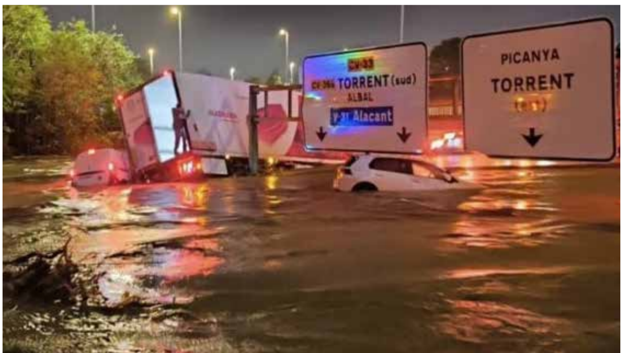
L'aigua va arribar a les carreteres