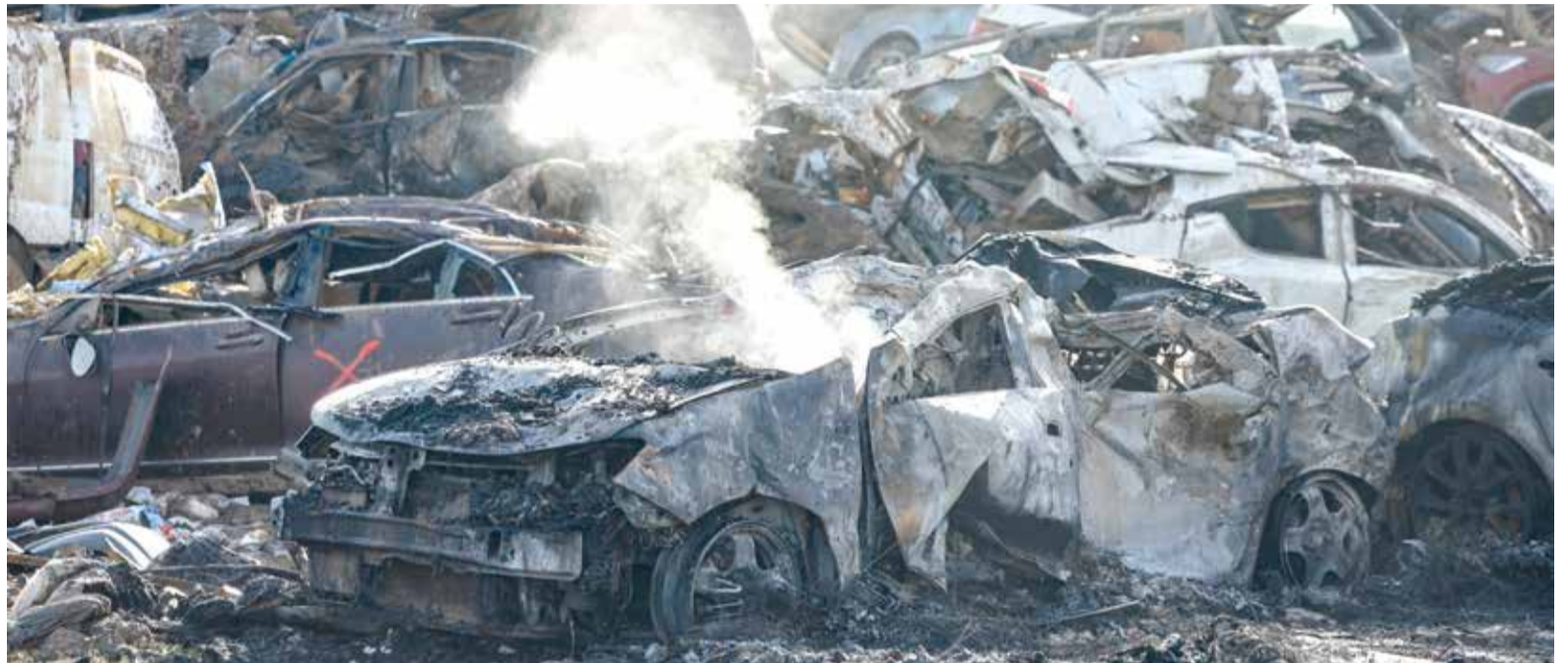
Campana a Catarroja després de l'incendi

EMERGÈNCIES SOL·LICITA UN INCREMENT DE LA SEGURETAT EN LES CAMPES D'APILAMENT D'ESTRIS I VEHICLES RETIRATS PER LA DANA