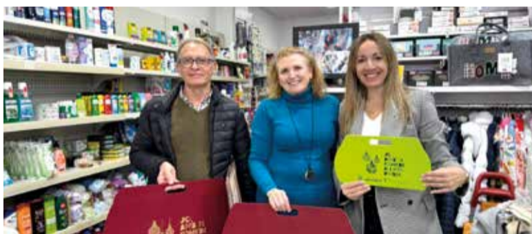
Alcaldesa i regidor en un comerç de la localitat durant el repartiment de bosses de regal