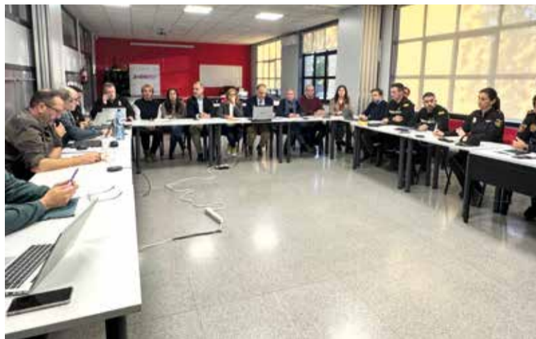
Alcaldesses de Catarroja, Benetússer i Paiporta en el CECOPI