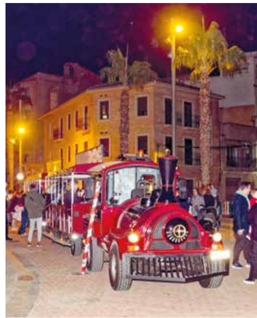
Tren de Nadal a Alboraya