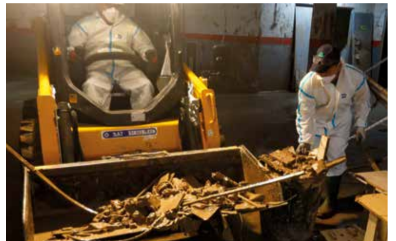
Empresa treballant en l'extracció de llot en un garatge

continuen estant molt fosques quan arriba la nit i els veïns no se senten segurs.