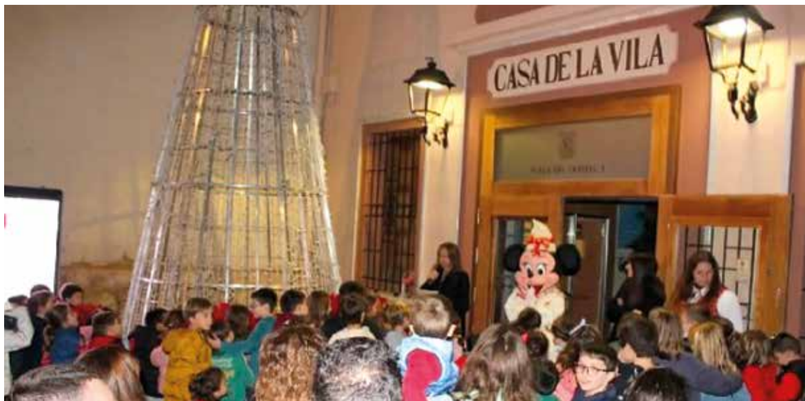
Encés de llums de Nadal a l'Ajuntament de Museros