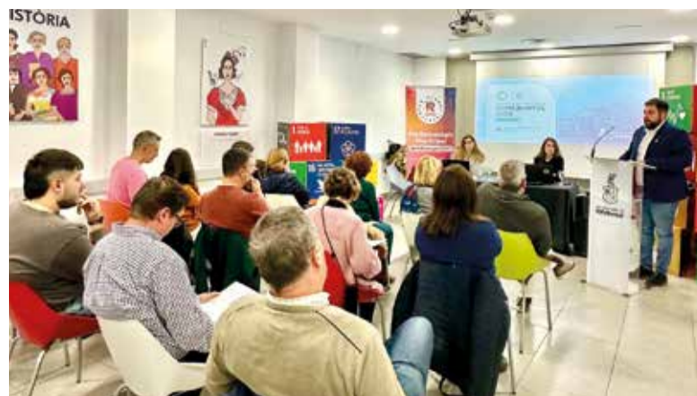
Reunió a Rafelbunyol

de 2024 i el 6 de gener de 2025, en algun domicili de la localitat. Es donaran un total de tres premis, sense dotació econòmica. El jurat visitarà els domicilis del 12 al 16 de desembre. També Massamagrell celebraenguany el seu XXVII Concurs Local de Pesebre. Podran participar tots aquells veïns i veïnes de Massamagrell que munten un Betlem en algun domicili de la localitat durant les festes de Nadal. Les persones guardonades es comprometen a exhibir, al públic en general, la composició guanyadora durant els dies i l'horari que es determine amb el titular del Betlem.