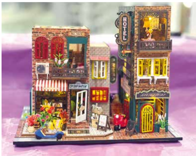
Barri en miniatura