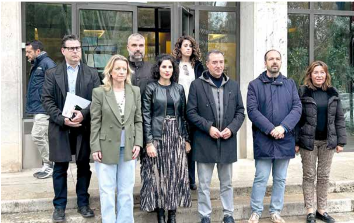
Els alcaldes i alcaldesses afectats pel barranc La Saleta -Pozolet a la porta d'entrada de la Confederació Hidrogràfica del Xúquer