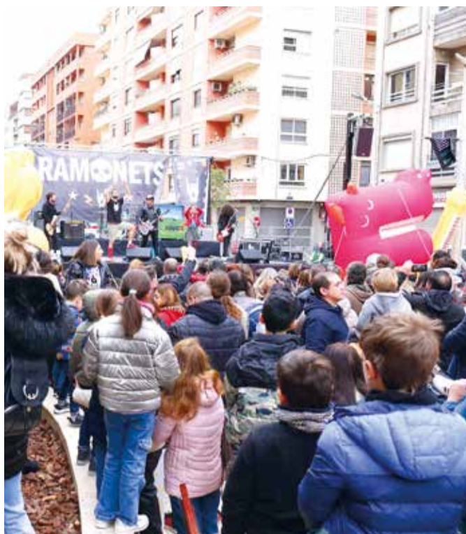
Concert a Mislata