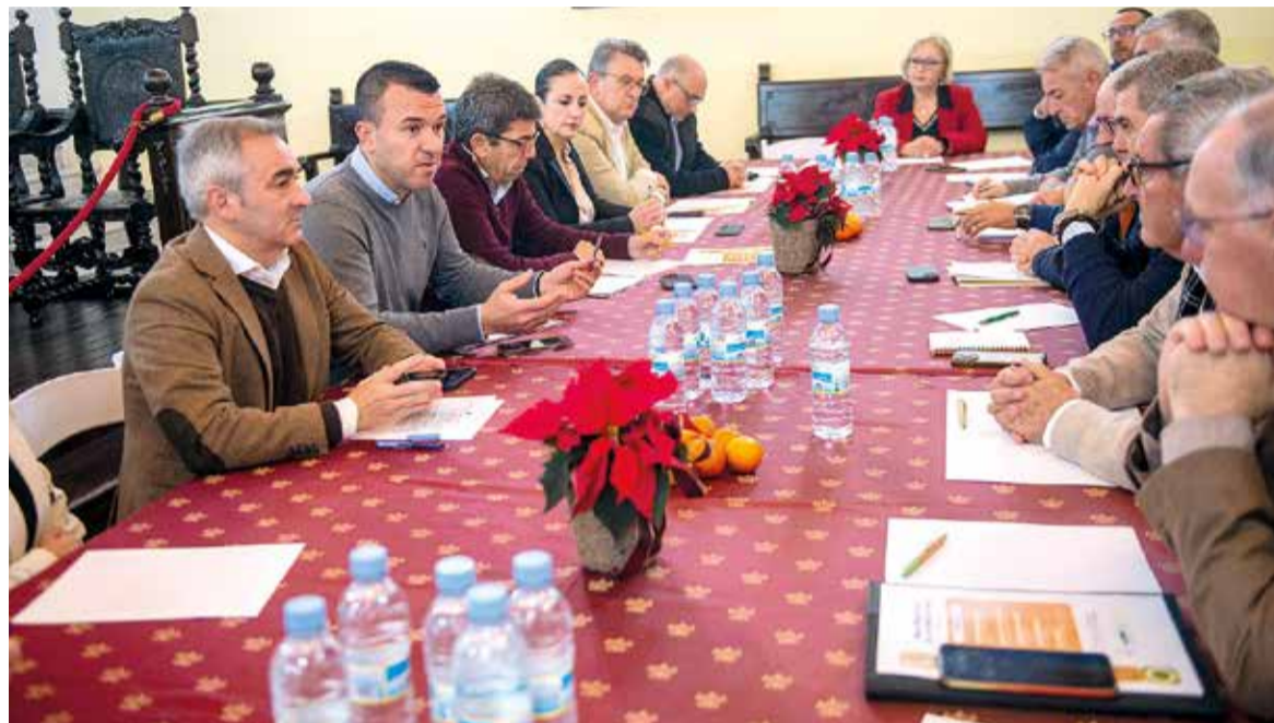
Taula de l'agricultura

LA UNIÓ DEMANA QUE L'AJUDA S'AMPLIE EN UN IMPORT EQUIVALENT ALS IMPOSTOS VINCULATS A L'ADQUISICIÓ DE VEHICLES