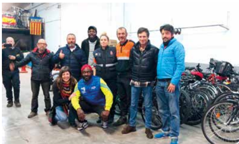
Partiparen 20 persones amb coneixements mecànics

A més de les bicicletes que es van reparar el dissabte, aquest dilluns han arribat a l'Horta Sud 200 bicis més des d'Euskadi, que han sigut aportades per Bizieskola, un projecte de Bilbao inspirat en Soterranya, amb la col·laboració de la Fundació Ciclista Euskadi. Ara,