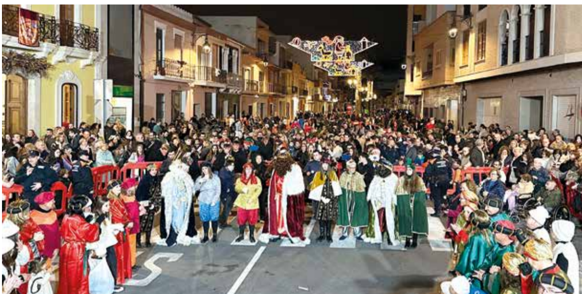
Nadal a Rafelbunyol