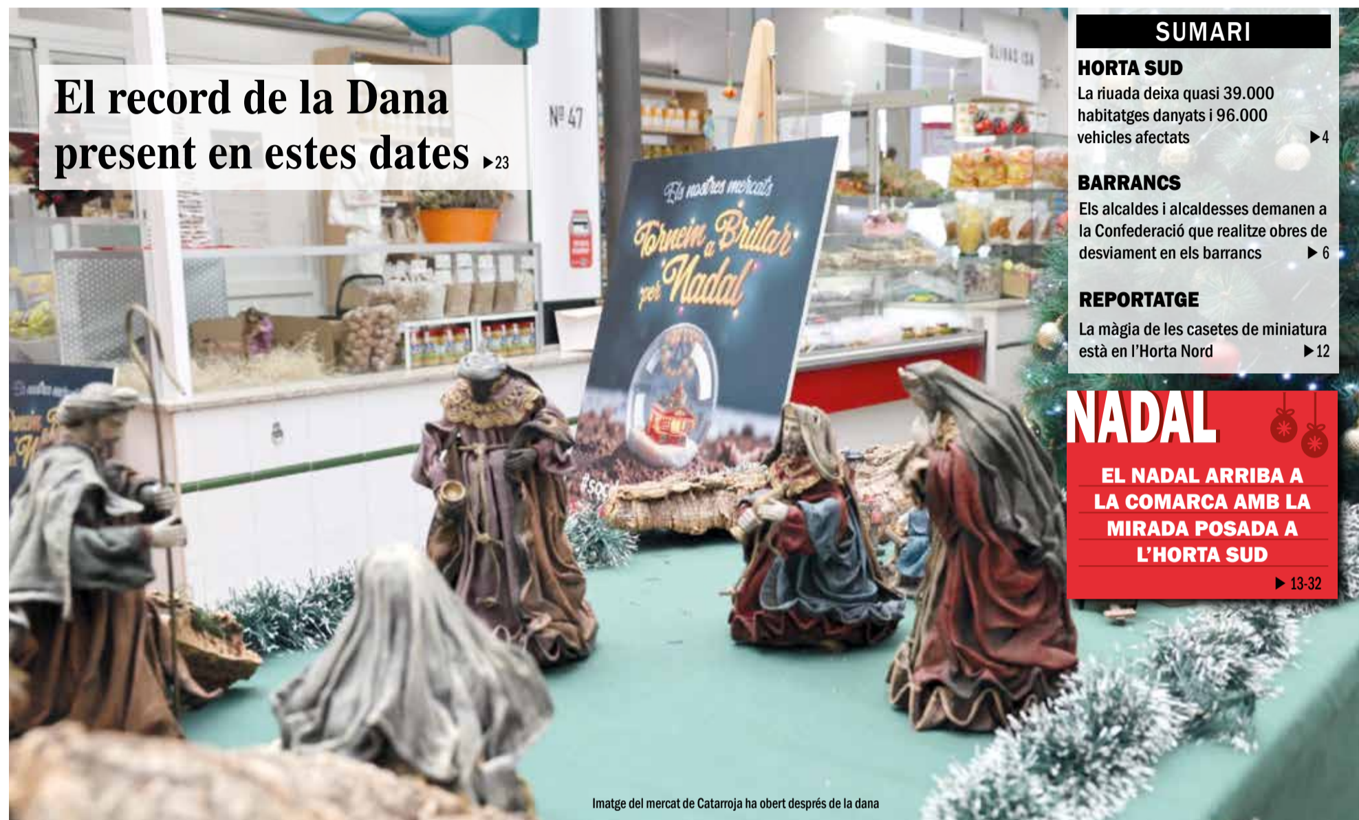
Imatge del mercat de Catarroja ha obert després de la dana

El record de la Dana present en estes dates ▶23