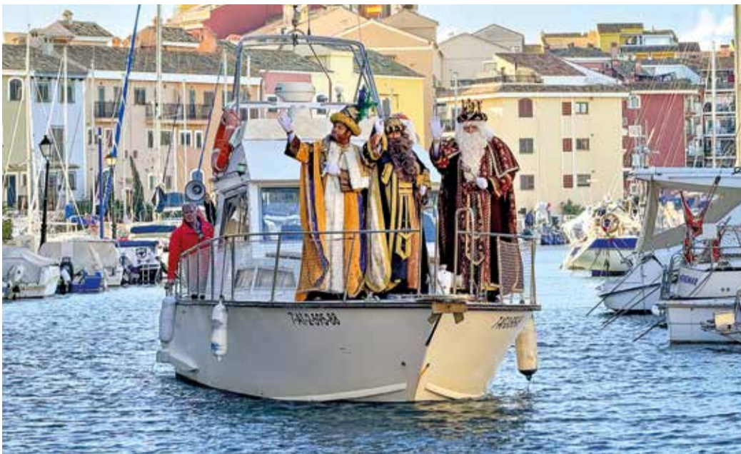
Els Reis Mags arriben amb vaixell a Port Saplaya