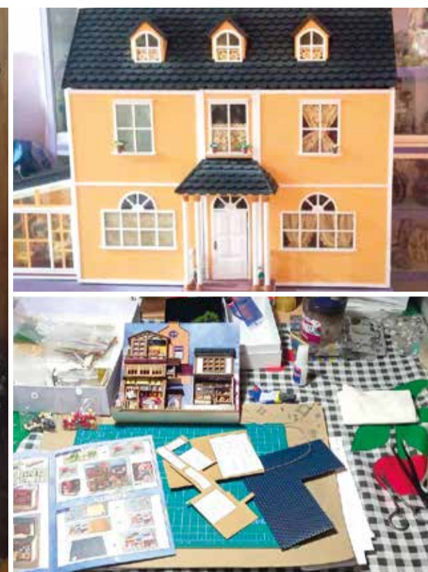
Procés d'elaboració de les cases i resultat final

Concha López és veïna de Museros, però la seua casa està molt prop d'Emperador. Viu com se sol dir entre dos "terres" i envoltada de més de 150 casetes, però són unes cases especials. Tan especials que estan elaborades amb les seues pròpies mans i amb el seu infinit carinyo, paciència i molt pols.