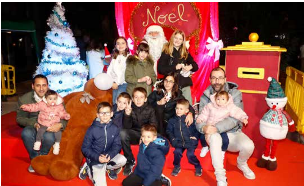
El Pare Noel va visitar Puçol, enguany tornarà