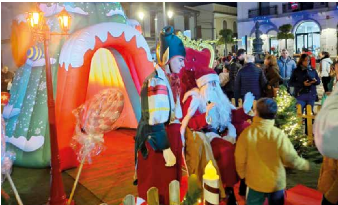
El Pare Noel a Quart de Poblet