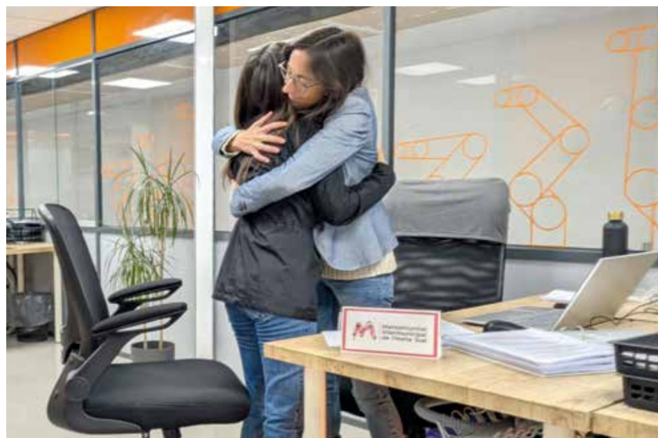
Una agent de proximitat abraça a una empresària del polígon de Catarroja