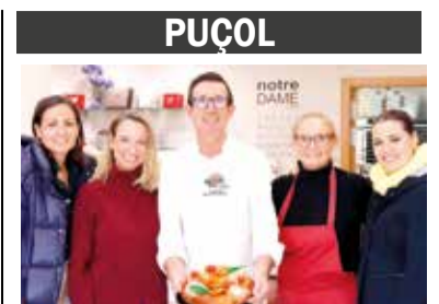
PUÇOL NOTRE DAME GUANYA EL CONCURS AUTONÒMIC DEL ROSCÓ DE REIS CLÀSSIC