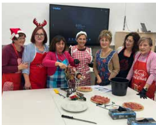
Taller de pernil