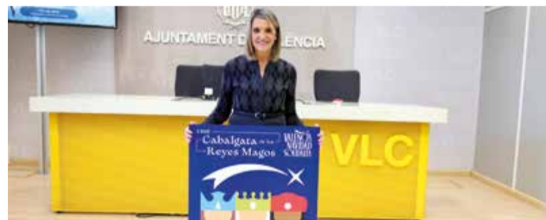
La regidora durant la presentació de la campanya

Per part seua, els qui visiten el Parc Central podran gaudir de 5.000 m 2 en els quals els Reis Mags han instal·lat un gran magatzem de 600 m 2 on es reben les cartes, es preparen els regals (inclòs el carbó), i on, a més, han deixat un missatge molt especial per a les xiquetes i els xiquets valencians. Això es complementa amb un carrusel d'animals, experiències sensorials, jocs, i activitats que po-