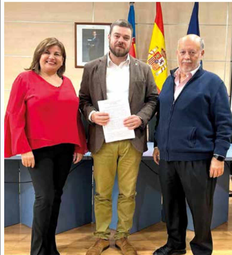
Les dues formacions gestionaran conjuntament el municipi fins a 2027

El pacte inclou principis de funcionament com la transparència, la rendició de comptes anual i la cerca del consens en la presa de decisions. La coordinació entre totes dues formacions s'aplicarà en totes les àrees municipals per a garantir el compliment dels objectius fixats.