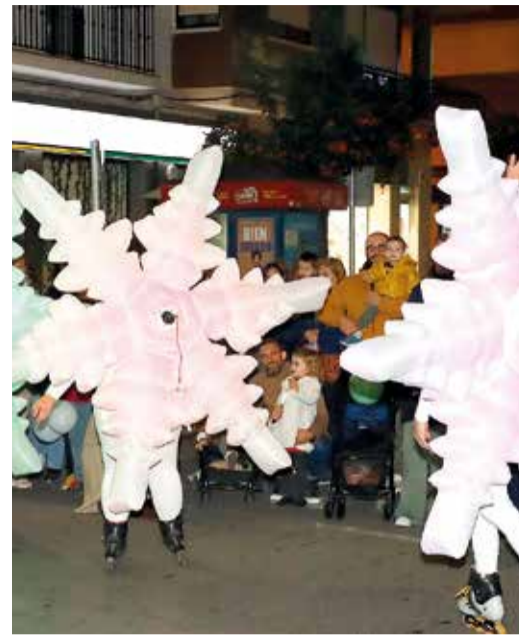
Cavalcada a Puçol