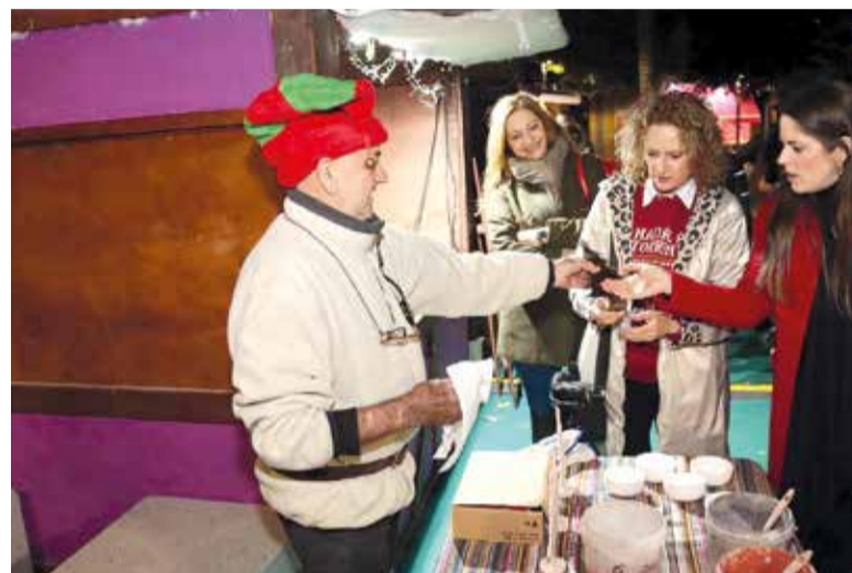
Alcaldeessa i regidora al mercat de Nadal