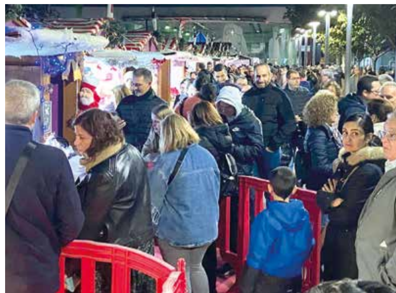
Mercat de Nadal a Torrent