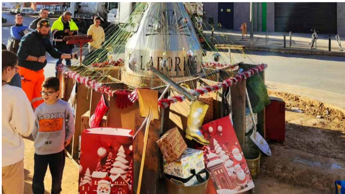
Imatge arbre Aldaia

HI HA PREVISTES ACTIVITATS FINS ALS 14 ANYS