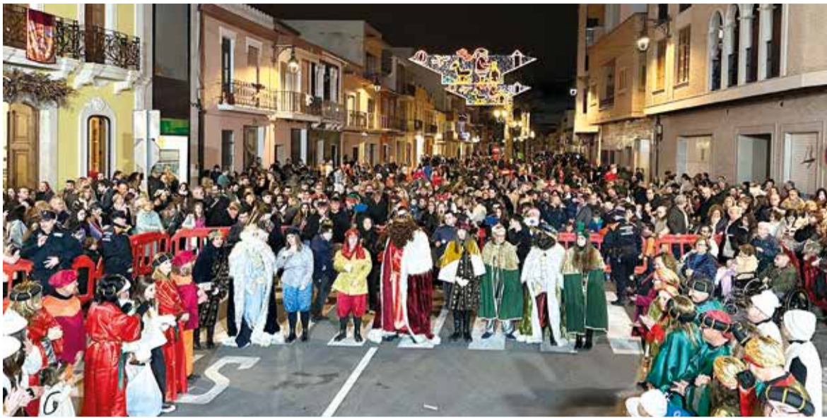
Nadal a Rafelbunyol