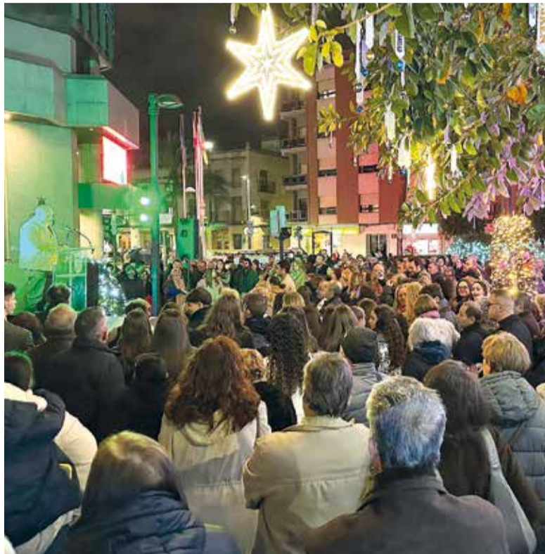
Encesa de l'arbre del voluntariat

La programació nadalenca de Torrent inclou activitats per a tots els públics, des de tallers i concerts fins a mercats i esdeveniments solidaris: Mercat Nadalenc: Del