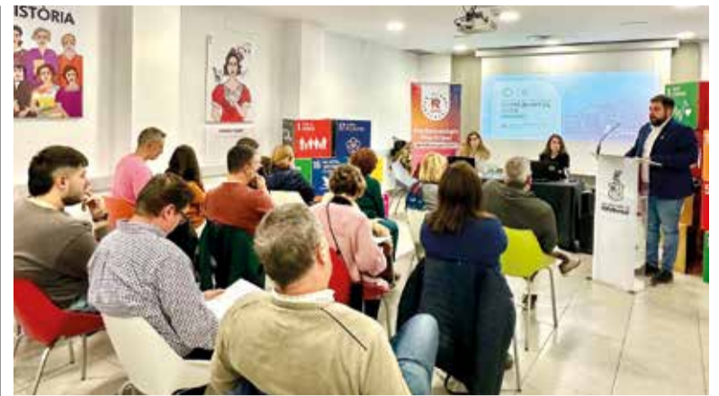
Reunió a Rafelbunyol

de 2024 i el 6 de gener de 2025, en algun domicili de la localitat. Es donaran un total de tres premis, sense dotació econòmica. El jurat visitarà els domicilis del 12 al 16 de desembre. També Massamagrell celebraenguany el seu XXVII Concurs Local de Pesebre. Podran participar tots aquells veïns i veïnes de Massamagrell que munten un Betlem en algun domicili de la localitat durant les festes de Nadal. Les persones guardonades es comprometen a exhibir, al públic en general, la composició guanyadora durant els dies i l'horari que es determine amb el titular del Betlem.