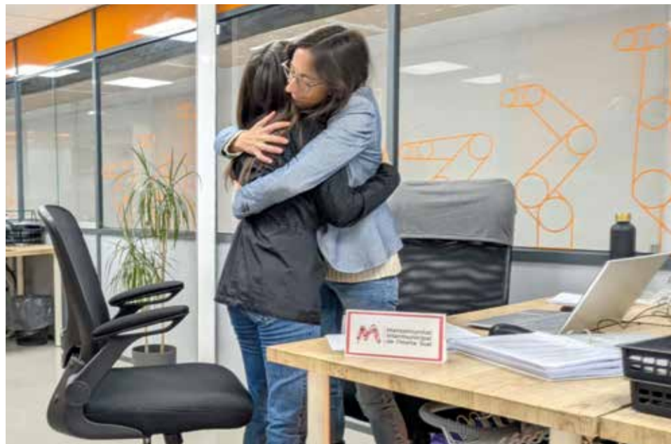
Una agent de proximitat abraça a una empresària del polígon de Catarroja