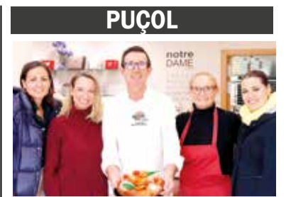
PUÇOL NOTRE DAME GUANYA EL CONCURS AUTONÒMIC DEL ROSCÓ DE REIS CLÀSSIC