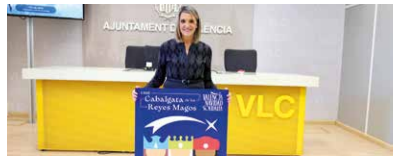
La regidora durant la presentació de la campanya

Per part seua, els qui visiten el Parc Central podran gaudir de 5.000 m 2 en els quals els Reis Mags han instal·lat un gran magatzem de 600 m 2 on es reben les cartes, es preparen els regals (inclòs el carbó), i on, a més, han deixat un missatge molt especial per a les xiquetes i els xiquets valencians. Això es complementa amb un carrusel d'animals, experiències sensorials, jocs, i activitats que po-