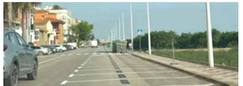
Avinguda Blasco Ibáñez a Albuixech