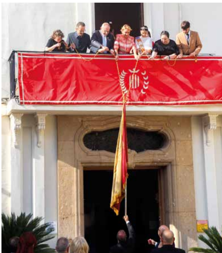
Baixada de la bandera de Benetússer des del balcó de l'Ajuntament