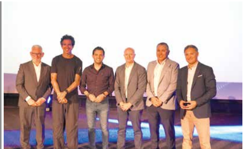
Acte empresarial a Paterna