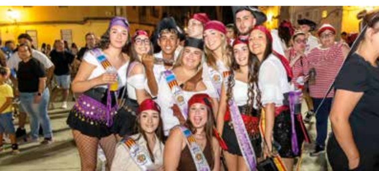
Espectacular inici de les festes de Moros i Cristians 2025