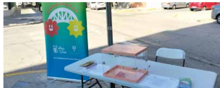
Prop de 500 persones han participat

En el nucli urbà, el projecte més votat ha sigut "El pati que volem", amb un total de 1.174 punts. Aquesta iniciativa, proposada pel Consell de la Infància i Adolescència Municipal (CIAM) i sorgida de tallers participatius realitzats al CEIP Cervantes, té com a objectiu transformar el pati escolar en un espai