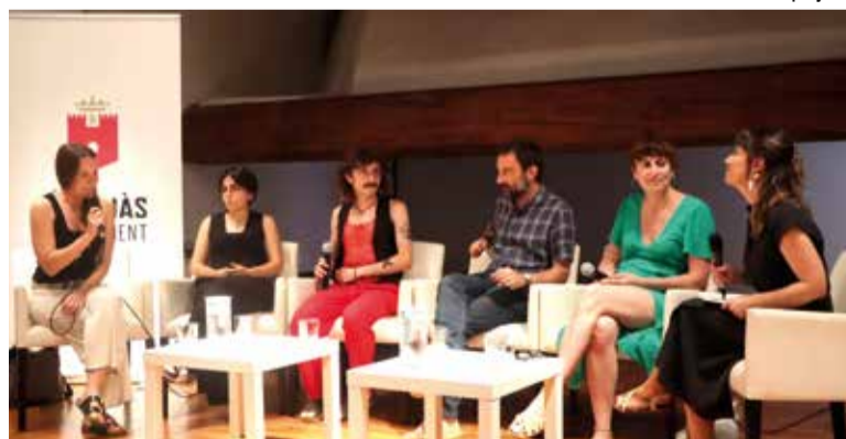
L'acte va tindre lloc a La sala Xemeneia del Castell