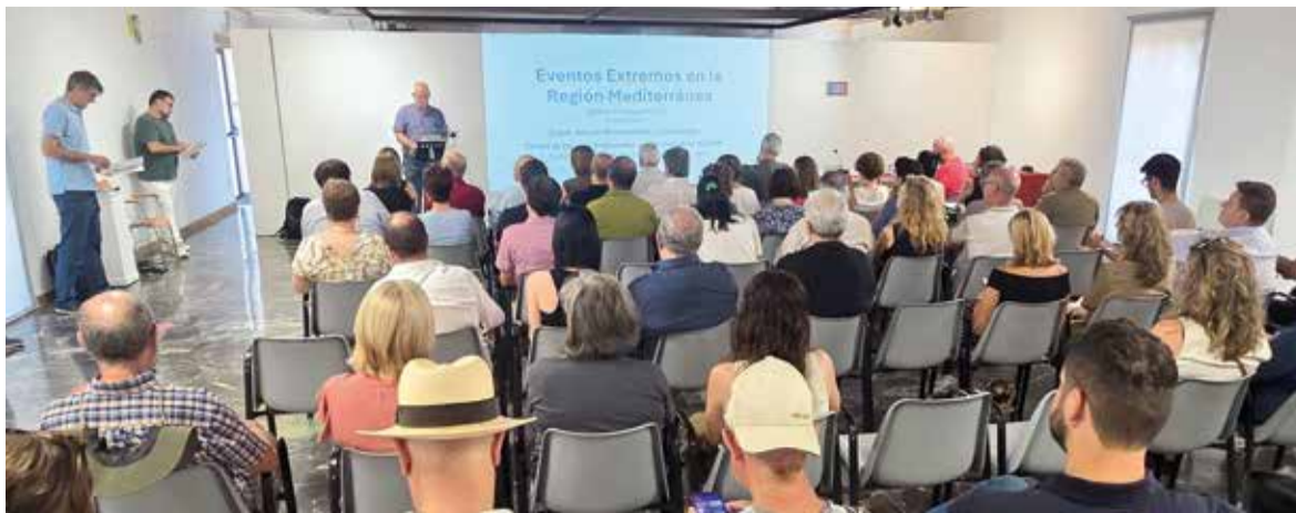
Acte a Paiporta