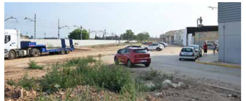
Nou espai per a la remodelació integral

La jornada a Paiporta es va dividir en tres blocs fundamentals: el primer ha analitzat els aspectes naturals i científics de l'episodi del 29 d'octubre; el segon ha presentat solucions urbanes i estratègies d'adaptació en entorns urbans; i el tercer ha aprofundit en les solucions basades en la natura, com la restauració de rius i repoblacions forestals, que permeten una gestió més sostenible i eficaç del territori.