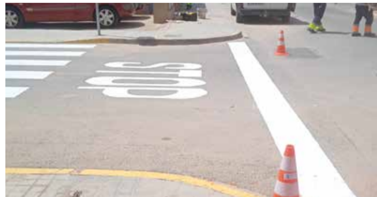
Obres als carrers