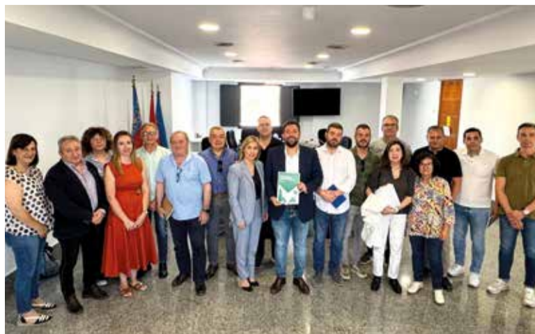
Alcaldesses, alcaldes i regidors de l'Horta Nord a la Mancomunitat

ELS COMPTES CONSOLIDEN LA GESTIÓ DIRECTA DEL SERVICI DE RESIDUS I POSEN EL FOCUS EN ELS SERVICIS SOCIALS