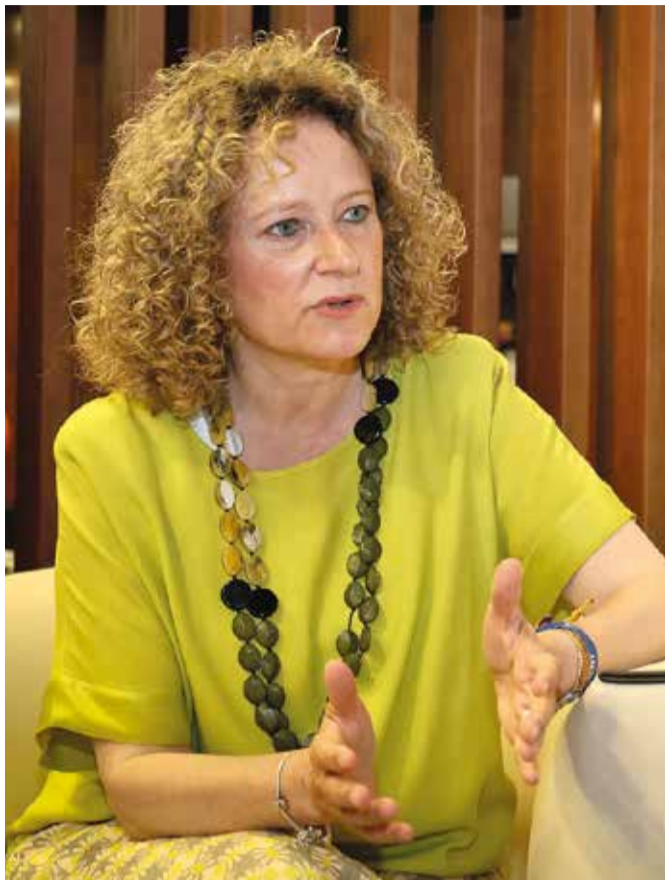
Amparo Folgado, alcaldessa de Torrent