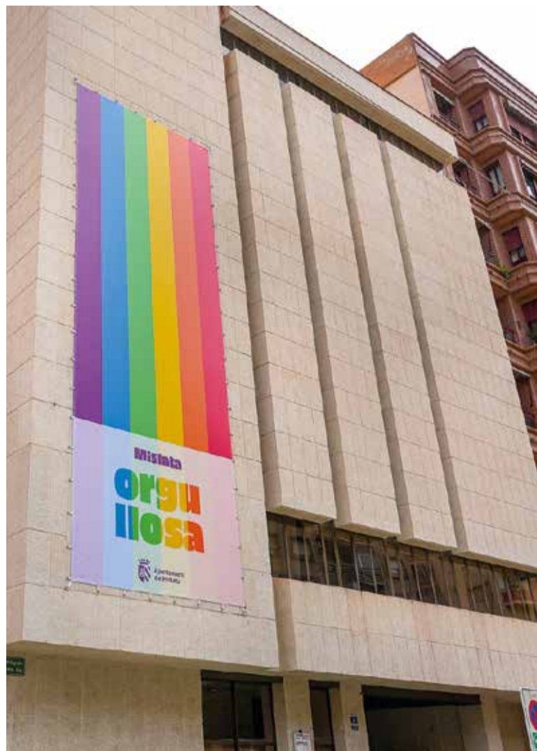
Façana del centre cultural Carmen Alborch de Mislata