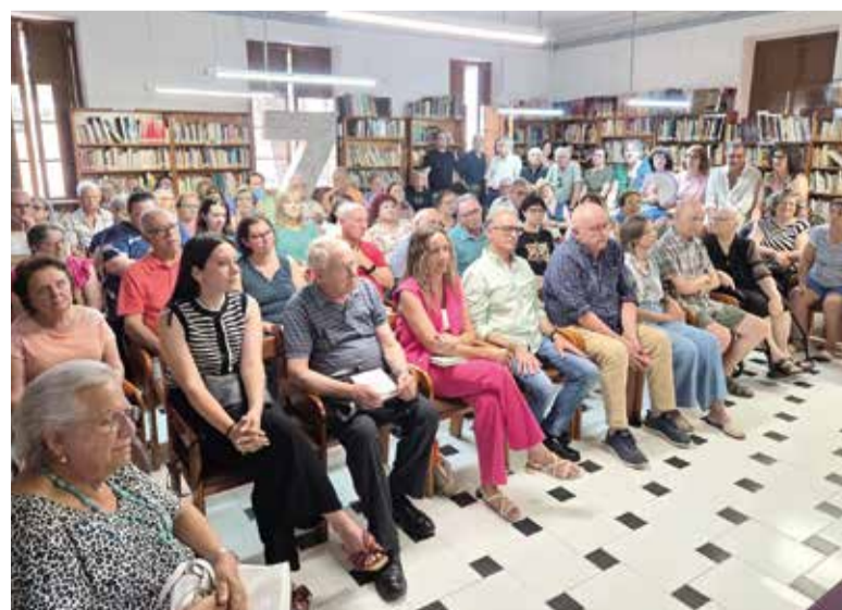
Nombrosos veïns van acudir a la biblioteca de Museros per a conèixer més sobre el seu il·lustre veí