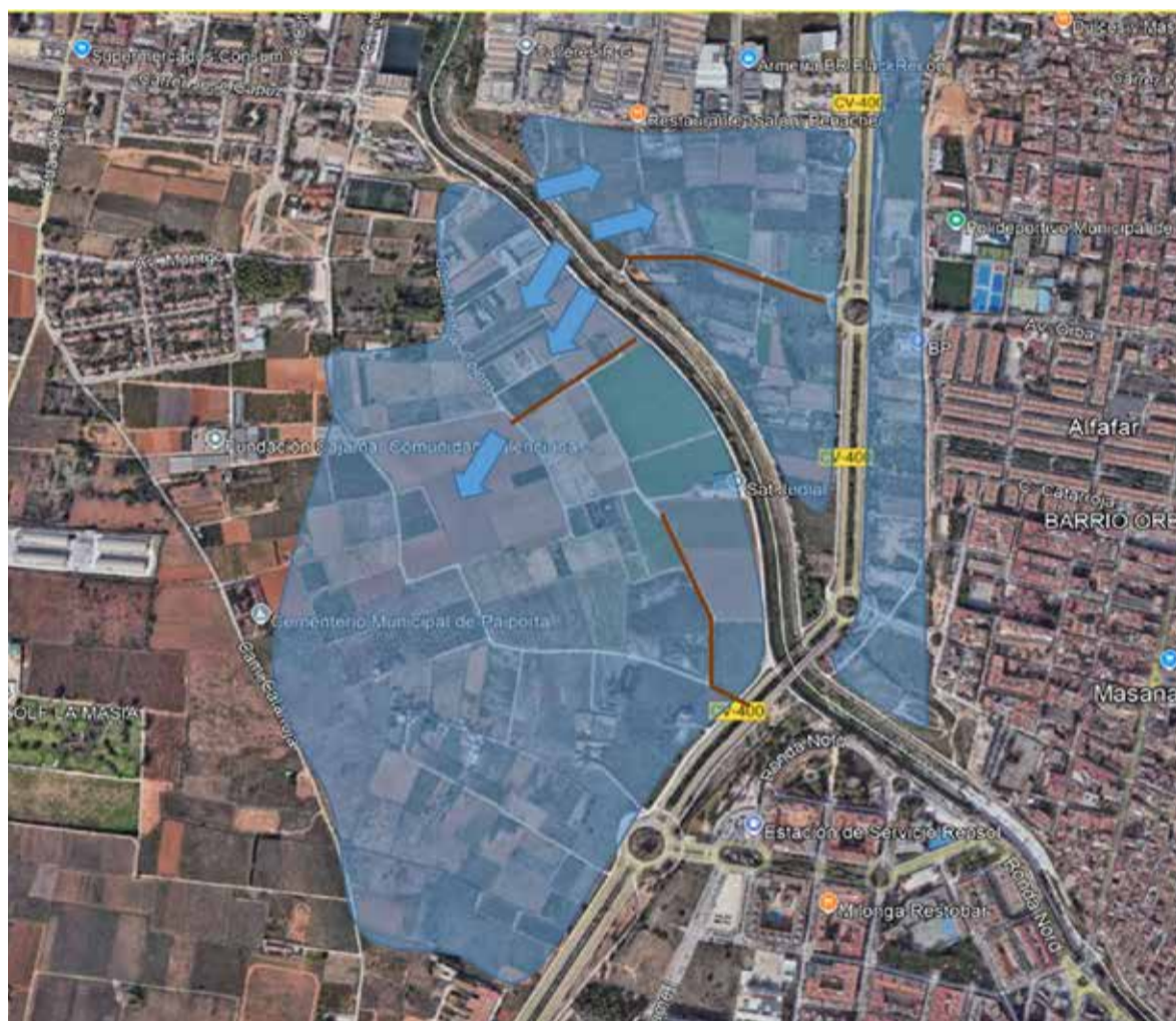
Zona de depòsit d'aigua proposada en els termes municipals de Catarroja, Paiorta, Massanassa i Alfafar (MITECO).

en el punt de mira del Govern, que planeja convertir-los en una zona de retenció o contenció d'aigua provinent dels desbordaments del