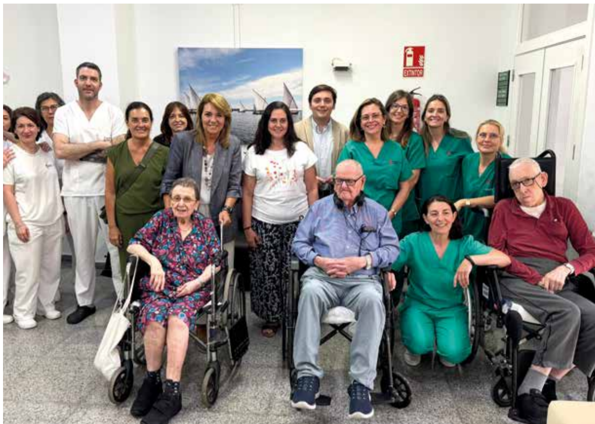
La consellera va visitar el centre d'Aldaia