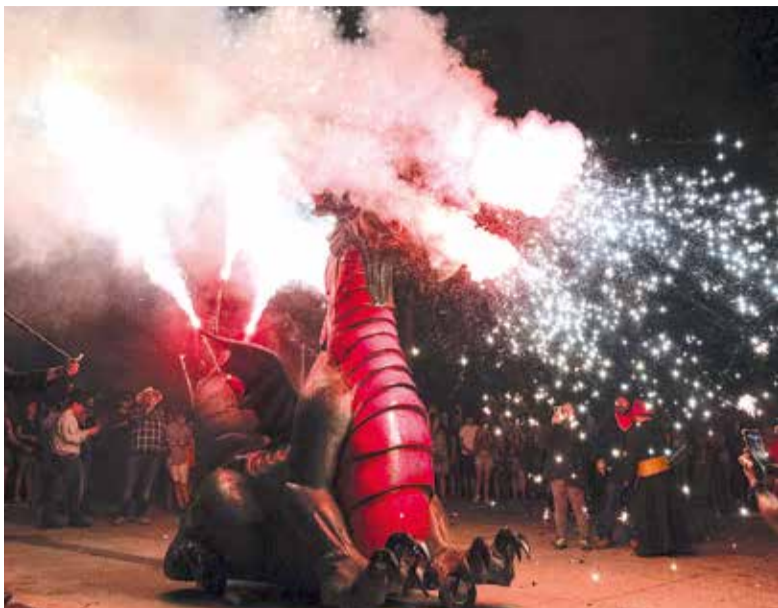
Correfocs a Alboraiia