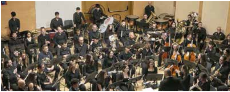
Societat Musical Eslava d'Albuixech.