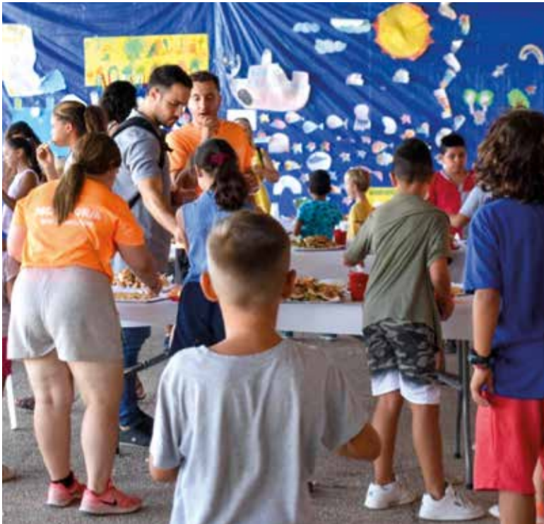
Activitats de l'any passat