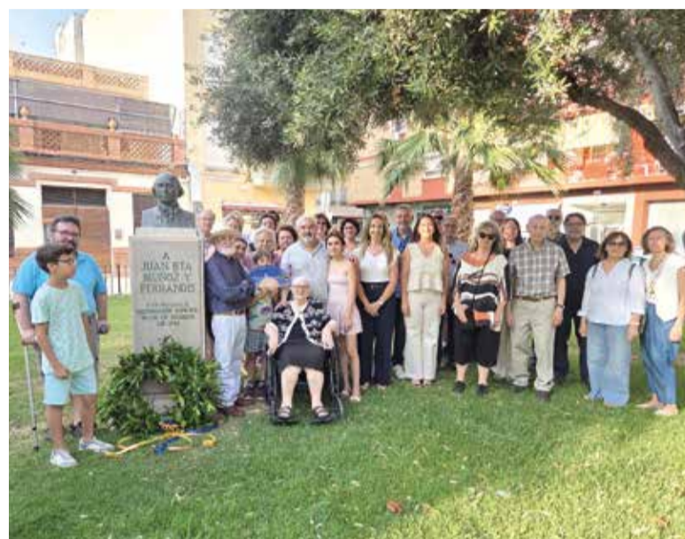
També descendents de Juan Bautista Muñoz van assistir a l'homenatge