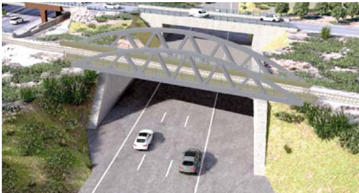
Obres a la A-7