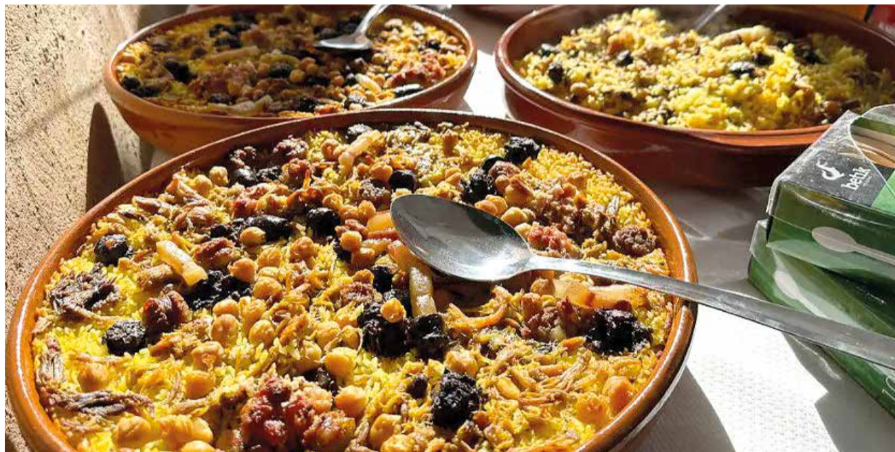
Rossejat de Torrent

Arròs amb Perol amb ànec és una recepta típica de Silla. Un plat que té el seu ingredient principal, amb permís de l'arròs, en l'ànec, criat en l'Albufera. Un guisat que servix per a temperar el cos en els mesos més freds de l'any, encara que qualsevol estació és bona per a menjar-ho. Un arròs que porta a més d'ànec; espinacs, nap, moniato, fesols, peus de porc i botifarra.