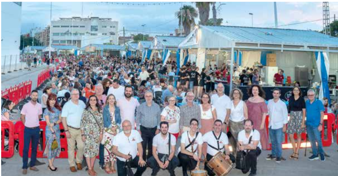
Alcalde d'Alboraiia junt a regidors en les festes de la població l'any passat