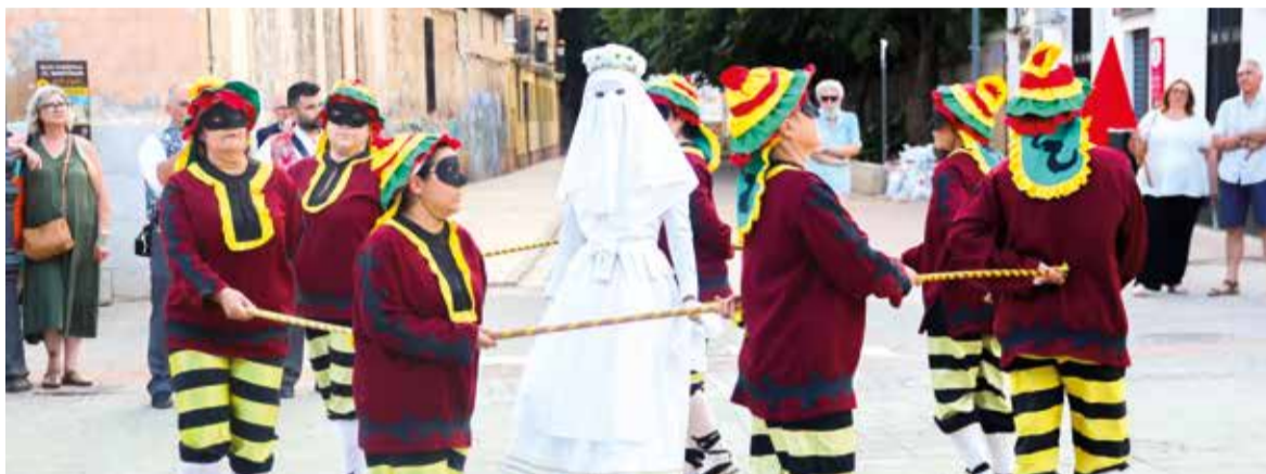
Danses del Corpus en la plaça Cardenal Benlloch