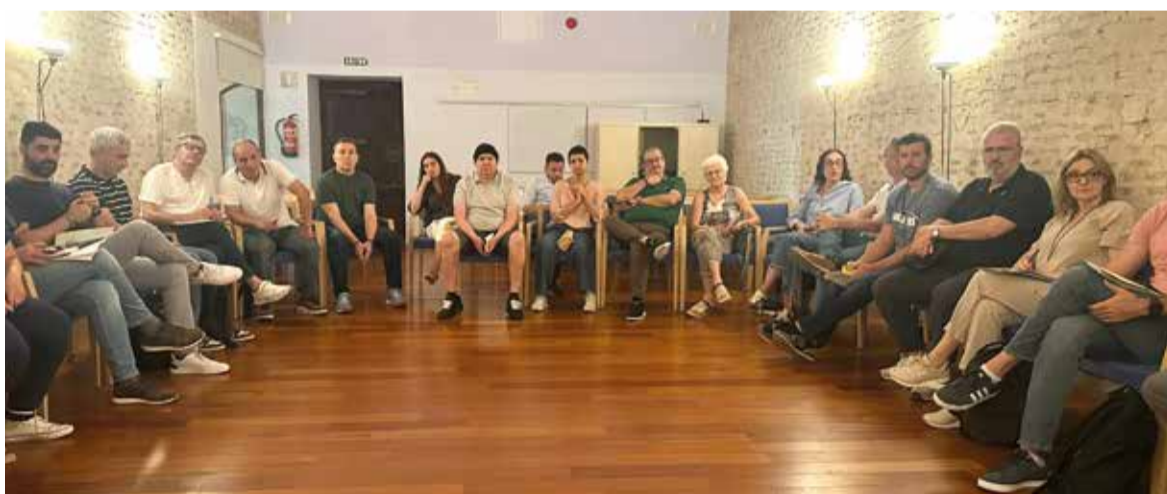
Reunió a Alaquàs

Després de la trobada, l'alcalde d'Aldaia s'ha compromès a aprovar en el ple municipal l'esmena de determinades qüestions en diversos informes sectorials, com a pas previ per a procedir a l'enviament de l'expedient a la Comissió Territorial d'Urbanisme. Després, el procés finalitzarà amb l'aprovació d'este per part de la Generalitat.