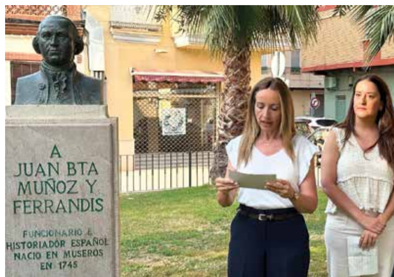
L'alcaldessa de Museros al costat de la regidora de Cultura, durant l'acte d'homenatge

Va morir als 55 anys i la seua figura va ser clau per a conèixer la història d'Amèrica. La Biblioteca Pública de Nova York compta amb un extens fons sobre Juan Bautista Muñoz la seua obra i els seus manuscrits que van eixir a subhasta i van ser adquirits per la biblioteca de Nova York, on ara es poden consultar.