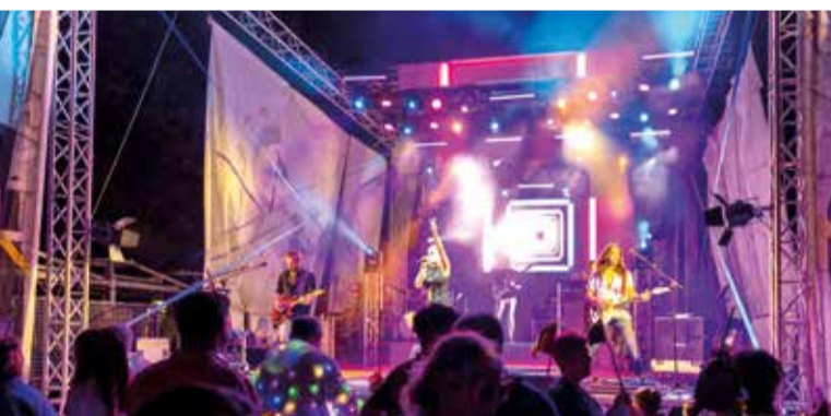
Concert de festes