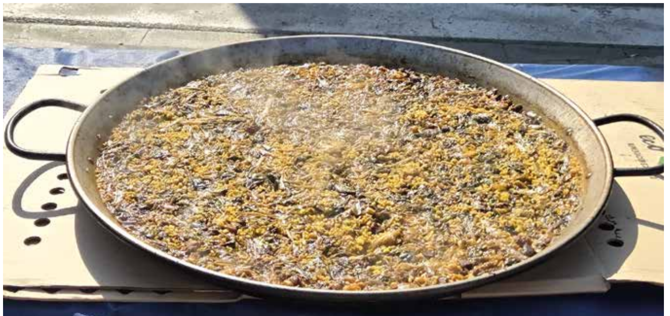
Paella de fetge de bou

No sols la tradicional paella valenciana s'elabora a la comarca, que també, es preparen altres deliciosos plats