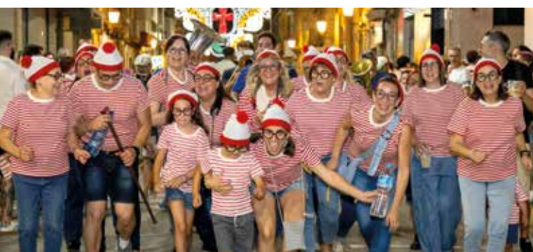
Molta participació en l'inici de les festes de Moros i Cristians 2025