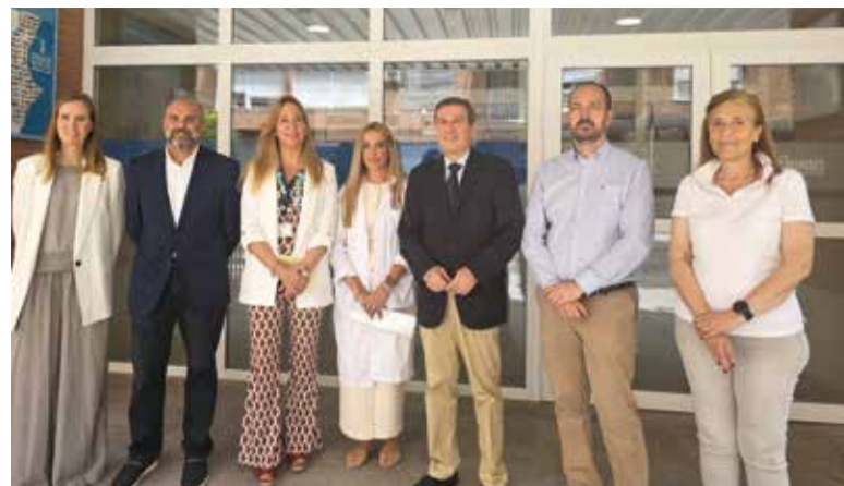
Conseller de Sanitat, alcalde i regidores en el centre de salut

El pressupost total per a infraestructures d'emergència derivades de la riuada en 2025 ascendeix a diverses desenes de milions d'euros, en un esforç coordinat per a restaurar i reforçar la xarxa de servicis socials en tota la Comunitat.