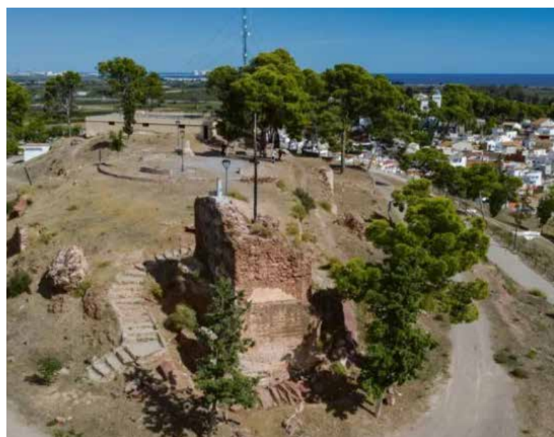
Castell del Puig