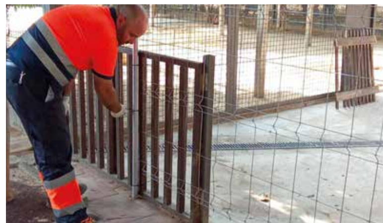
Renovació de materials

Des de l'Ajuntament s'agraïx l'esforç diari de la brigada i es fa una crida a la ciutadania per a col·laborar en la cura de l'entorn urbà.