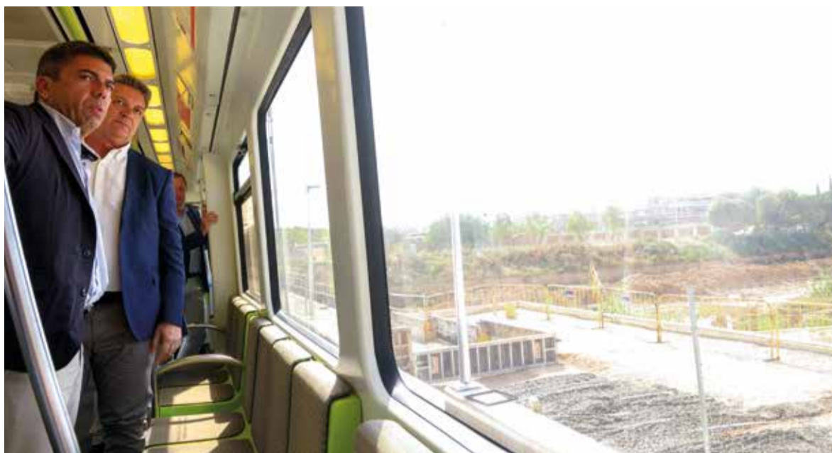
Mazón va visitar l'estació de Torrent i Paiporta