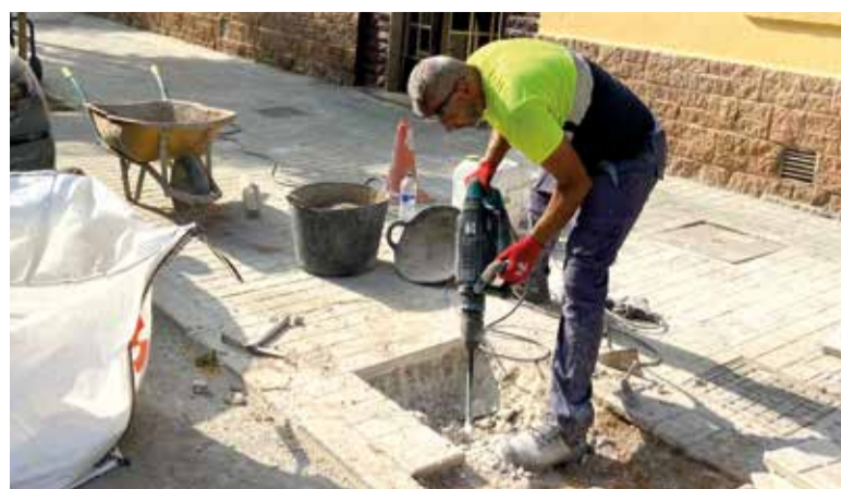
Obres als carrers d'Alfafar

Aquests pressupostos han sigut aprovats amb el vot a favor del Partit Popular, el vot en contra de PSOE i Compromís i l'abstenció de VOX.