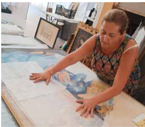
Preparació de material