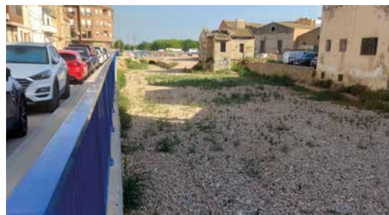
Estat actual del tram del barranc de la Font de la Rambleta al costat del carrer Pelayo (T. L.).

barranc destinades, segons es diu textualment en l'informe de l'Ajuntament, a "retornar el nivell del fons del barranc a la seua situació natural", està la "d'adequar l'eixida natural de l'aigua, gràcies a un estudi topogràfic, per a portar a nivell el sòl", per a això s'ha procedit a "l'ompliment de terres per a portar el llit al seu nivell des de l'interior del calaix de pluvials al pont entre Catarroja i Albal". I, a més, s'han cobert estes terres "amb una capa de 'machaca' -pedres o cudols- de 10 cm", segons es diu, "amb la finalitat d'evitar humitat". Per tant, i com és evident, s'ha pujat el nivell del fons del barranc, la qual cosa no casa amb "retornar el nivell del llit a la seua situació natural" ni amb el plantejament d'augmentar la capacitat d'este. El nivell 'natural' del fons del barranc estava abans més baix, com es pot comprovar en fotografies anteriors. En este sentit, crida l'atenció com, en el mateix informe, es remarca que "en cap cas s'ha enterrat el ba-