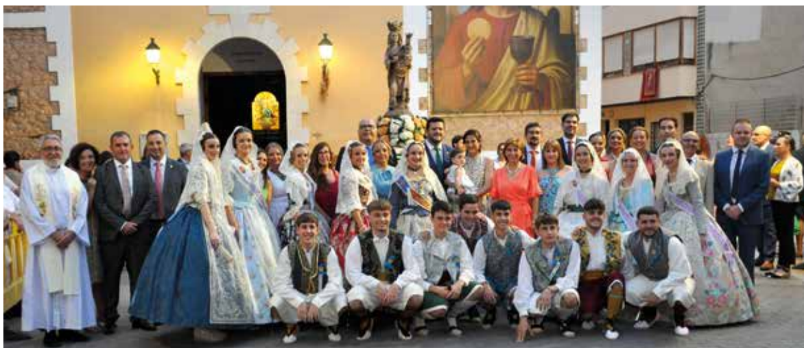
Ofrena en Albal