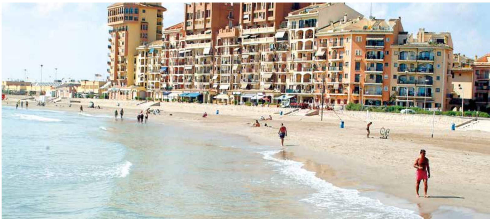
La platja de Port Saplaya a Alboraya ha estat setmanes tancada al bany