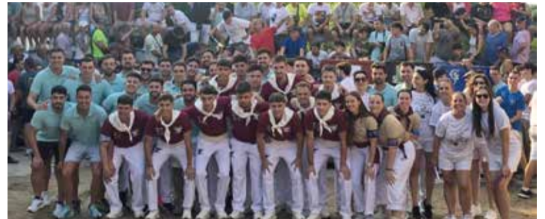
Dia del bou