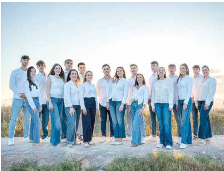
Festers i festeres 2025