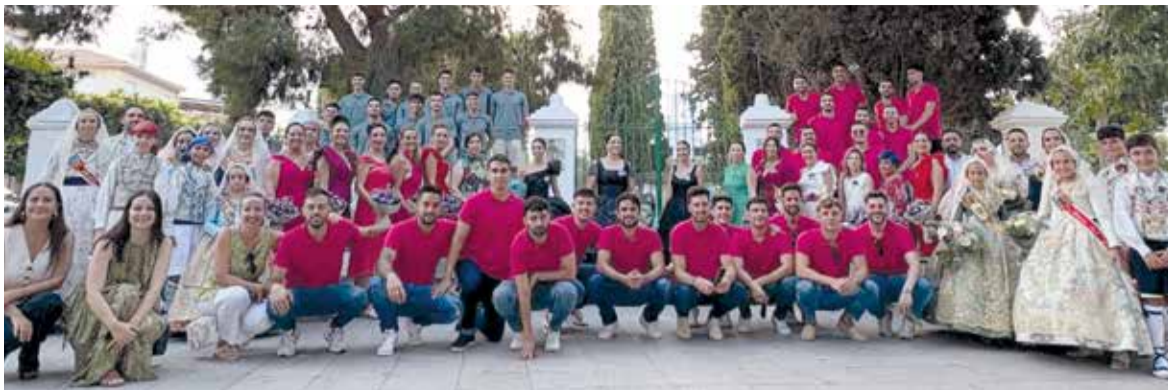
Ofrena de flors a Museros