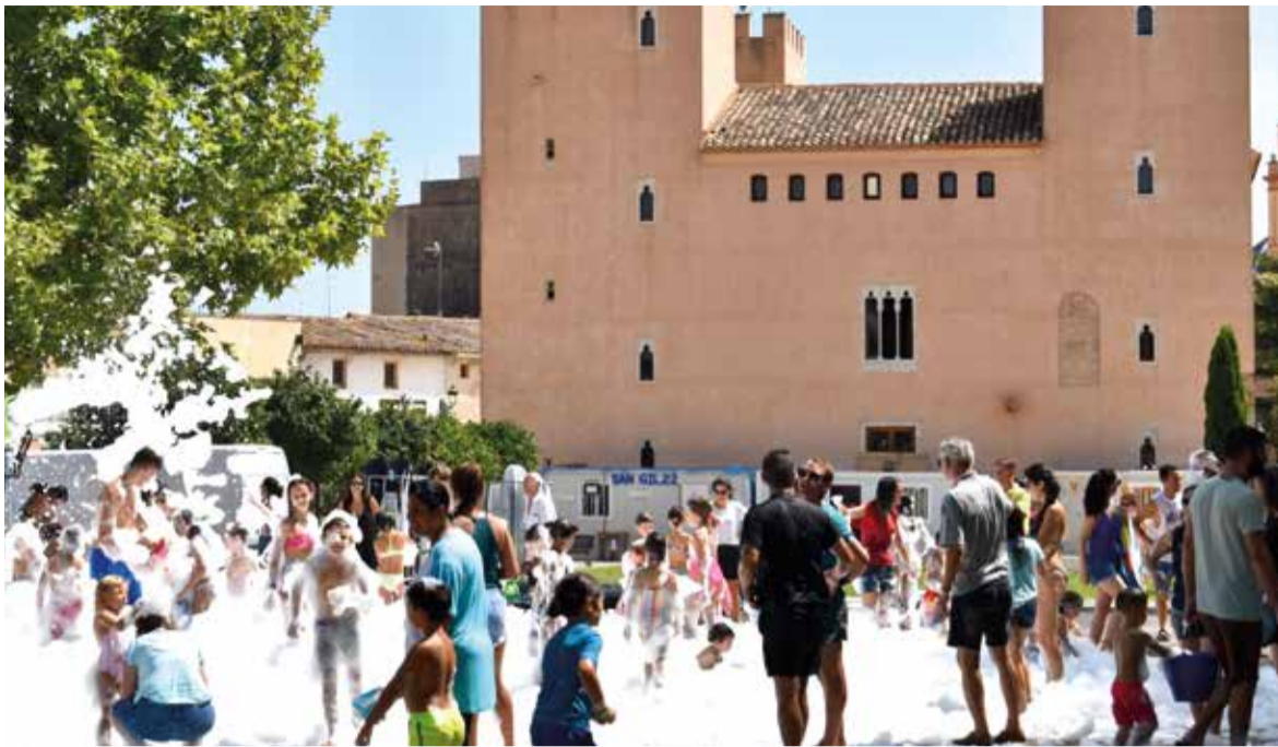
Imatge d'arxiu de les festes d'Albalat dels Sorells