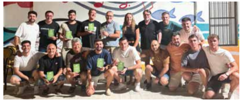
Campionat de Truc de Museros