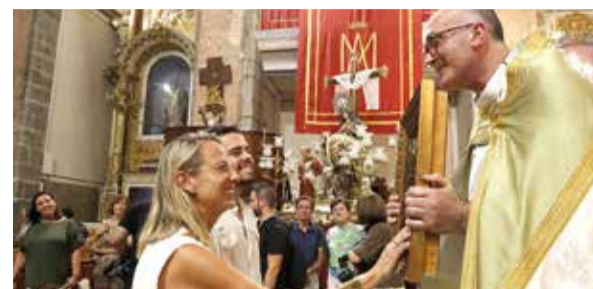
Entrà de la Murta de l'any passat