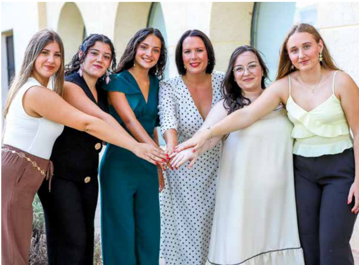
L'alcaldeessa junt a les festeres d'enguay