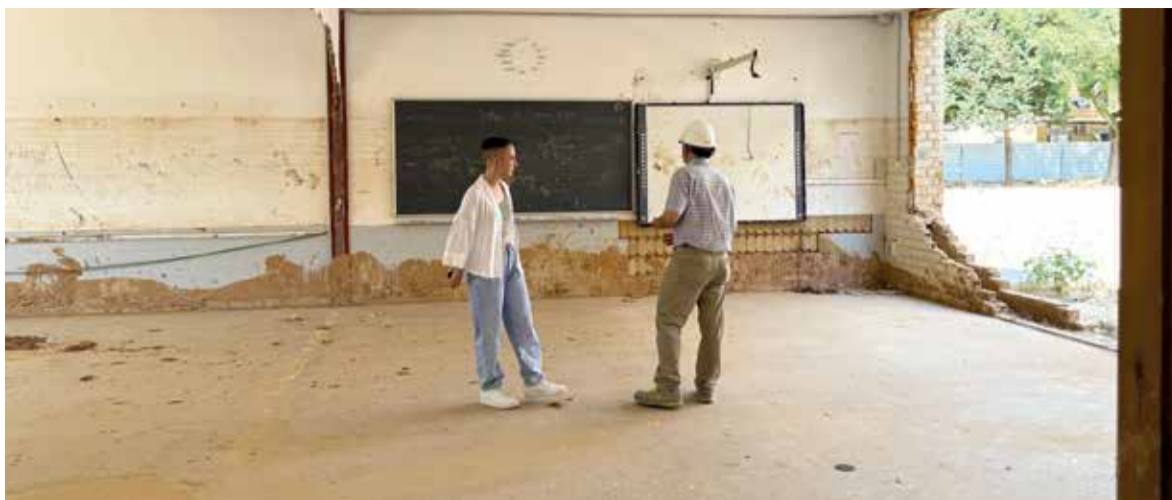
Estat actual de l'edifici