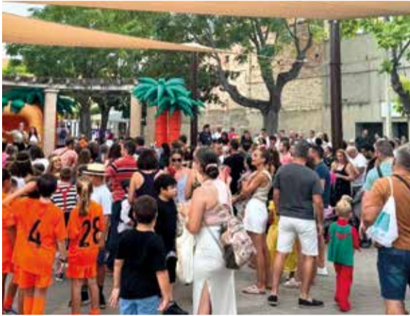
La cavalcada de disfresses infantil