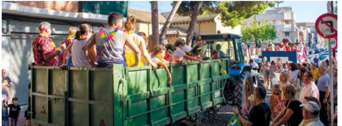
Cavalcada durant les festes de l'any passat