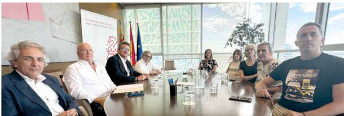
Reunió en la Generalitat amb associacions afectades

En l'informe, al forat d'eixida que es troba al final del carrer Pelayo, en direcció al camí de les Eres, es diu "arc que dona eixida a l'aigua que puga rebre el barranc", encara que més prompte sembla l'ull d'un pont sobre el barranc que, segurament, ha resultat tapat amb el pas dels anys pel camí que porta al túnel de les Barraques o de Joan XXIII, paregut al que va passar amb el pont del Camí Real entre Catarroja i Albal, els ulls del qual estan tapats des de fa molts anys, igual que el tram del barranc que hi havia a l'altre costat del pont, cap a l'avinguda Rambleta, que va resultar al final enterrat i substituït per una simple tuberia de desaigüe.