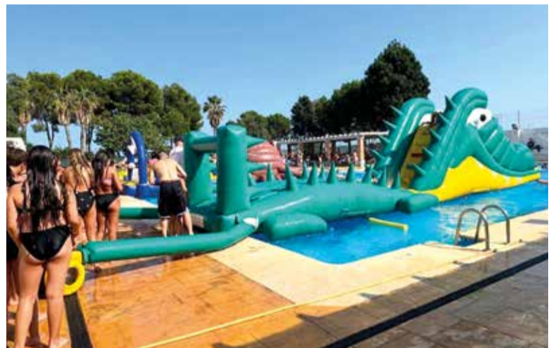
Dia dels Xiquets i de les Xiquetes de les festes de Museros