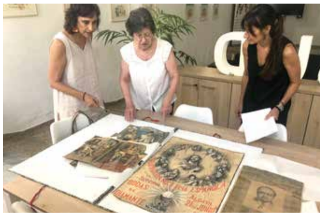
Una família d'Aldaia aporta obra gràfica de la col·lecció de son pare

Una dada important és que més de la meitat del comerç ja havia reobert al maig en els tres municipis, però en situacions molt desiguals, des d'aquells que han escomés una profunda modernització fins als qui han hagut de tornar a l'activitat amb una reforma precària. I és que la inversió no ha estat tant en funció del cobrament del consorci d'assegurances (que arriba molt lentament) o les ajudes rebudes sinó del capital disponible de cada comerciant.