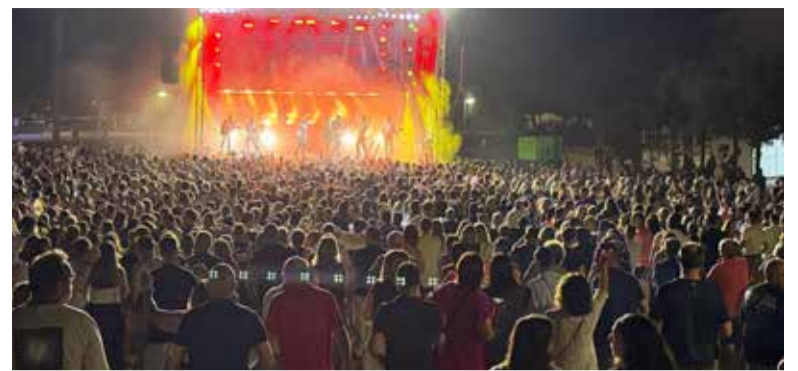
Actuació de l'orquestra Montecarlo

El dissabte 26 es va oficiar la missa en honor a Santa Ana en l'ermita. A