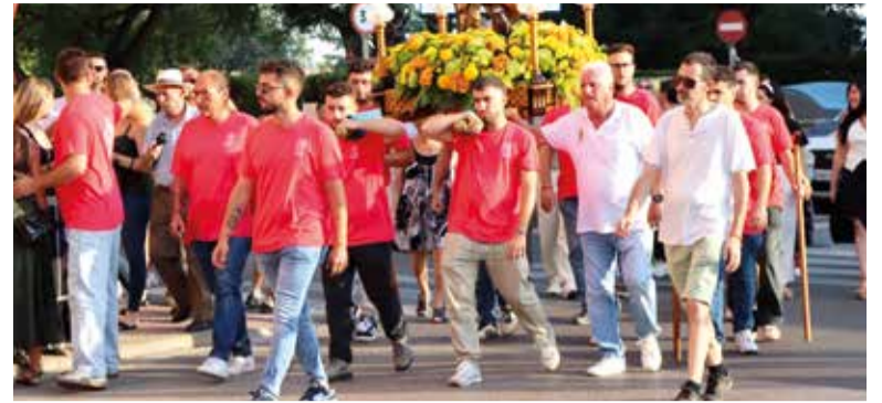
Processó pels carrers de la població