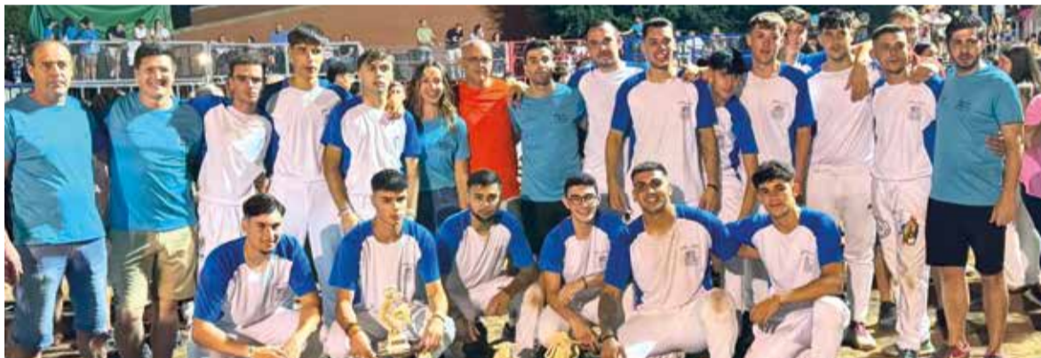
XXV Setmana Taurina de Museros

Les festes de Museros també van comptar amb actuacions musicals, campionats esportius i la seua tradicional setmana taurina.