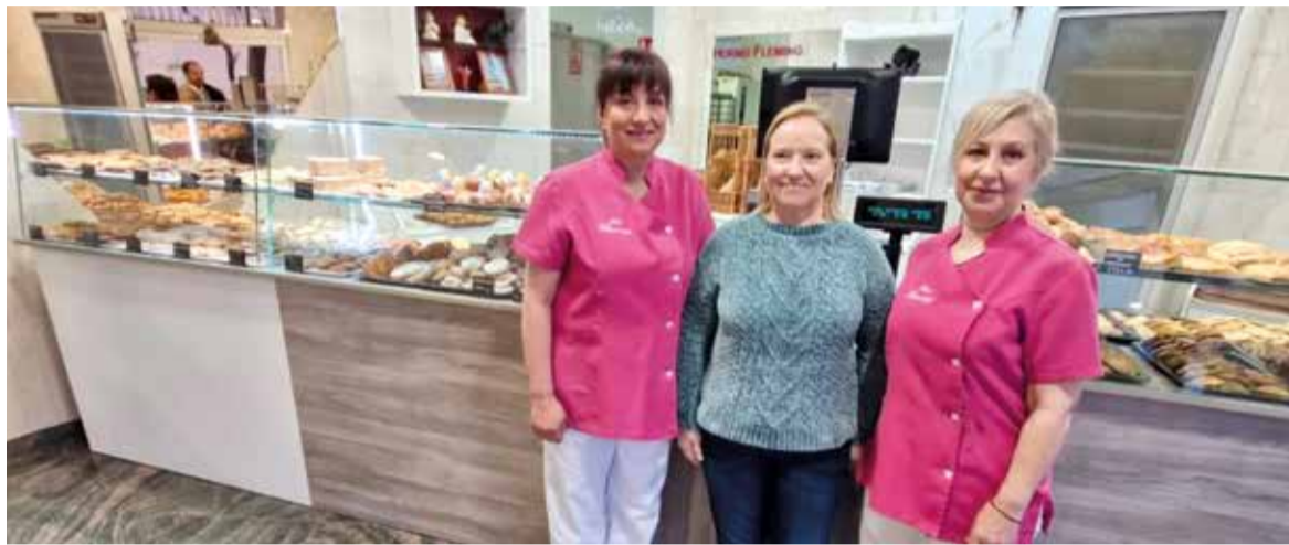
Comerç de Catarroja que es va veure afectat per la Dana i està de nou obert

EL PRIMER ESBORRANY ASSENYALA LES DESIGUALTATS AMB LES QUALS AFRONTEN EL FUTUR IMMEDIAT ELS NEGOCIS DE LA COMARCA