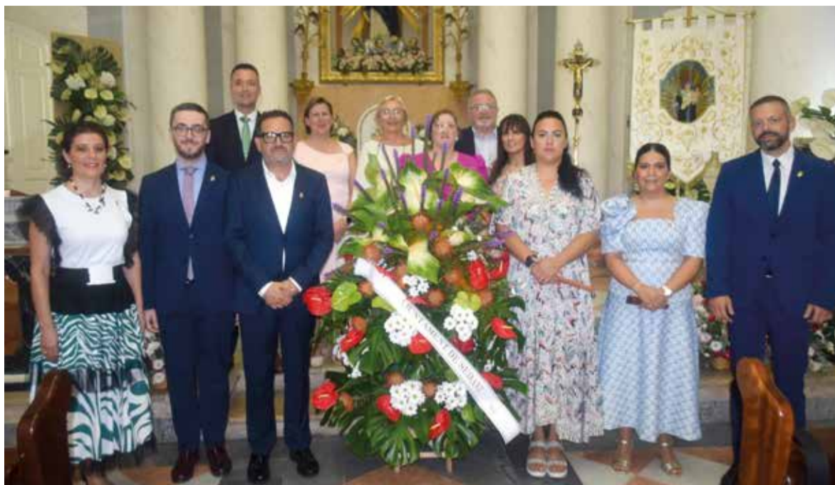
Ofrena de l'any passat