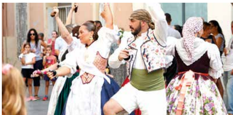
'Dansà' en l'Entrada de la Murta