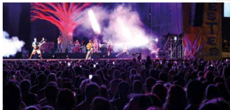
Concert en el recinte firal