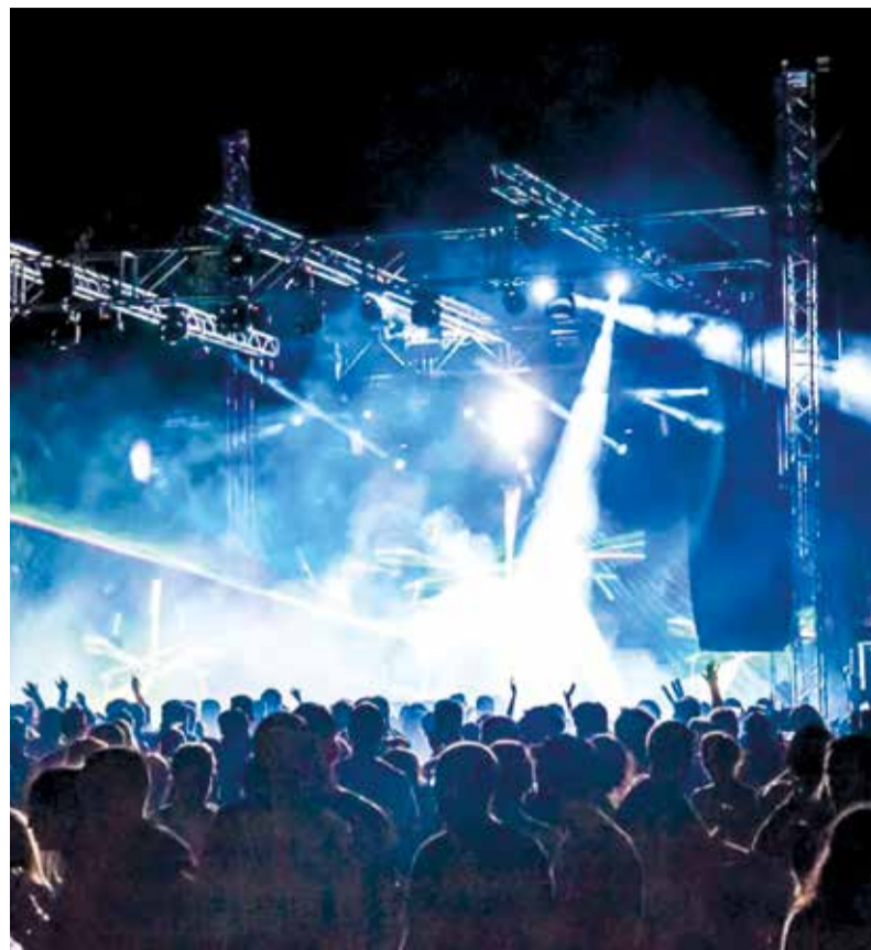
Nit de concert a Moncada