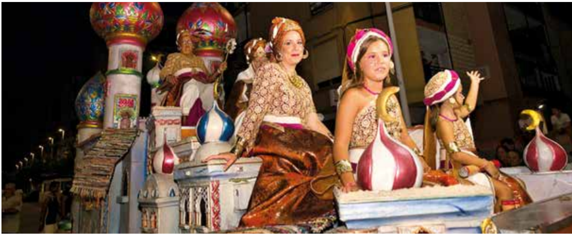
Nit de disfresses, imatge de l'any passat.