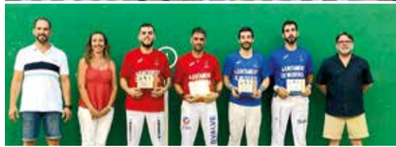
Campionat de galotxa i frontó