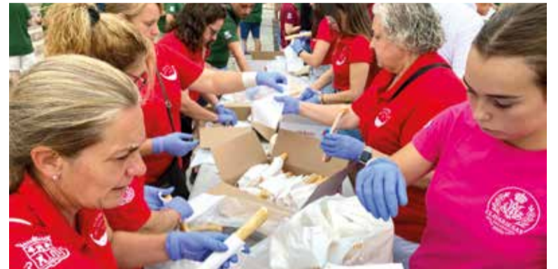
Repartiment d'orxata i fartons