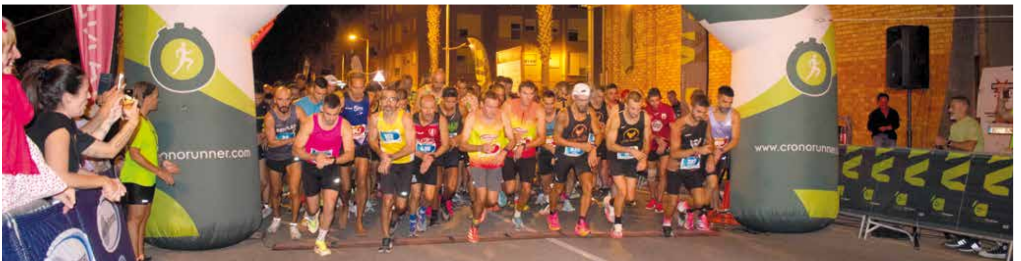
15K Nocturna Alfafar

A més el 17 de setembre conclouran les festes amb la Missa del Lledoner i trasllat de les imatges de Sant Sebastià i de la Verge del Do fins a la Casa de la Verge, passant pel carrer Maestro Barrachina, acompanyats de danses valencianes, tabal i dolçaina.