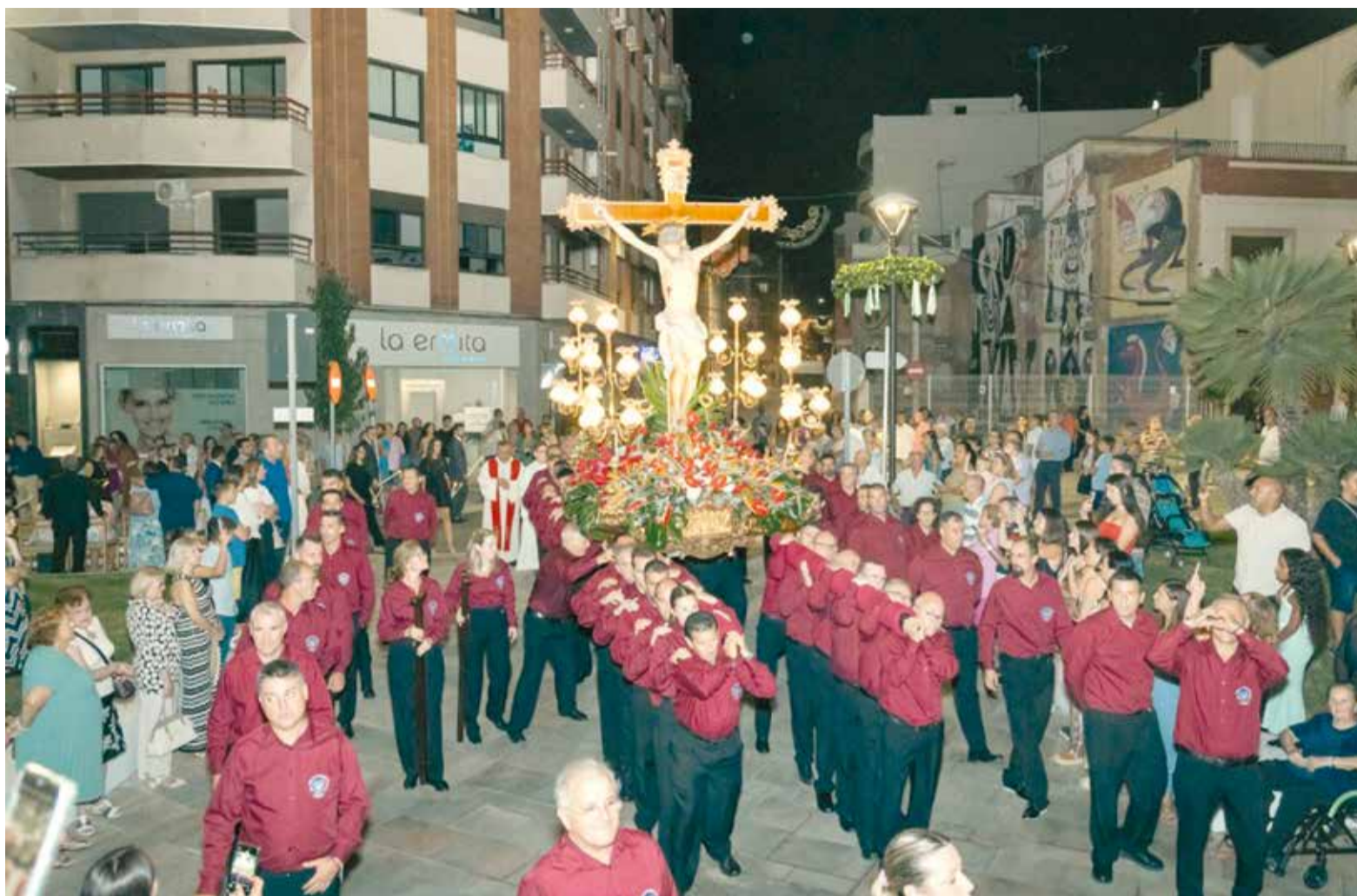
Gran devoció a les festes de Picassent