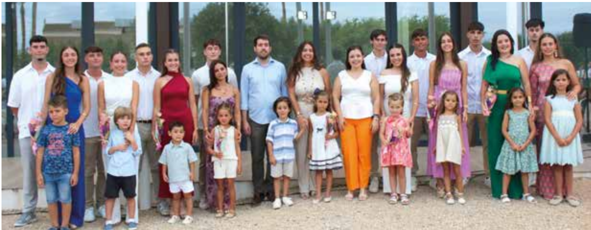
Representants de les festes junt a l'alcalde