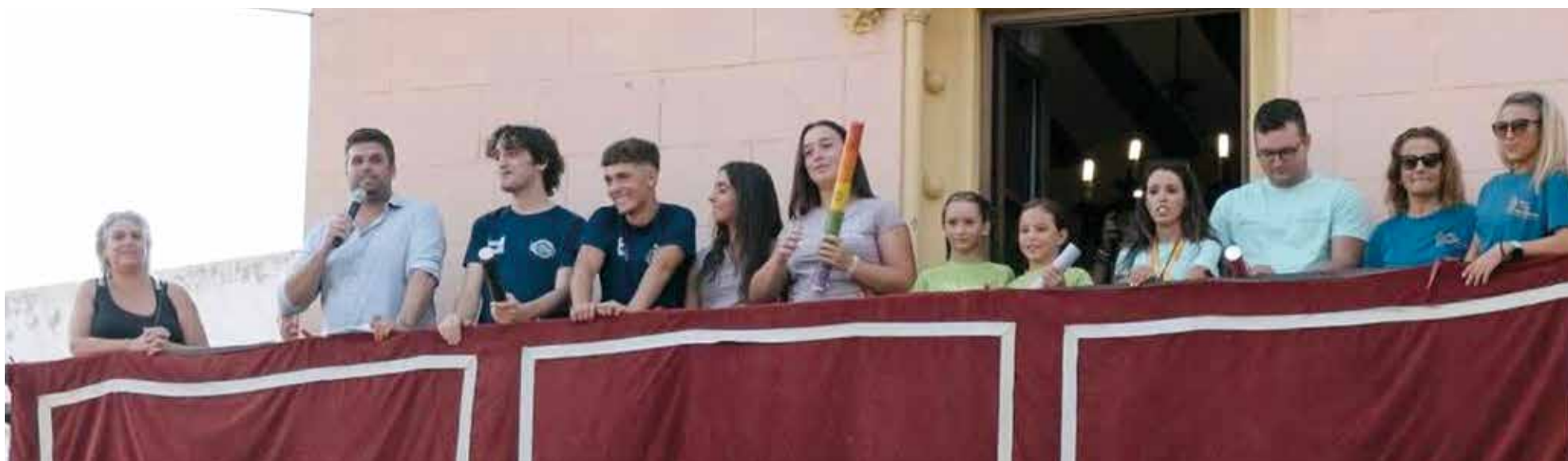
Alcalde, regidora i clavaries durant el pregó del inici de les festes a Alfara del Patriarca