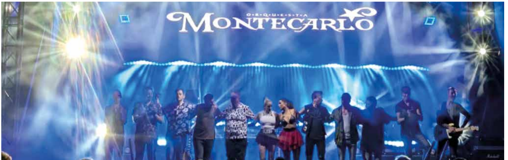
Orquestra Montecarlo va actuar a Tavernes Blanques