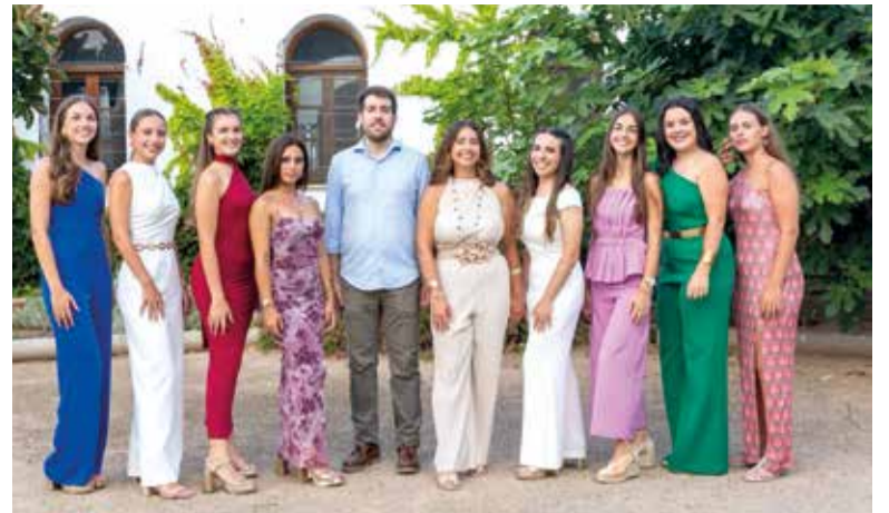
Representants de les festes