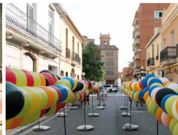
Algunes imatges de les festa d'Alfara del Patriarca, d'esquerra a dreta: punt violeta situat en el recinte firal, sopar dels majors de la localitat i 'globotà' per als més xicotets de la població