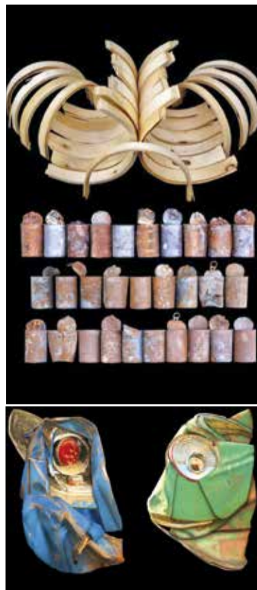
Dos de les obres de Paco Guillem

Així mateix, ha exposat en la Fundació Balearia en la Casa de Cultura de Pedreguer, en la Fundació Mutua de Levante a Alcoi i en la Casa de Cultura de Picassent, participant també en la Biennale International de Grand Angle a Epinal (França) i en la Col·lectiva a Coubron-Sein Saint Denis (França), amb l'obra 'Belles deixalles', composta per fotos realitzades a peu de contenidors industrials, per a fomentar el reciclatge, la defensa del medi ambient i contra els abocadors incontrolats.