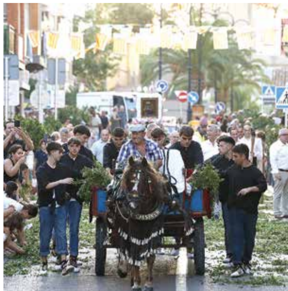
Tradicional Entrà de la Murta