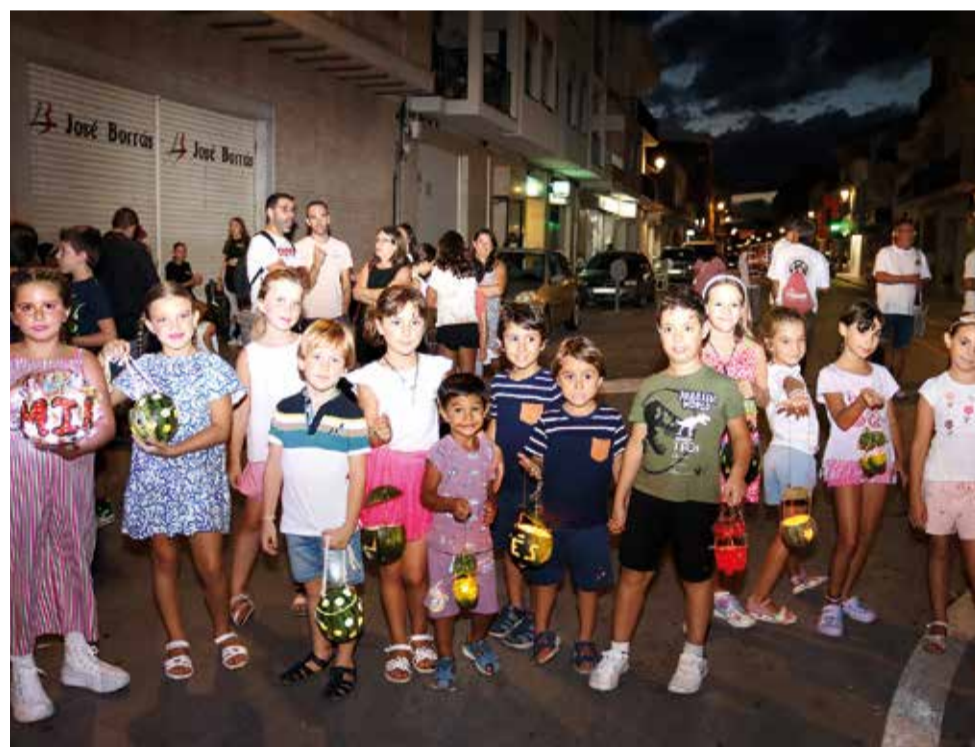
Nit de 'farolets'