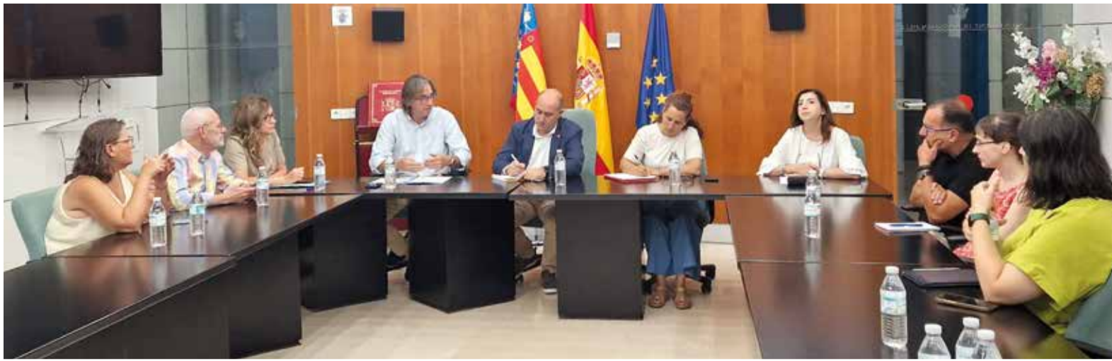
Reunió representants municipals