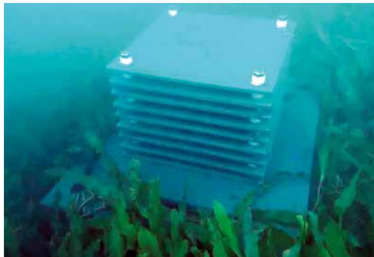
Aparell situat en el fons marí de la platja a La Pobla

LA TEMPERATURA DE L'AIGUA AFECTA A LES ESPÈCIES