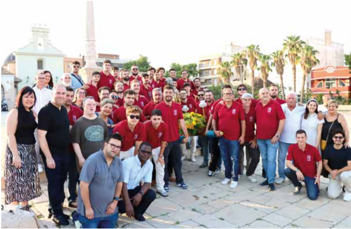
Clavaris amb la imatge de Sant Roc, patró de la població