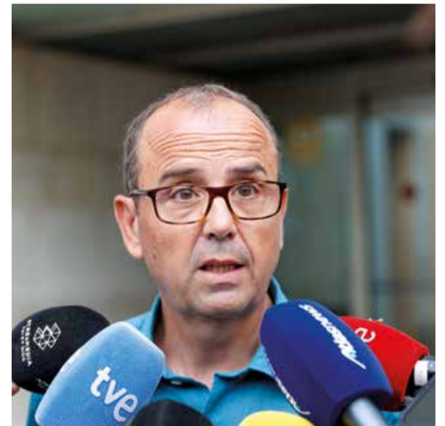
El cap de Climatologia de l'Agència Estatal de Meteorologia, dels últims en declarar

Aquests dies, la Guàrdia Civil ha presentat un nou informe a la jutgessa amb converses entre els tècnics d'Emergències i el Consorci Provincial de Bombers el dia 29 d'octubre. Unes transcripcions, desconegudes fins ara que revelen la sorpresa dels bombers en demanar-los des del centre de l'Eliana, al migdia del 29-O, que vigilaren el barranc de Poyo. El nou informe també inclou una conversa en la que es parla de que la tempesta es desplaçava cap a la re-