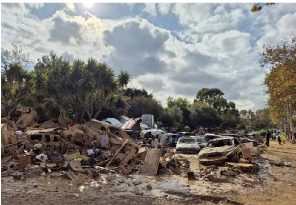
Zona entre el barri Orba i els Alfalares d'Alfafar, 9 dies després de la 'barrancà'

Bartual insistix "és imprescindible per a la recuperació dels ajuntaments, la suspensió immediata de les regles fiscals que permeta afrontar amb eficàcia els ingents gastos derivats de la reconstrucció, de manera que facilite la seua gestió financera. Les regles fiscals no poden ser una llosa que impedisca reparar ponts, camins, vivendes i servicis bàsics, per això el Govern d'Espanya ha de regularitzar que els governs locals puguen destinar el seu superàvit a inversions financerament sostenibles en els anys 2025 i 2026, o fins i tot amb vigència indefinida. No podem continuar demanant miracles als equips municipals. Fa falta gent, fa falta mitjans, fa falta suport real.