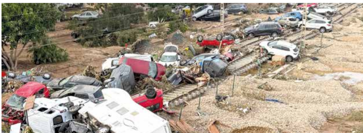
Vies de tren al seu pas per Alfatar i Benetússer.

D'altra banda, les dades de risc d'inundació utilitzades en el treball van ser proporcionades per la Confederació Hidrogràfica del Xúquer, "que va emprar el model Infoworks 2D per a calcular els nivells i velocitats de flux en l'àrea inundada". També es van utilitzar els mapes de risc d'inundació corresponents a períodes de retorn de 10, 25, 50, 100 i 500 anys.