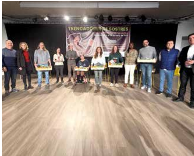
Meliana va acollir diverses xarrades