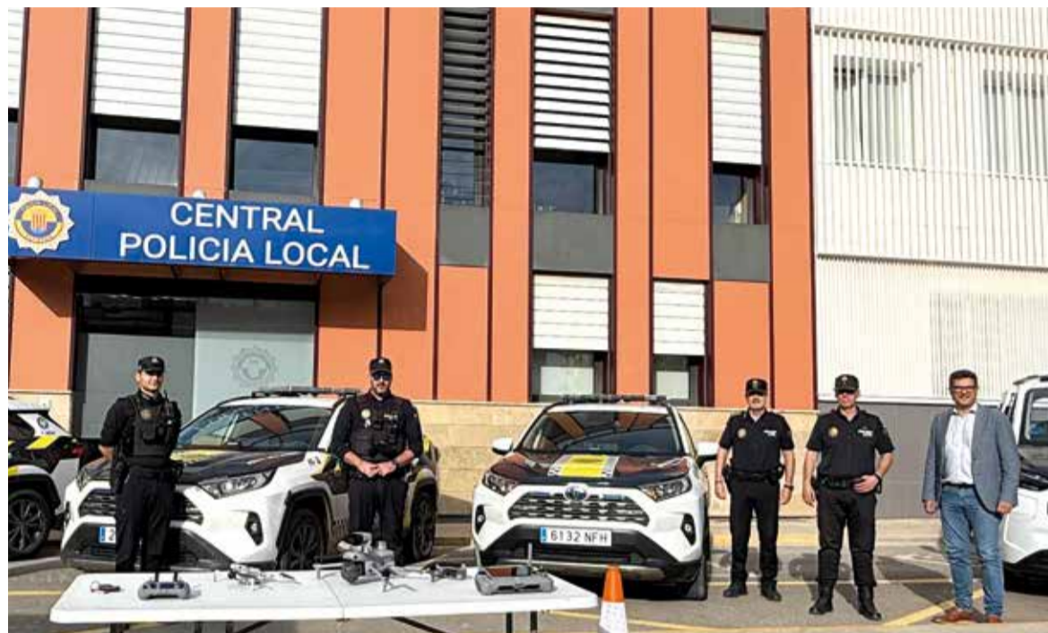
Agents i alcalde durant la presentació dels nous drons

L'AJUNTAMENT REFORÇA EL SEU COMPROMÍS AMB LA SEGURETAT CIUTADANA DONANT SUPORT A LA MODERNITZACIÓ TECNOLÒGICA DE LA POLICIA LOCAL