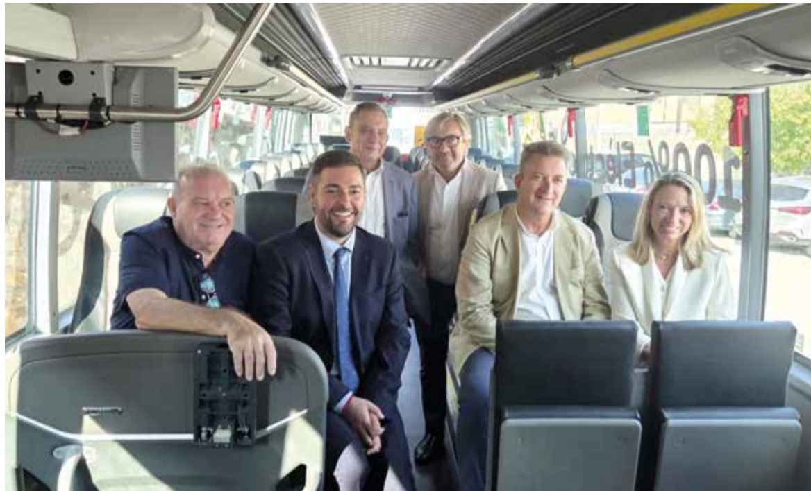
El conseller, junt als alcaldes i alcaldessa i responsables de l'AMT

EL SERVICI SERÀ DE DILLUNS A DIVENDRES, I EN FUNCIO A LA DEMANDA S'AMPLIARÀ ELS CAPS DE SETMANA