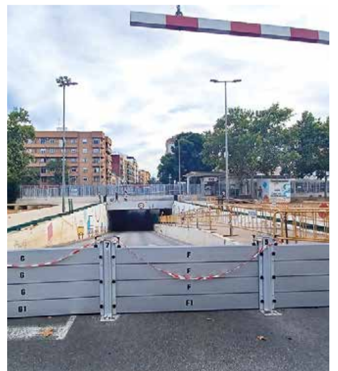
Barranc de la Saleta

"L'objectiu d'estes mesures és guanyar marge de reacció per a salvaguardar als veïns fins que s'execute la gran obra general de canalització del projecte de la Saleta que portem reclamant més de 40 anys", va assenyalar l'alcalde. Quan es realitze esta obra no sols beneficiarà a Aldaia sinó també als municipis veïns d'Alaquàs i Xirivella, els dos es van inundar en menor mesura a conseqüència del desbordament del barranc de la Saleta, en el terme d'Aldaia.