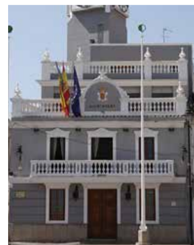
Ajuntament de Meliana

En eixe sentit, des de l'Ajuntament de Meliana insistixen "el que necessitem és el soterrament de les vies, si municipis com Alborià l'han aconseguit nosaltres hem de continuar treballant per a aconseguir el mateix".