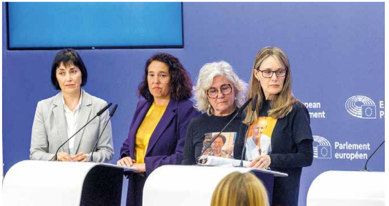
Associacions de víctimes van acudir a Brussel·les i van demanar que s'investigue l'ocorregut

Dins de la cronologia de la instrucció, un moment important va ser quan al mes de juliol la Guàrdia Civil va entregar un informe a la jutgessa sobre les pluges, alertes, desbordaments i actuacions de la Generalitat. Un