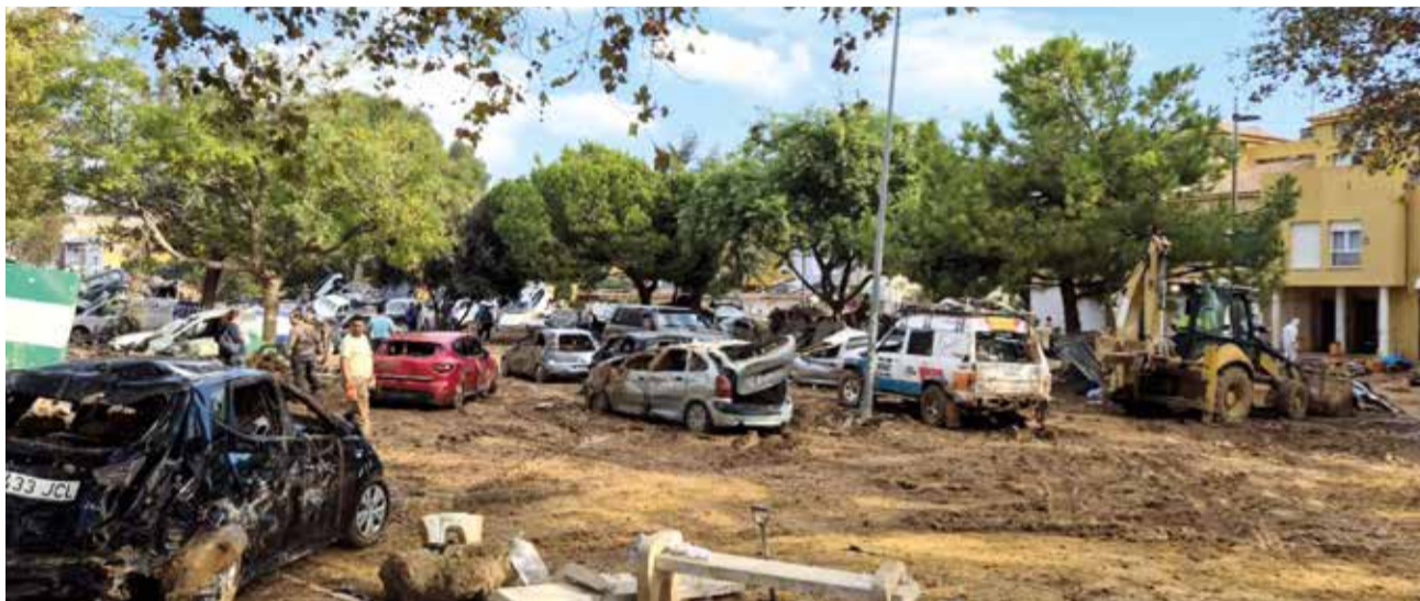
Zona entre el barri Orba i els Alfalares a Alfafar

L'AJUNTAMENT D'ALFAPAR HA SOL·LICITAT LA COL·LABORACIÓ DE LA CONSELLERIA DE MEDI AMBIENT, INFRAESTRUCTURES I TERRITORI AMB LA FINALITAT DE RESTAURAR LA NORMALITAT I DAVANT LA IMPOSSIBILITAT D'ASSUMIR EL COST DE LA RETIRADA D'ENDERROCS