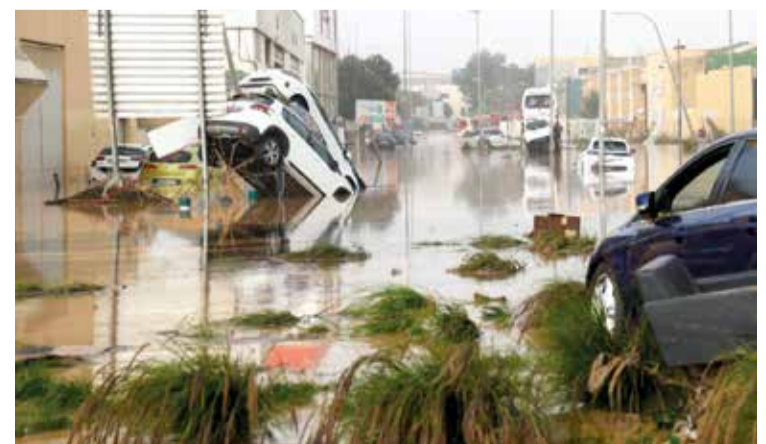
Polígon industrial a Sedaví.