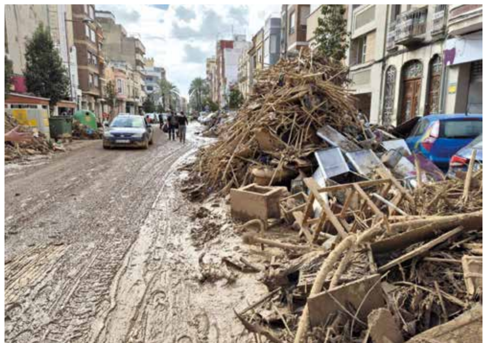
Catarroja, imatge de 9 dies després de la Dana