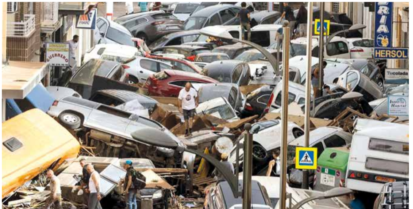
Carrer a Alfatar i Sedaví.

En l'article s'exposen com a exemples inundacions ocorregudes en diversos països i diferents anys, algunes també a Espanya, en les quals es van produir danys i morts relacionats amb els efectes de les riudades en els vehicles, assenyalant al respecte que, "perquè la gestió siga adequada, és