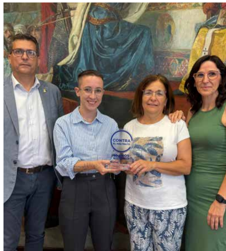
Alcalde, regidora i tècniques

"Este reconeixement ens anima a continuar treballant per un Alfagar on les festes i l'oci siguen sinònim de convivència, igualtat i respecte. La nostra prioritat