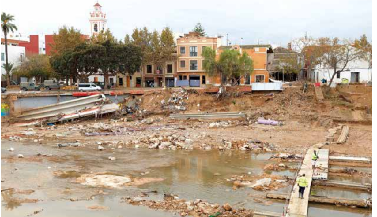
Picanya, 19 dies després de la riuada.

També el barranc de Picassent va fer de les seues i va ser el primer a entrar en la zona inundable a l'Horta Sud. Per a minimitzar riscos són necessàries actuacions: algunes d'elles estan ja en marxa, unes altres sembla que hauran d'esperar. En el barranc de l'Horteta, la Generalitat Valenciana, ha assegurat que avançant-se al Govern, està realitzant obres de canalització que compten amb una inversió total de 5,7 milions d'euros, destinades a la reparació i reforç dels talussos de ribera danyats, també està construint murs de contenció, treballs que s'espera que finalitzen abans del pròxim estiu.