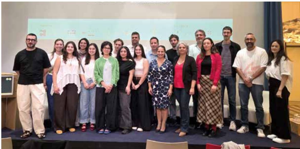
Presentació del festival amb artistes i alcaldes i alcaldessa