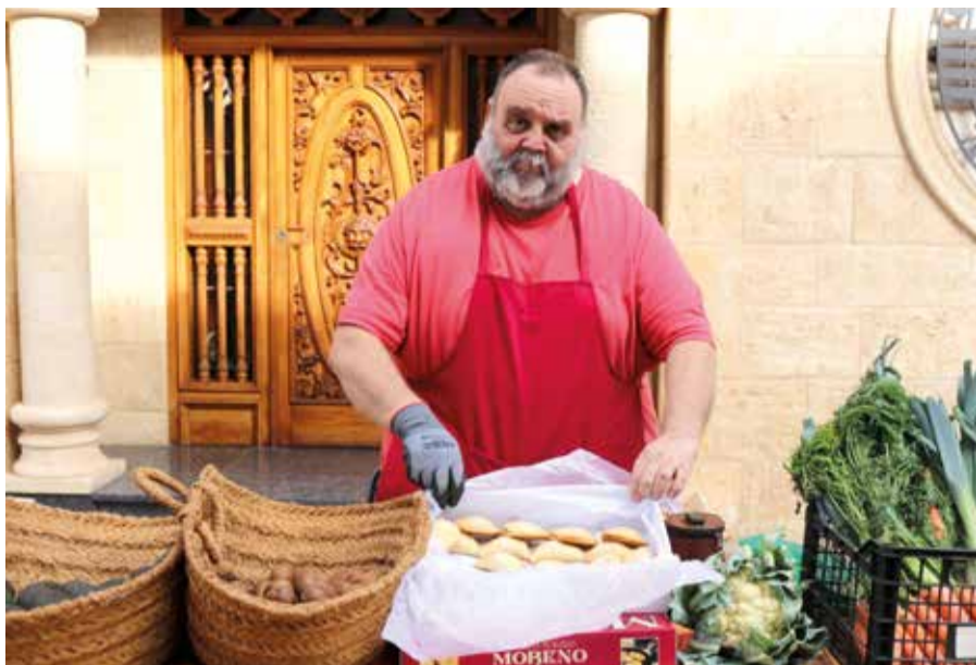
La fira acull parades d'alimentació