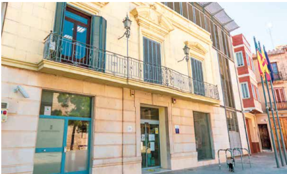
Ajuntament de Massamagrell

L'OBJECTIU D'AQUESTA INICIATIVA ÉS FOMENTAR LES COMPRES EN EL COMERÇ DE LA LOCALITAT