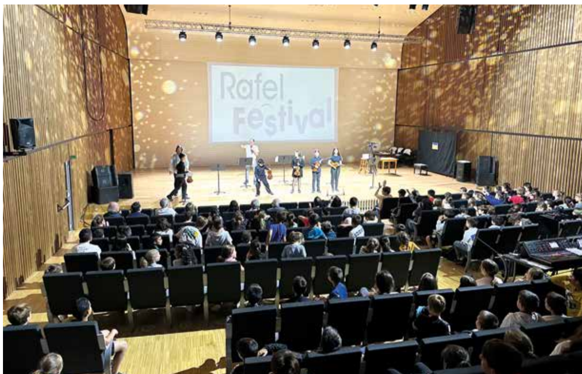
Imatge de l'any passat