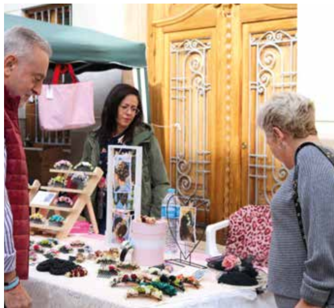
També hi ha parades de venda d'artesanía