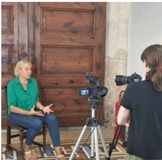
Dones esportistes van ser les protagonistes del vídeo