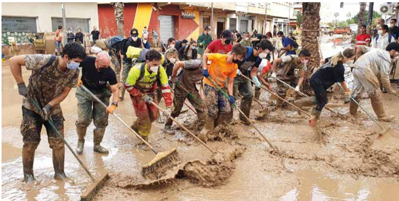
Voluntaris a Paiporta

Finalment, el 2 de novembre se celebrarà l'acte institucional de reconeixements i homenatges a la ciutadania, el voluntariat i els diferents serveis d'emergència que van treballar sense descans durant la crisi. Un moment d'agraïment