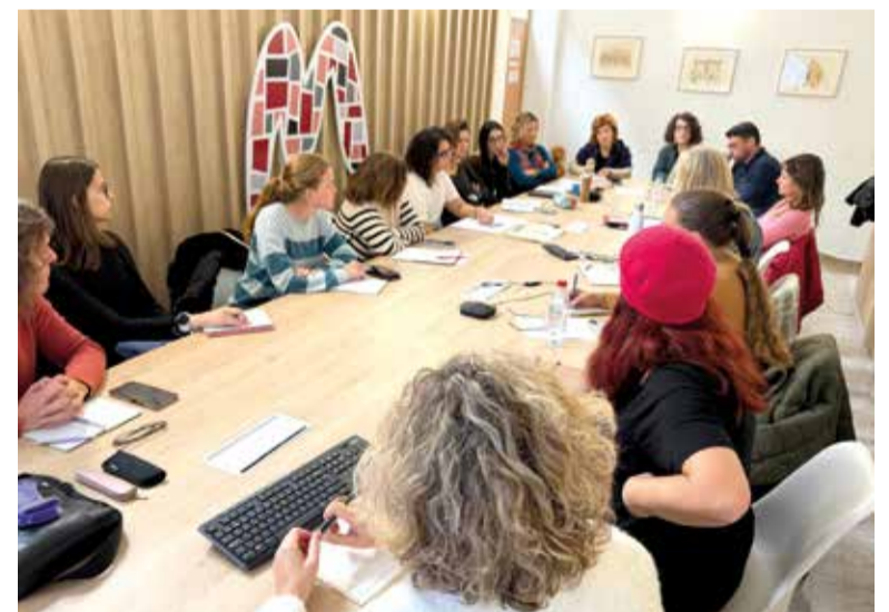
Jornada a la Mancomunitat