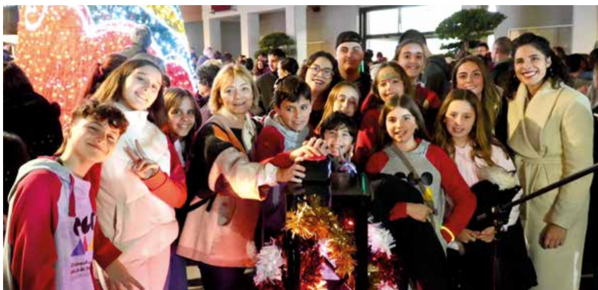
Encesa de llums a Quart de Poblet