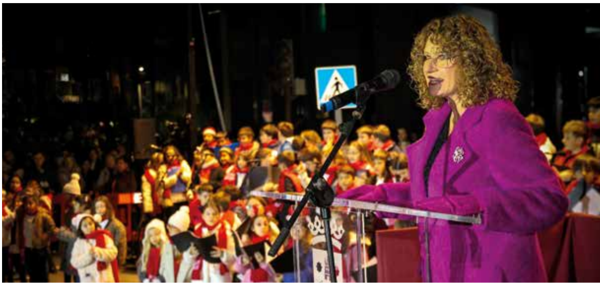
La inauguració i l'encesa es van realitzar amb l'actuació del cor que va cantar nadales