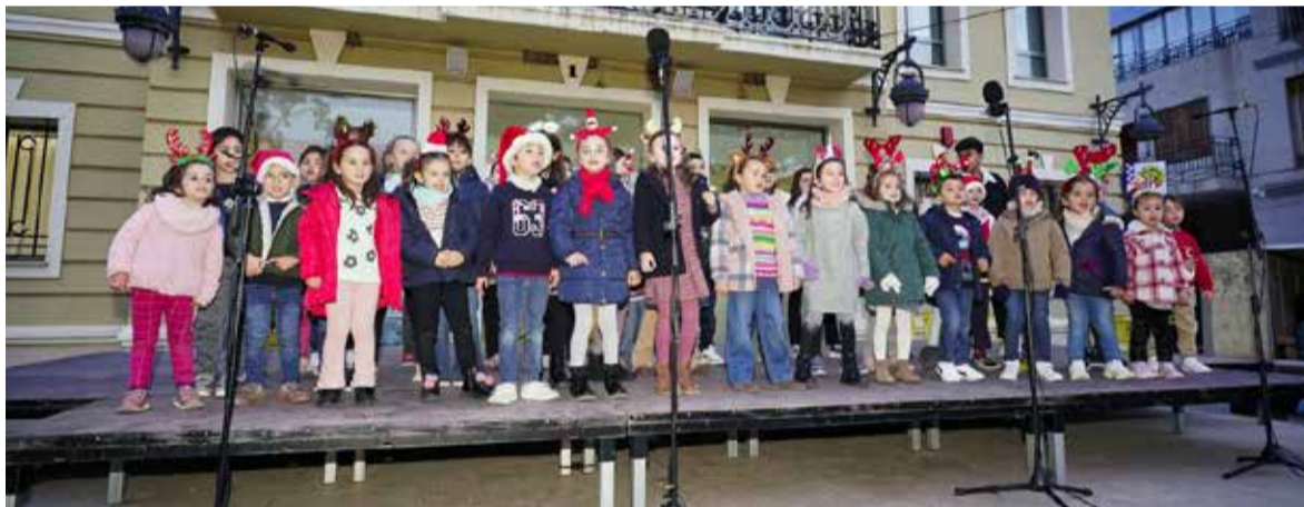
Cor infantil de la Unió Musical Pobla de Farnals

L'acte va concloure amb una fotografia de grup amb totes les persones donants i les autoritats, així com amb un vi d'honor que va posar fi a una jornada dedicada a reconèixer la solidaritat de totes aquelles persones que fan possible que la donació de sang continue salvant vides.