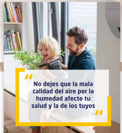
CALIDAD DEL AIRE

“ No dejes que la mala calidad del aire por la humedad afecte tu salud y la de los tuyos ”