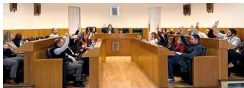
Ple Ajuntament de Paterna

Este lideratge en la contractació està impulsat especialment pel sector industrial, que concentra el 38% dels contractes, en coherència amb