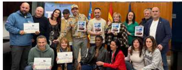
Premiats i participants de la ruta de la tapa

El fil conductor del projecte ha sigut la dramatització, i per això han participat en diferents tallers de teatre, expressió corporal i cor.