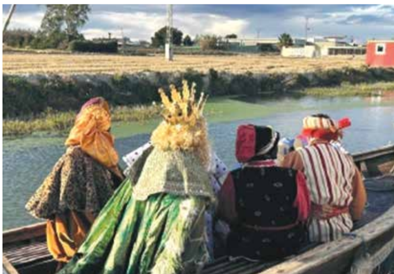
Reigs Mags a Alfatar

Amb esta aprovació, Alfatar consolida la seua aposta per una gestió basada en la participació, la planificació i la millora contínua del benestar i les oportunitats laborals per a tota la seua ciutadania.