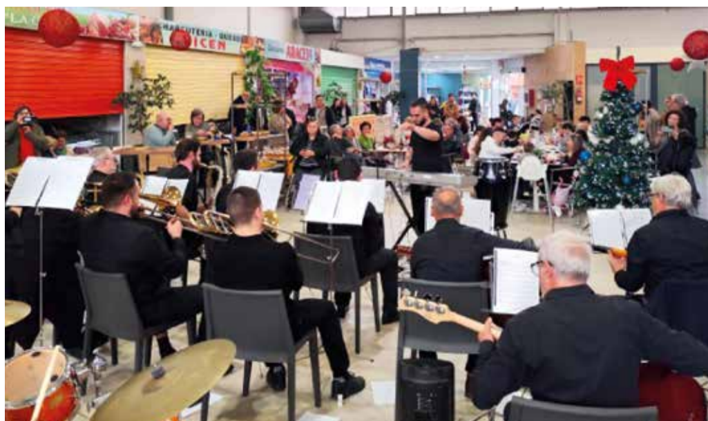
Concert en el mercat