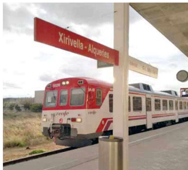
Tren de rodalia

Un de les fites més importants del pla és la construcció d'una nova estació en el sector de Bonaire (Aldaia). Esta futura instal·lació es dissenyarà com un edifici de viatgers, equipat amb dos andanes de 210 metres de longitud i 5 metres d'ample, connectats per un pas a distint nivell que serà plenament accessible. La nova esta-