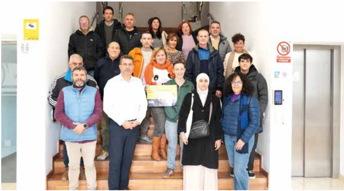
Nou plan d'ocupació a Alfafar