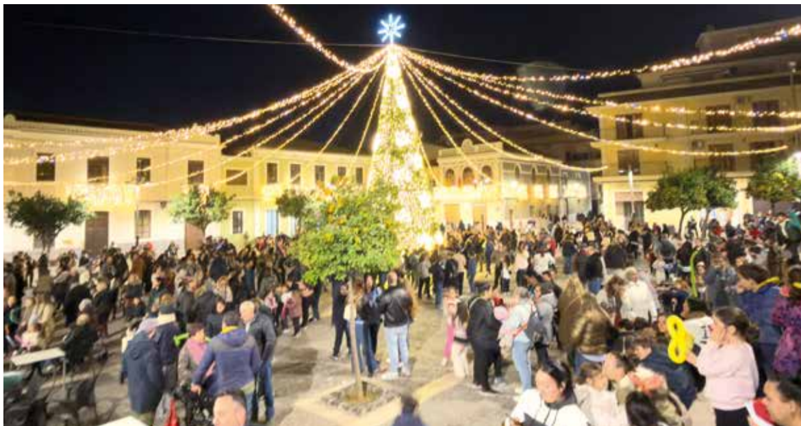
Encesa de les llums