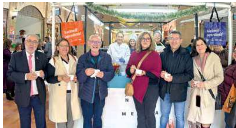
Nadal al Mercat d'Alboraia

El programa complet, disponible en valencià i castellà, pot consultar-se en la pàgina web municipal www.alboraya.es .