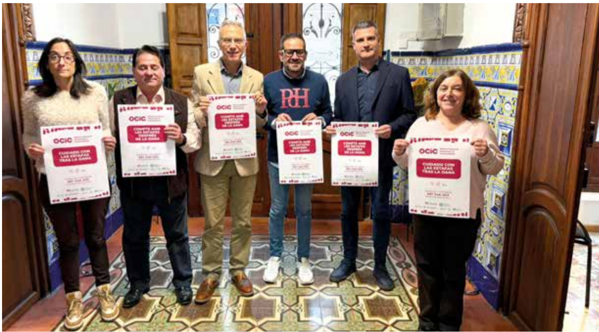
Representants de la Mancomunitat de l'Horta Sud, el Comissionat del Govern per a la reconstrucció i la Unió de Consumidors