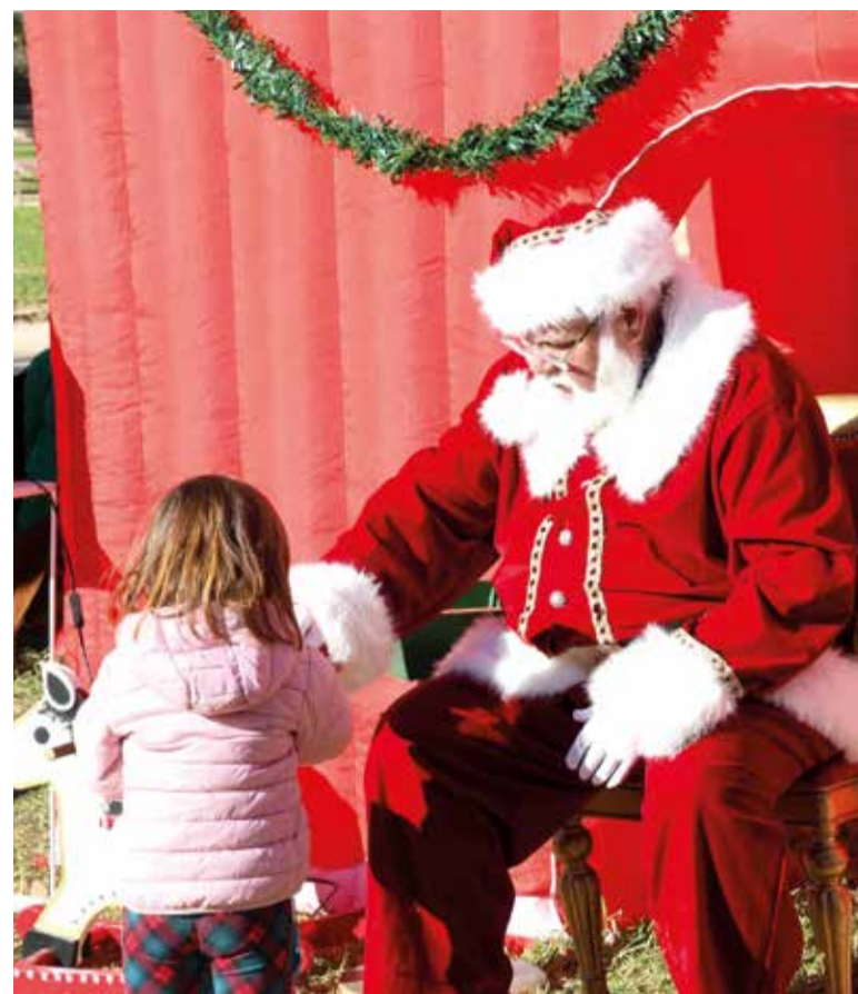
Imatge del Nadal de l'any passat

del 6 de desembre al 6 de gener, romandrà instal·lada la Fira d'Atraccions de Nadal, ubicada a l'aparcament del Mundial 82.