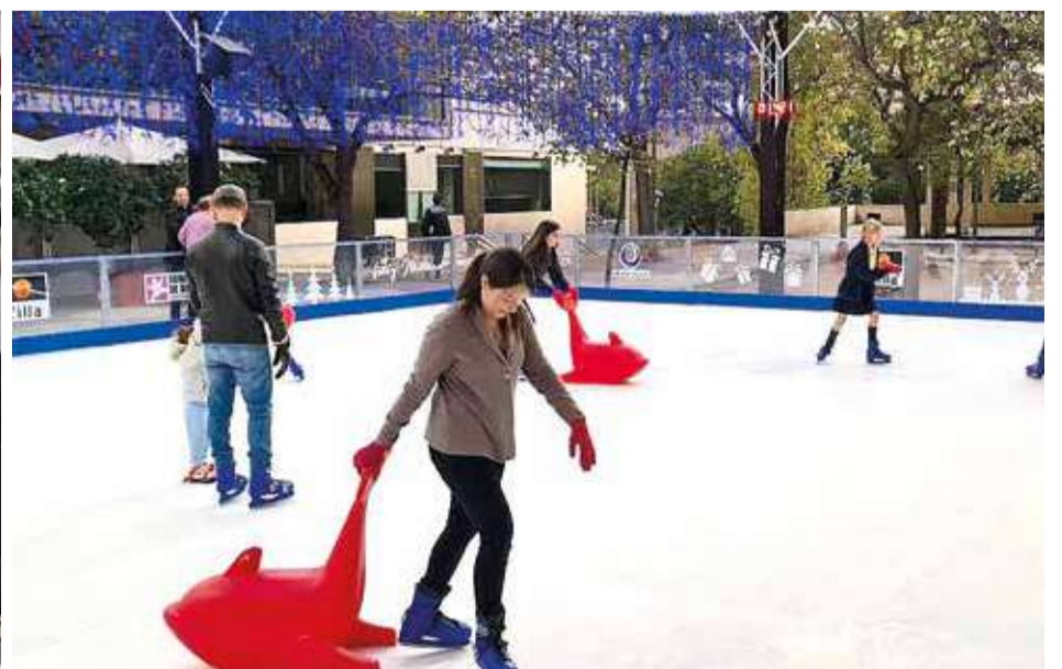
Pista de patinatge

de la Constitució (junt al Castell d'Alaquàs).