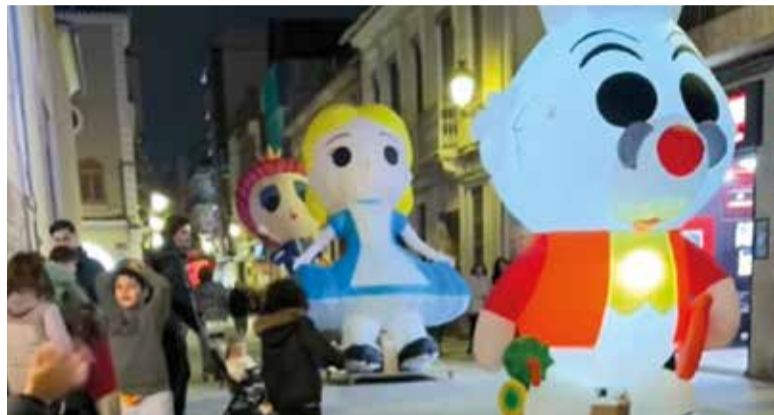
Festa a Paiporta per l'encesa de llums