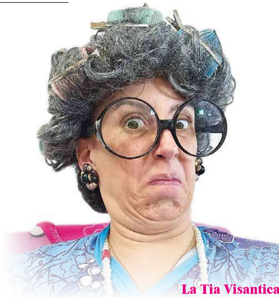
La Tia Visantica

En esta pàgina es poden veure moltes coses i entre elles. on realitzaré els següents shows. Us recomane visitar-la.