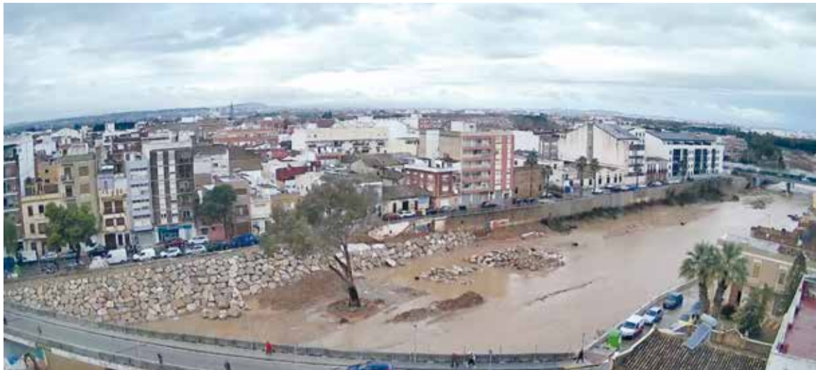
Paiporta ha instal·lat una càmera a temps real en el barranc de Poyo