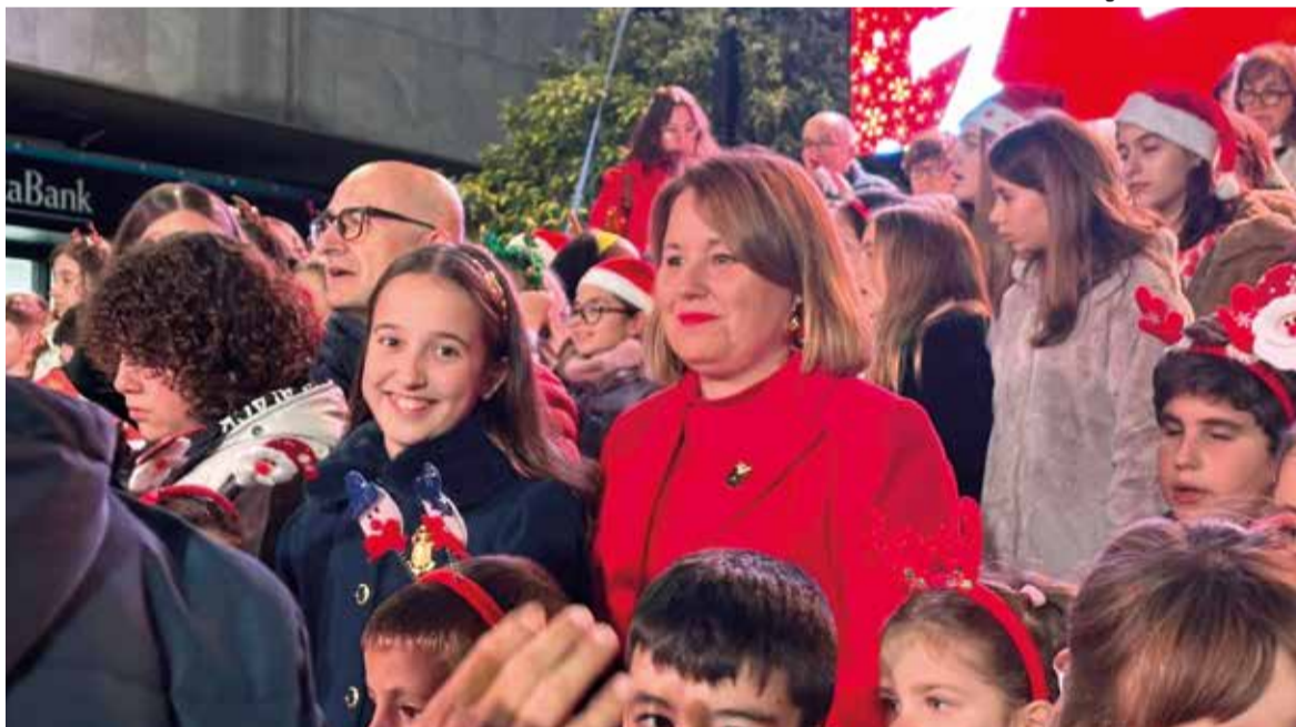
Molta participació en el pregó de Nadal d'Alaquàs