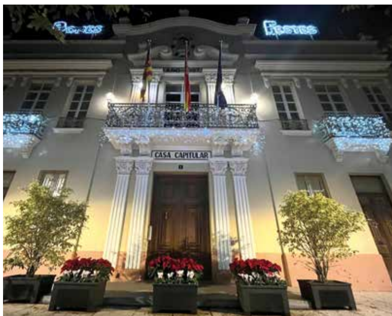
Ajuntament de Tavernes Blanques