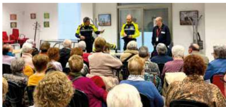
Xarrades a Mislata

Aquestes activitats no sols proporcionen informació útil a la ciutadania, sinó que també con-