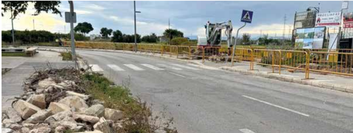
Foios inicia les obres de la ronda

posen una inversió de 186.701,31 euros (IVA inclòs) de l'Ajuntament de Foios i se centren en renovar les voreres per a millorar l'accessibilitat a les persones vianants, rehabilitar el carril bici per a assegurar un trajecte segur i continu, millorar l'enllumenat de tot l'espai perquè siga més sostenible o plantar altres espècies més adequades, com ara moreres, ja que ofereixen ombra sense generar problemes amb les arrels.