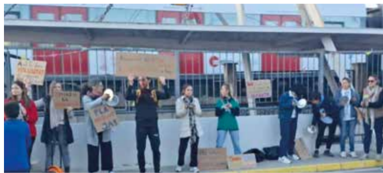
Concentració al CEIP d'Albalat dels Sorells

centració a les portes exteriors del nostre centre a les 16:30h, on professorat del claustre, també amb famílies i alumnat que s'han volgut sumar, hem reivindicat els nostres drets laborals i les condicions de millora de l'educació pública. Les nostres reivindicacions són clares i compartides: des de les millores