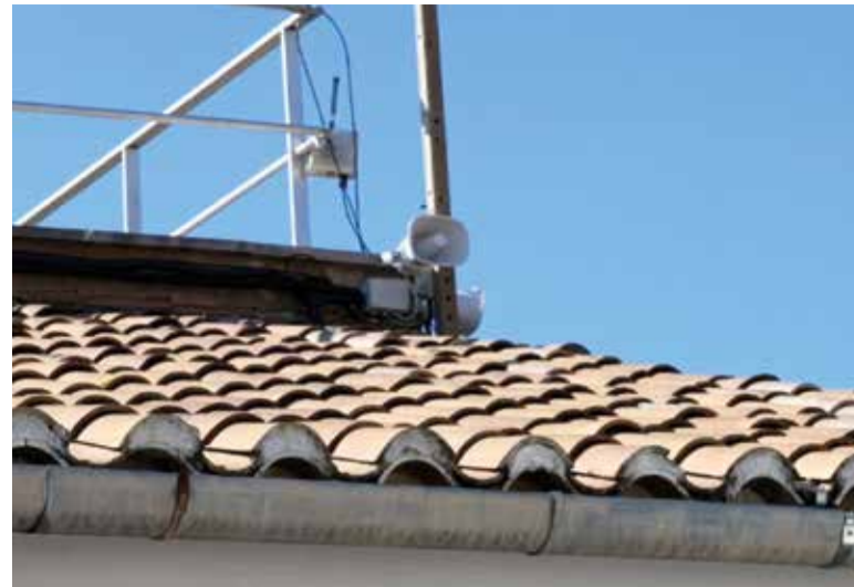
Catarroja ha posat un sistema de megafonia pels barris per a avisar a la població