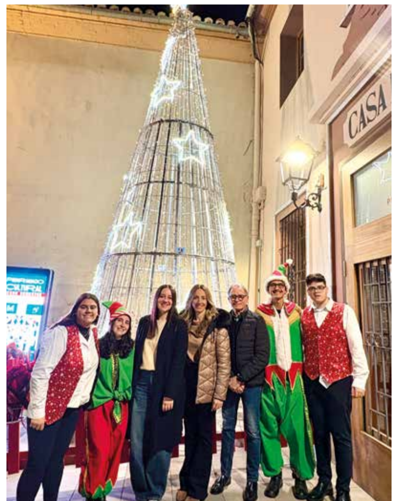
Encesa de l'arbre de Nadal

Finalment, el 5 de gener els carrers del municipi tornaran a omplir-se d'emoció amb la gran cavalcada dels Reis d'Orient, que posarà el fermall final a unes festes pensades per a reforçar la convivència, l'esperit nadalenc i l'orgull de pertinença a Museros.