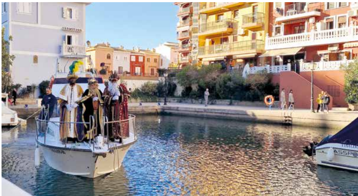
Els Reis Mags acudixen a Port Saplaya