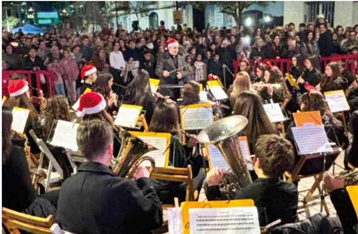
Pregó de Nadal amb concerts

PARTICIPEN EN EL PREGÓ NOMBROSOS CORS INFANTILS DE LA POBLACIÓ