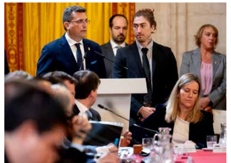
Adsuara, en la presentació del projecte a la Casa Reial

Afig que esta iniciativa naix de la col·laboració, de la implicació del