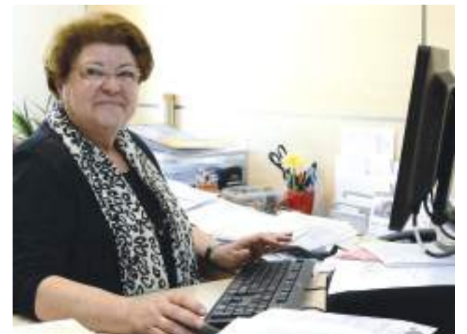
Gloria va exercir els seus últims anys com a secretaria de l'alcalde

"Gràcies als meus veïns i veïnes. Graciès, Poble", diu Gloria.