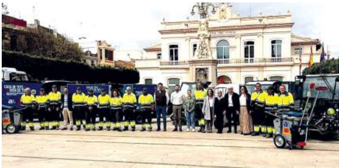
Presentació dels nous vehicles

LA MODERNITZACIÓ DEL SERVICI DE NETEJA INCLOU MAQUINÀRIA EFICIENT I RESPECTUOSA AMB EL MEDI AMBIENT, REAFIRMANT EL COMPROMÍS DE L'AJUNTAMENT AMB LA QUALITAT DE VIDA DELS SEUS HABITANTS