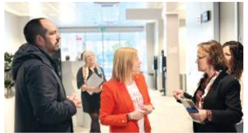
La delegada del Govern va visitar la població

Així mateix, s'han renovat els sistemes de contenció adaptant-los a la normativa actual mitjançant muralletes metàl·liques i s'ha procedit a la pavimentació de tot el tram de calçada afectat.