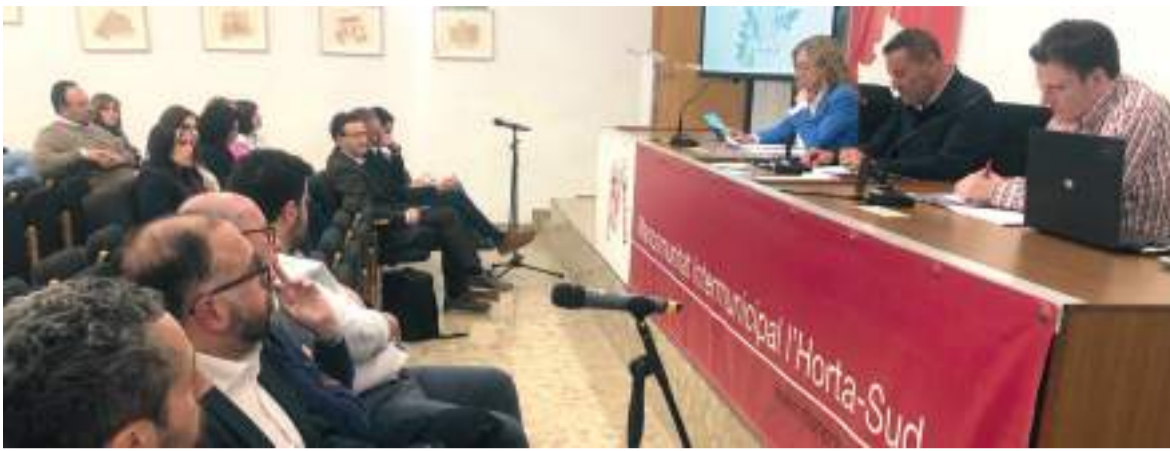
Ple de la Mancomunitat de l'Horta Sud