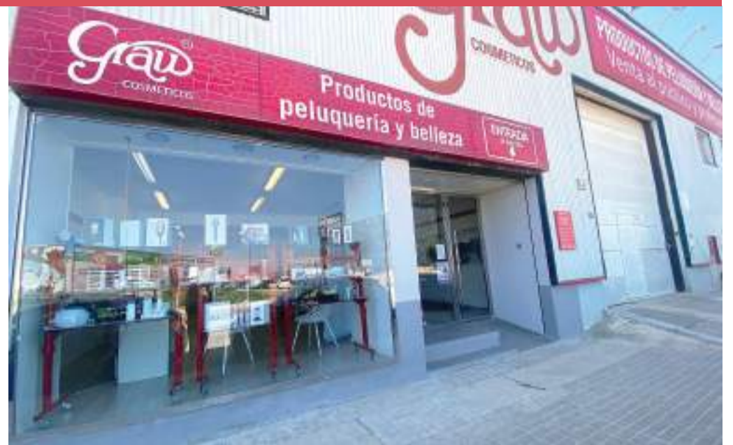
La tienda está completamente reformada. Está ubicada en la Calle Camí Fus, 64, polígono de Massanassa.