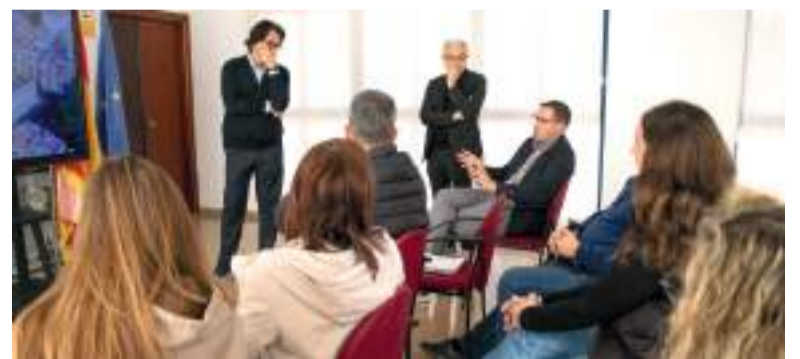
Presentació del projecte

Entre altres elements destacats, el futur edifici comptarà amb mesures específiques de protecció enfront d'inundacions, pistes esportives i gimnàs situats en la primera planta, així com criteris de sostenibilitat, eficiència, energètica i autosuficiència. Tot això