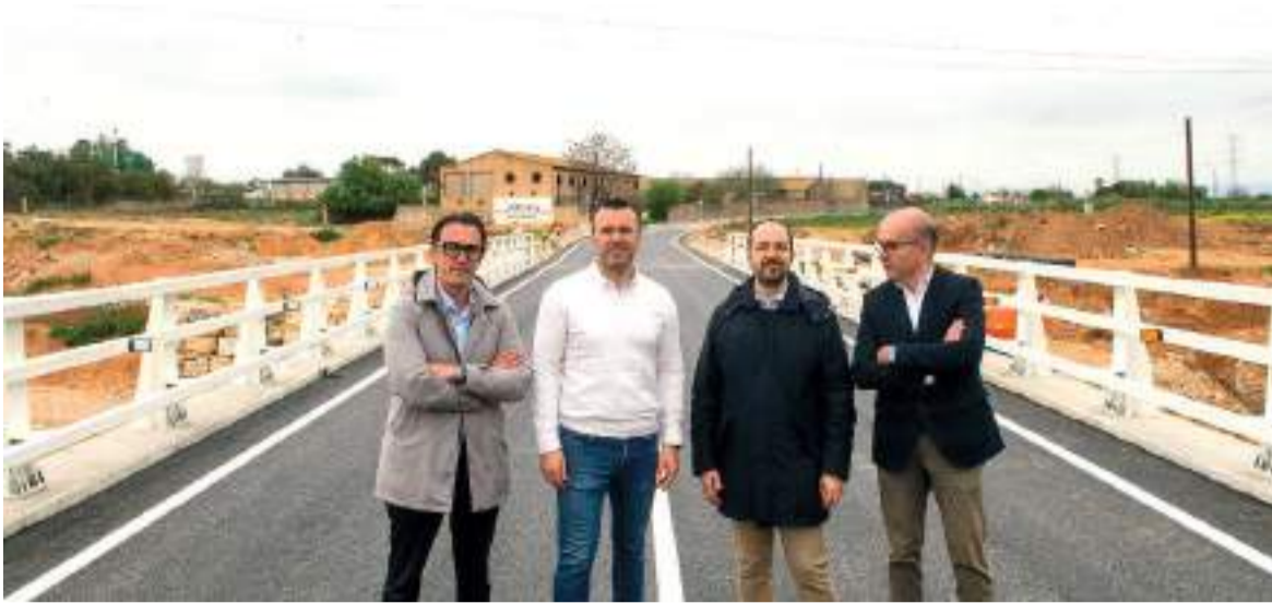
El president de la Diputació, junt l'alcalde d'Aldaia i tècnics