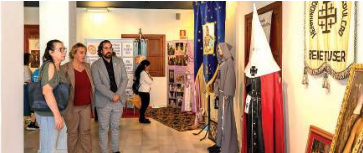
Inauguració de l'exposició de la Setmana Santa