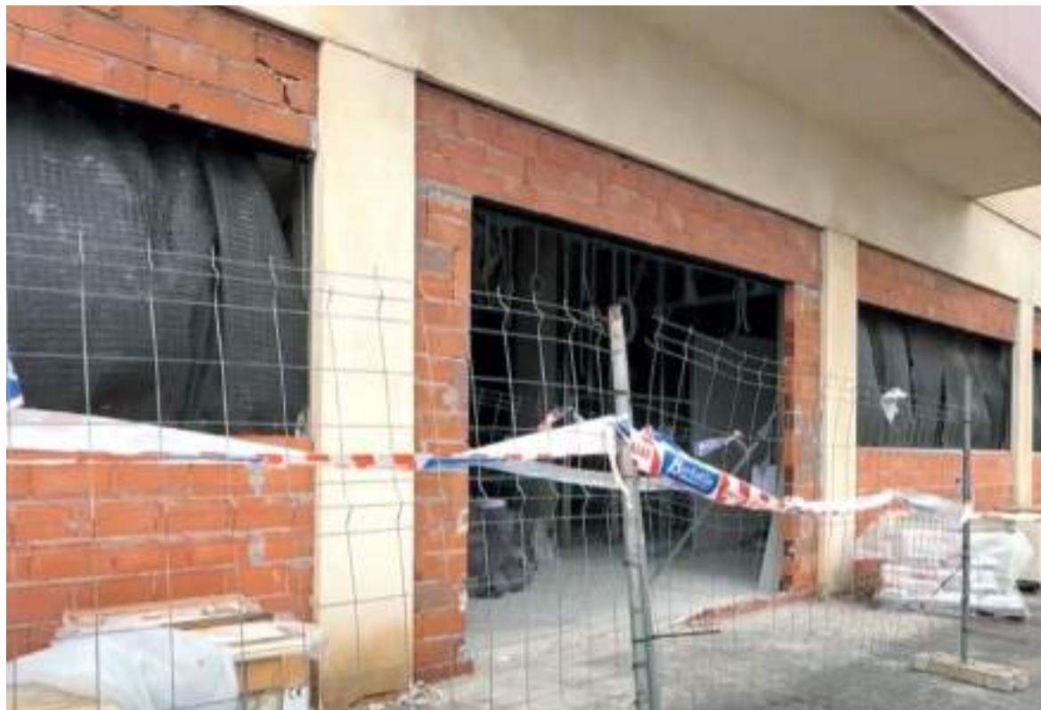
Nou centre de formació