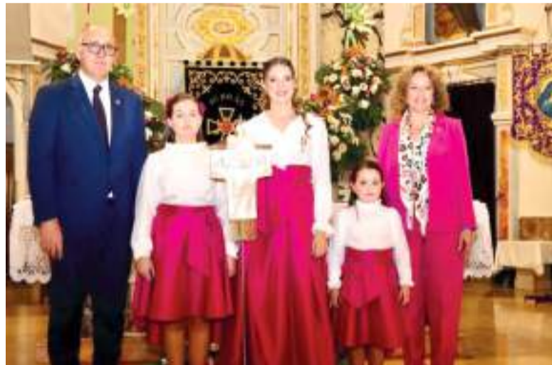
Pregó de la Setmana Santa a Torrent