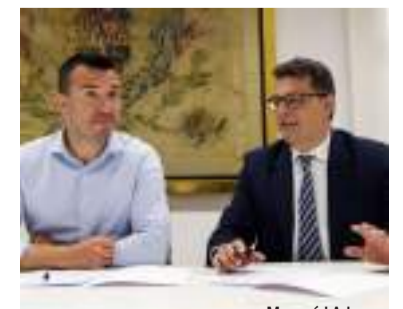
Mompó i Adsuara

L'èxit i el bon funcionament mostrat fins ara per DivalCloud s'ha vist referenciat pel guardó obtingut en la XVII edició dels Premis @aslan 2025 de Digitalització en les Administracions Públiques en la categoria ciberseguretat en ajuntaments.