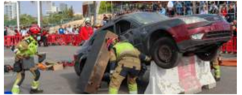
Recreació d'una actuació dels bombers

Tampoc va escapar de la destrucció total un dels escenaris més icònics de les representacions sacres de la Vida, Passió, Mort i Resurrecció de Jesús, el pretori, estructura que s'alçava sobre la plaça de l'Ajuntament per a acollir escenes clau com el lliurament del profeta als romans o el juí de Pilat. Sense estes localitzacions, de creació artesanal i la pèrdua de la qual està valorada en uns 35.000 euros, l'equip actoral i tècnic de l'Agrupació Cultural La Passió ha treballat sense descans per a tornar a representar totes les escenes, oferint una proposta escènica alternativa que segur emocionarà al públic.