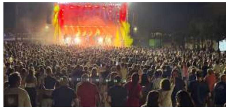
Actuació de l'orquestra Montecarlo

El dissabte 26 es va oficiar la missa en honor a Santa Ana en l'ermita. A