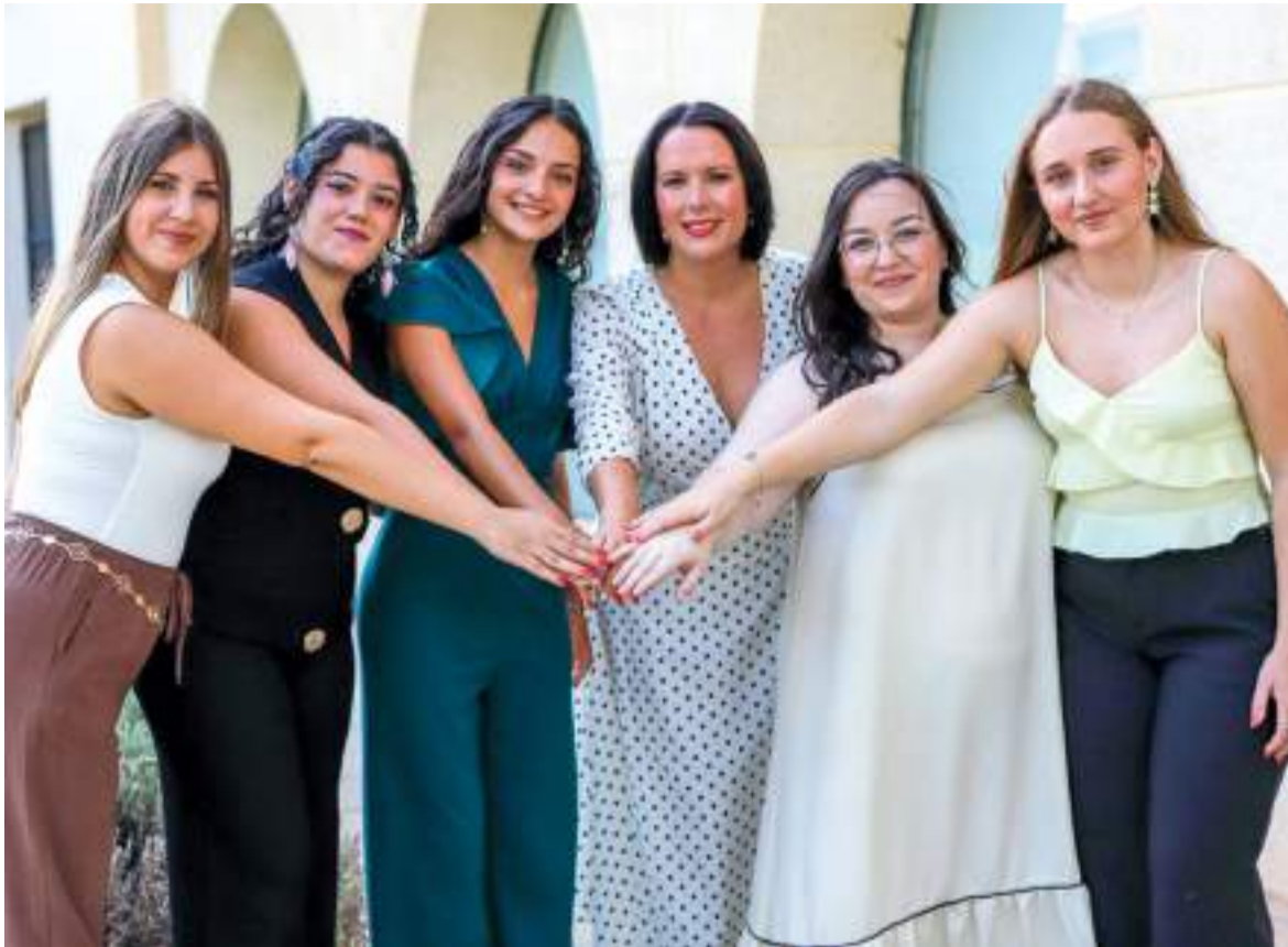
L'alcaldeessa junt a les festeres d'enguay