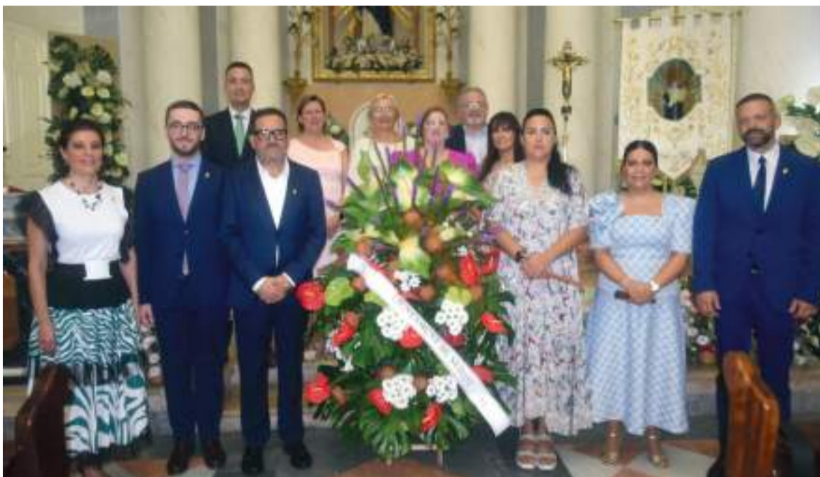
Ofrena de l'any passat