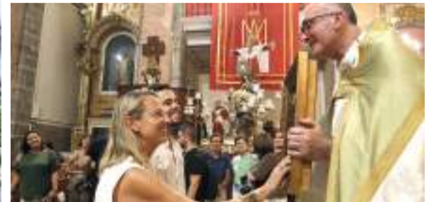
Entrà de la Murta de l'any passat