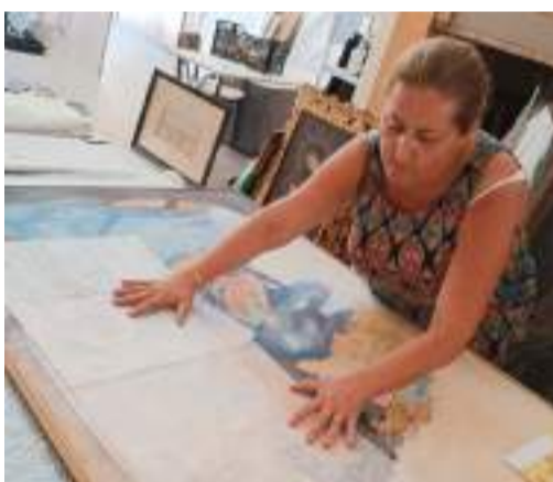
Preparació de material