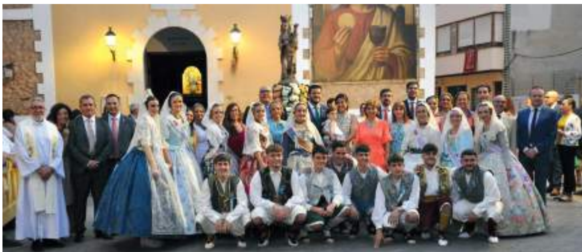
Ofrena en Albal