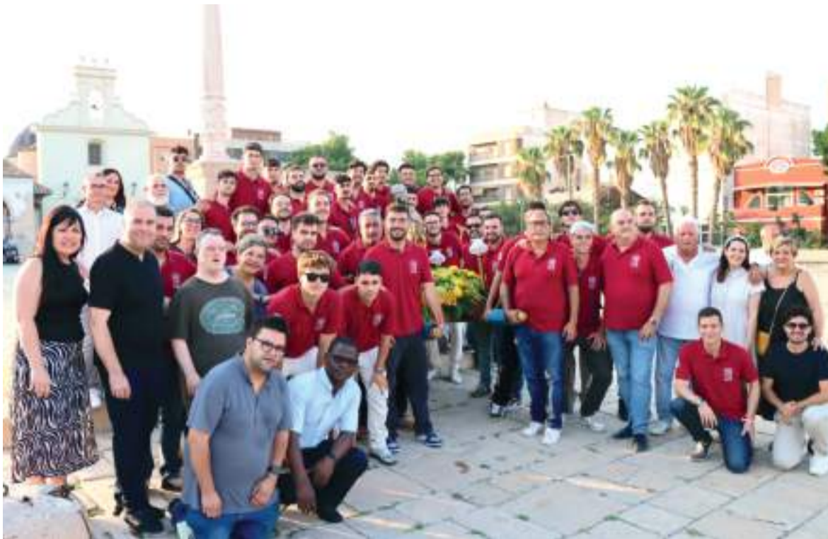
Clavaris amb la imatge de Sant Roc, patró de la població