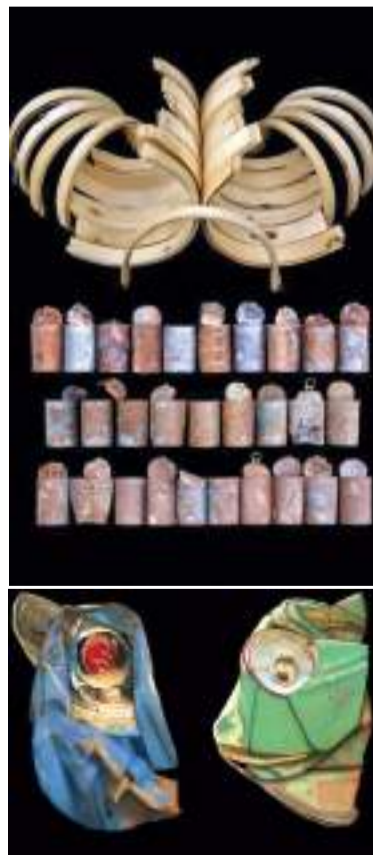
Dos de les obres de Paco Guillem

Així mateix, ha exposat en la Fundació Balearia en la Casa de Cultura de Pedreguer, en la Fundació Mutua de Levante a Alcoi i en la Casa de Cultura de Picassent, participant també en la Biennale International de Grand Angle a Epinal (França) i en la Col·lectiva a Coubron-Sein Saint Denis (França), amb l'obra 'Belles deixalles', composta per fotos realitzades a peu de contenidors industrials, per a fomentar el reciclatge, la defensa del medi ambient i contra els abocadors incontrolats.