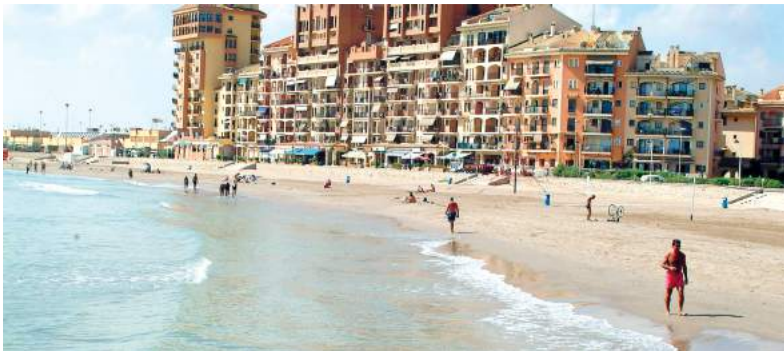
La platja de Port Saplaya a Alboraya ha estat setmanes tancada al bany