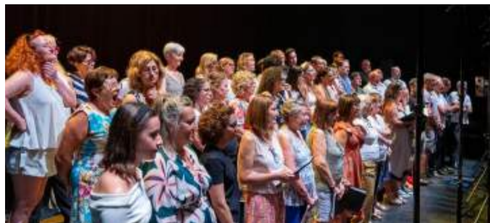
Concert l'Orfeó d'Aldaia, Joie de Vivre