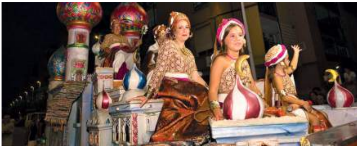
Nit de disfresses, imatge de l'any passat.