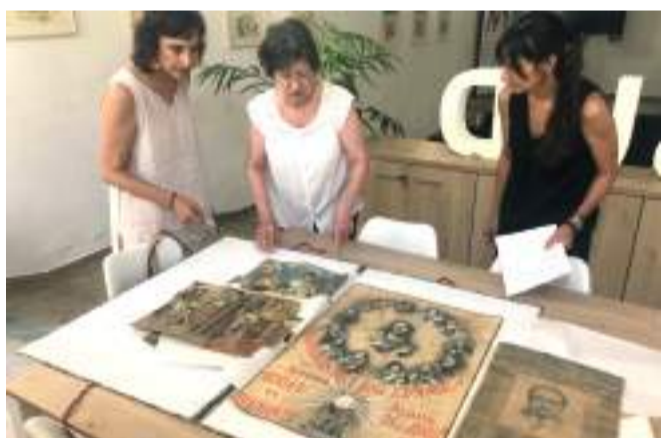
Una família d'Aldaia aporta obra gràfica de la col·lecció de son pare

Una dada important és que més de la meitat del comerç ja havia reobert al maig en els tres municipis, però en situacions molt desiguals, des d'aquells que han escomés una profunda modernització fins als qui han hagut de tornar a l'activitat amb una reforma precària. I és que la inversió no ha estat tant en funció del cobrament del consorci d'assegurances (que arriba molt lentament) o les ajudes rebudes sinó del capital disponible de cada comerciant.