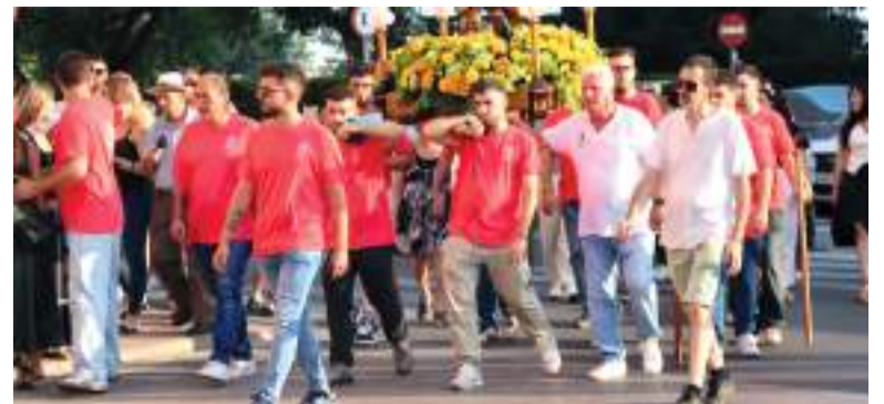
Processó pels carrers de la població