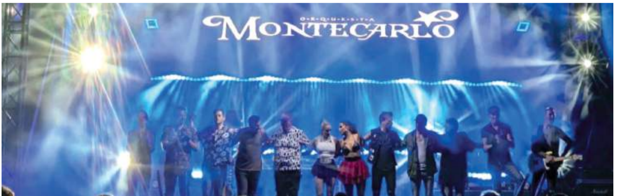
Orquestra Montecarlo va actuar a Tavernes Blanques