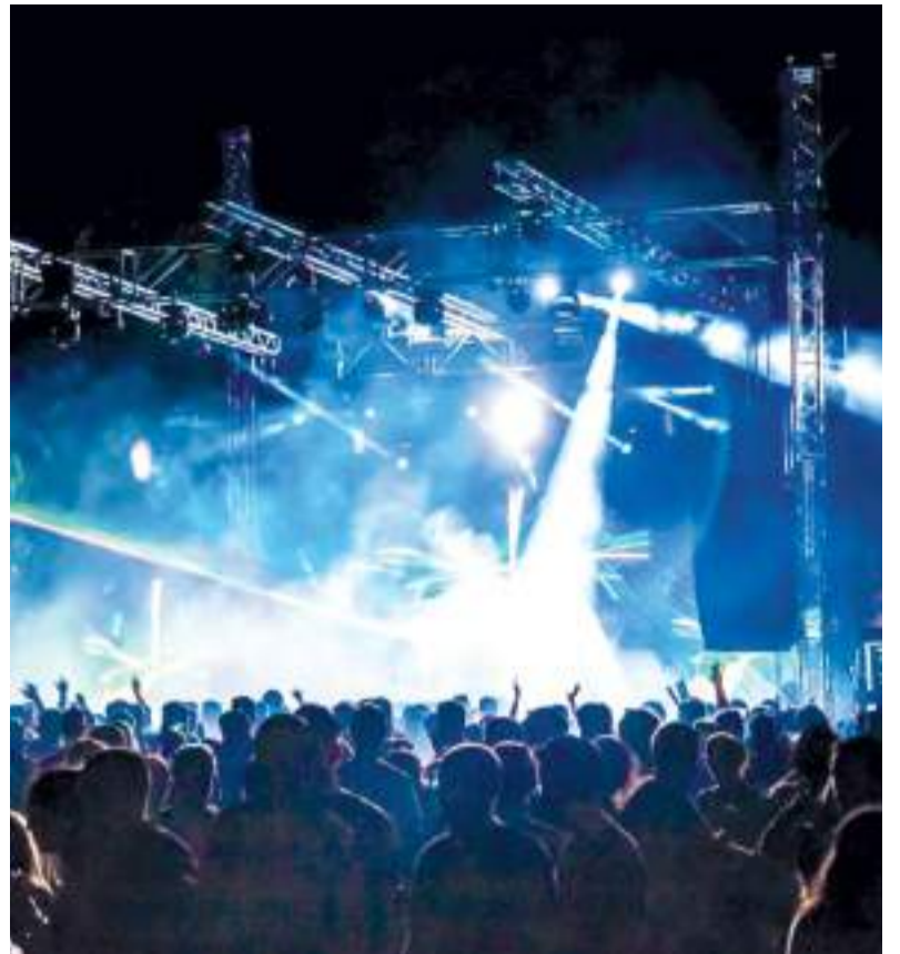
Nit de concert a Moncada