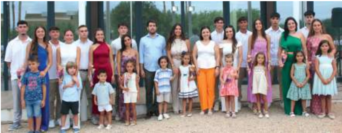
Representants de les festes junt a l'alcalde