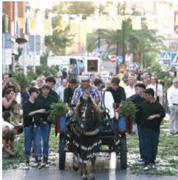
Tradicional Entrà de la Murta