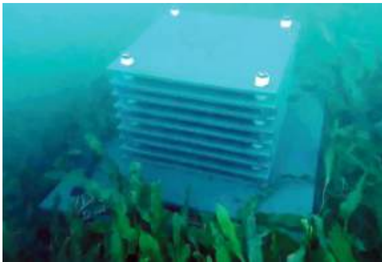
Aparell situat en el fons marí de la platja a La Pobla

L'estudi forma part del programa ThinkInAzul i compta amb el suport del MCIN amb finançament de la Unió Europea NextGenerationEU i de la Generalitat Valenciana. L'objectiu final és comprendre i anticipar-se als efectes ecològics, socials i econòmics del canvi climàtic que incidixen directament al Mediterrani.