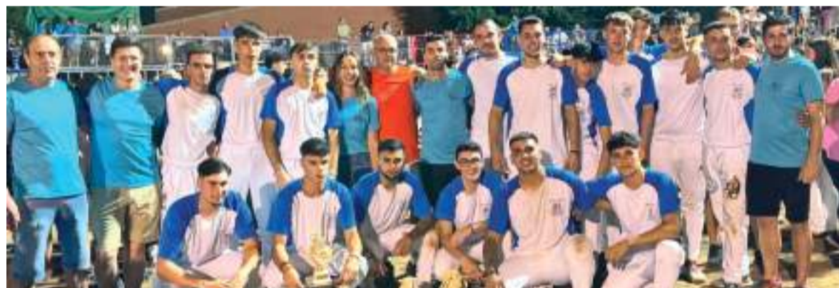
XXV Setmana Taurina de Museros

Les festes de Museros també van comptar amb actuacions musicals, campionats esportius i la seua tradicional setmana taurina.