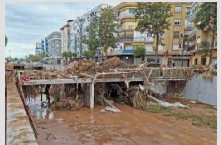
Barranc de la Saleta

Finalment, des de l'Ajuntament d'Aldaia tornen a reclamar a Catalá "que escolte els científics" que estan avalant la viabilitat d'este projecte.