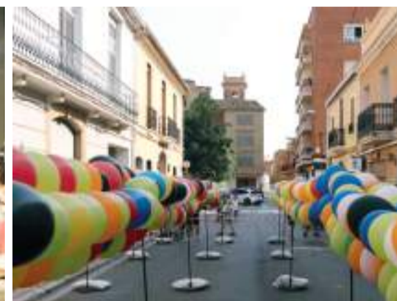
Algunes imatges de les festa d'Alfara del Patriarca, d'esquerra a dreta: punt violeta situat en el recinte firal, sopar dels majors de la localitat i 'globotà' per als més xicotets de la població