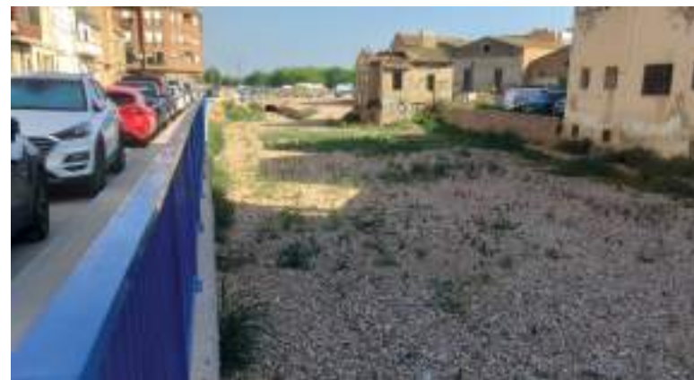
Estat actual del tram del barranc de la Font de la Rambleta al costat del carrer Pelayo (T. L.).

barranc destinades, segons es diu textualment en l'informe de l'Ajuntament, a "retornar el nivell del fons del barranc a la seua situació natural", està la "d'adequar l'eixida natural de l'aigua, gràcies a un estudi topogràfic, per a portar a nivell el sòl", per a això s'ha procedit a "l'ompliment de terres per a portar el llit al seu nivell des de l'interior del calaix de pluvials al pont entre Catarroja i Albal". I, a més, s'han cobert estes terres "amb una capa de 'machaca' -pedres o cudols- de 10 cm", segons es diu, "amb la finalitat d'evitar humitat". Per tant, i com és evident, s'ha pujat el nivell del fons del barranc, la qual cosa no casa amb "retornar el nivell del llit a la seua situació natural" ni amb el plantejament d'augmentar la capacitat d'este. El nivell 'natural' del fons del barranc estava abans més baix, com es pot comprovar en fotografies anteriors. En este sentit, crida l'atenció com, en el mateix informe, es remarca que "en cap cas s'ha enterrat el ba-