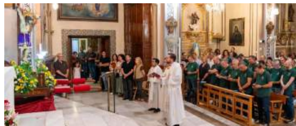
Pujà del Crist