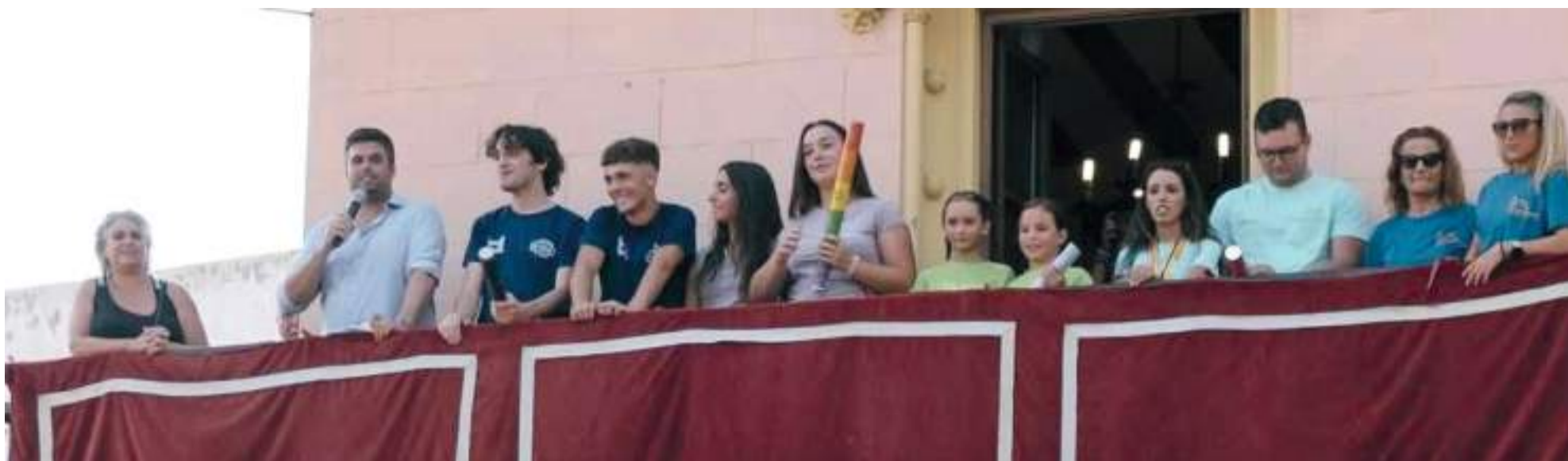
Alcalde, regidora i clavaries durant el pregó del inici de les festes a Alfara del Patriarca