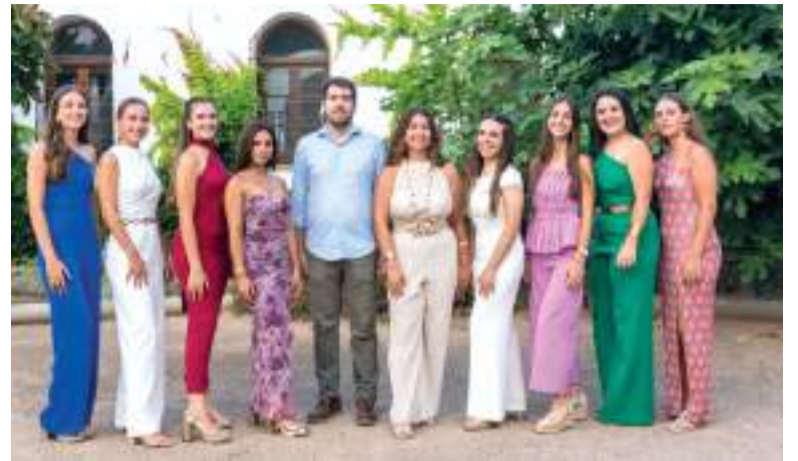
Representants de les festes