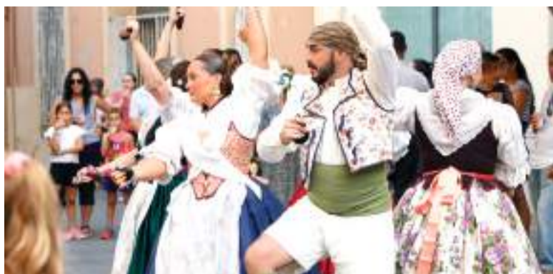
'Dansà' en l'Entrada de la Murta