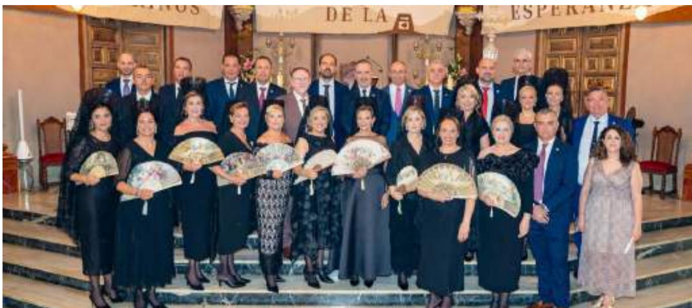
Processó de les Clavariesses de la Verge de l'Assumpció