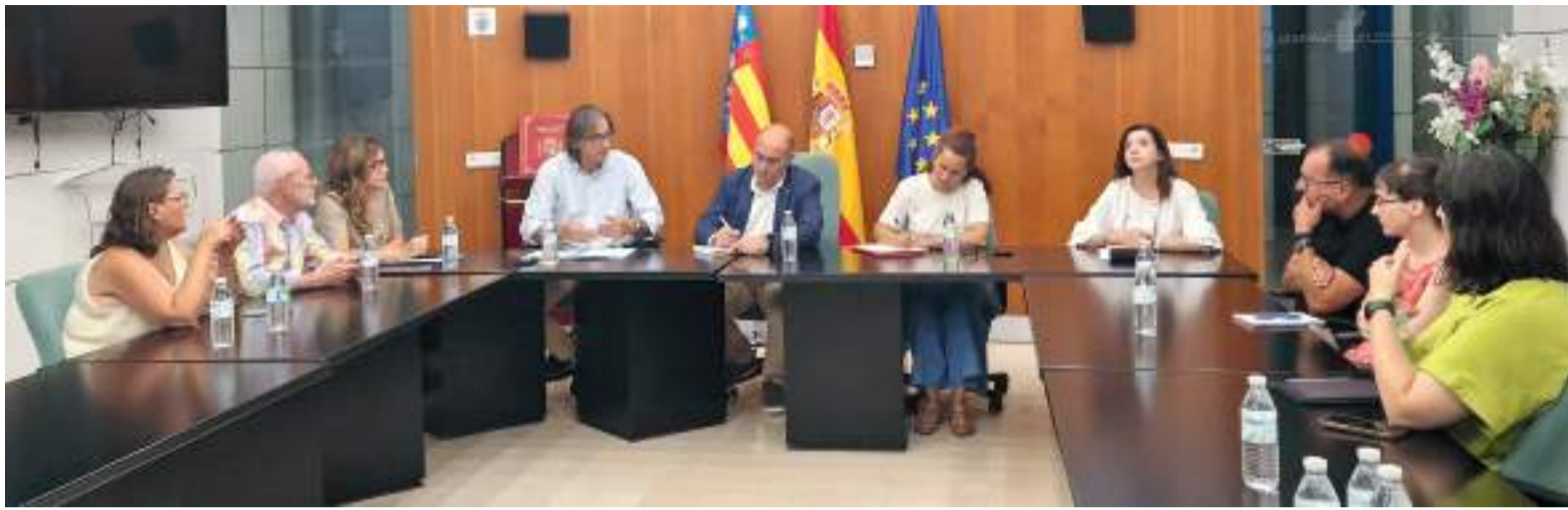
Reunió representants municipals