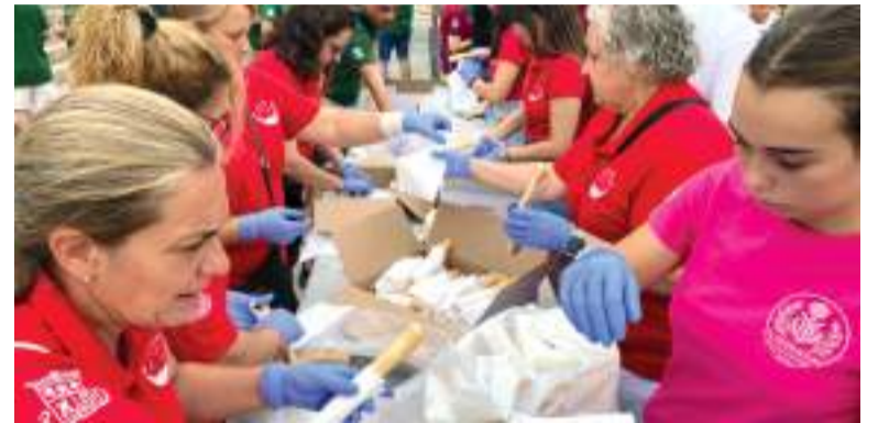
Repartiment d'orxata i fartons