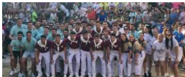
Dia del bou