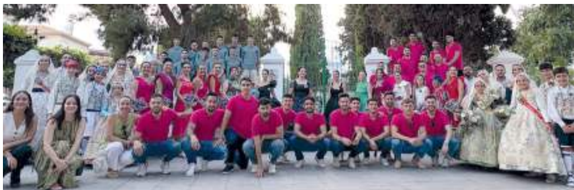
Ofrena de flors a Museros