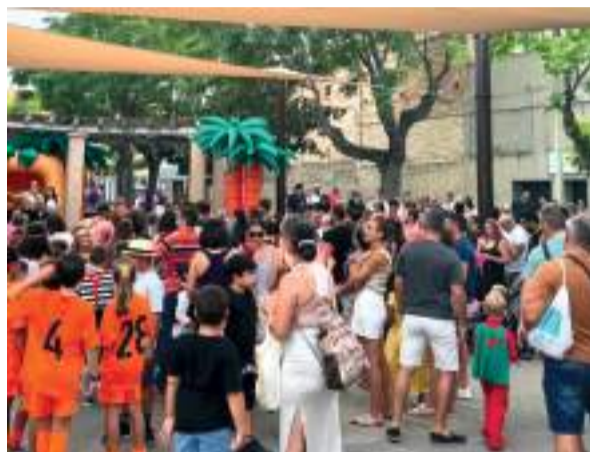
La cavalcada de disfresses infantil