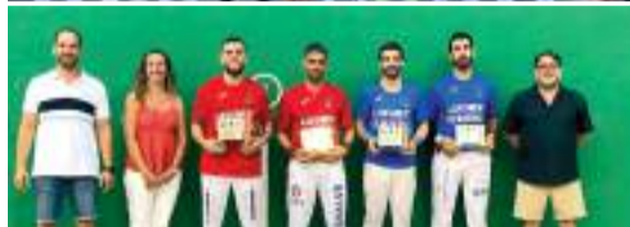
Campionat de galotxa i frontó