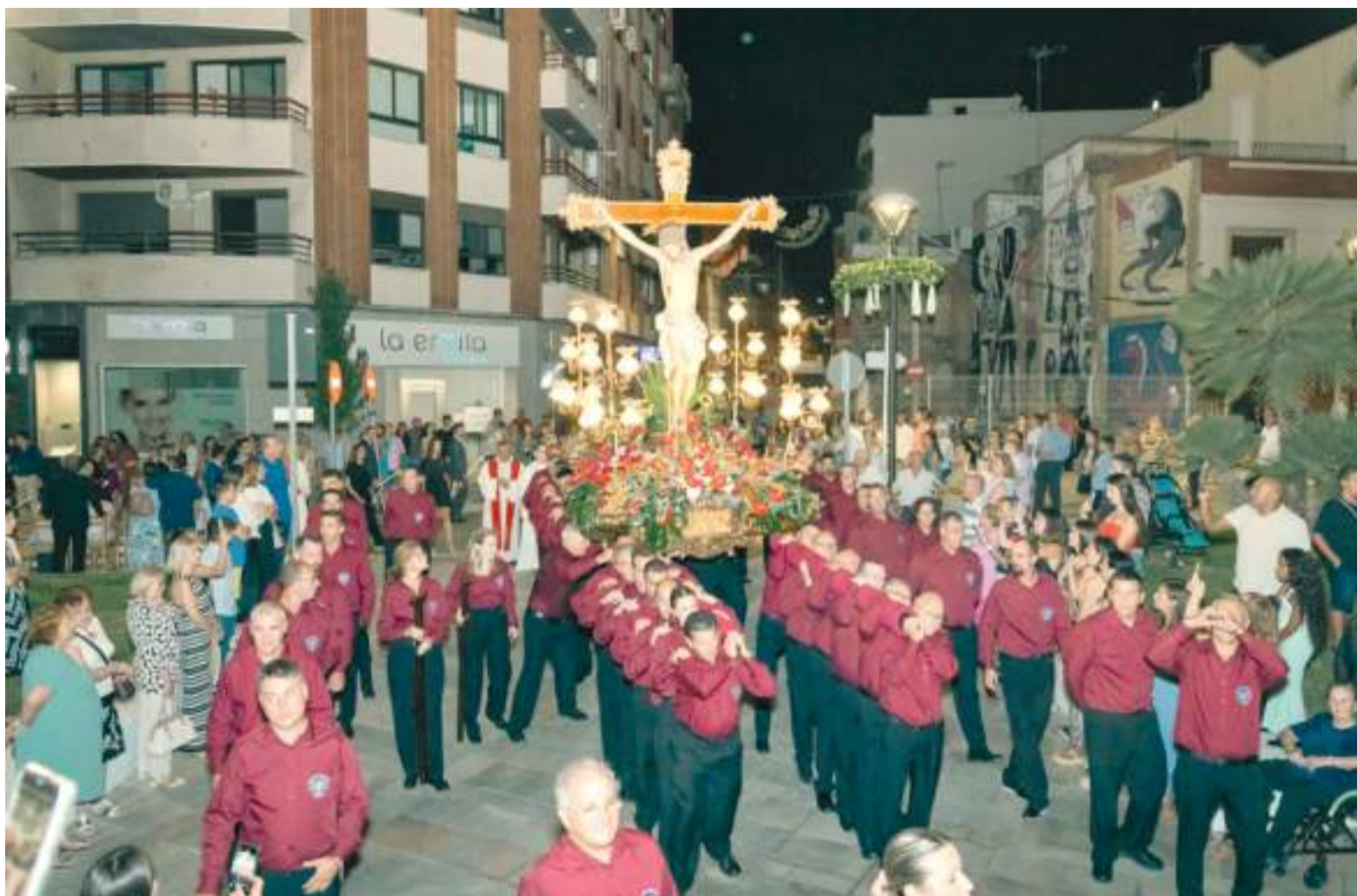
Gran devoció a les festes de Picassent

Enguany, i com a gran novetat, Picassent estrena un nou recinte de festes de més d'11.000 metres quadrats, ubicat al carrer Clara Campoamor