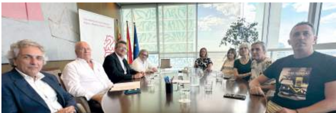
Reunió en la Generalitat amb associacions afectades

En l'informe, al forat d'eixida que es troba al final del carrer Pelayo, en direcció al camí de les Eres, es diu "arc que dona eixida a l'aigua que puga rebre el barranc", encara que més prompte sembla l'ull d'un pont sobre el barranc que, segurament, ha resultat tapat amb el pas dels anys pel camí que porta al túnel de les Barraques o de Joan XXIII, paregut al que va passar amb el pont del Camí Real entre Catarroja i Albal, els ulls del qual estan tapats des de fa molts anys, igual que el tram del barranc que hi havia a l'altre costat del pont, cap a l'avinguda Rambleta, que va resultar al final enterrat i substituït per una simple tuberia de desaigüe.