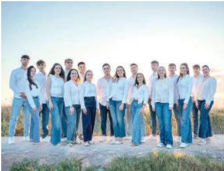
Festers i festeres 2025