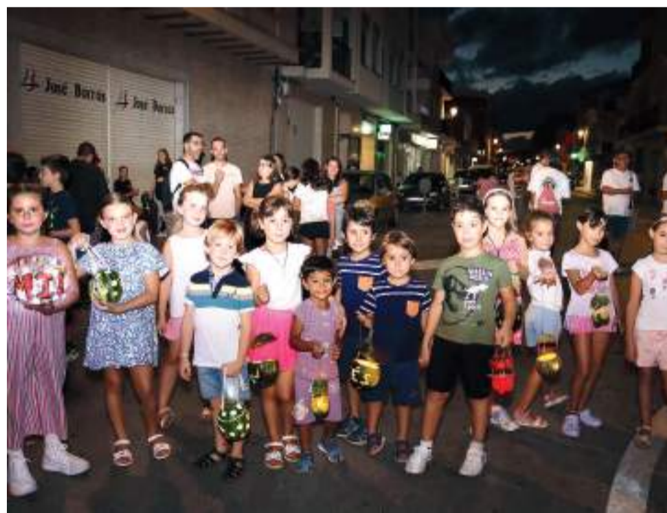
Nit de 'farolets'