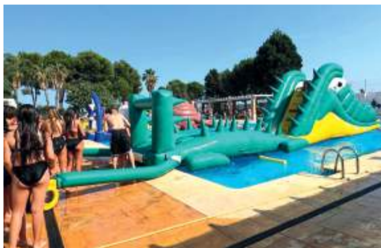
Dia dels Xiquets i de les Xiquetes de les festes de Museros