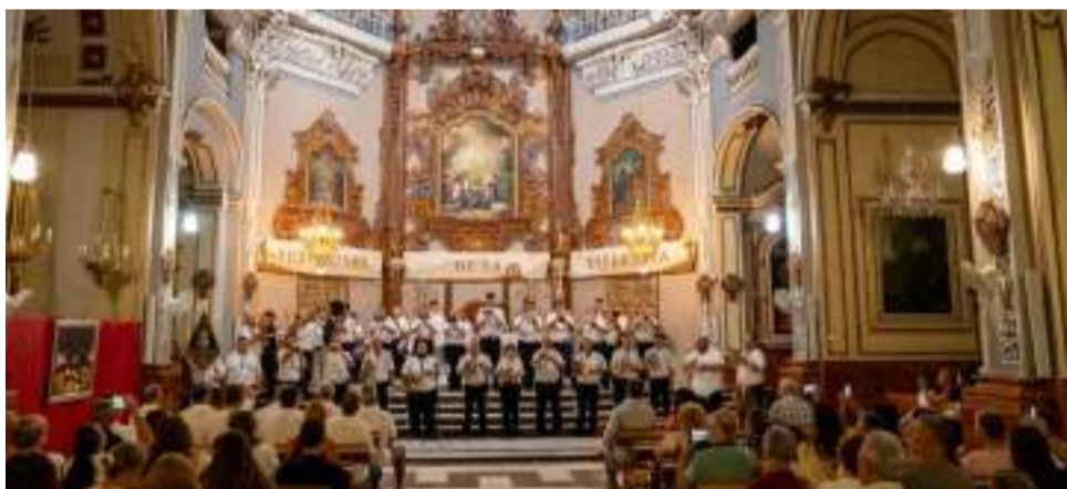
Concert de la Banda Simfònica i banda Cometas i tambors

Amb la traca final, el municipi es va acomiadar d'uns dies intensos en els quals la tradició i la convivència han sigut protagonistes, i on s'ha respirat un sentiment compartit: el d'una comunitat que, unida, sap celebrar la vida.