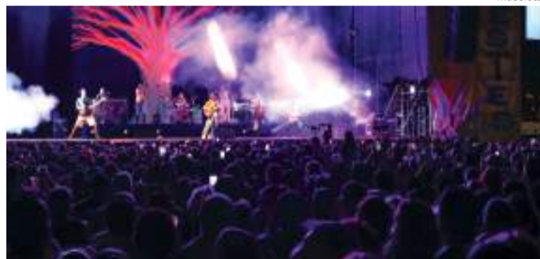
Concert en el recinte firal