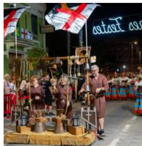
Desfilada Federació Moros i Cristians