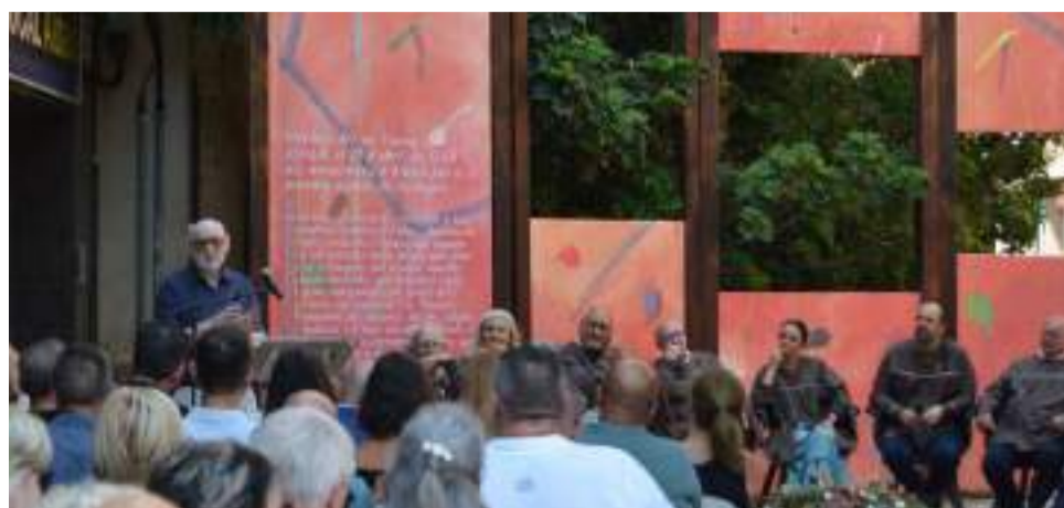
Tribunal del Comuner del Rollet de Gràcia