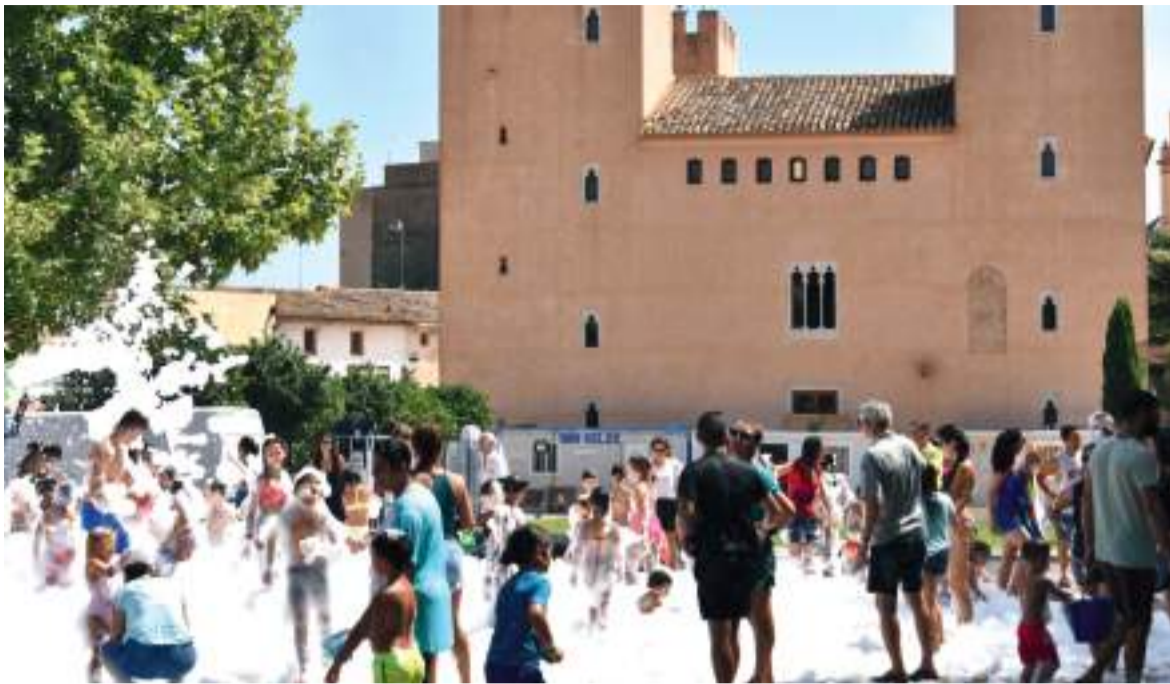
Imatge d'arxiu de les festes d'Albalat dels Sorells