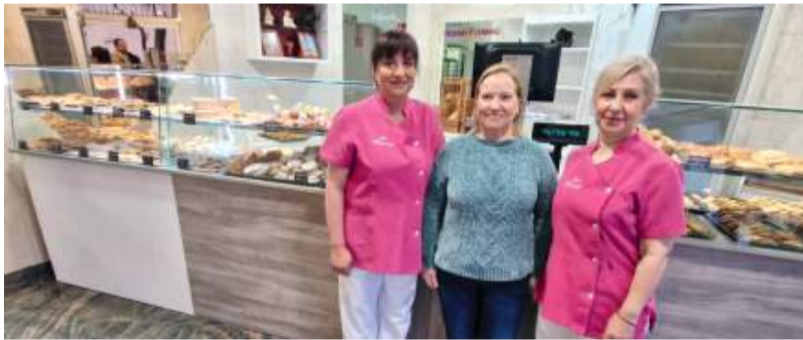
Comerç de Catarroja que es va veure afectat per la Dana i està de nou obert

EL PRIMER ESBORRANY ASSENYALA LES DESIGUALTATS AMB LES QUALS AFRONTEN EL FUTUR IMMEDIAT ELS NEGOCIS DE LA COMARCA