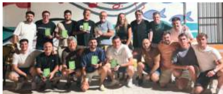
Campionat de Truc de Museros