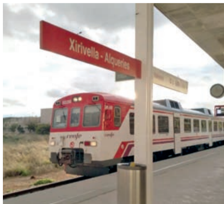
Tren de rodalia

Un de les fites més importants del pla és la construcció d'una nova estació en el sector de Bonaire (Aldaia). Esta futura instal·lació es dissenyarà com un edifici de viatgers, equipat amb dos andanes de 210 metres de longitud i 5 metres d'ample, connectats per un pas a distint nivell que serà plenament accessible. La nova esta-