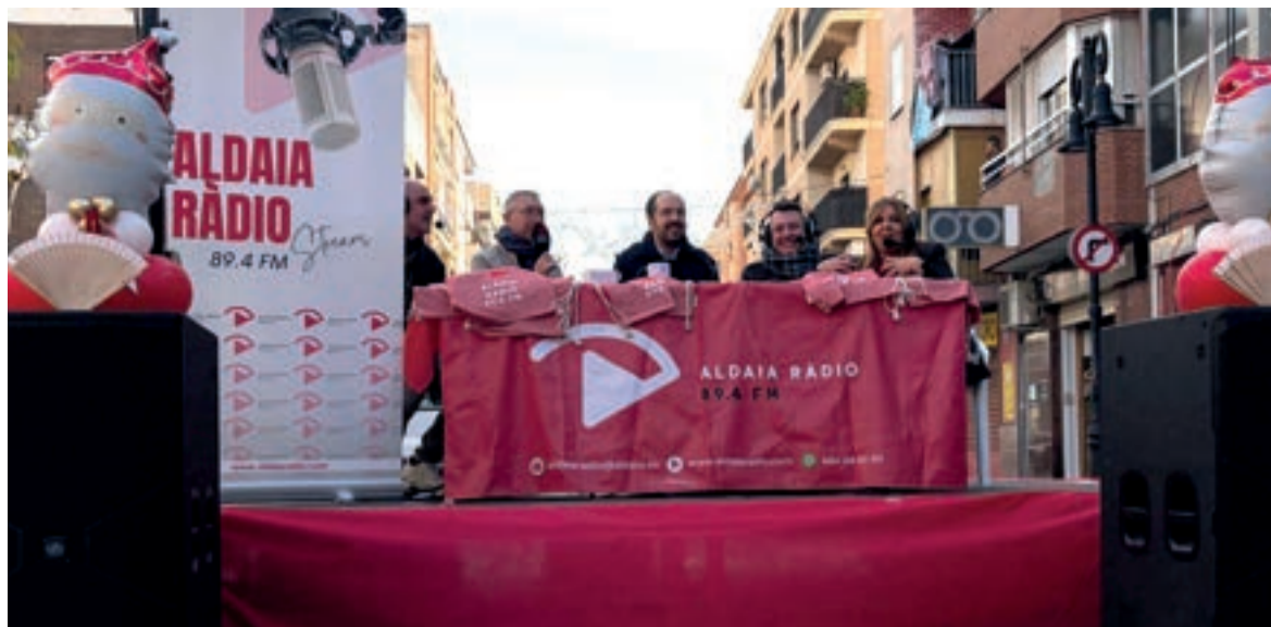
Jomada de ràdio a Aldaia