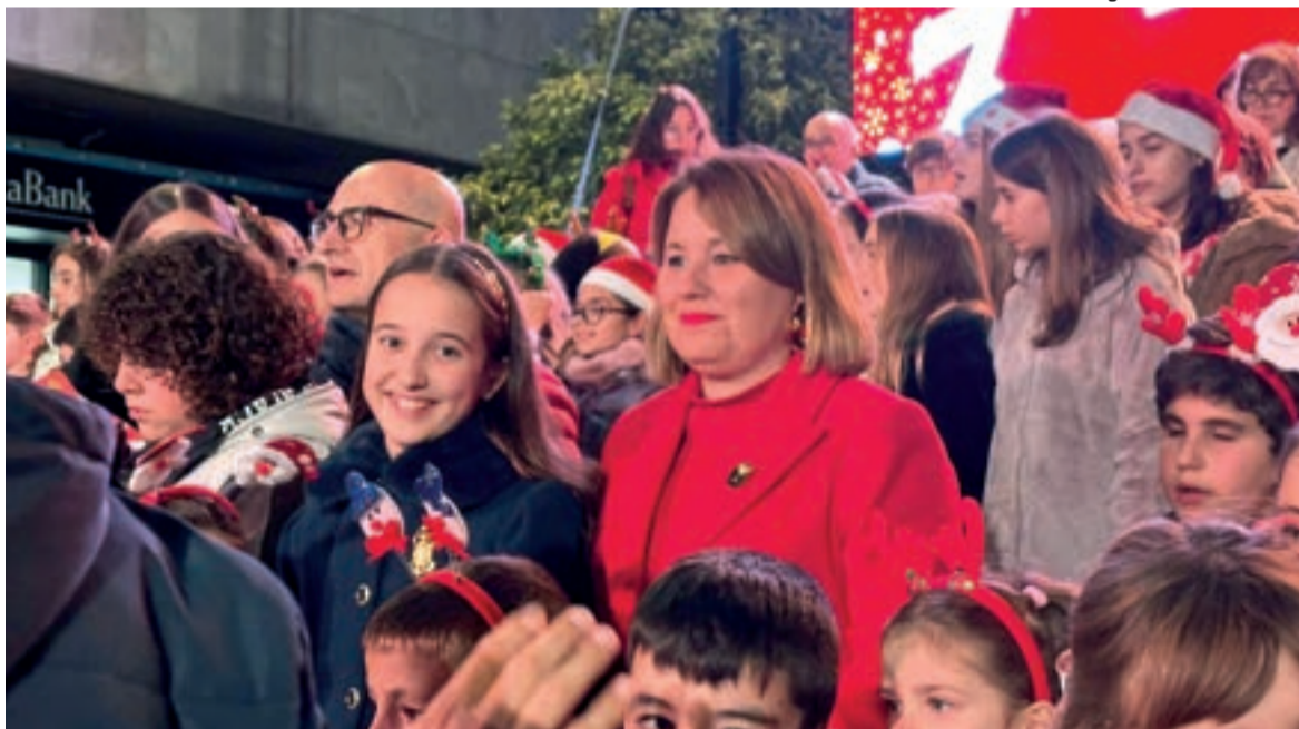
Molta participació en el pregó de Nadal d'Alaquàs