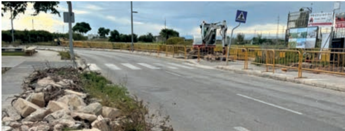
Foios inicia les obres de la ronda

posen una inversió de 186.701,31 euros (IVA inclòs) de l'Ajuntament de Foios i se centren en renovar les voreres per a millorar l'accessibilitat a les persones vianants, rehabilitar el carril bici per a assegurar un trajecte segur i continu, millorar l'enllumenat de tot l'espai perquè siga més sostenible o plantar altres espècies més adequades, com ara moreres, ja que ofereixen ombra sense generar problemes amb les arrels.