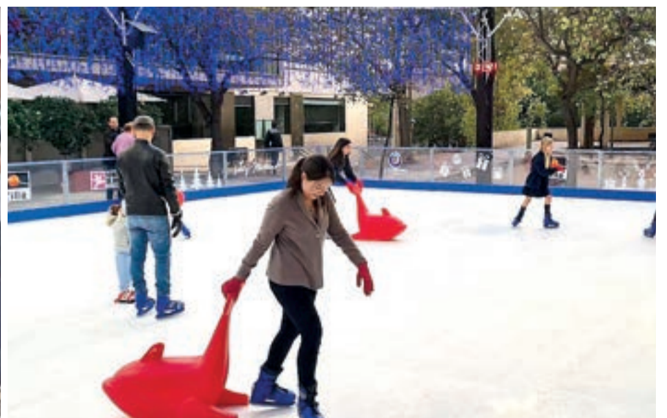
Pista de patinatge

de la Constitució (junt al Castell d'Alaquàs).