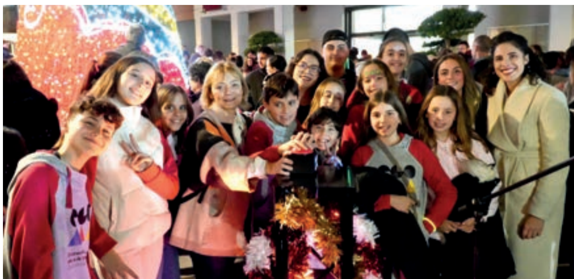
Encesa de llums a Quart de Poblet