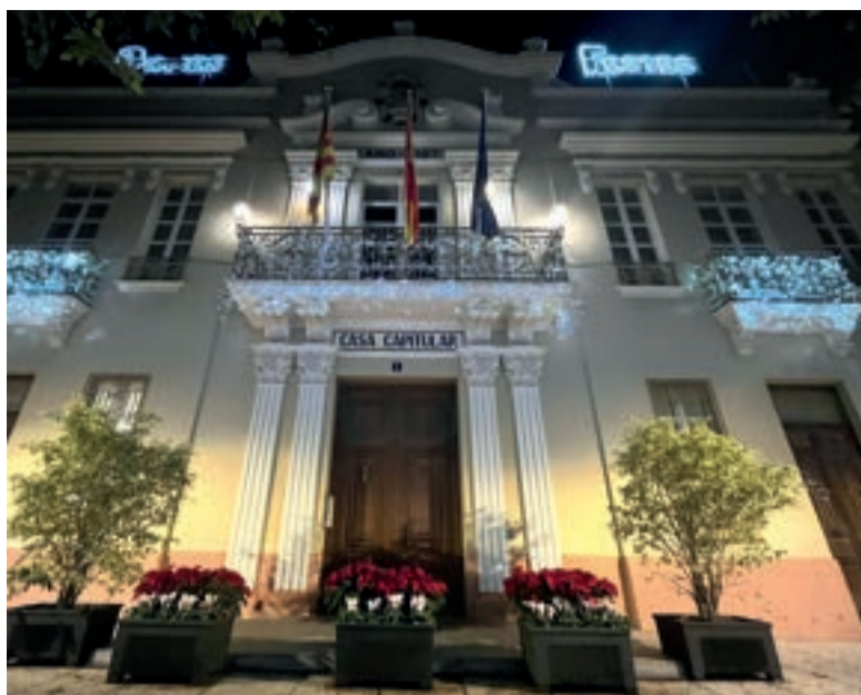
Ajuntament de Tavernes Blanques