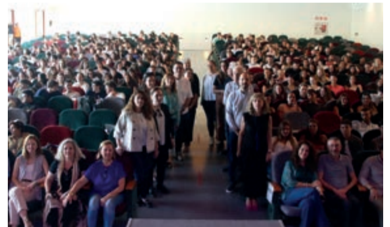
Alumnat d'Arquitectura i Enginyeria Industrial de la Universitat Politècnica de València a Aldaia

en el municipi des del pla urbanístic, posant especial èmfasi en l'ampliació del Cinturó Verd com a eix estructural i social.