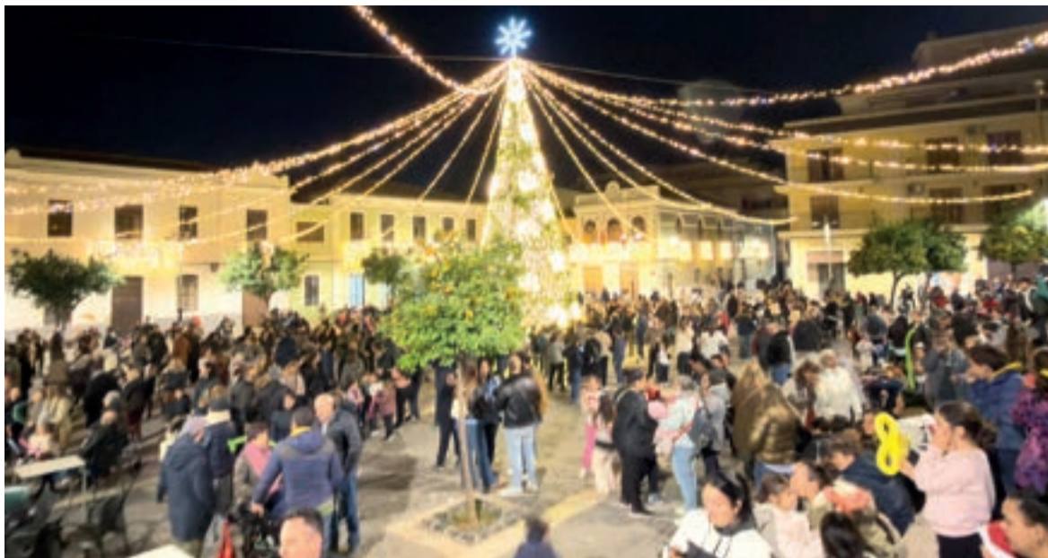
Encesa de les llums