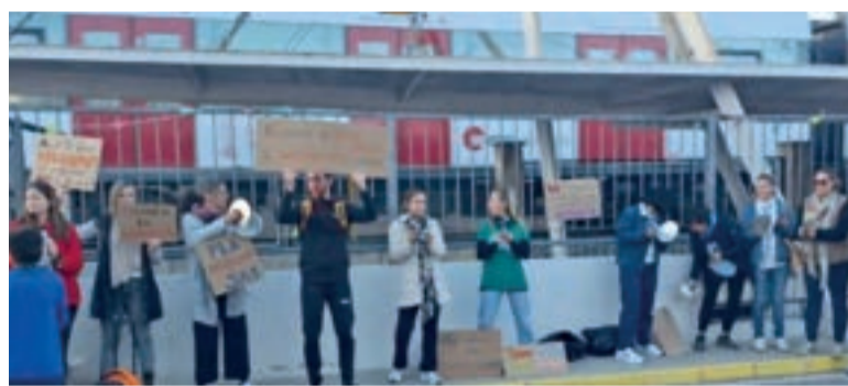
Concentració al CEIP d'Albat dels Sorells

centració a les portes exteriors del nostre centre a les 16:30h, on professorat del claustre, també amb famílies i alumnat que s'han volgut sumar, hem reivindicat els nostres drets laborals i les condicions de millora de l'educació pública. Les nostres reivindicacions són clares i compartides: des de les millores