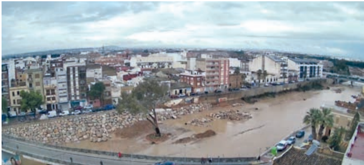
Paiporta ha instal·lat una càmera a temps real en el barranc de Poyo