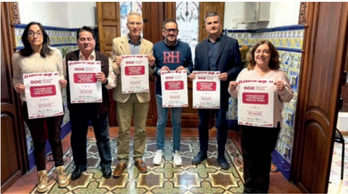
Representants de la Mancomunitat de l'Horta Sud, el Comissionat del Govern per a la reconstrucció i la Unió de Consumidors