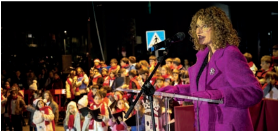
La inauguració i l'encesa es van realitzar amb l'actuació del cor que va cantar nades