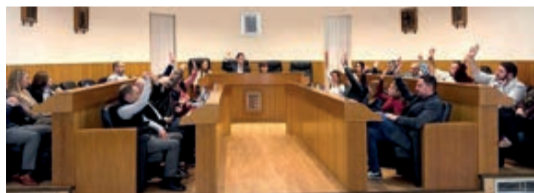
Ple Ajuntament de Paterna

Este lideratge en la contractació està impulsat especialment pel sector industrial, que concentra el 38% dels contractes, en coherència amb