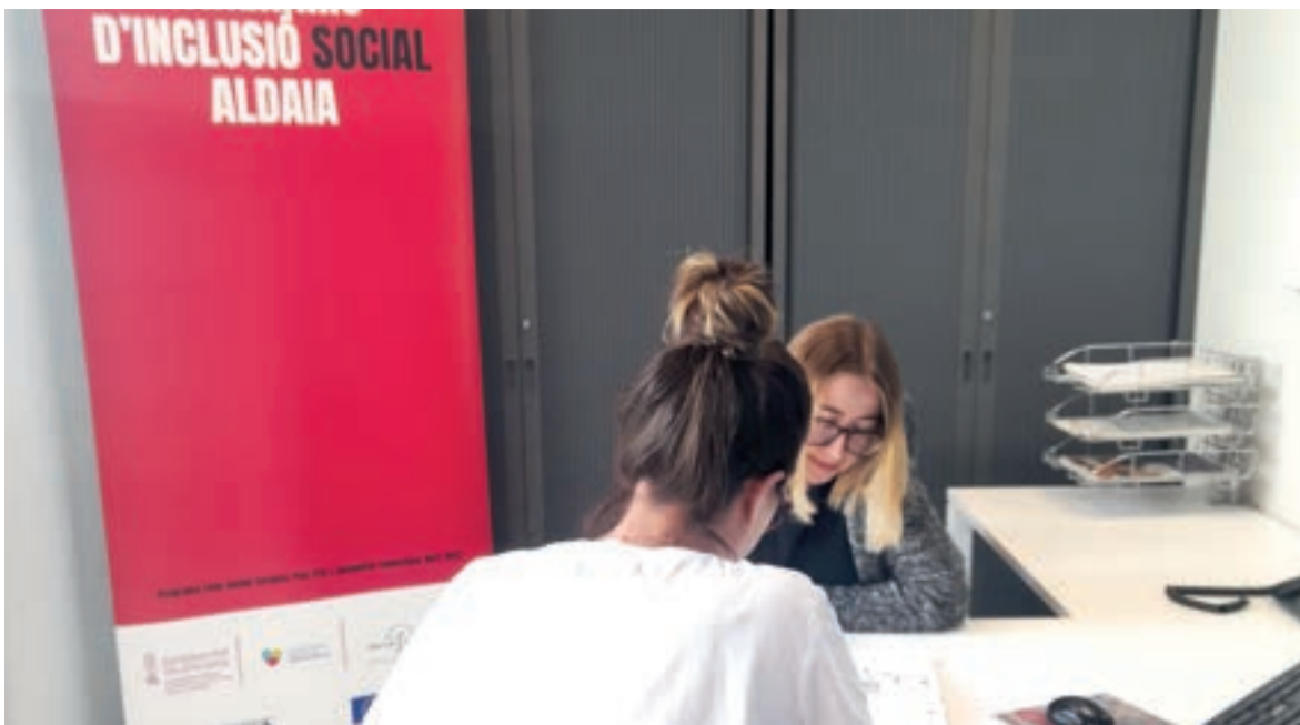
Oficina d'informació municipal