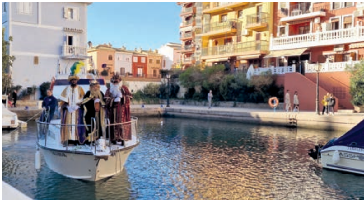
Els Reis Mags acudixen a Port Saplaya