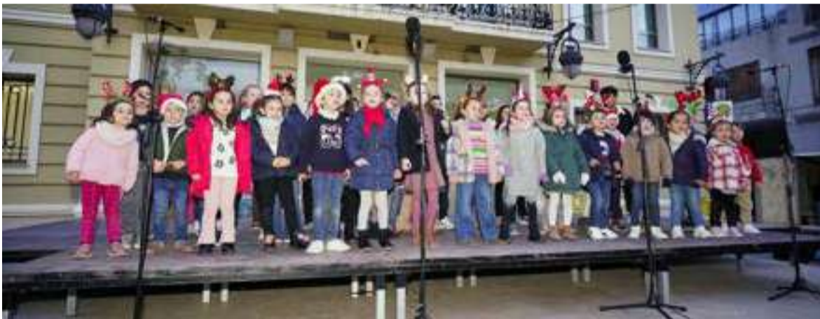
Cor infantil de la Unió Musical Pobla de Farnals

L'acte va concloure amb una fotografia de grup amb totes les persones donants i les autoritats, així com amb un vi d'honor que va posar fi a una jornada dedicada a reconèixer la solidaritat de totes aquelles persones que fan possible que la donació de sang continue salvant vides.