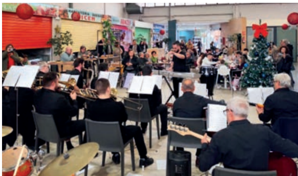
Concert en el mercat