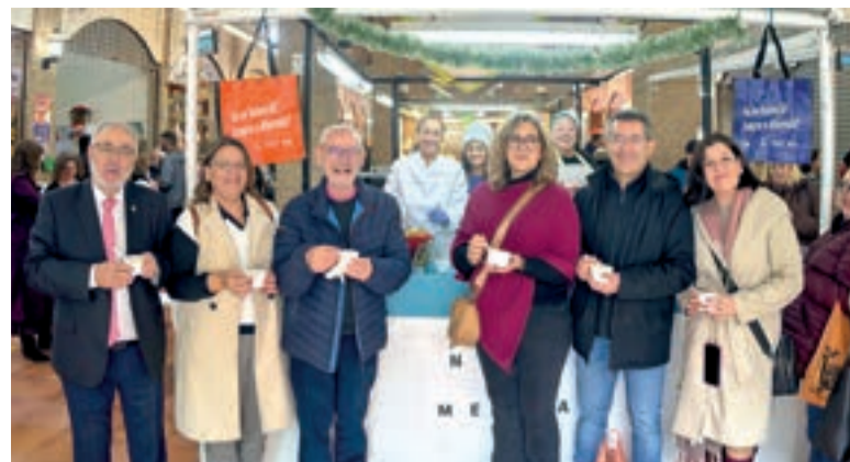
Nadal al Mercat d'Alboraia

El programa complet, disponible en valencià i castellà, pot consultar-se en la pàgina web municipal www.alboraya.es .