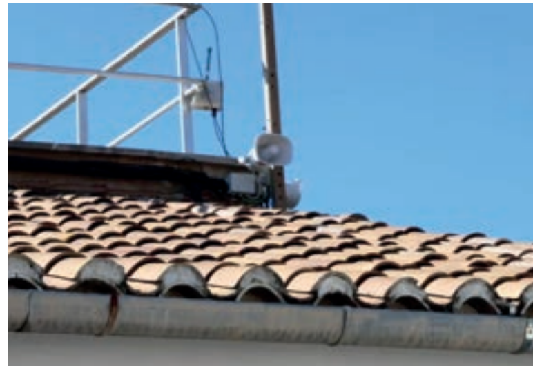
Catarroja ha posat un sistema de megafonia pels barris per a avisar a la població