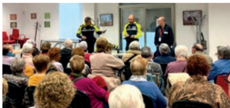
Xarrades a Mislata

Aquestes activitats no sols proporcionen informació útil a la ciutadania, sinó que també con-