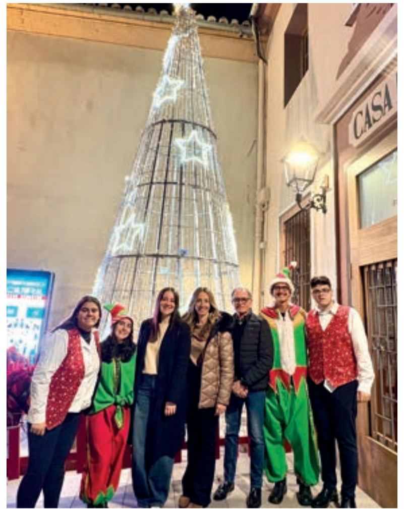
Encesa de l'arbre de Nadal

Finalment, el 5 de gener els carrers del municipi tornaran a omplir-se d'emoció amb la gran cavalcada dels Reis d'Orient, que posarà el fermall final a unes festes pensades per a reforçar la convivència, l'esperit nadalenc i l'orgull de pertinença a Museros.