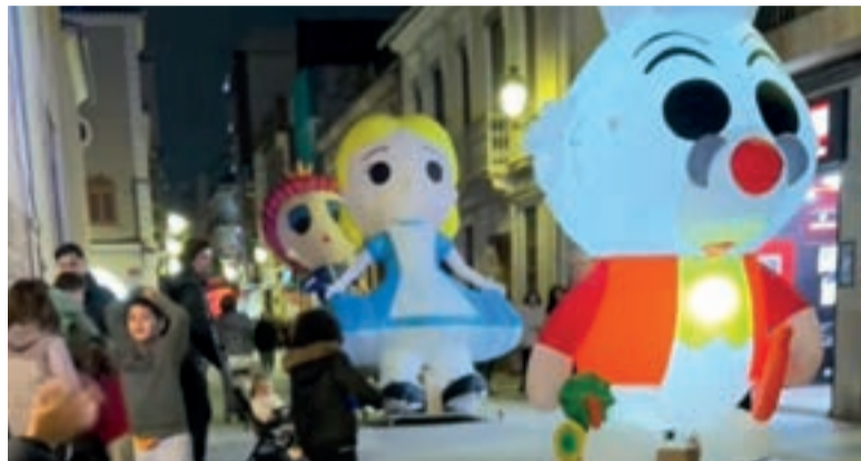
Festa a Paiporta per l'encesa de llums