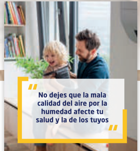
CALIDAD DEL AIRE

“ No dejes que la mala calidad del aire por la humedad afecte tu salud y la de los tuyos ”