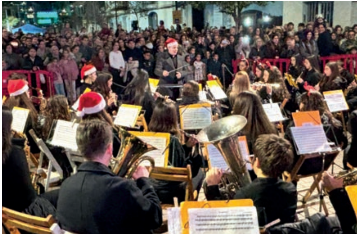
Pregó de Nadal amb concerts

PARTICIPEN EN EL PREGÓ NOMBROSOS CORS INFANTILS DE LA POBLACIÓ