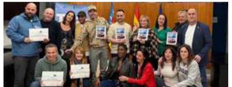
Premiats i participants de la ruta de la tapa

El fil conductor del projecte ha sigut la dramatització, i per això han participat en diferents tallers de teatre, expressió corporal i cor.