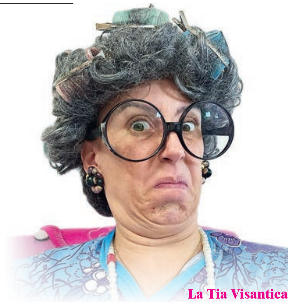
La Tia Visantica

En esta pàgina es poden veure moltes coses i entre elles. on realitzaré els següents shows. Us recomane visitar-la.