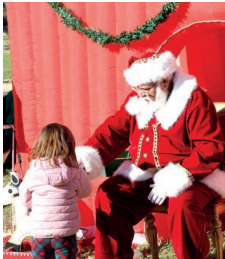
Imatge del Nadal de l'any passat

del 6 de desembre al 6 de gener, romandrà instal·lada la Fira d'Atraccions de Nadal, ubicada a l'aparcament del Mundial 82.