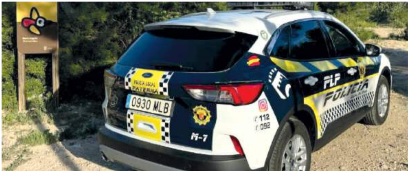
Policia Local a la Vallesa

L'objectiu d'esta jornada de convivència, impulsada per uNICEF Comitè Comunitat Valenciana en coordinació amb les localitats del la xarxa de Ciutats Amigues de la Infància de la província de València i que va tindre lloc en el Parc Central, va ser compartir un espai de trobada, joc i reflexió sobre les conseqüències d'esta tragèdia i la seua implicació en el procés de reconstrucció des de la mirada de els/as més xicotets/as i jòvens. Un acte en el qual s'ha comptat amb la col·laboració d'un important grup de voluntaris d'entitats locals.