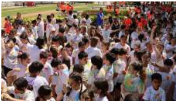
Nombrosos xiquets i xiquetes van participar de les activitats