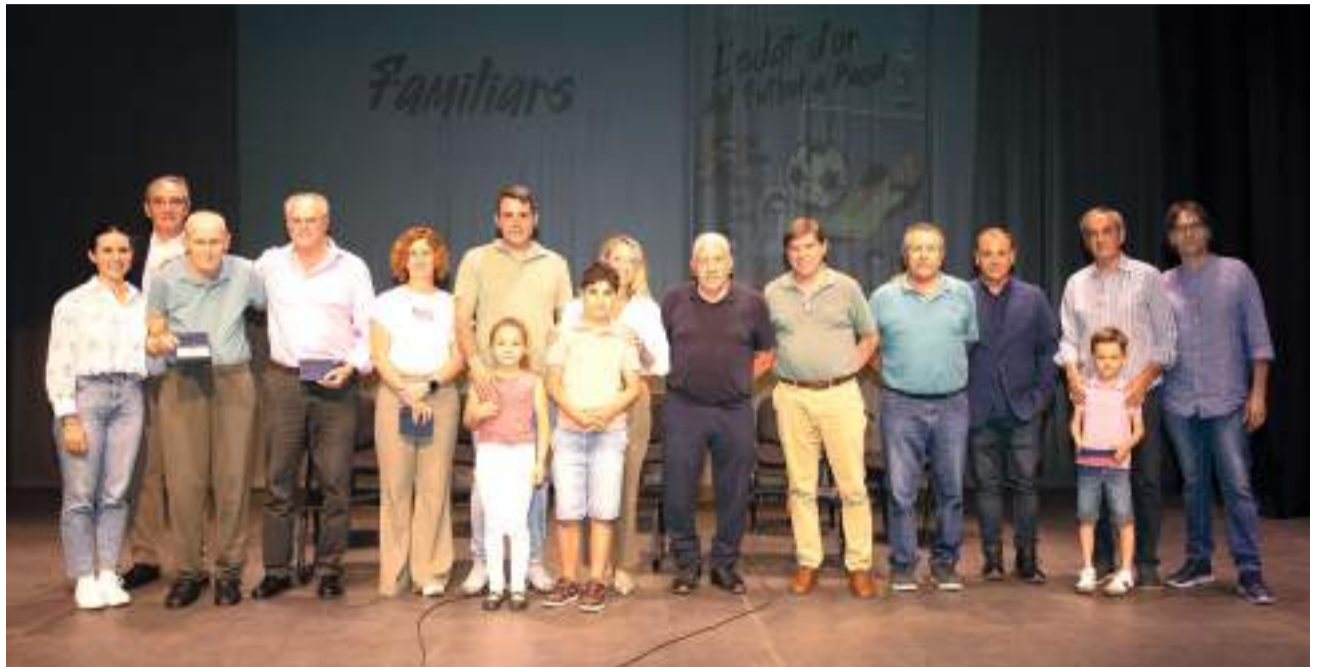
Reconeixement a tota una vida esportiva

La segona part de la trobada va comptar amb el públic i els protagonistes d'aquella edat daurada. Un acabar ple de nostàlgia i alegria per a tots els presents. Un acte homenatge que corona la dècada daurada de l'esport de Puçol.