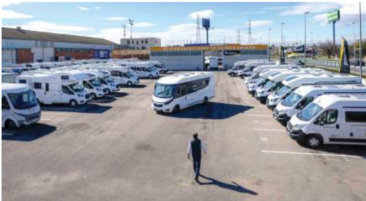
AC-LLAR cuenta con los modelos más recientes del mercado