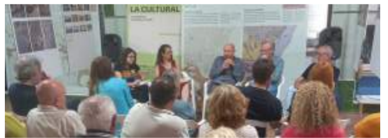
Participants en la taula redona i assistents (El Meridiano de l'Horta).

Es dona a més la circumstància que la mateixa empresa té un altre local llogat al carrer Ramón y Cajal de Catarroja que, encara que també va resultar afectat per la 'barrancà', ho va ser en molta menor mesura, de manera que, segons la propietària, "podrien haver tornat a obrir en pocs dies, com van fer altres negocis pròxims, però no ho han fet". En este cas, i en vista del temps transcorregut, la propietària ha presentat una demanda judicial. Este periòdic es va posar en contacte amb l'empresa per a recaptar més informació al respecte per part dels seus responsables, però no ha obtingut resposta. Únicament va poder confirmar, a través d'una persona d'atenció al client, que no tornarà a obrir la botiga d'Albal per raons econòmiques. En el cas de Catarroja, l'empresa va enviar un comunicat a la propietària dient que deixava de pagar el lloguer "fins que esta situació acabe, degut a les excepcionals circumstàncies produïdes per la Dana" i a "no disposar dels servicis mínims per a poder desenrotllar l'activitat".