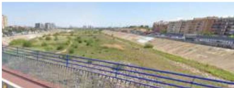
L'actual passarel·la en l'avinguda del Cid

A més, enguany el segon cap de setmana de festival va coincidir amb un esdeveniment molt especial a Mislata, el concert de la mítica banda valenciana L'Arrel, en el Recinte Firal el dia 24 de maig.