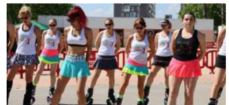
L'esport també va estar present