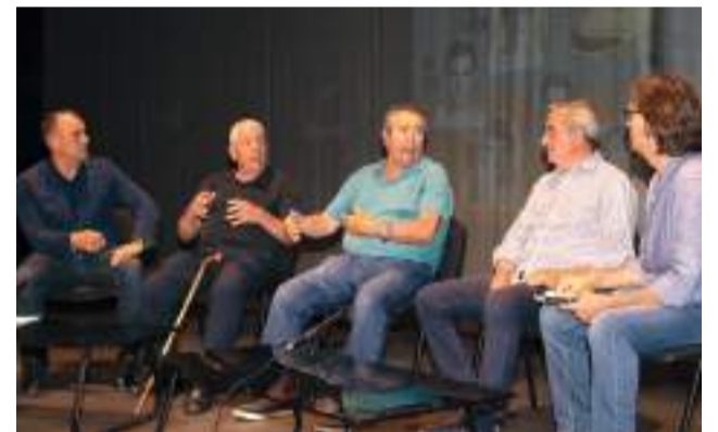
Les anècdotes contades per protagonistes van encantar al públic assistent