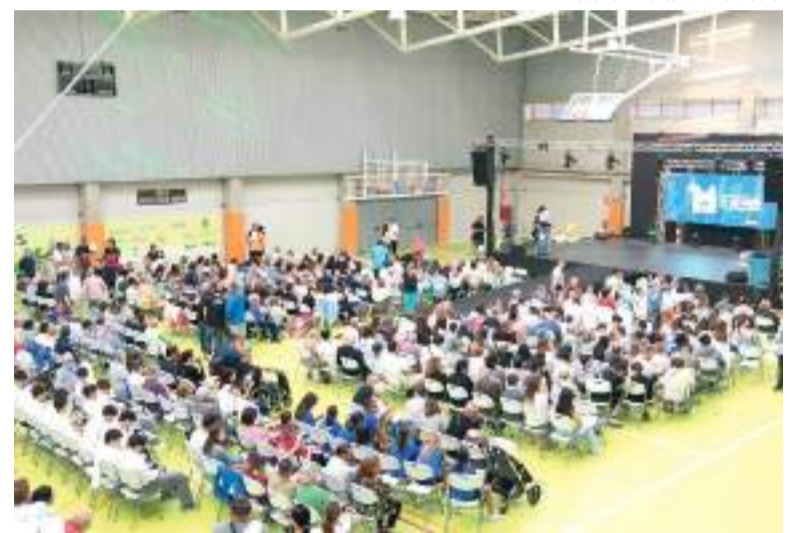
Molta participació en l'acte

La vetlada va servir també per a presentar l'inici del Pla Municipal d'Esports 2025-2028, que es