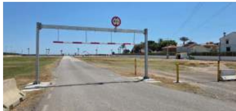
Control de galibó en el solar entre PlayPuig i PuigVal