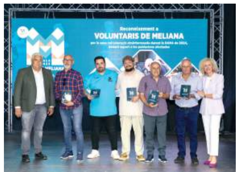
Reconeixements durant la Gala