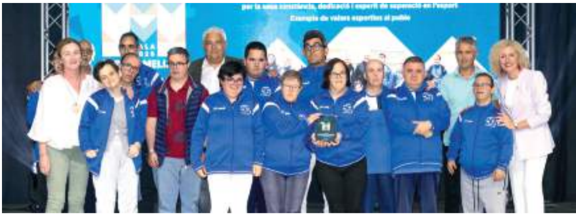
Reconeixements a esportistes adaptats