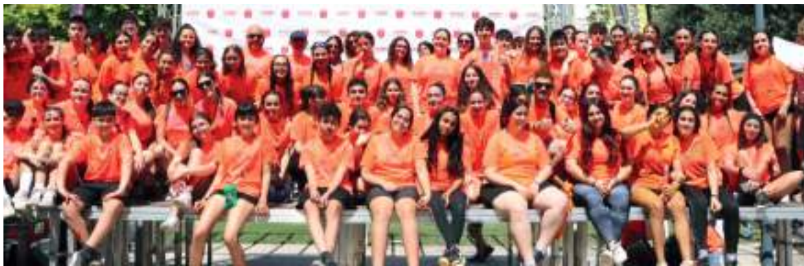
L'acte va comptar amb la participació i organització d'un gran nombre de voluntaris