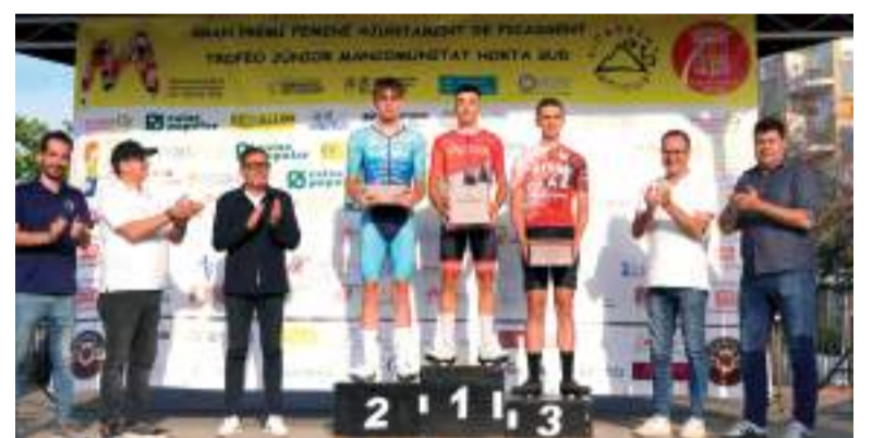
Entrega de trofeus

"Aquesta prova s'ha anat consolidant en quatre anys i en 2025 hem tingut una gran participació. Agraïsc enormement el treball que fa el Bici Club Picassent, que no sols fomenta l'esport entre la joventut sinó que fa comarca i contribueix a la cohesió amb aquesta prova intermunicipal",