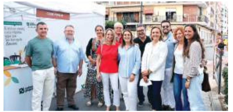
Alcaldessa i regidors durant la Fira de l'any passat

DEL 6 AL 8 DE JUNY, L'AVINGUDA DE LA MANCOMUNITAT ES CONVERTIRÀ EN EL GRAN APARADOR DEL COMERÇ LOCAL