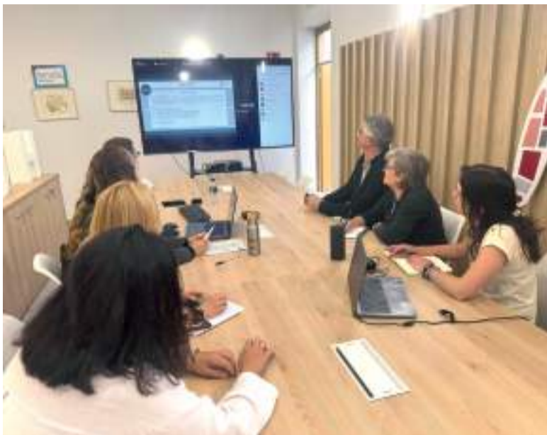
Primera sessió del curs ERASMUS+ sobre catàstrofes, centrada en les inundacions