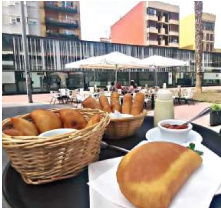
Els bars oferiran les seues varietats en la carta