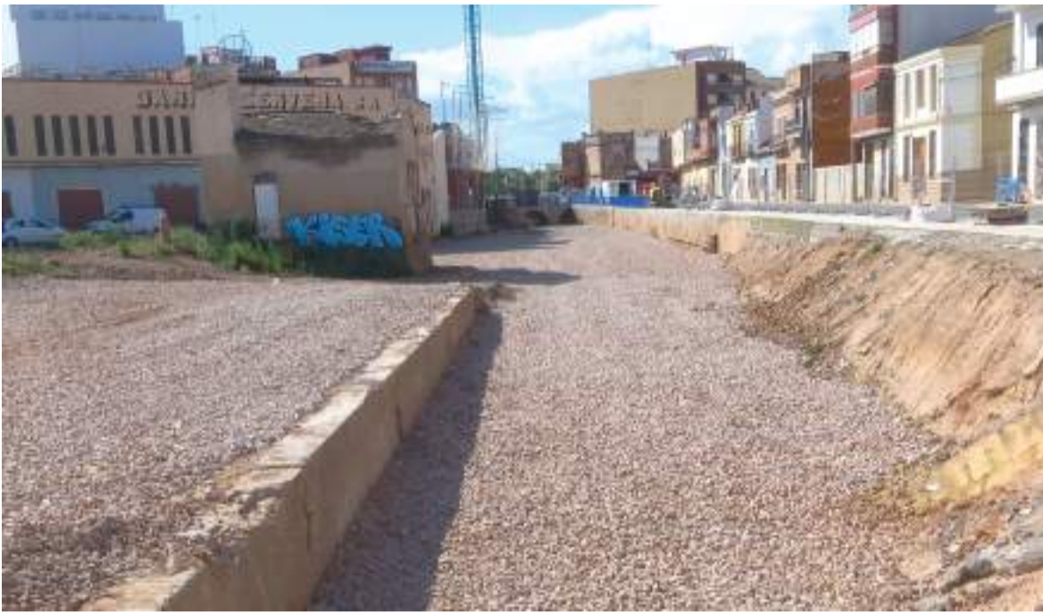
Estat actual del tram del barranc de la Font de la Rambleta al carrer Pelayo de Catarroja (T. L.).