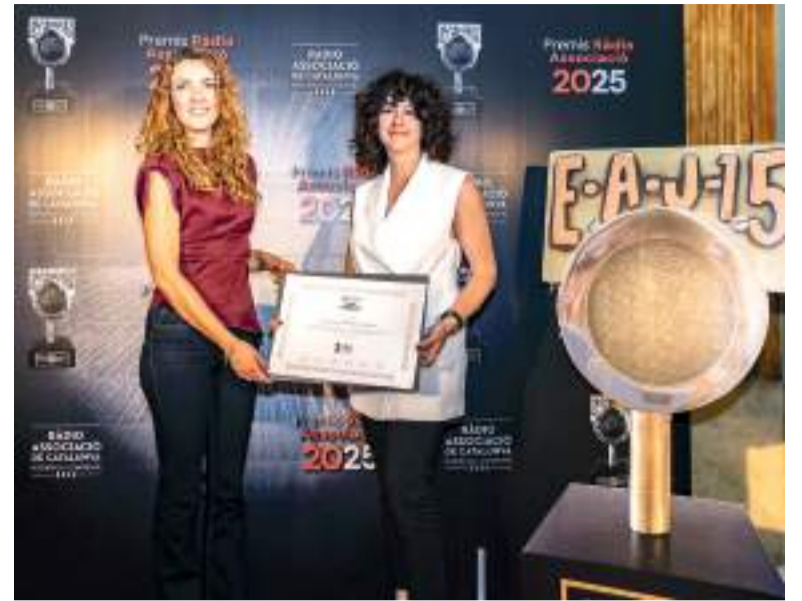
Regidora de comunicació i directora d'Aldaia Ràdio