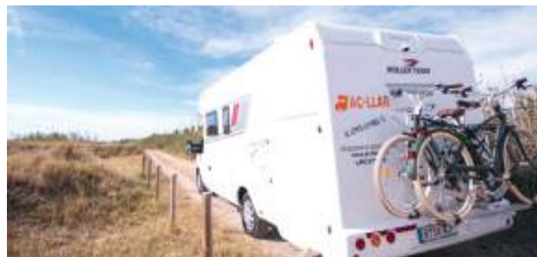
Viajar en caravana es un plan ideal para las familias

Con su participación en la feria, AC-LLAR no solo refuerza su presencia de marca, sino que reafirma su compromiso con el desarrollo del sector a nivel autonómico, en una apuesta por la innovación, la atención totalmente personalizada y una red de servicios diseñada para responder a las necesidades reales de los usuarios.