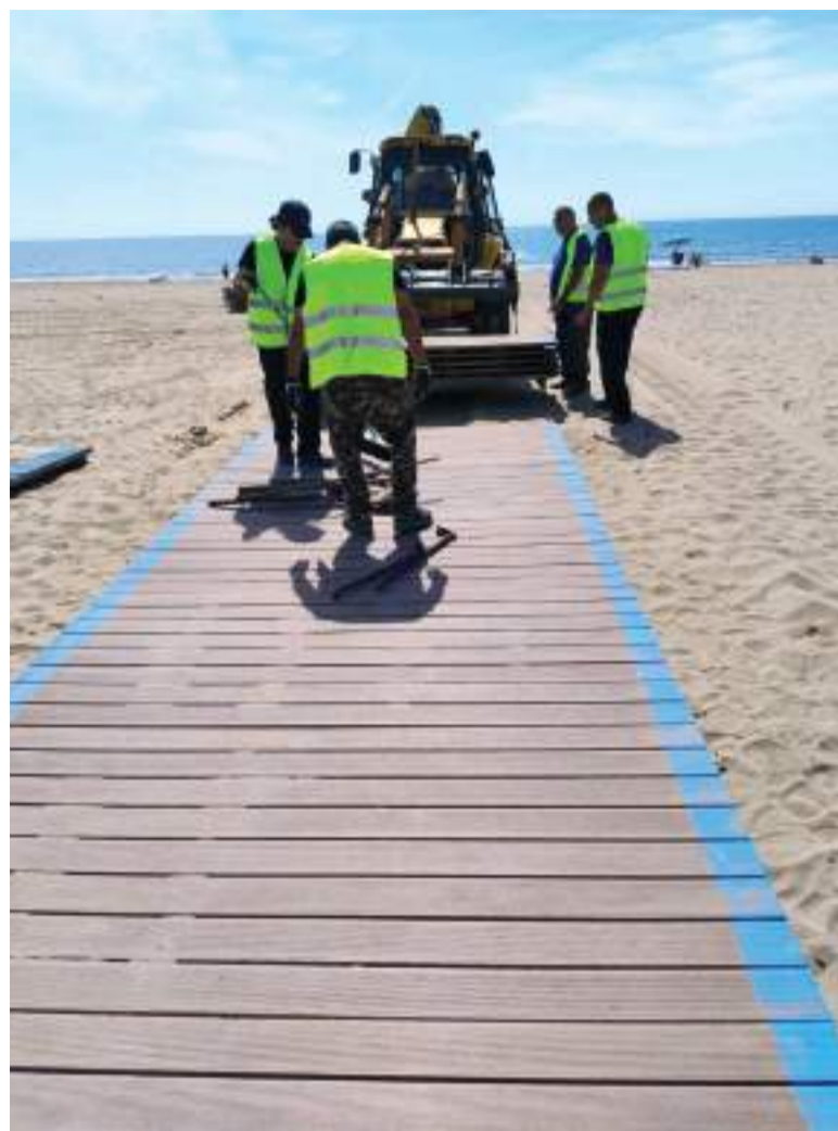
Preparació a les platges de La Pobla de Farnals

D'altra banda, la ciutadania també pot consultar l'estat de la meteorologia a través d'avamet.org i MeteoXarxa, amb imatges i dades en temps real de les dues estacions instal·lades a La Pobla de Farnals.