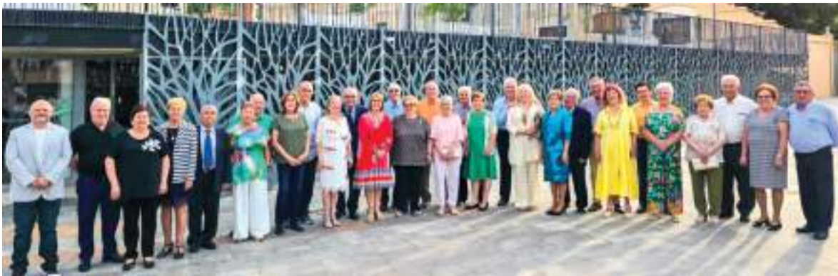
Primer acte del mes dels majors, Bodes d'Or