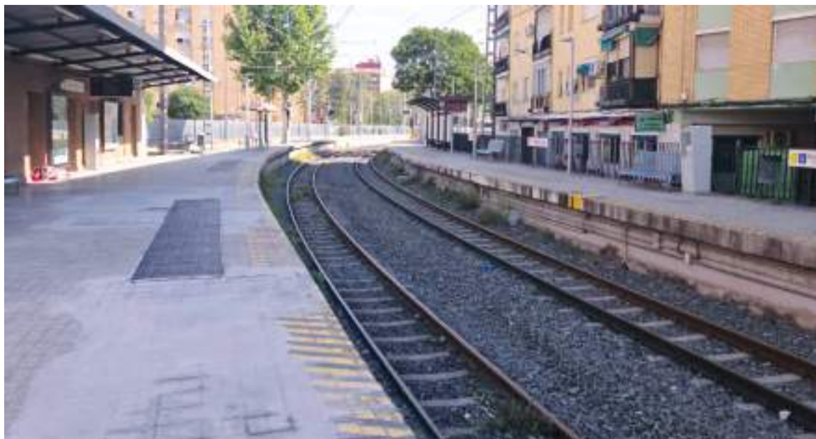
Estació de Torrent