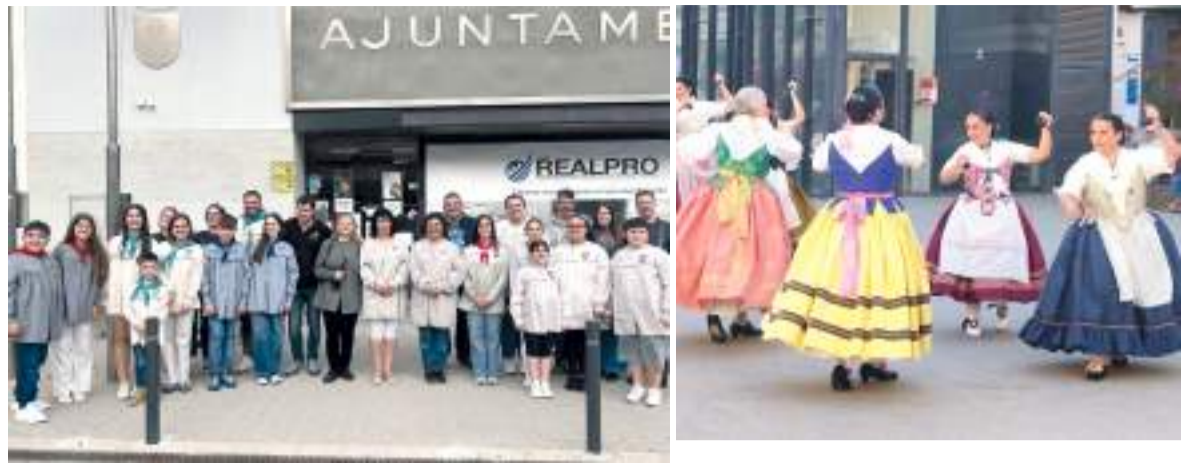
Algunes de les activitats realitzades en la Setmana Cultural en la població de Sedaví

LA 44 EDICIÓ S'HA CELEBRAT DURANT LA SETMANA DEL 12 AL 18 DE MAIG