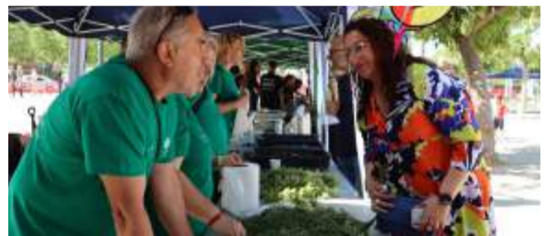
Es van fer tallers sobre la importància del medi ambient i el reciclatge