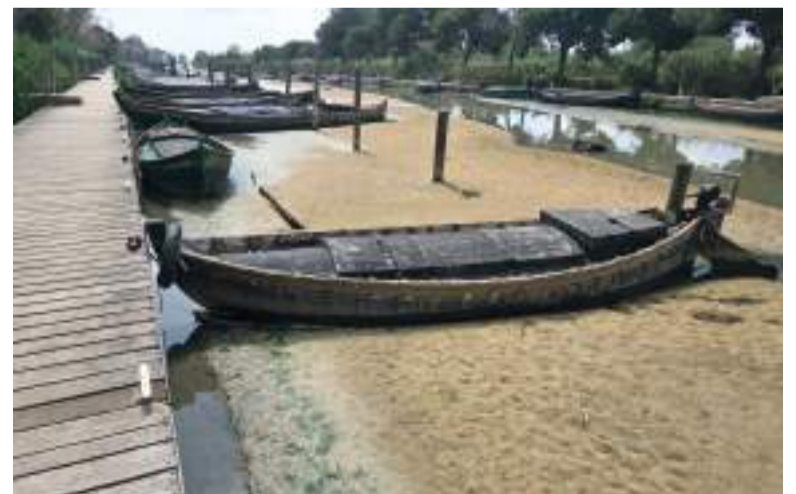
El fang ha deixat les barques atrapades en el Port de Catarroja