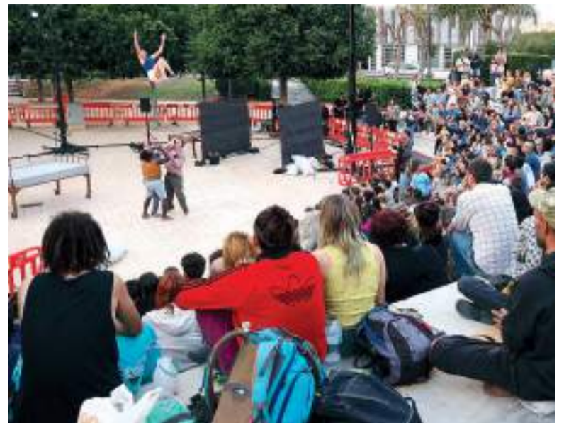
Espectacle a Mislata

El festival també va portar als carrers de Mislata l'espectacle teatral d'Oca&Cia. Welcome & Sorry; els robots gegants itinerants de Actua Produccions, amb la seua proposta Robobops; les acrobàcies de Kanbahiota troupe amb Volant vinc; el concert en acústic de la jove i emergent artista Abril; l'espectacle itinerant de música i acrobàcies de Circ Pistolet, A peu de carrer; la proposta escènica