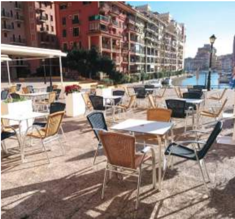
Participen bars dels tres nuclis de la població