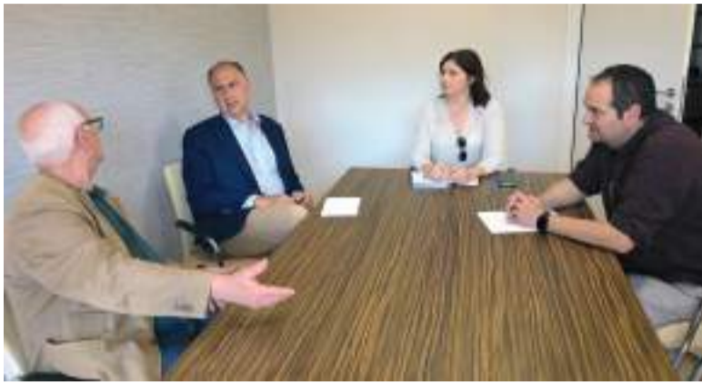
Reunió del conseller, alcaldessa i regidors a Paiporta