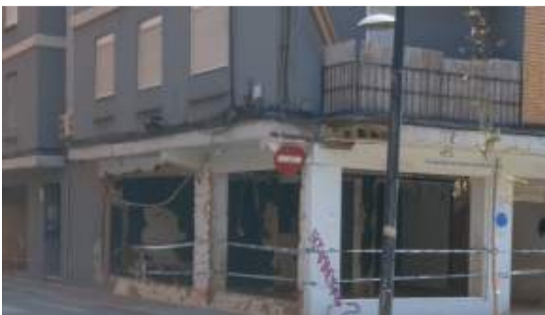
Estat actual del local comercial arrasat per la 'barrancà' a Albal.

Cal recordar així mateix al respecte que prop del pont de la carretera, en la part d'Albal, hi havia un taulell en una paret en el qual s'assenyalava el nivell al qual va arribar l'aigua en eixa zona en la riuada de 1957, la marca estava a l'altura de dos metres i vint-i-cinc centímetres, el qual es va superar en la 'barrancà' del 29-O en arribar fins als quasi tres metres