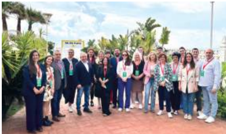
Representants dels municipis i de la Mancomunitat junt al grup de representats europeus

També varen parlar sobre enfocaments culturals vinculats a la sostenibilitat i la regeneració urbana,