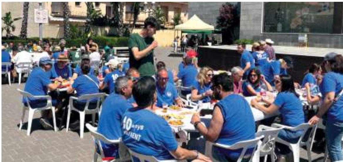
Jornada de germanor