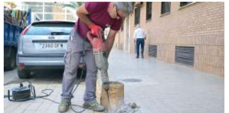
Obres als carrers de Paiporta

L'alcaldessa i el conseller van coincidir en la importància de buscar solucions ràpides i efectives, en coordinació entre la Generalitat i els ajuntaments, per garantir una recuperació completa i segura del territori afectat.