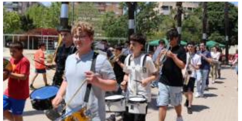
El dia va comptar amb la participació de les bandes de música