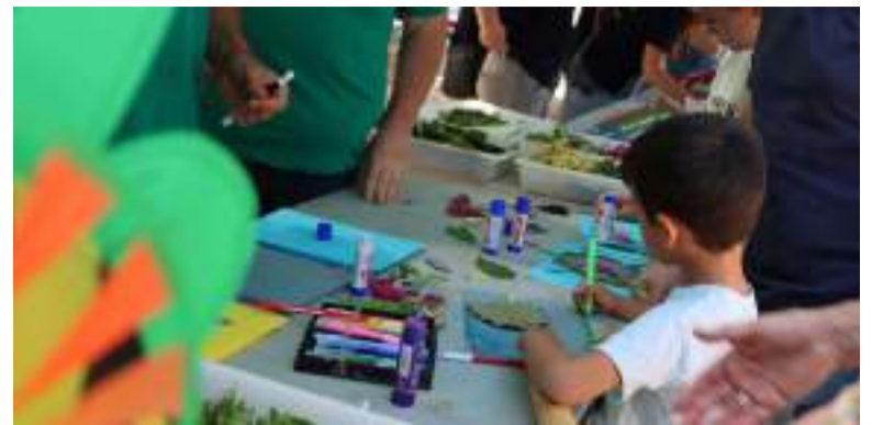
Es van realitzar tallers per a totes les edats