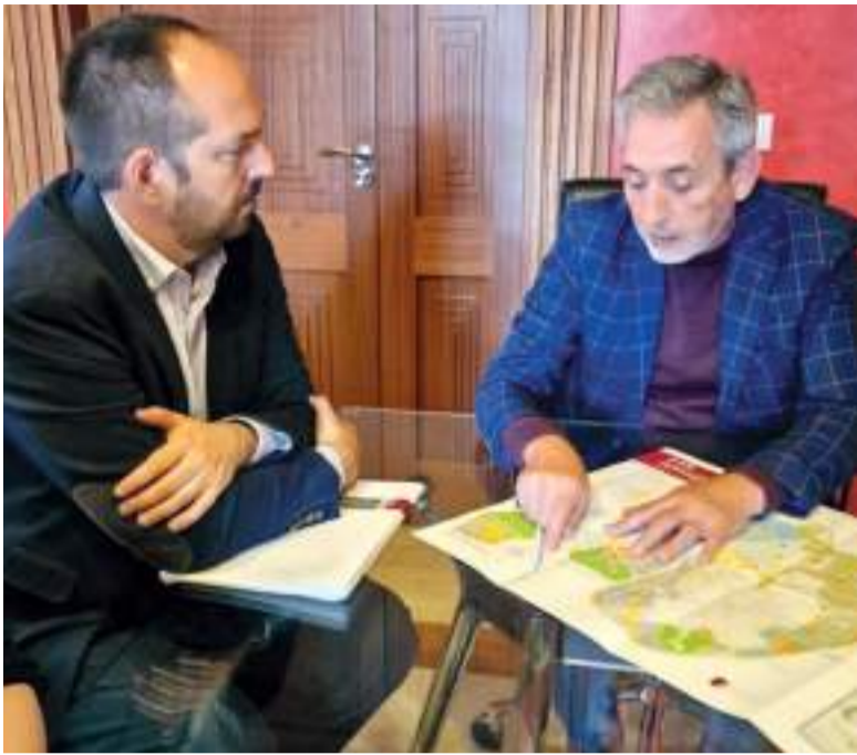
Alcalde d'Aldaia, junt a l'alcalde de Valdepeñas