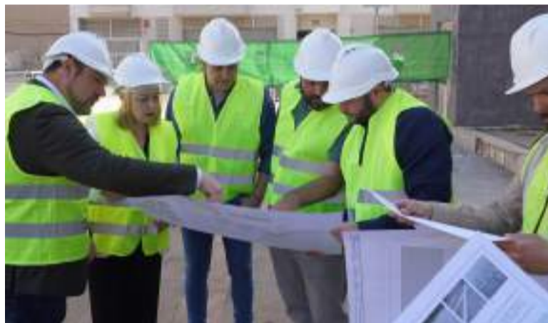
La vicepresidenta de la Diputació va visitar les obres