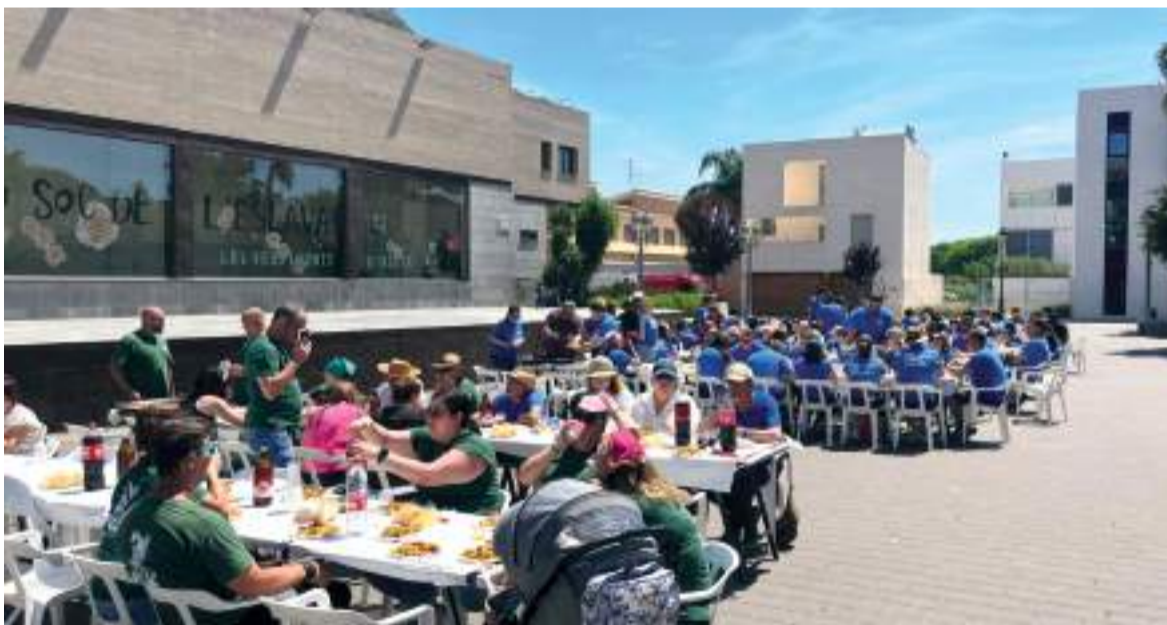
Jornada de germanor