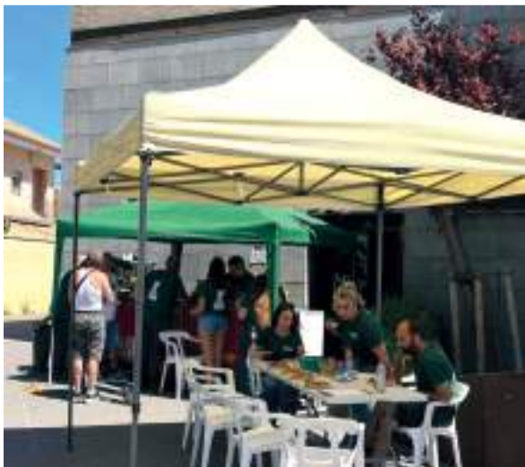
Jornada de germanor