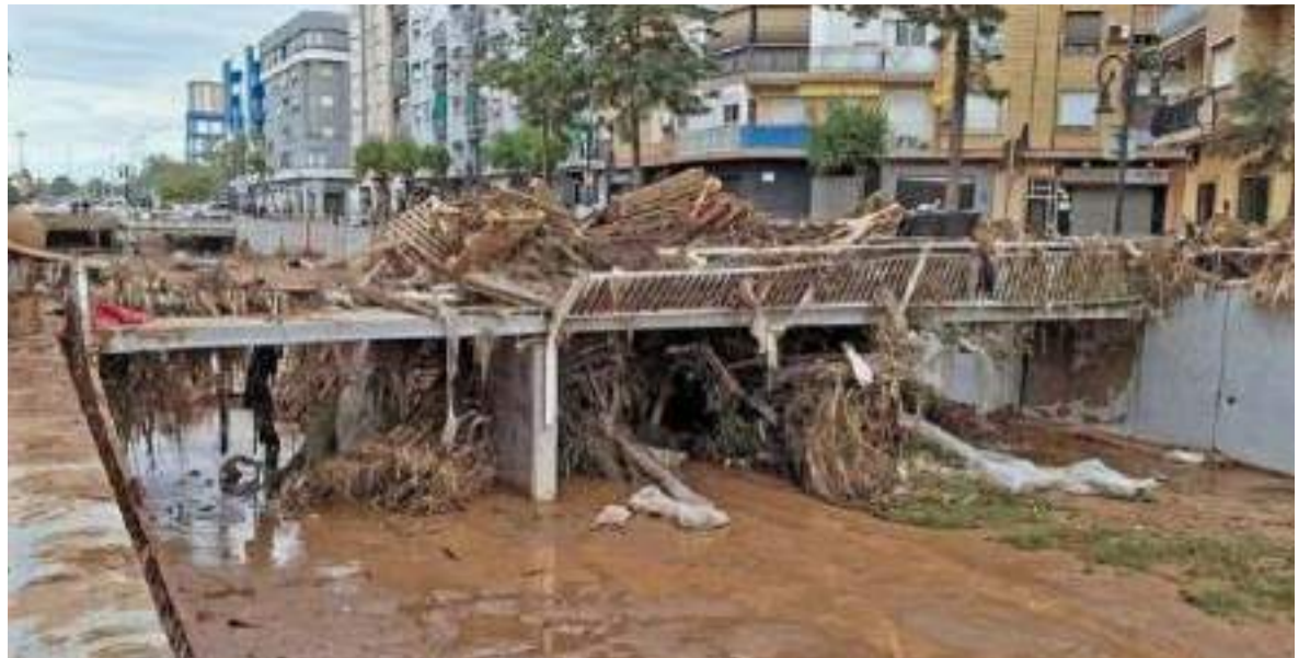
Barranc de La Saleta