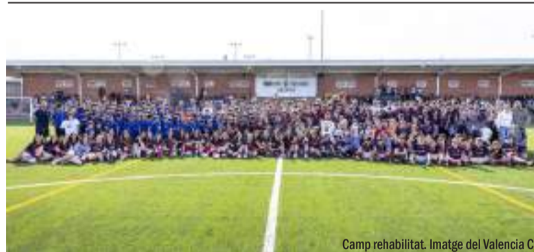
Camp rehabilitat.

La sol·licitud de les quanties, que ascendixen a 2.500 euros per a unitats familiars de fins a dos persones, amb un increment de 300 euros per cada membre addicional de la unitat familiar, fins a un màxim de 900 euros, tindrà com a requisit que la renda per càpita de la unitat familiar o de convivència no excedisca els 8.400 € per a unitats familiars de 3 o més membres, 10.500 € per a unitats de dos membres i 12.600 € per a persones individuals que la sol·liciten. També s'haurà de justificar que la unitat familiar tinguera la seua residència efectiva a Benetússer abans del 29 d'octubre de 2024, així com disposar d'un informe tècnic favorable emés per l'Equip d'Intervenció Social dels servicis socials municipals.