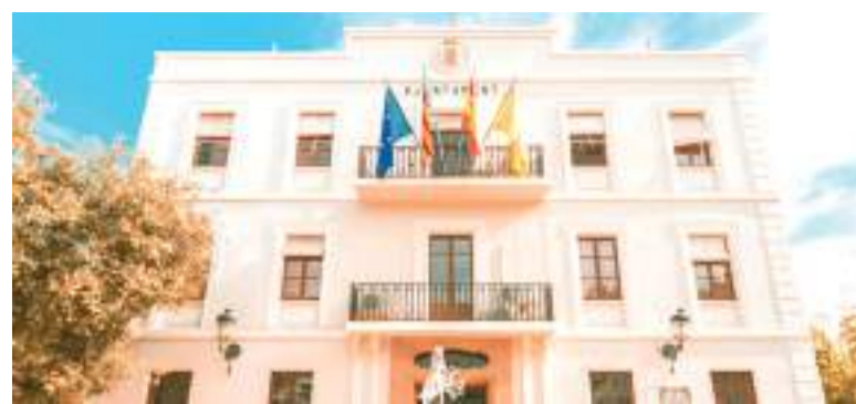
Ajuntament de Benetússer

La instal·lació oferirà servici ininterromput durant tres mesos, amb diferents horaris en funció del mes. d'esta forma, al juny i juliol la piscina obrirà de dilluns a dijous de 12.00 a 20:00 horas, mentres que els divendres, dissabtes i festius l'horari serà d'11.00 a 20.00 hores. Per part seua, durant el mes d'agost l'horari serà d'11.00 a 20.00 hores tots els dies de la setmana, adaptant-se així a la demanda creixent durant les vacances. L'accés a la piscina es gestionarà amb la web quartciutatesportiva.valbit.com .