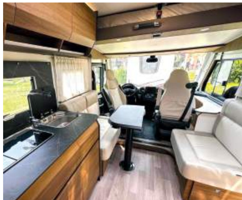
Interior de la caravana