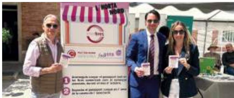
Alcaldessa, regidor i representant de l'Associació de Comerciants CAMU