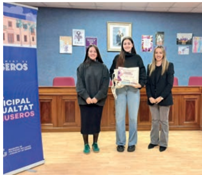
Alcaldessa i regidora junt a la guanyadora del concurs cartells 25N de 2024

Estes activitats no són només una commemoració, sinó una manera de continuar treballant junts per a construir un municipi més just, lliure i segur per a totes les persones, explica Cristina Civera