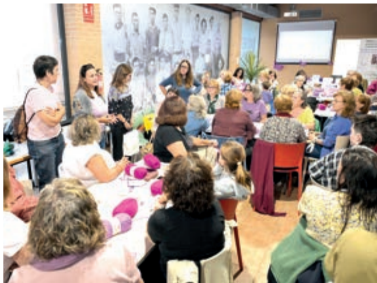
Al llarg de l'any es realitzen nombroses activitats de sensibilització

La programació s'iniciarà el diumenge 23 de novembre amb la cinquena edició de la Marxa dels Pobles contra la Violència Masclista, que eixirà a les nou del matí des de la carretera de Benetússer i es dirigirà cap a Sedaví en una caminada conjunta amb municipis veïns. El dimarts 26 de novembre tindrà lloc la jornada "Sembrant Sororitat", un taller d'iniciació a l'hort per a dones que es realitzarà als horts socials del CEIP L'Horta amb la col·laboració d'Interpèta Natura, amb l'objectiu de crear espais d'aprenentatge compartit i connexió amb l'entorn. La pro-