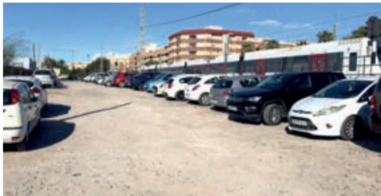
Zona estació de metre de Paterna

Durant l'última dècada, l'Ajuntament ha creat més de 2.000 places d'aparcament mitjançant actuacions en Els Molins, Els Tarongers, Ramón Ramia, el Carrer València, Santa Rita, l'entorn del Auditori, La Canyada o Mas del Rosari, consolidant una xarxa pública d'estacionament àmplia, moderna i ben distribuïda, que contribuïx a una Paterna més accessible, amable i millor connectada.