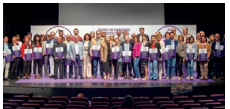
Assemblea de municipis contra la violència

Finalment, ha insistit en la importància de la implicació ciutadana en totes les accions programades: "La lluita contra la violència masclista és una responsabilitat col·lectiva. Cada gest suma, i Paiporta continuarà treballant perquè totes les dones visquen lliures i amb plenitud".