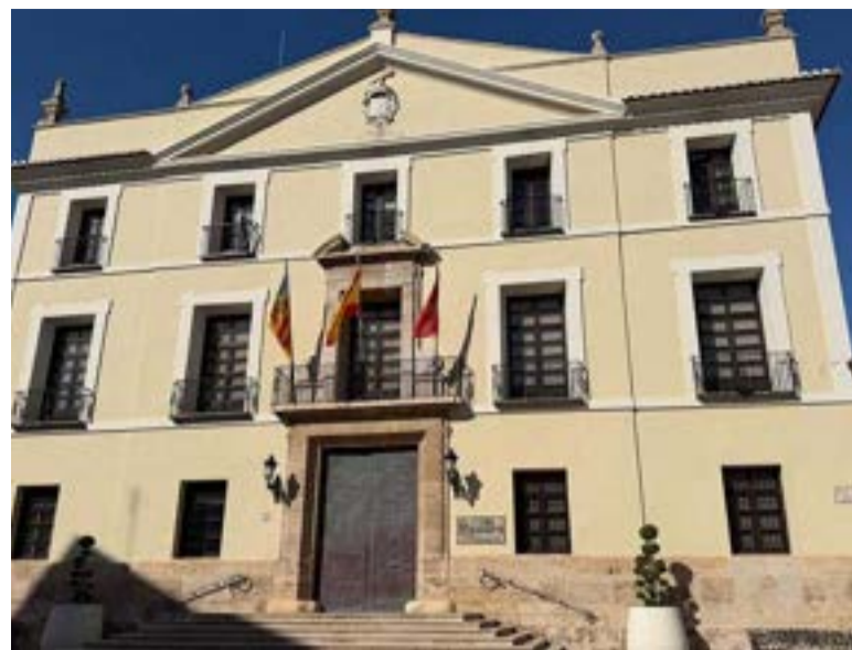
Ajuntament de Paterna

Sagredo ha assenyalat que "continuem treballant perquè Paterna siga una ciutat cada vegada més