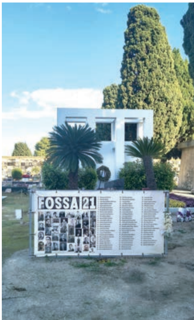
Fusilats a la fossa 21 a Paterna