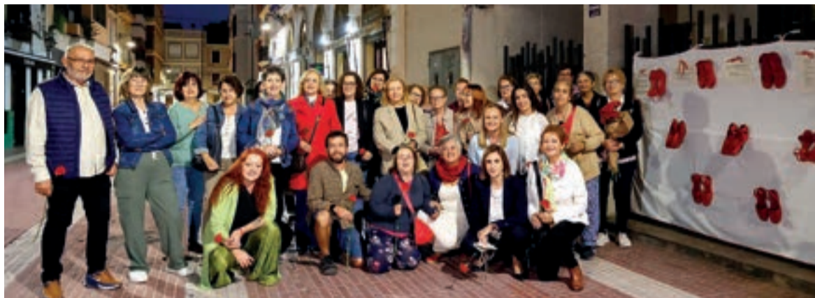
Inauguració Art al Carrer

LA CIUTAT CELEBRA A NOVEMBRE LES XXI JORNADES CONTRA LES VIOLÈNCIES MASCLISTES