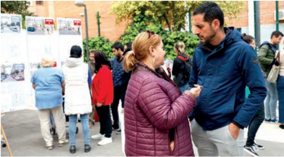
El alcalde de Mislata junt a una veïna del barri