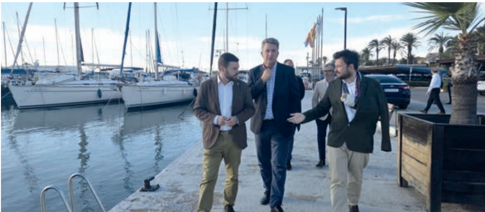
El Conseller va visitar el port de La Pobla de Farnals junt a l'alcalde