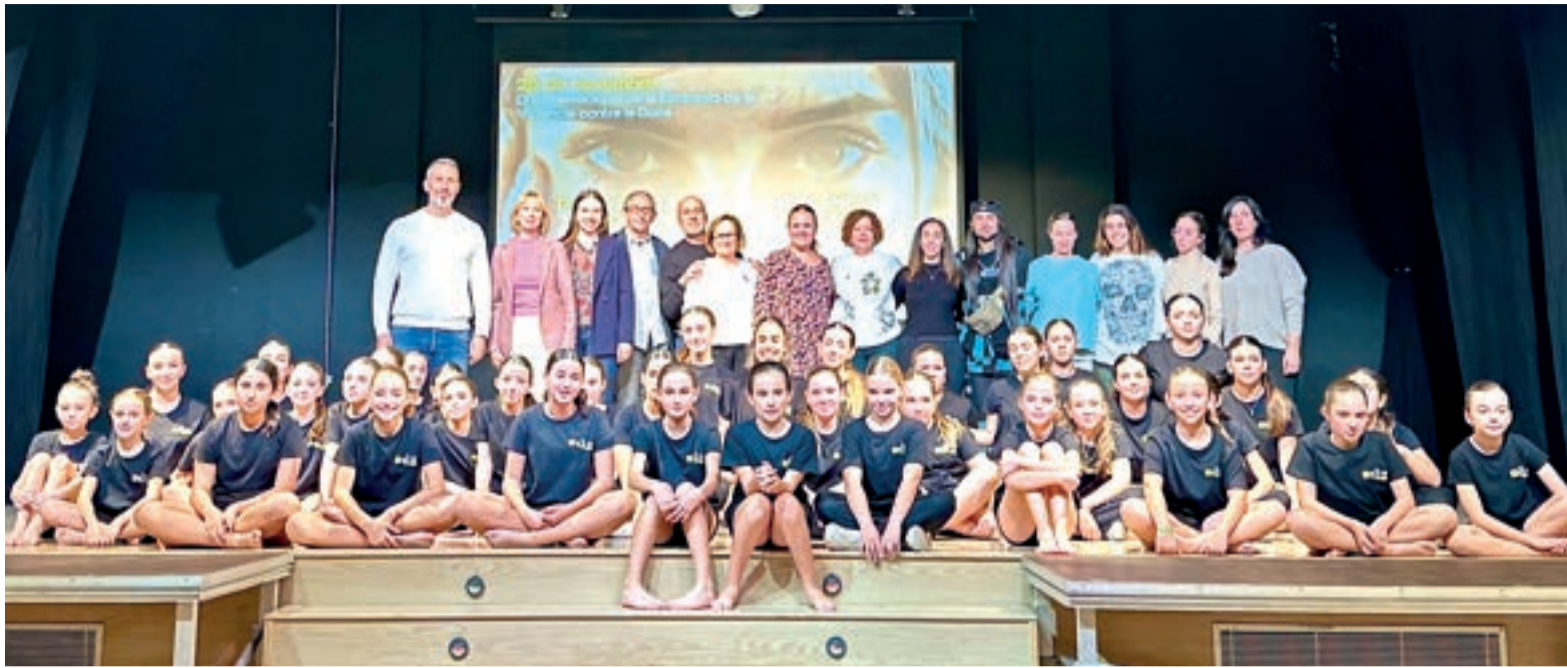
Acte a Rafelbunyol amb motiu del 25N