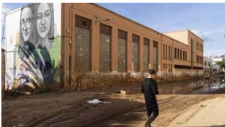
Carrers de Catarroja