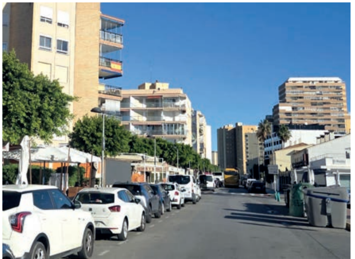
Apartaments a La Pobla de Farnals i El Puig al fons

Malgrat este increment, viure a la platja s'ha convertit en una opció