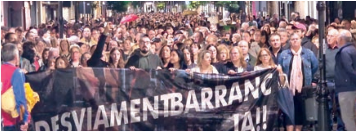
Imatge de la manifestació a Aldaia