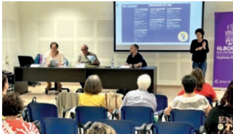
Presentació Campanya 25N