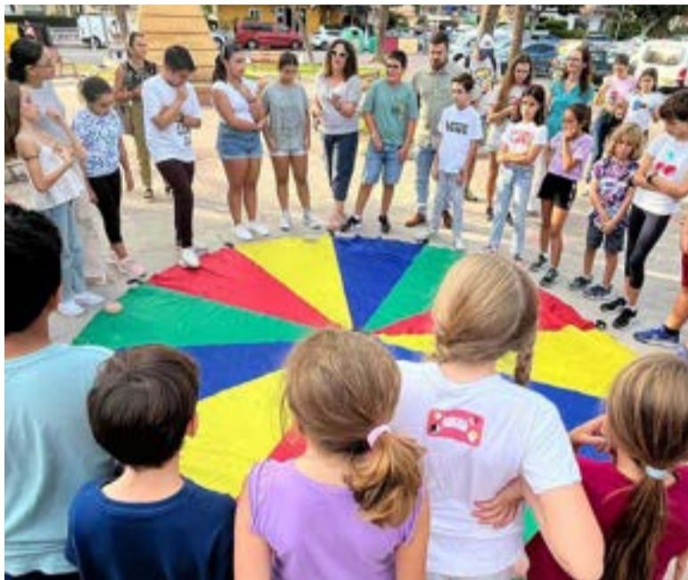
Imatge de l'any passat

bre, el CEIP Cervantes va acollir el 'Gran Joc Els Nostres Drets', una activitat educativa adreçada a l'alumnat de cinqué de Primària. Es tracta d'una dinamització basada en l'exposició sobre la Convenció dels Drets de la Infància i l'Adolescència, que l'equip de l'Àrea d'Infància de l'Ajuntament de la Pobla de Farnals durà a terme a les aules del centre per a do-