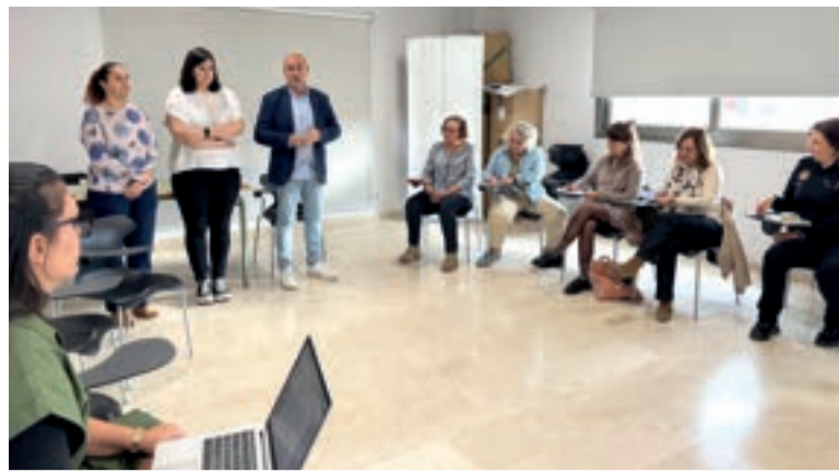
Presentació del Pla d'Igualtat

UN ARBRE SIMBÒLIC RECORRERÀ EL MUNICIPI, CONVIDANT ALS VEÏNS I VEÏNES A ESCRIURE EN UNA TARGETA EL SEU COMPROMÍS AMB LA IGUALTAT