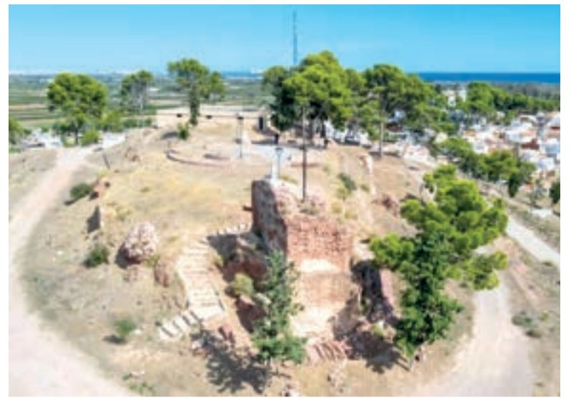
Imatge de les restes del Castell del Puig

i amb una profunditat de 4 metres traurà a la llum partix del fossat que defenia el castell. A més, en eixa zona hi ha un jaciment del