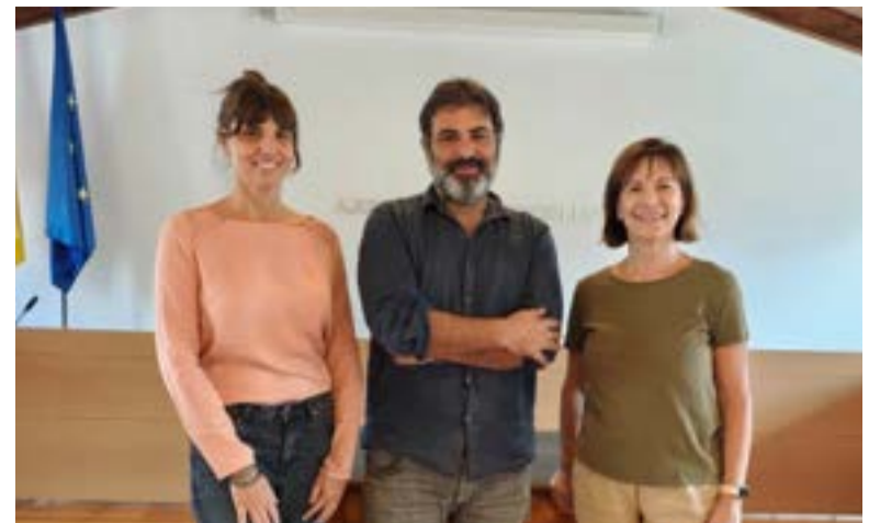
Esporles reafirma su solidaridad con Aldaia

vostra solidaritat immensa i sincera. Ens va donar ànim quan semblava que no ens quedaven forces, ens va ajudar a alçar-nos i ens va impulsar a iniciar la reconstrucció que encara continua i que s'allargarà per anys. Ens va donar també una autèntica lliçó de vida, sense haver sigut anomenats. Vau convertir els nostres carrers en mares humanes de solidaritat, d'abraços, de mans tendides i de llàgrimes compartides.