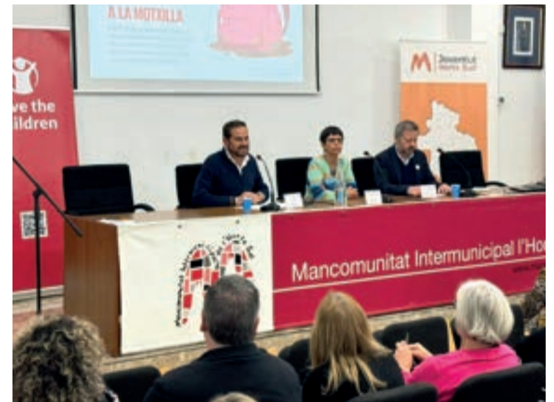
Presentació de l'estudi a la Mancomunitat

Respecte a conclusions específiques, el diagnòstic reflecteix que el 70% de les famílies conside-