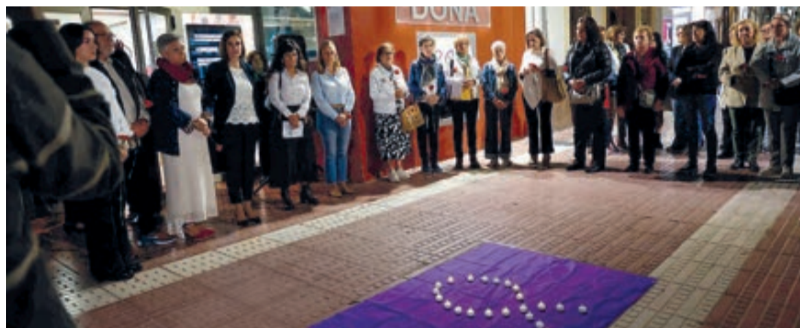
Minut de silenci

Les jornades culminen amb el lliurament d'estos guardons i el mateix 25N amb activitats de prevenció en els centres educatius i de la lectura del manifest anual, un gest que Mislata manté com un acte cívic que es repeteix any rere any.