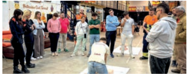
Curs de primers auxilis

També La xarxa de sensors en zones de risc, els models predictius d'inundacions i els panells urbans d'avís faran de Torrent una ciutat més segura i resilient, capaç d'anticipar-se a emergències i protegir les persones. A més, la mobilitat intel·ligent reduirà embossos, millorarà la seguretat viària i oferirà informació en temps real sobre trànsit i aparcament.