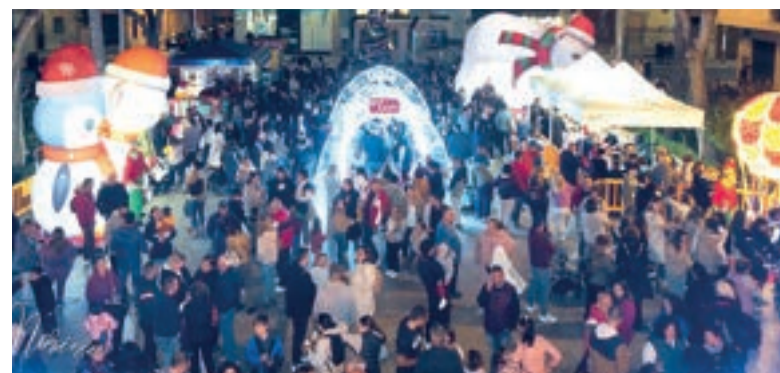
Imatge 2024 encesa de llums

nar a conèixer, de manera lúdica i participativa, els drets fonamentals dels xiquets i xiquetes. Amb aquesta programació, el Consistori referma el seu compromís amb la promoció dels drets de la infància i l'adolescència, així com amb la implicació del teixit associatiu i la participació activa de la comunitat educativa del municipi.