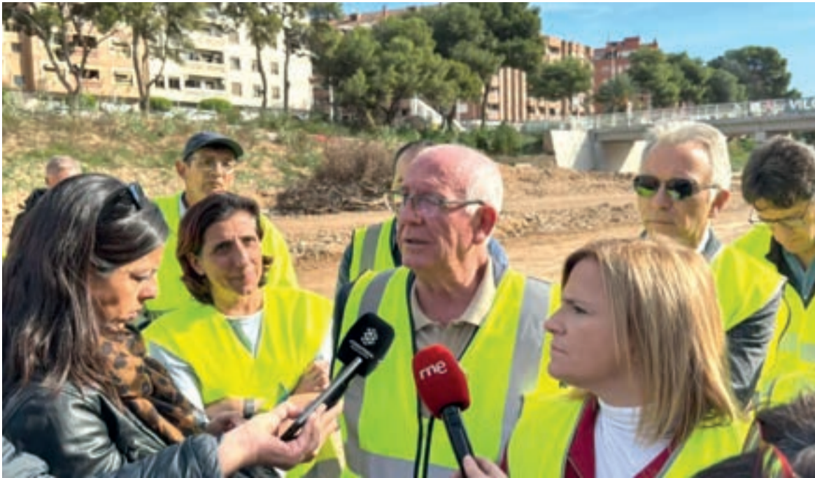
Alcalde i delegada de Govern