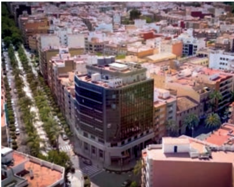
Ajuntament de Torrent