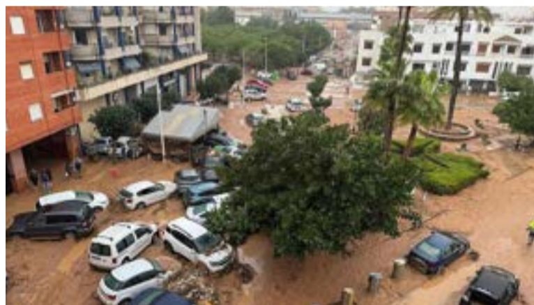
Imatge del barri després de la Dana

Respecte a la inversió ascendeix a més de 9 milions d'euros, finançats íntegrament amb la subvenció estatal dels 138 milions d'euros per a la reconstrucció.