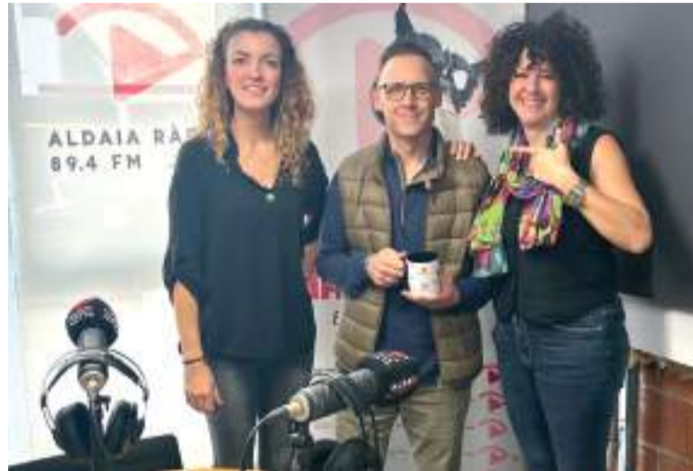
Responsables d'Aldaia Ràdio

A més a més, l'emissora municipal d'Aldaia prepara noves propostes amb associacions de majors i juvenils per a contar de manera