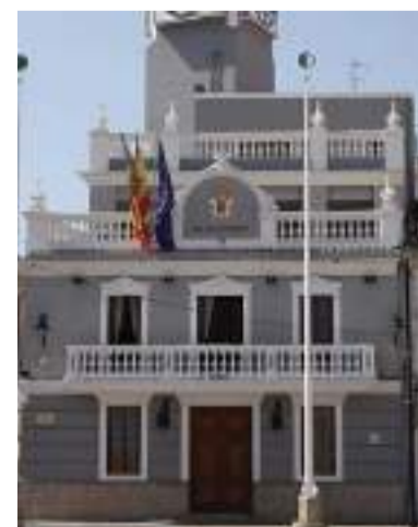
Ajuntament de Meliana

En eixe sentit, des de l'Ajuntament de Meliana insistixen "el que necessitem és el soterrament de les vies, si municipis com Alboraià l'han aconseguit nosaltres hem de continuar treballant per a aconseguir el mateix".