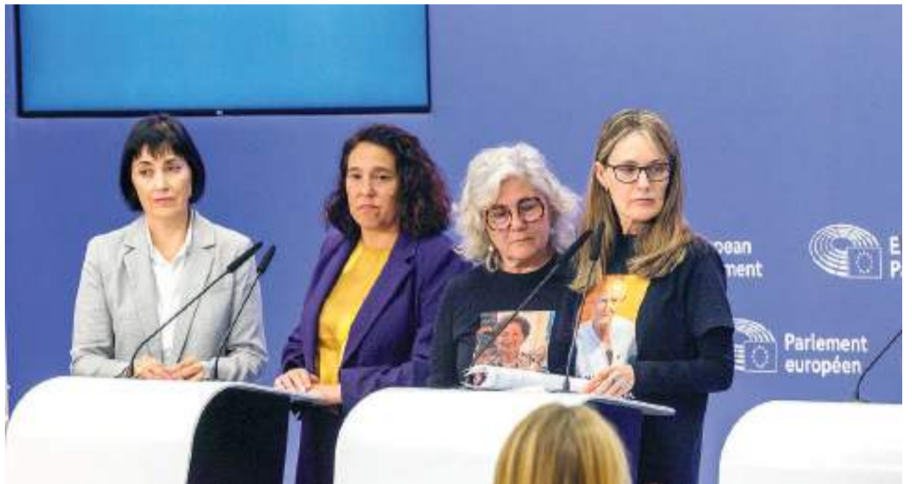
Associacions de víctimes van acudir a Brussel·les i van demanar que s'investigue l'ocorregut

Dins de la cronologia de la instrucció, un moment important va ser quan al mes de juliol la Guàrdia Civil va entregar un informe a la jutgessa sobre les pluges, alertes, desbordaments i actuacions de la Generalitat. Un