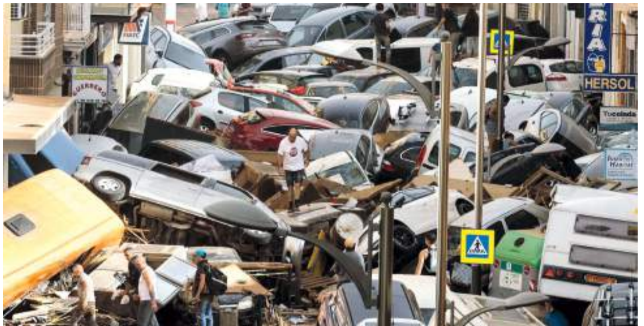
Carrer a Alfafar i Sedaví.

En l'article s'exposen com a exemples inundacions ocorregudes en diversos països i diferents anys, algunes també a Espanya, en les quals es van produir danys i morts relacionats amb els efectes de les riudades en els vehicles, assenyalant al respecte que, "perquè la gestió siga adequada, és