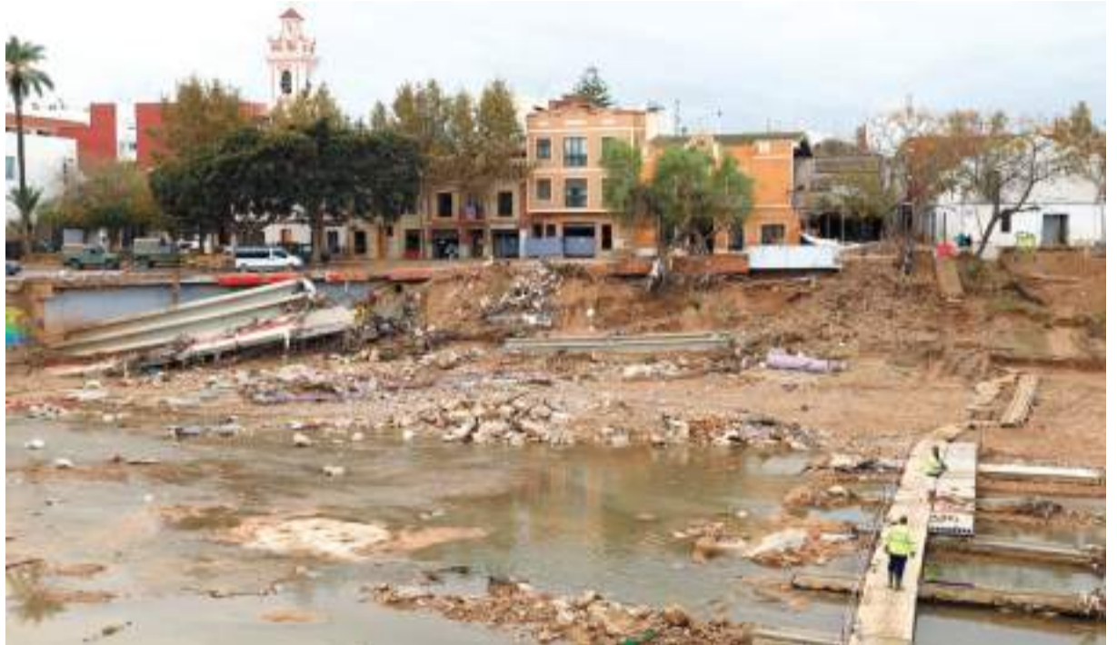
Picanya, 19 dies després de la riuada.

Una altra de les solucions que es plantegen per a contindre avingudes d'aigua i llot que es puguin donar en el futur, és el gran parc inundable metropolità de 35 km que connectarà l'Horta Sud amb el Jardí del Túria projectat per la Generalitat.