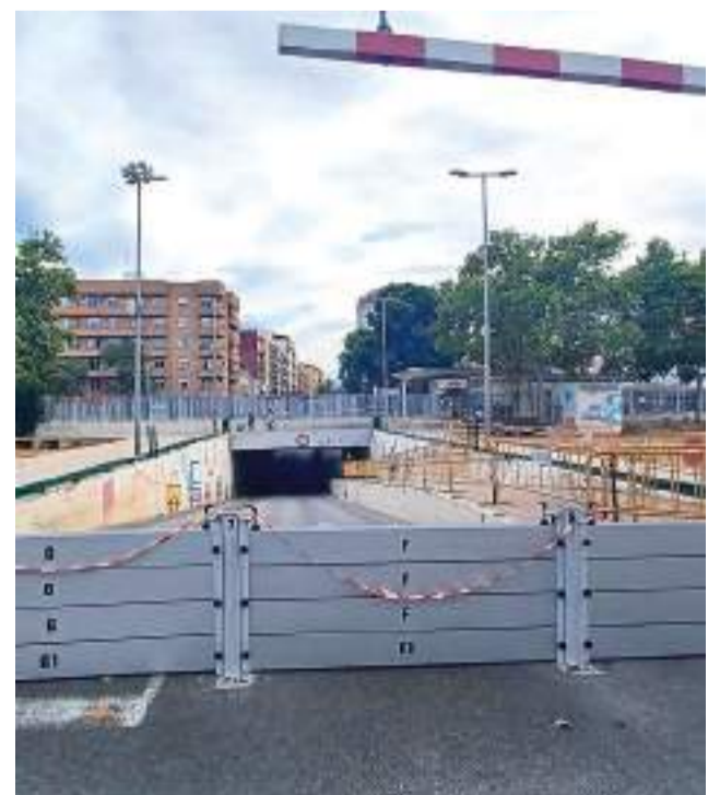
Barranc de la Saleta

"L'objectiu d'estes mesures és guanyar marge de reacció per a salvaguardar als veïns fins que s'execute la gran obra general de canalització del projecte de la Saleta que portem reclamant més de 40 anys", va assenyalar l'alcalde. Quan es realitze esta obra no sols beneficiarà a Aldaia sinó també als municipis veïns d'Alaquàs i Xirivella, els dos es van inundar en menor mesura a conseqüència del desbordament del barranc de la Saleta, en el terme d'Aldaia.