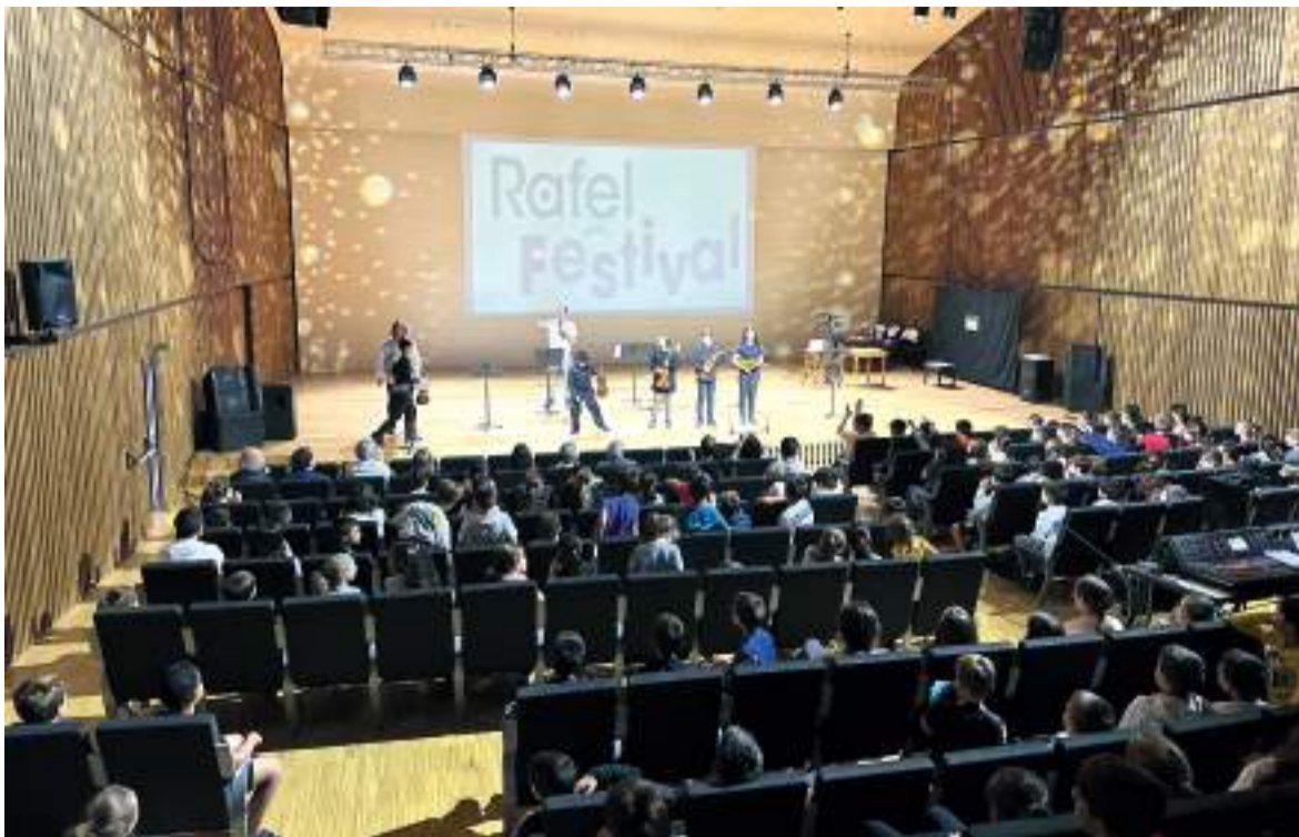
Imatge de l'any passat