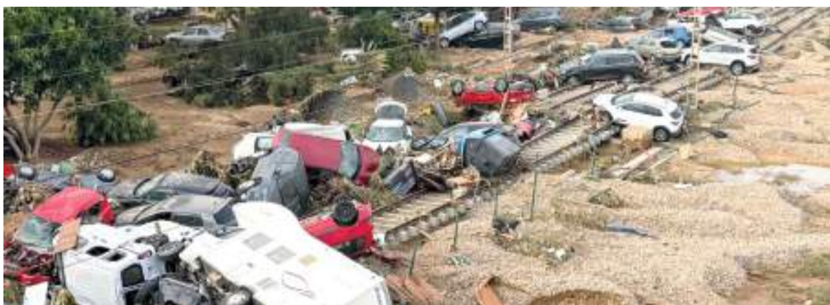
Vies de tren al seu pas per Alfafar i Benetússer.

D'altra banda, les dades de risc d'inundació utilitzades en el treball van ser proporcionades per la Confederació Hidrogràfica del Xúquer, "que va emprar el model Infoworks 2D per a calcular els nivells i velocitats de flux en l'àrea inundada". També es van utilitzar els mapes de risc d'inundació corresponents a períodes de retorn de 10, 25, 50, 100 i 500 anys.