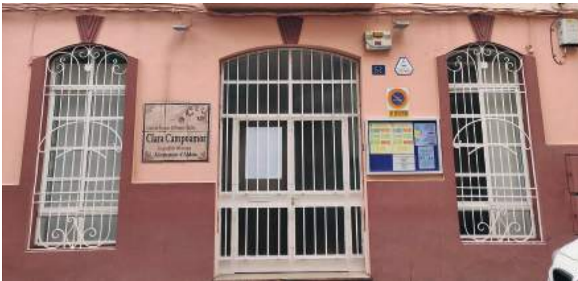
Centre municipal Clara Campoamor