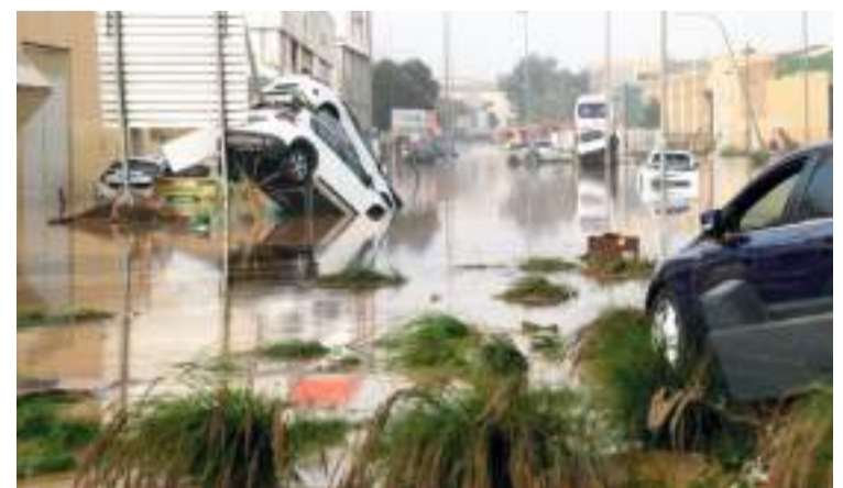
Polígon industrial a Sedaví.