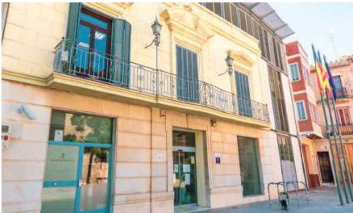
Ajuntament de Massamagrell

L'OBJECTIU D'AQUESTA INICIATIVA ÉS FOMENTAR LES COMPRES EN EL COMERÇ DE LA LOCALITAT