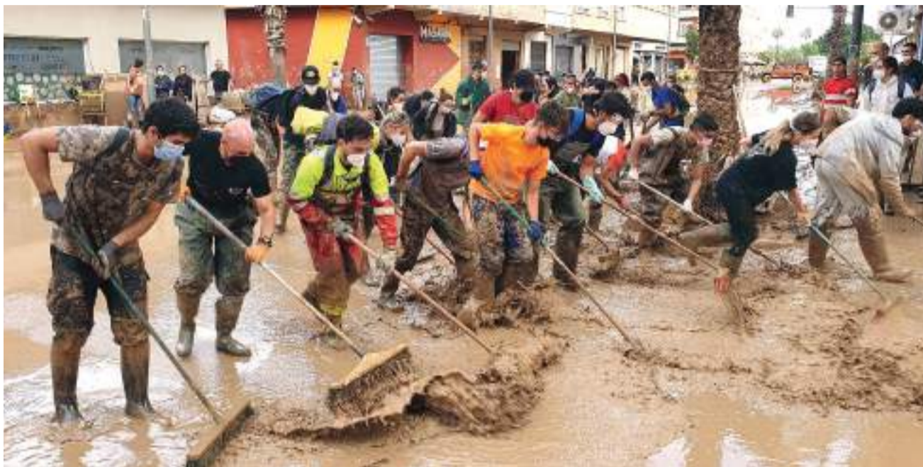
Voluntaris a Paiporta

Finalment, el 2 de novembre se celebrarà l'acte institucional de reconeixements i homenatges a la ciutadania, el voluntariat i els diferents serveis d'emergència que van treballar sense descans durant la crisi. Un moment d'agraïment