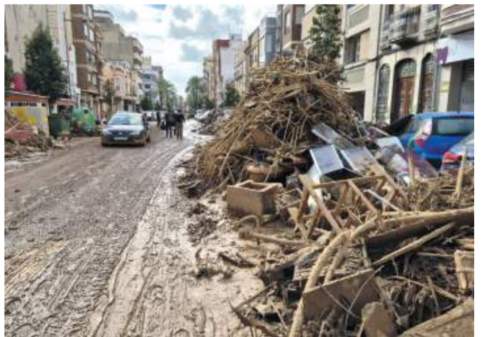
Catarroja, imatge de 9 dies després de la Dana