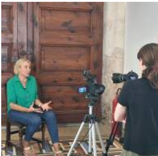
Dones esportistes van ser les protagonistes del vídeo