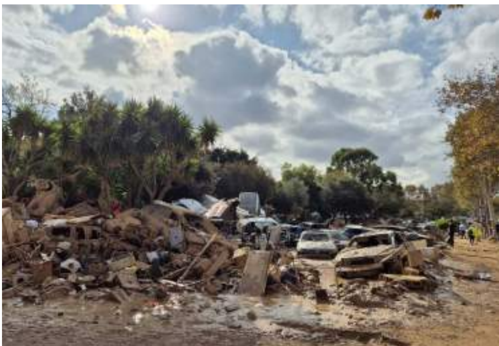
Zona entre el barri Orba i els Alfalares d'Alfafar, 9 dies després de la 'barrancà'