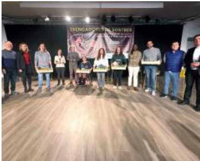
Meliana va acollir diverses xarrades