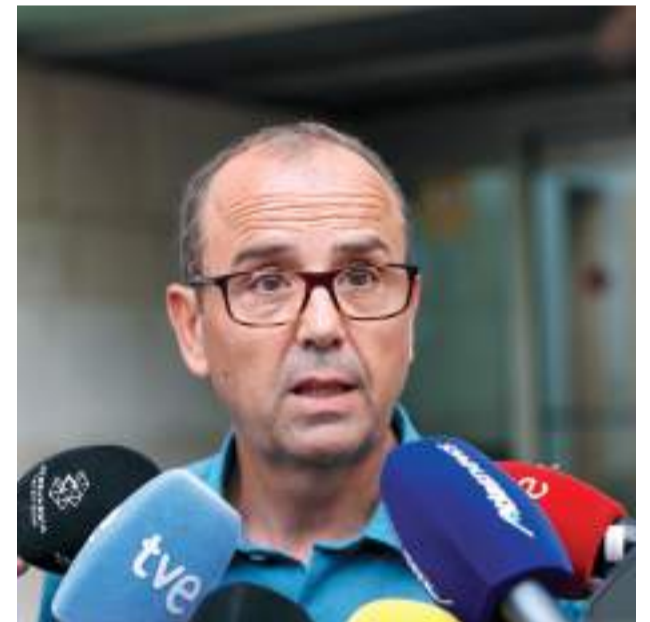
El cap de Climatologia de l'Agència Estatal de Meteorologia, dels últims en declarar