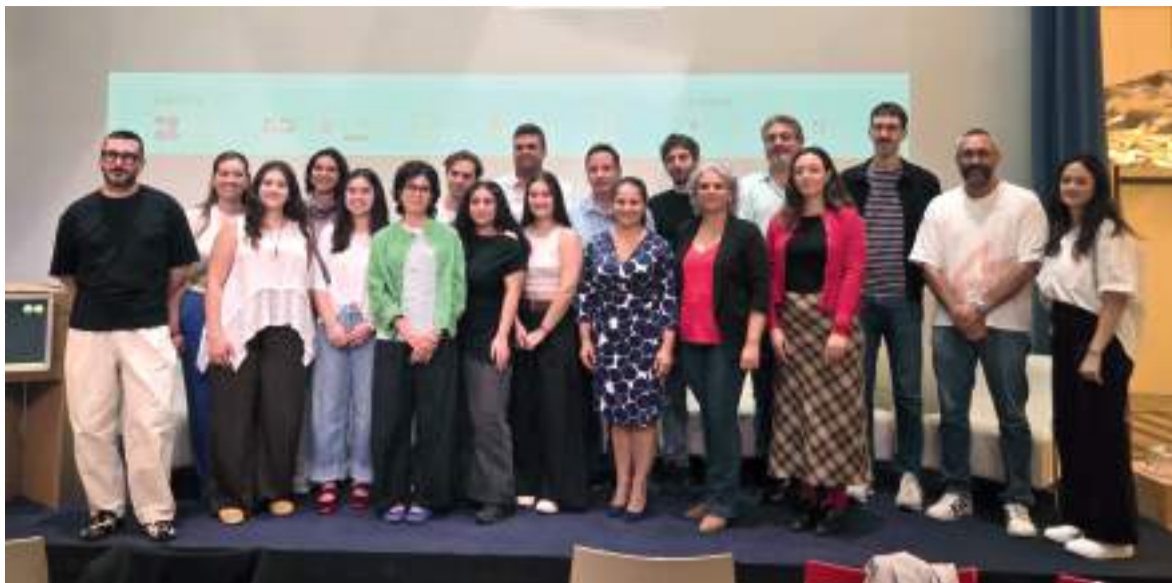
Presentació del festival amb artistes i alcaldes i alcaldessa