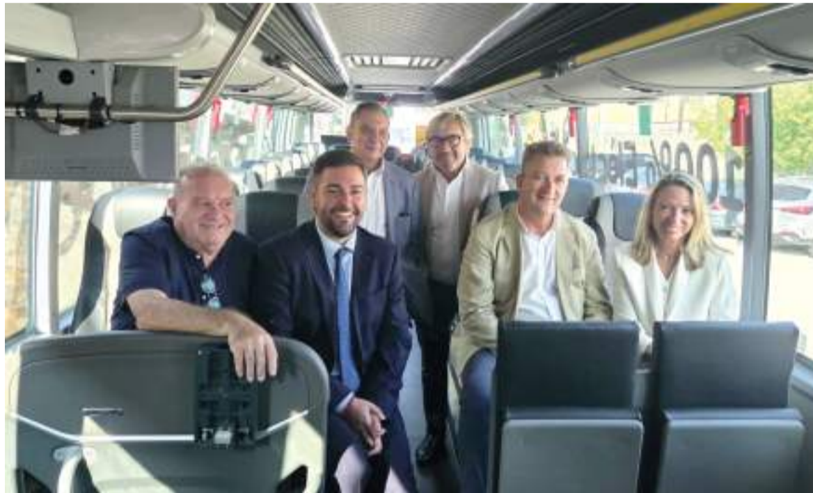
El conseller, junt als alcaldes i alcaldessa i responsables de l'AMT

EL SERVICI SERÀ DE DILLUNS A DIVENDRES, I EN FUNCIO A LA DEMANDA S'AMPLIARÀ ELS CAPS DE SETMANA