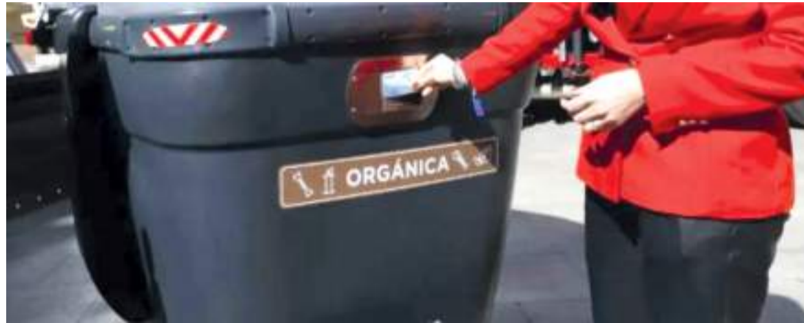
Contenidors intel·ligents situats ja a Saragossa

El nou contracte de neteja implica el canvi de tots els contenidors, més de 2.000, pels nous contenidors intel·ligents i de major capacitat. A més, també es renova