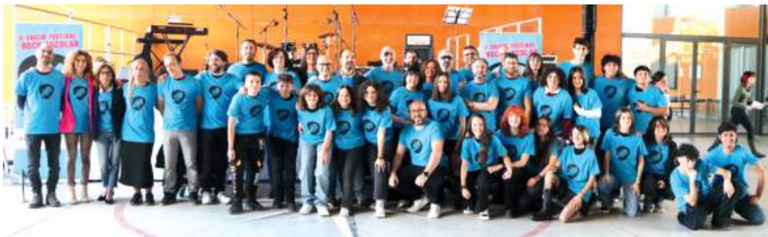
Professorat i alumnat.