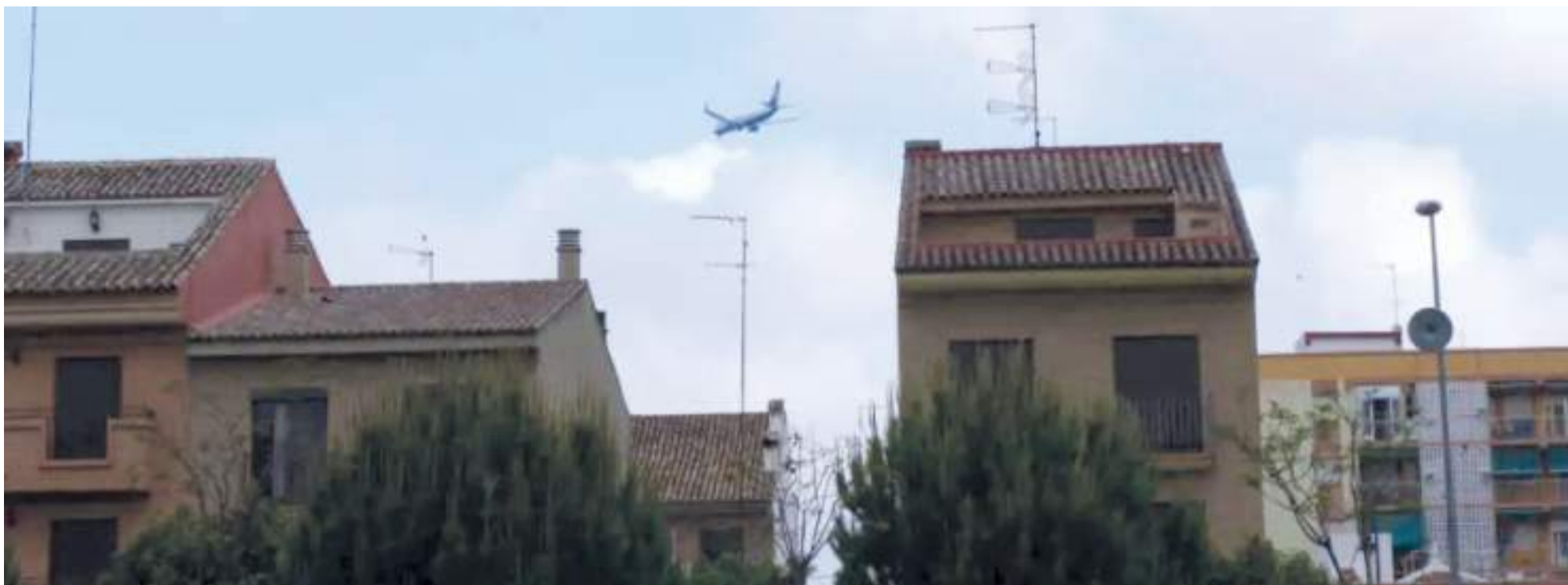
Un avió sobrevolant habitatges de Xirivella