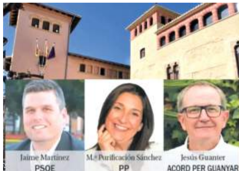
Alcalde al costat dels portaveus de l'oposició