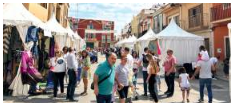
Fira a Rafelbunyol l'any passat

"Fomentar el comerç de proximitat és una de les nostres prioritats. Volem animar a tots els nostres comerços a participar activament en aquesta cita, ja que la varietat, la qualitat i el servei destaquen tant