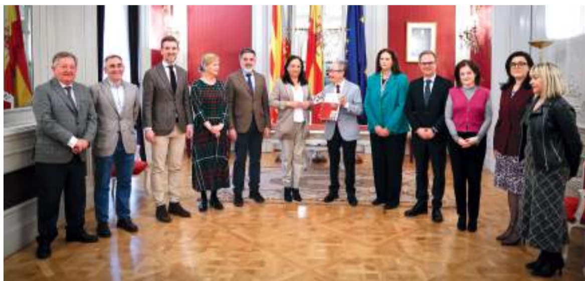
Asistentes a la presentación del Informe Anual del Síndic de Greuges 2023

“LAS LIMITACIONES DEL ACCESO A LA INFORMACIÓN POR LOS CONCEJALES DE LA OPOSICIÓN SE HAN AMPLIADO A PARTIR DE LAS ELECCIONES LOCALES DE 2023”