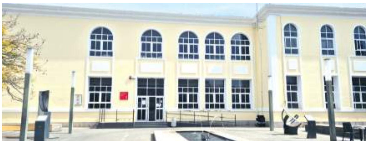
Centro de Salud de Albuixech