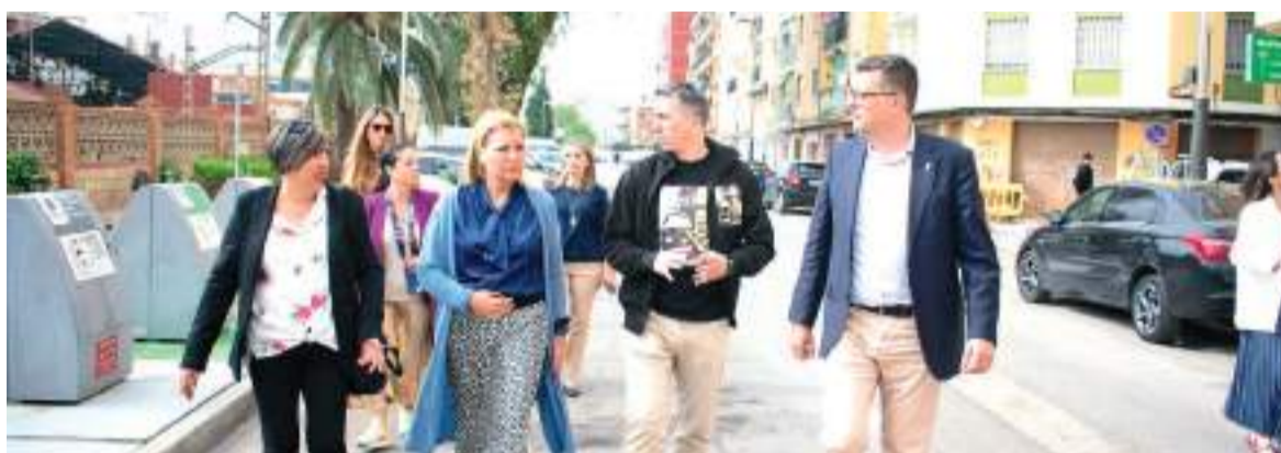
Camarero, junt a l'alcalde i membres de la plataforma pel soterrament

"Tenim tota la documentació preparada, amb les signatures recollides, i un peu a Europa perquè estem davant una clara vulneració dels drets fonamentals", alcalde d'Alfatar