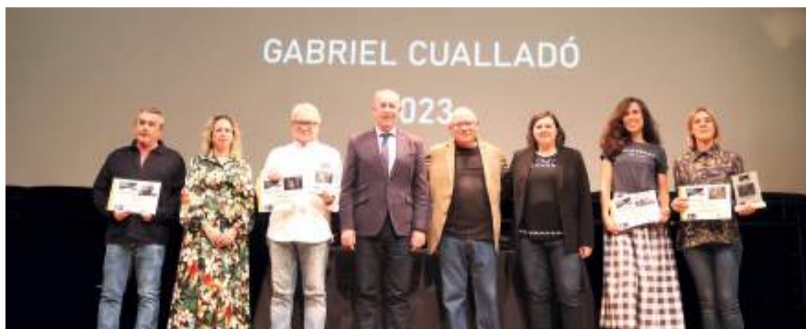
1 Concurso Nacional de Fotografía Gabriel Cualladó