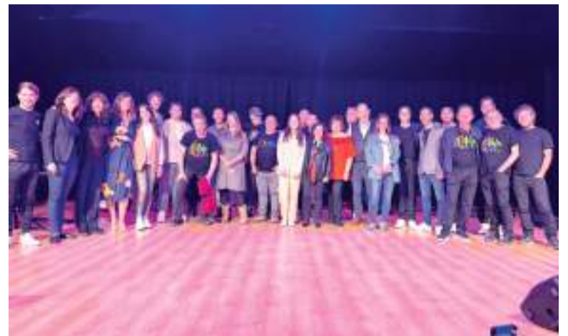
Concierto benéfico a favor de la Federación Española de Parkinson

Según explicó la concejala de cultura, "desde el Ayuntamiento estamos impulsando diferentes actos culturales para todos los públicos" y avanzó que este año volverá a haber 'Juliol Musical' con numerosas actuaciones previstas.