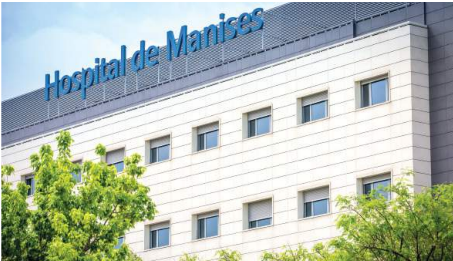
Hospital de Manises