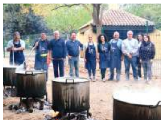
2º Día del Perol de Massanassa