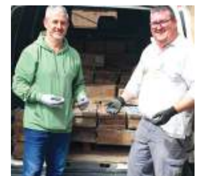
Alcaldesa, regidor i brigada de obres ja amb les peces donades a Meliana