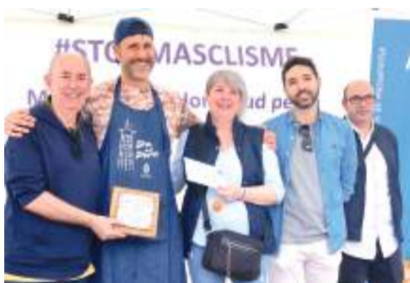
Premios del Concurso de Perol