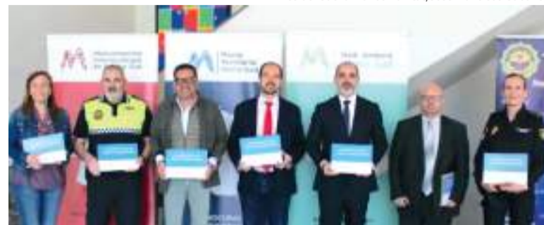
La jornada va comptar amb l'assistència d'autoritats