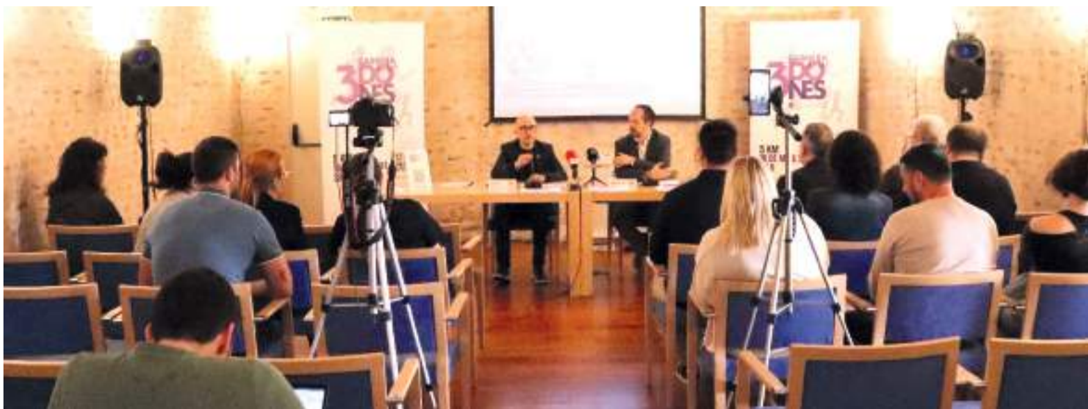
Els alcaldes van oferir una roda de premsa