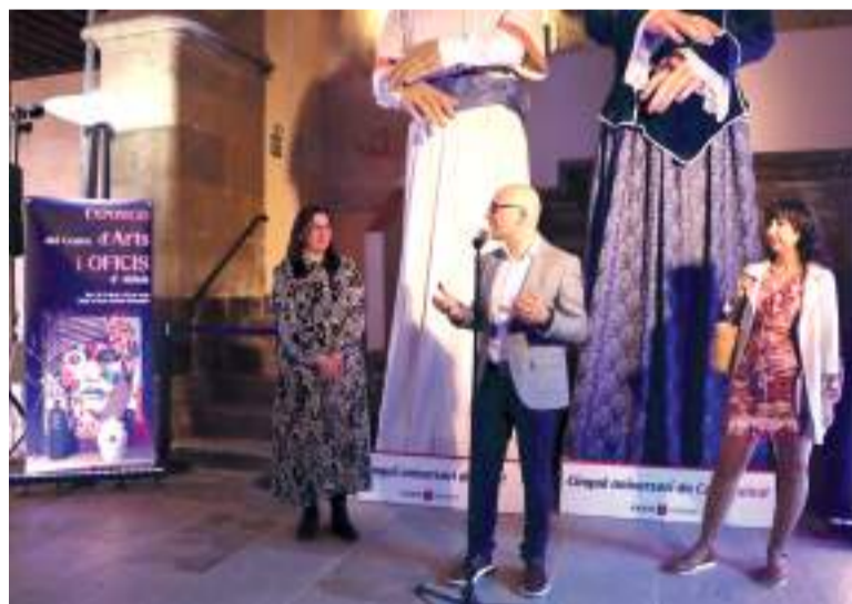
Alcalde d'Alaquàs durant la inauguració

La mostra és un conjunt aleatori d'obres en les quals cada persona ha plasmat una idea del que en eixe moment li abellia o necessitava pintar. Com a resultat, gaudim d'una exposició rica en temàtica, variada i molt interessant.