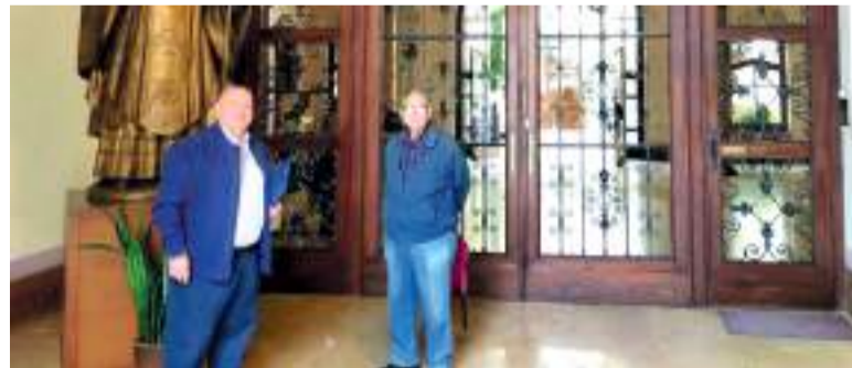
El presidente y el secretario, al salir del Palacio Arzobispal de presentar los estatutos de la cofradía