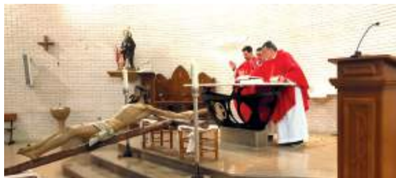
Imagen de Semana Santa con el Cristo que preside el Altar Mayor de la Iglesia de la playa

Entre los fines de la cofradía, entre otros, indica el secretario son "fomentar acciones solidarias y caritativas, así como favorecer las obras de caridad, no sólo entre sus miembros, sino sobre todo con los enfermos y los más necesitados"