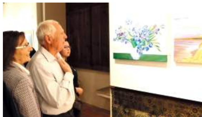
Imatge d'algunes de les obres