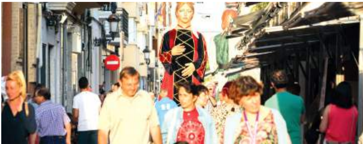
Imagen de la feria del año pasado