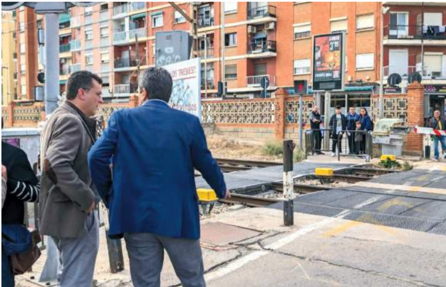
Mazón va visitar la zona a final d'any i va reivindicar al Govern d'Espanya el soterrament