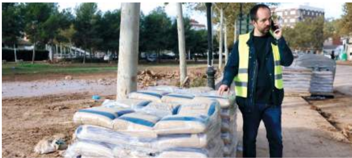
Imatge d'arxiu. L'alcalde, després de la Dana, i amb previsió de pluges, al costat del barranc, on es van posar sacs d'arena perquè les comportes estaven trencades

L'ANUNCI QUE VALÈNCIA CIUTAT REALITZARÀ AL·LEGACIONS AL DESVIAMENT DE LA SALETA HA CAUSAT UN PROFUND MALESTAR A ALDAIA, EL QUART MUNICIPI MÉS AFECTAT PER LA DANA I EN EL QUAL VAN MORIR SIS PERSONES