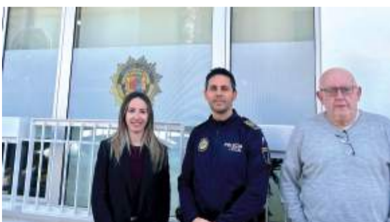
Alcalde de Museros, regidor i cap de Policia en les noves oficines