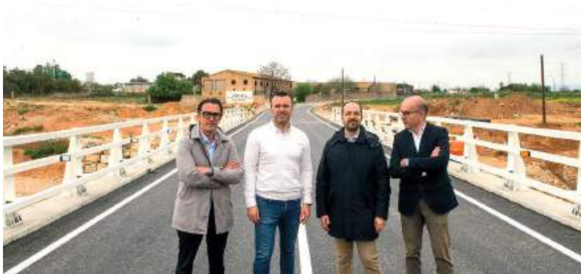
El president de la Diputació, junt l'alcalde d'Aldaia i tècnics