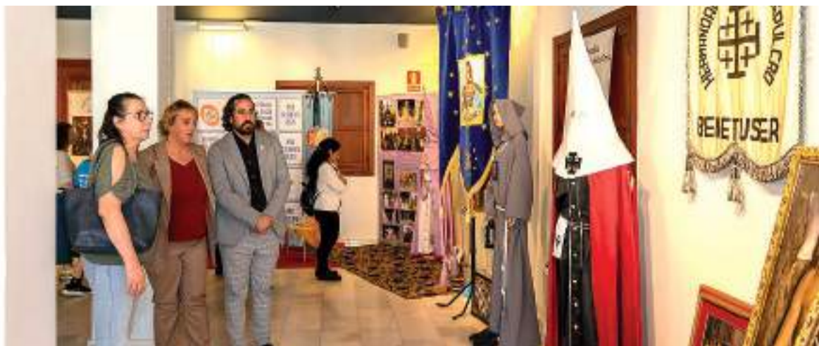
Inauguració de l'exposició de la Setmana Santa