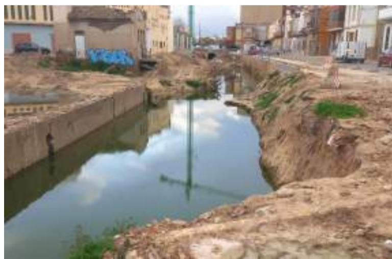
Imatge recent del tram descobert del barranc de la Rambleta existent entre Catarroja i Albal (T. L.).

En l'estudi d'inundabilitat del Pla General d'Ordenació Urbana de Catarroja no se li dona la importància deguda al barranc de la Rambleta, encara que es reconeix que arreplega "una quantitat significativa dels fluxos desbordats del barranc de Poyo, que es produïxen aigües amunt de la CV-400", o avinguda del Sud, i fins i tot s'apunta que l'antic assentament de la Vila Romana es va construir "just en cotes més altes esquivant eixes avingudes". A més, es recalca que "proves més recents són els estudis realitzats per Project Rinamed respecte de l'avinguda d'octubre de 2000, en concordança amb els testimoniatges trobats d'eixes dates. Eixa mateixa trajectòria del flux desbordat sembla que van seguir els desbordaments de la riuada de 1957, com així ho relatava don Emilio Porcar Lliberós, alcalde de Catarroja" d'eixa època. Quant a l'origen d'este barranc, s'assenyala que és, efectivament, "una font, hui desapareguda,