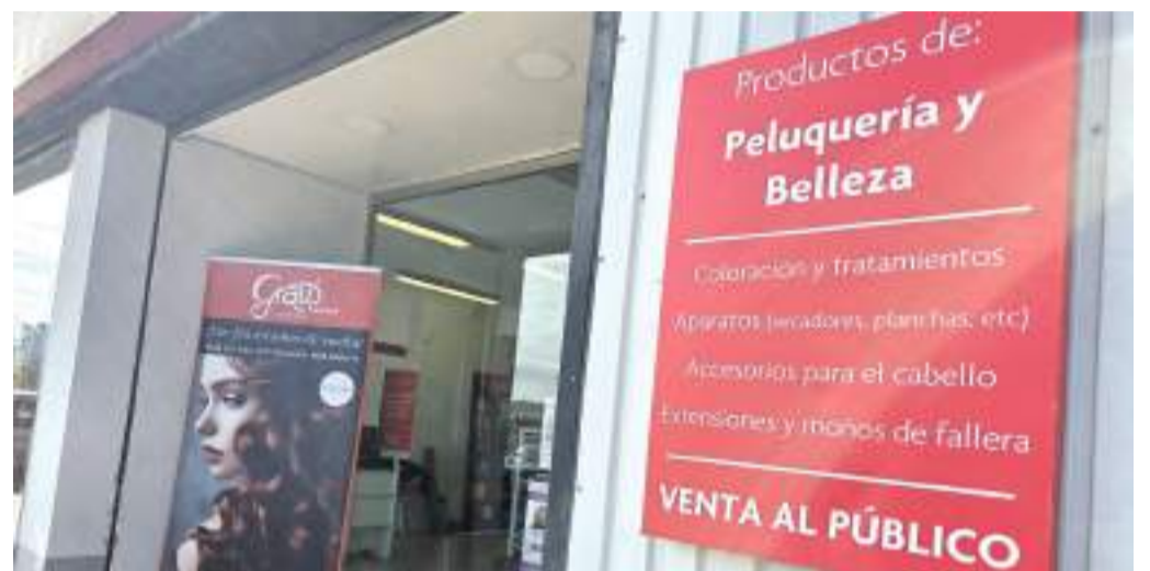
La venta no es sólo para profesionales, desde siempre venden al público.