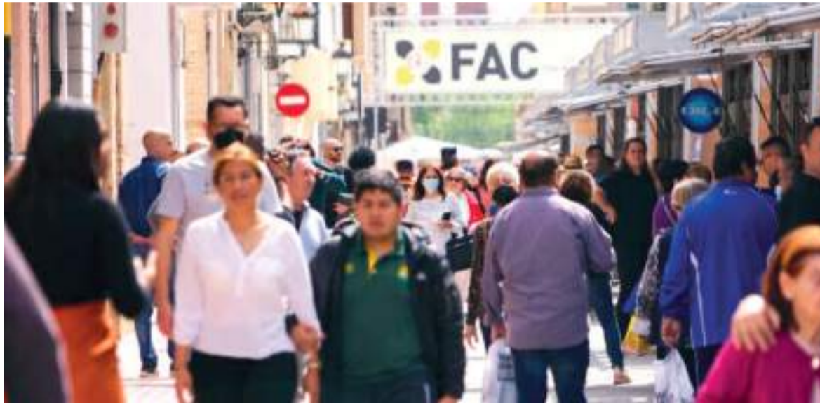
Milers de persones visiten la FAC, imatge de l'any passat

sociativa i Comercial serà un cant a l'optimisme i una oportunitat d'ajudar a les persones que estan alçant-se i plantant-li cara a l'adversitat.