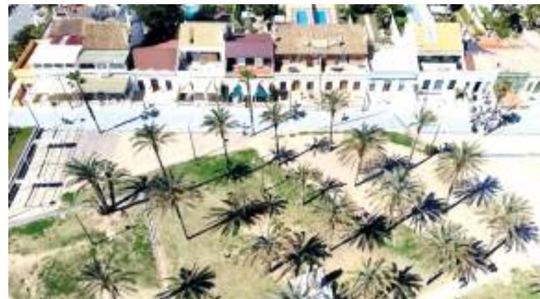
Palmerar de La Patacona

I és que al llarg de mig segle, la Junta ha sigut clau en la coordinació i organització dels actes processionals, gràcies a l'esforç conjunt de les deu germandats que la componen. Tant és així que en 2018 va ser declarada com a Festa d'Interés Turístic Provincial en un projecte conjunt amb l'Ajuntament.