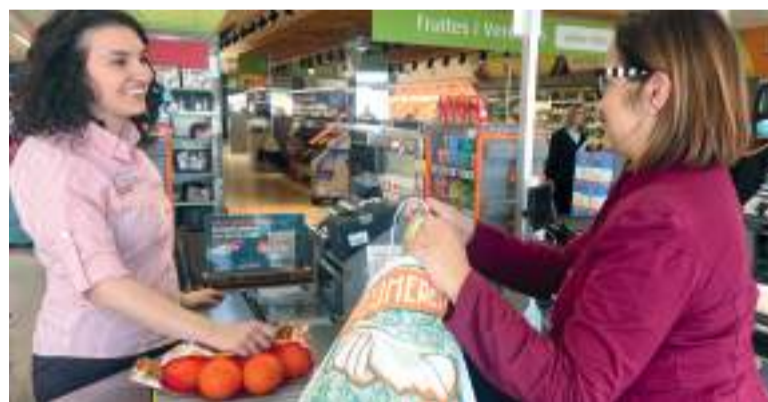
Repartiment de bosses en Consum

Els clients poden col·laborar des de hui mateix amb la iniciativa sol·licitant esta bossa, de paper i amb el lema 'El comerç ajuda al comerç', en passar per caixa i contribuir així a la volta a la normalitat dels més de 8.800 comerços afectats pel pas del temporal del passat 29 d'octubre. Tota la recaptació que s'aconsegueixca per la venda d'estes bosses anirà destinada íntegrament als comerços afectats per a promoure la seua activitat i reactivació comercial.