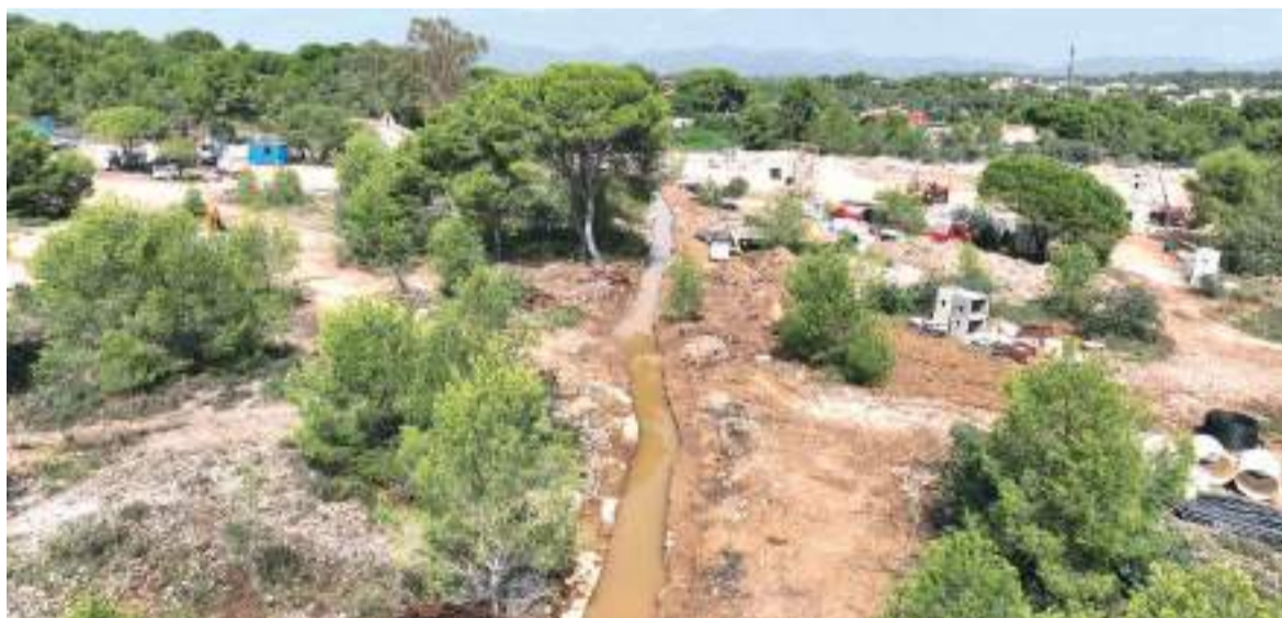
PAI de la Torre del Pirata

en aquesta àrea, les plataformes Salvem La Torre del Pirata Pulmó Verd de Godella i Natura Godella van sol·licitar a l'Ajuntament "la paralització immediata de les obres fins que hi hagués un estudi rigorós". El PAI que inclou la construcció de 447 habitatges va ser aprovat al 2002, al 2008 es van paralitzar les obres i la promotora va reprendre el projecte després