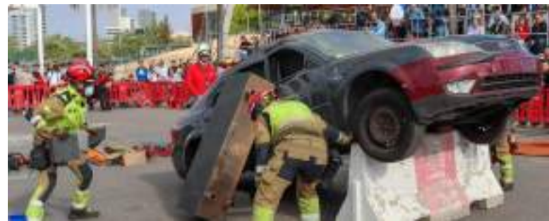
Recreació d'una actuació dels bombers

Tampoc va escapar de la destrucció total un dels escenaris més icònics de les representacions sacres de la Vida, Passió, Mort i Resurrecció de Jesús, el pretori, estructura que s'alçava sobre la plaça de l'Ajuntament per a acollir escenes clau com el lliurament del profeta als romans o el juí de Pilat. Sense estes localitzacions, de creació artesanal i la pèrdua de la qual està valorada en uns 35.000 euros, l'equip actoral i tècnic de l'Agrupació Cultural La Passió ha treballat sense descans per a tornar a representar totes les escenes, oferint una proposta escènica alternativa que segur emocionarà al públic.