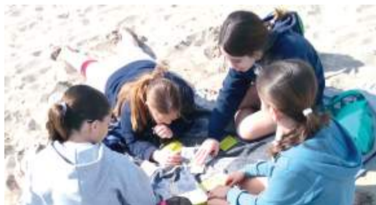
Activitats en la platja

Juventut de l'Ajuntament de la Pobla de Farnals ha organitzat una nova edició de Pasqua Jove, una proposta dirigida a joves d'entre 12 i 16 anys que tindrà lloc del 22 al 25 d'abril a l'Espai Jove, en horari de 10.00 a 13.00 hores.