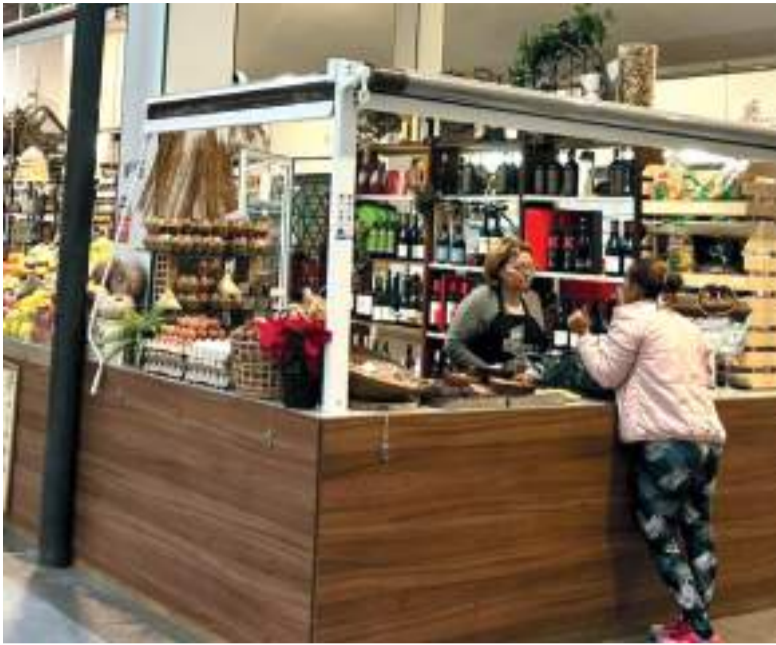
Mercat de Catarroja