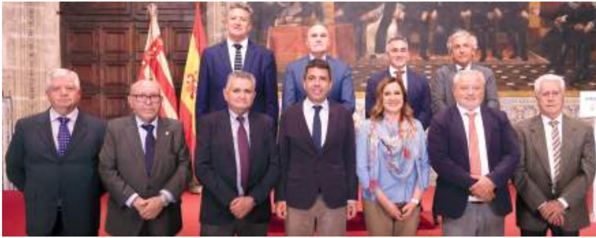
Firmants del Pacte de l'Aigua per l'Albufera