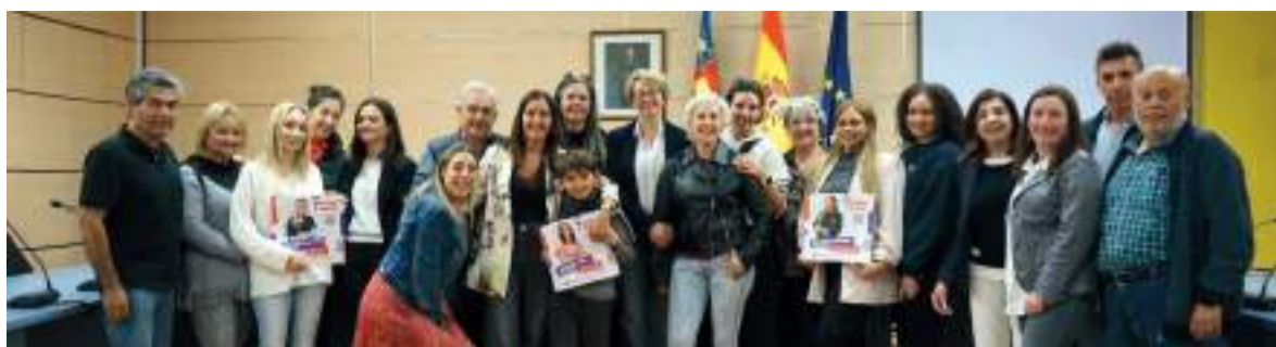
Presentació del curtmetratge a l'Ajuntament de La Pobla de Farnals