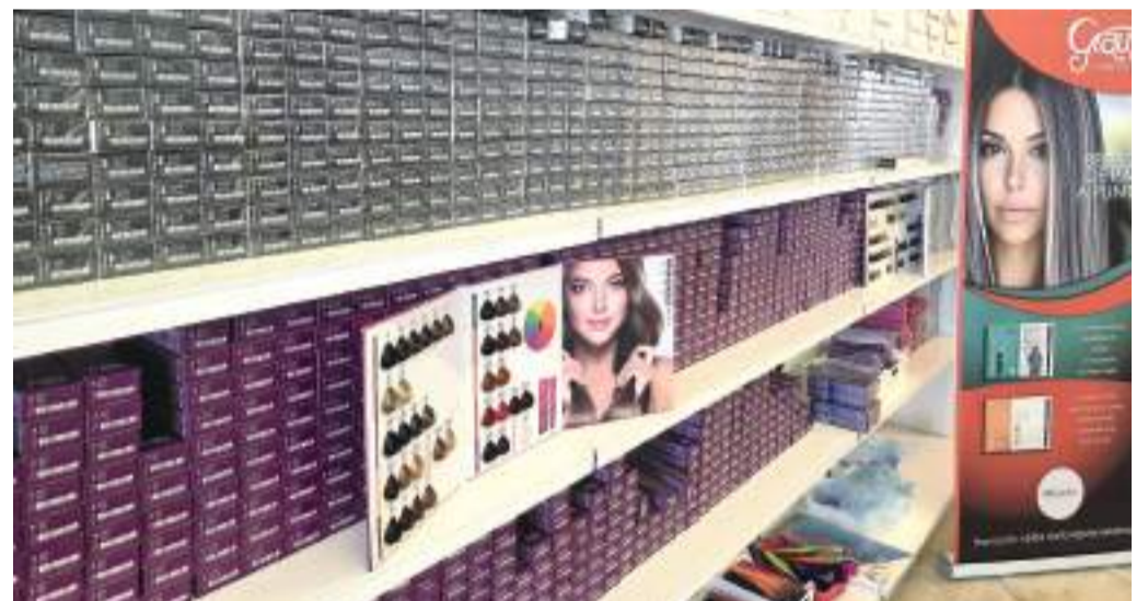
Cuentan con una gran gama de tintes y asesoran a las clientas sobre matizar colores o qué productos deben usar las personas con alergias.