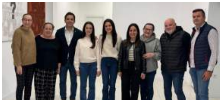
Sagredo amb la Presidenta de JLF i els membres de la comissió del Museu Faller

Amb este projecte, l'Ajuntament de Paterna fa un pas més en la seua aposta per la conservació i promoció de les seues tradicions.