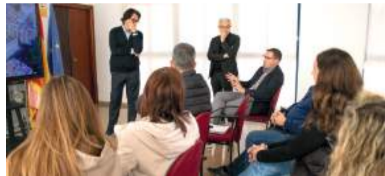
Presentació del projecte

Entre altres elements destacats, el futur edifici comptarà amb mesures específiques de protecció enfront d'inundacions, pistes esportives i gimnàs situats en la primera planta, així com criteris de sostenibilitat, eficiència, energètica i autosuficiència. Tot això