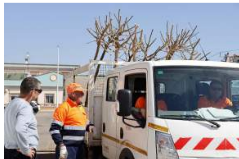
La brigada va ser l'encarregada de fer la plantació

tat, destaquen les moreres sense fruits, els tarongers bords i els aurons, totes elles espècies mediterrànies. A més, la brigada ha procurat substituir els que estaven malalts i cobrir els buits que havien quedat en diferents zones del nucli urbà.