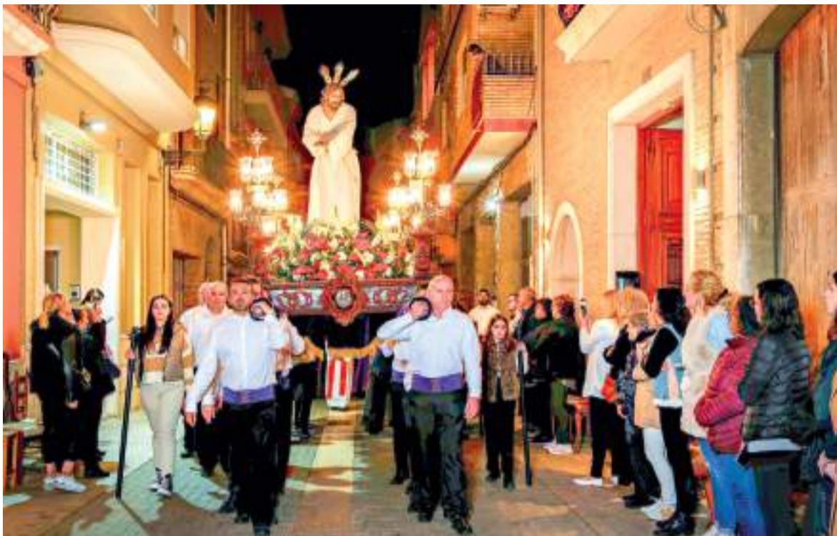
Processó a Alboraya