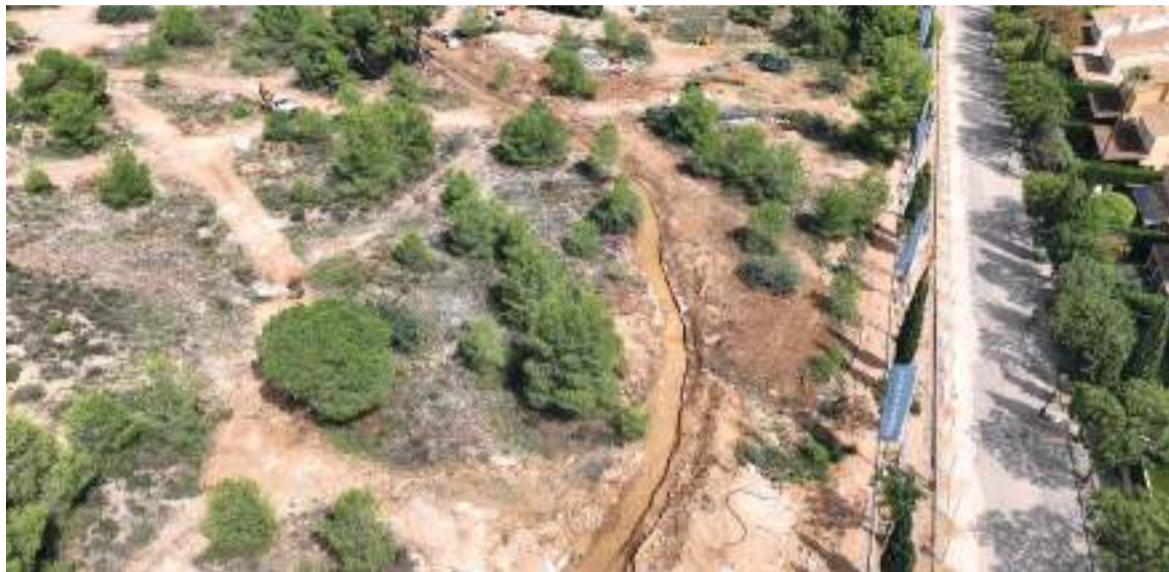
Situació actual de la zona

origen en la defensa del patrimoni d'aquesta zona de Godella.