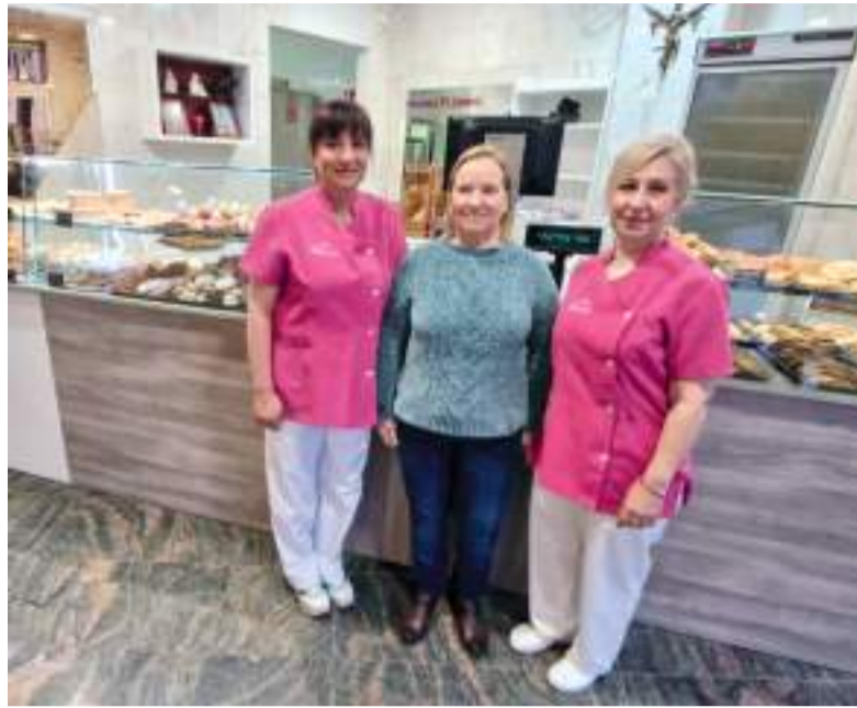
Forn pastisseria Fleming a Aldaia