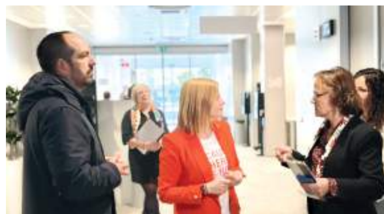
La delegada del Govern va visitar la població

Així mateix, s'han renovat els sistemes de contenció adaptant-los a la normativa actual mitjançant muralletes metàl·liques i s'ha procedit a la pavimentació de tot el tram de calçada afectat.