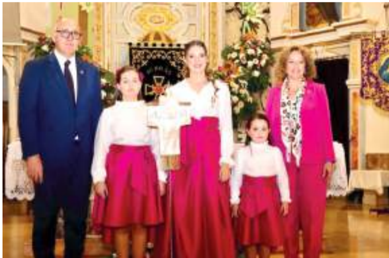
Pregó de la Setmana Santa a Torrent