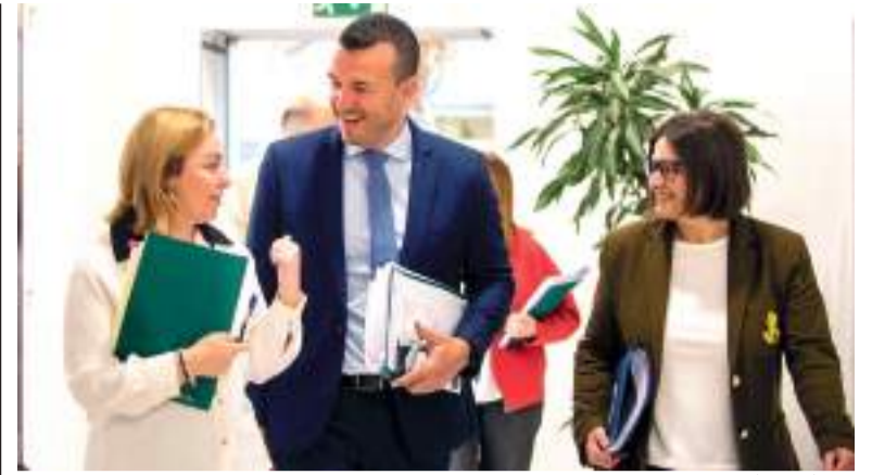
President i diputades de la Diputació de València