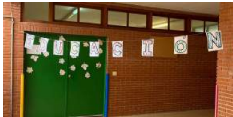
Escoleta de La Pobla de Farnals

La documentació completa de la licitació, així com els requisits tècnics i administratius, està disponible en el perfil del contractant de l'Ajuntament en aquesta mateixa plataforma.