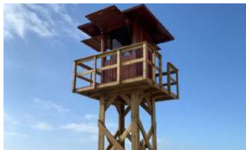
Noves torres de vigilància