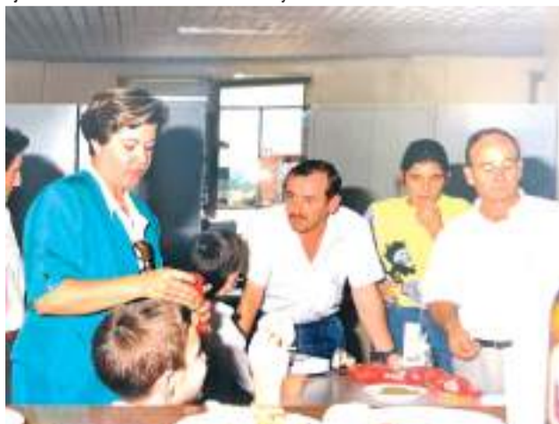
Treballadors municipals en els anys 90, en una celebració

replica, "tot va ser molt progressiu. Saps que el servici de recollida d'escombraries era molt diferent? No existia el plàstic, i el vidre no es rebutjava, els envasos buits es retornaven a les botigues. Eren uns altres temps".