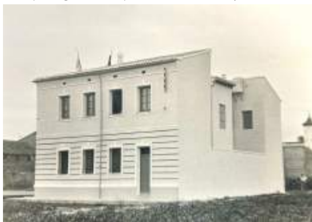
Ajuntament de La Pobla de Farnals en els anys 70