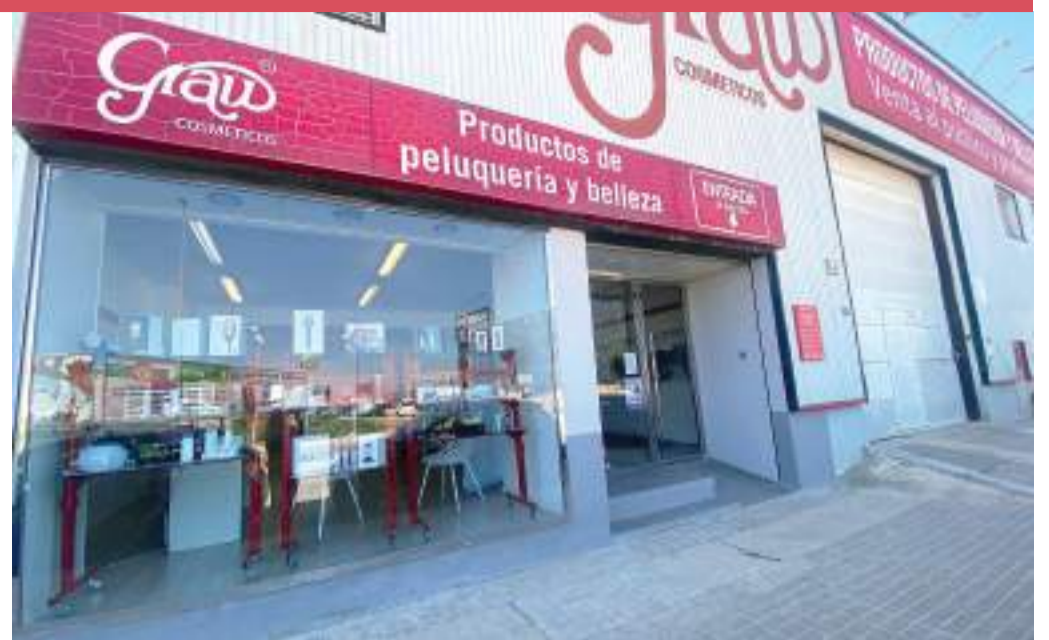
La tienda está completamente reformada. Está ubicada en la Calle Camí Fus, 64, polígono de Massanassa.