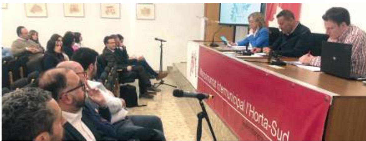
Ple de la Mancomunitat de l'Horta Sud