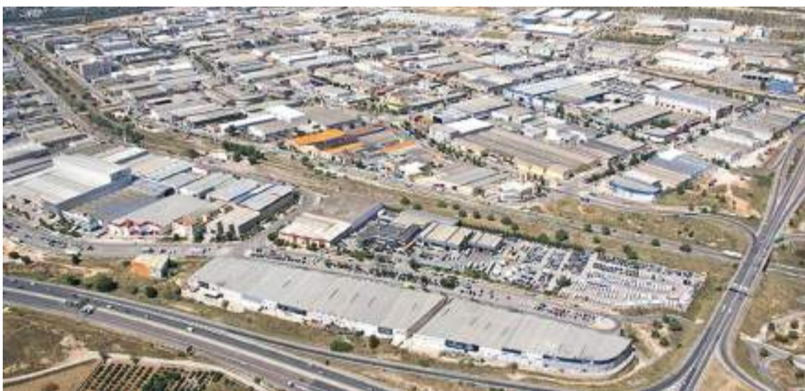
Polígon de Paterna

A través de l'ús de la nova tecnologia, la vigilància i control diari de la Unitat de Medi Ambient (UEMA) de la Policia Local de Paterna permet preservar el medi ambient i el benestar de la ciutadania minimitzant o garantint la prevenció dels abocaments no autoritzats en el terme municipal, entre ells, el paratge natural protegit de La Vallesa.