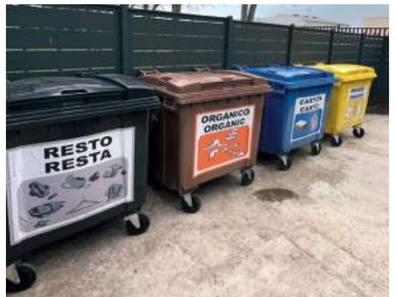
Il·la de contenidors a Meliana, tancada i videovigilada

L'inici de la implantació va ser un poc polèmic per l'exclusivitat del servei porta a porta, però després de les eleccions municipals i el canvi de govern van començar a instal·lar-se més illes de contenidors en la població. Un sistema híbrid que està funcionant. Recentment s'han instal·lat cinc noves àrees tancades de contenidors totes amb videovigilància.