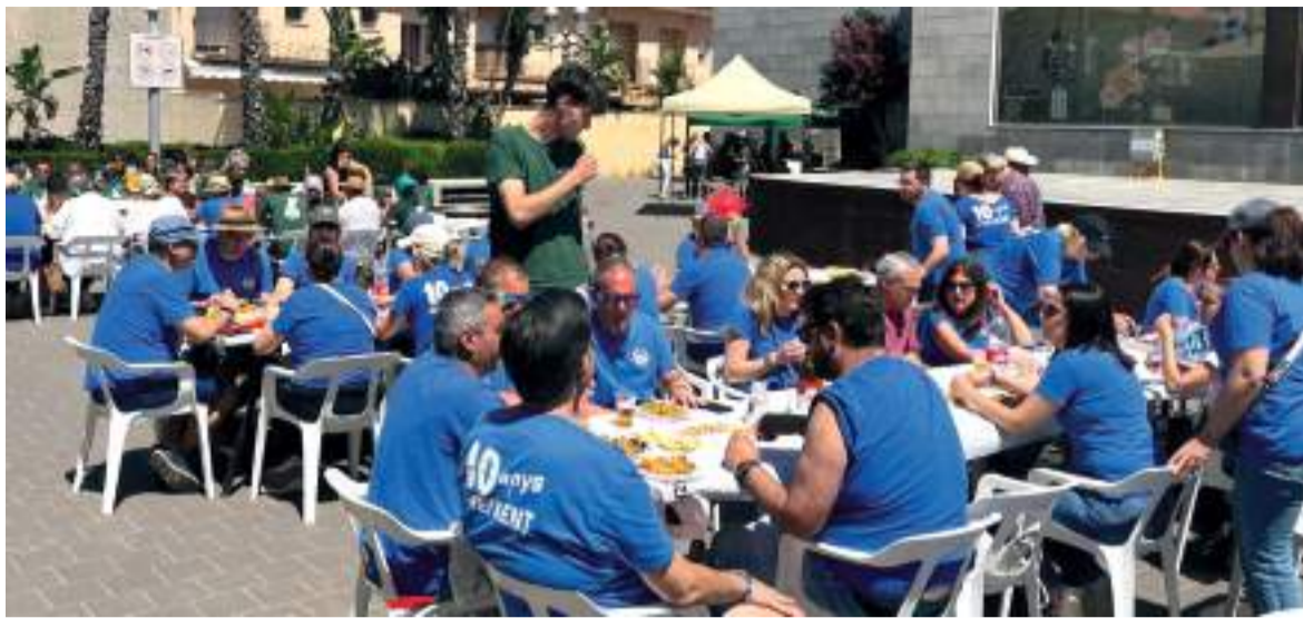
Jornada de germanor