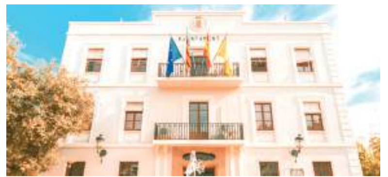
Ajuntament de Benetússer

La instal·lació oferirà servici ininterromput durant tres mesos, amb diferents horaris en funció del mes. d'esta forma, al juny i juliol la piscina obrirà de dilluns a dijous de 12.00 a 20:00 horas, mentres que els divendres, dissabtes i festius l'horari serà d'11.00 a 20.00 hores. Per part seua, durant el mes d'agost l'horari serà d'11.00 a 20.00 hores tots els dies de la setmana, adaptant-se així a la demanda creixent durant les vacances. L'accés a la piscina es gestionarà amb la web quartciutatesportiva.valbit.com .