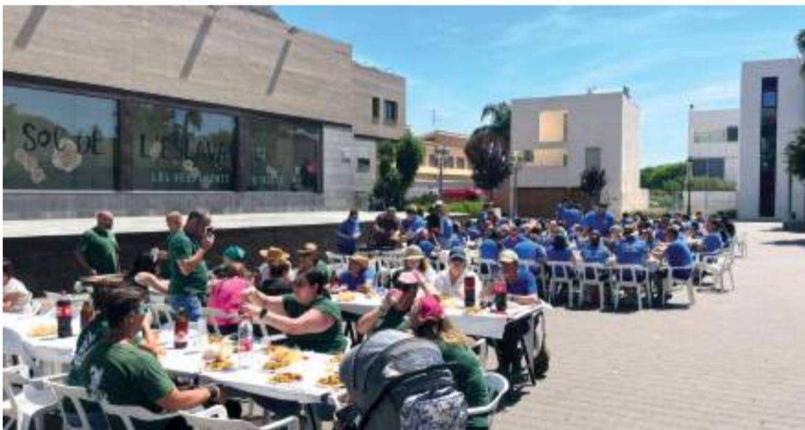
Jornada de germanor