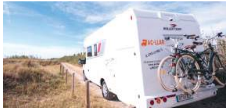
Viajar en caravana es un plan ideal para las familias

Con su participación en la feria, AC-LLAR no solo refuerza su presencia de marca, sino que reafirma su compromiso con el desarrollo del sector a nivel autonómico, en una apuesta por la innovación, la atención totalmente personalizada y una red de servicios diseñada para responder a las necesidades reales de los usuarios.