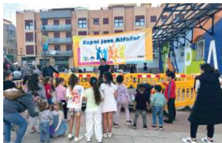
Obertura del centre

La mesura no sols alleujarà la càrrega econòmica de moltes famílies, sinó que també enfortirà el teixit social del municipi, promovent la solidaritat i la col·laboració en temps difícils.