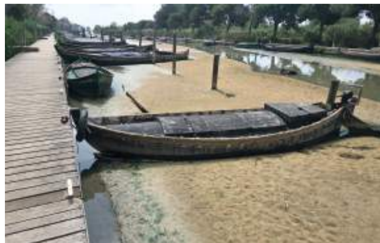
El fang ha deixat les barques atrapades en el Port de Catarroja