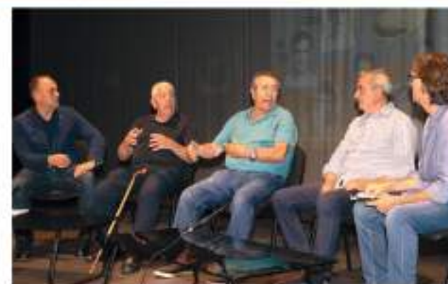
Les anècdotes contades per protagonistes van encantar al públic assistent