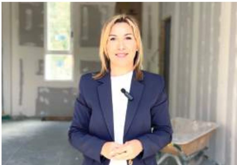
Pilar Peris, alcaldessa de Massamagrell