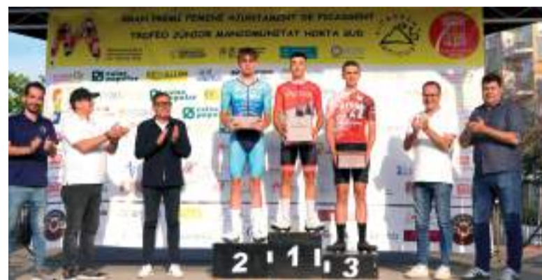
Entrega de trofeus

"Aquesta prova s'ha anat consolidant en quatre anys i en 2025 hem tingut una gran participació. Agraïsc enormement el treball que fa el Bici Club Picassent, que no sols fomenta l'esport entre la joventut sinó que fa comarca i contribueix a la cohesió amb aquesta prova intermunicipal",