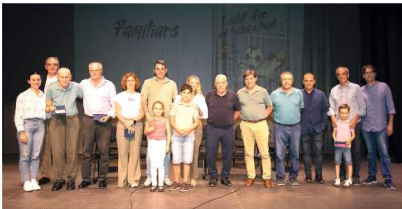
Reconeixement a tota una vida esportiva

La segona part de la trobada va comptar amb el públic i els protagonistes d'aquella edat daurada. Un acabar ple de nostàlgia i alegria per a tots els presents. Un acte homenatge que corona la dècada daurada de l'esport de Puçol.