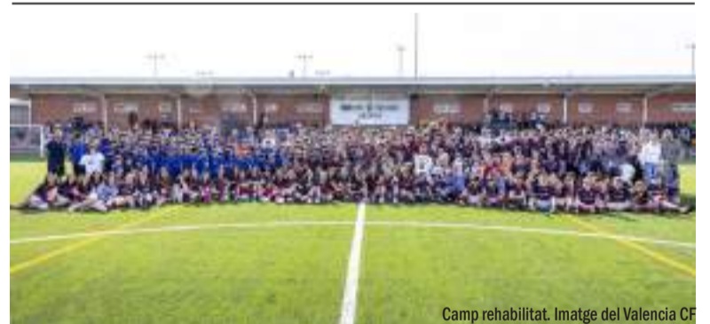
Camp rehabilitat. Imatge del Valencia CF

La sol·licitud de les quanties, que ascendixen a 2.500 euros per a unitats familiars de fins a dos persones, amb un increment de 300 euros per cada membre addicional de la unitat familiar, fins a un màxim de 900 euros, tindrà com a requisit que la renda per càpita de la unitat familiar o de convivència no excedisca els 8.400 € per a unitats familiars de 3 o més membres, 10.500 € per a unitats de dos membres i 12.600 € per a persones individuals que la sol·liciten. També s'haurà de justificar que la unitat familiar tinguera la seua residència efectiva a Benetússer abans del 29 d'octubre de 2024, així com disposar d'un informe tècnic favorable emés per l'Equip d'Intervenció Social dels servicis socials municipals.