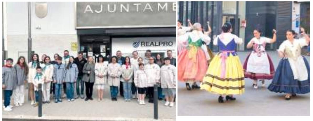
Algunes de les activitats realitzades en la Setmana Cultural en la població de Sedaví

LA 44 EDICIÓ S'HA CELEBRAT DURANT LA SETMANA DEL 12 AL 18 DE MAIG