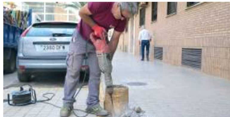
Obres als carrers de Paiporta

les tasques de reconstrucció després de la DANA que va afectar el municipi l'octubre de l'any passat. Durant la trobada, les autoritats locals van traslladar al conseller diverses preocupacions municipals relacionades amb la ges-