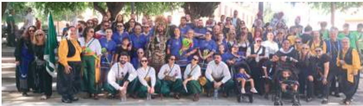
Mercat Medieval a les festes de Quart de Poblet