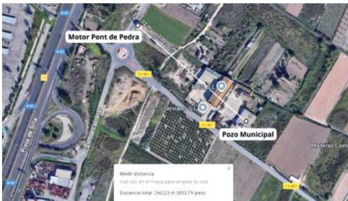
Imatge de la zona