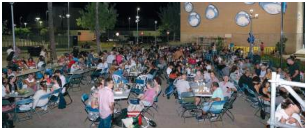
Sopar a la fresca

Unes festes que han sigut possibles un any més gràcies al treball de les clavaries, comissions i de l'ajuntament.