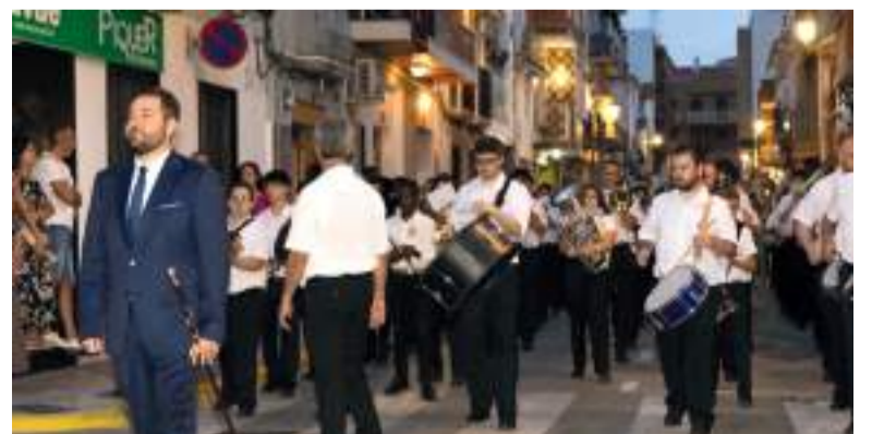
Processó a les festes de Rafelbunyol

Tampoc han faltat assistents als actes religiosos, omplint-los i mostrant la seua tradició i devoció.