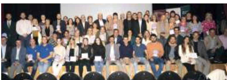
Premiats de l'any passat i autoritats locals

El client compra una targeta de 50 euros, amb la qual podrà comprar productes per valor de 100 euros en els comerços locals de les 26 poblacions de la província de València més afectades per la Dana