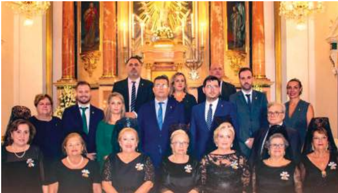
Solemne Misa Major en honor a la Mare de Déu del Do