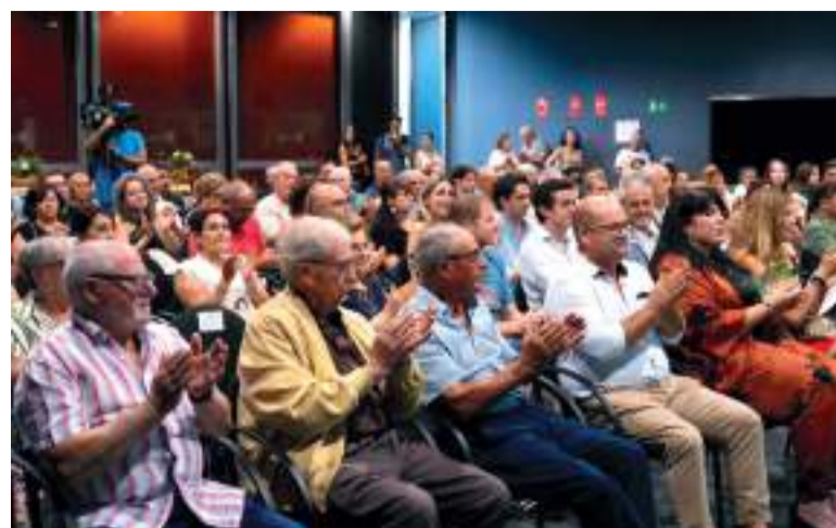
Gran assistència de públic