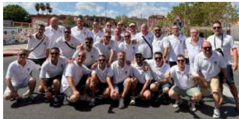
Gran Mascletà de festes locals, organitzada pels Clavaris del Crist