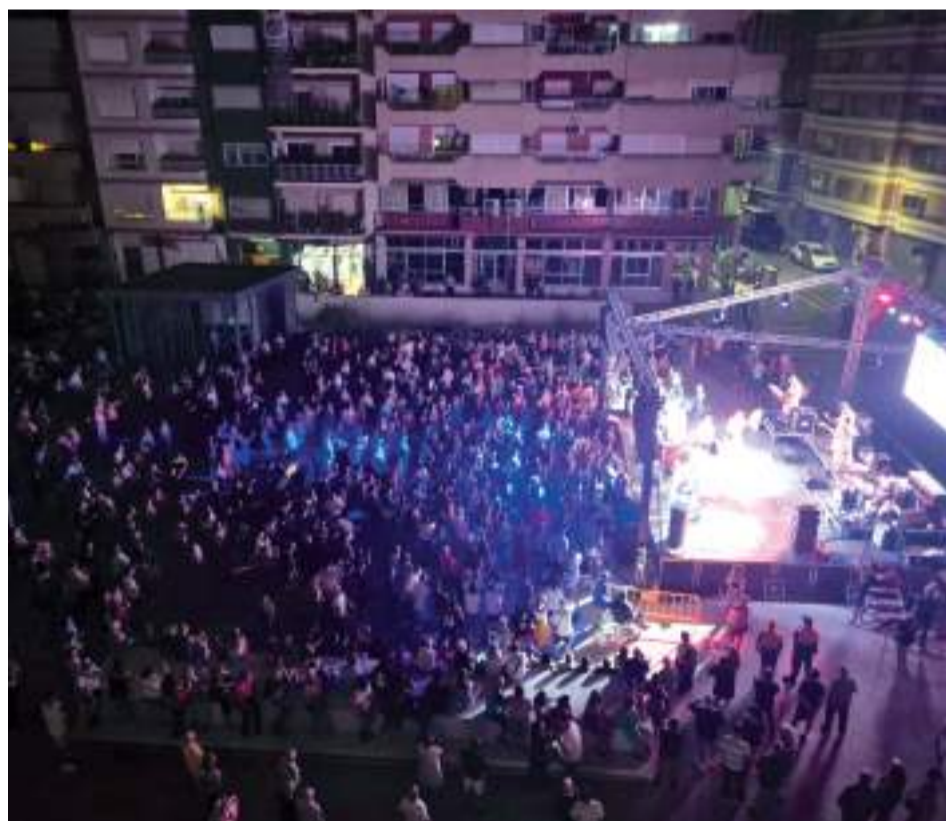
Participació en les festes de la població