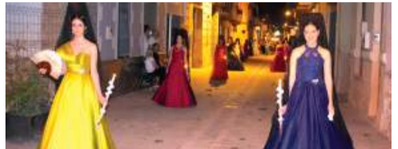
Solemne processó a la Mare de Déu del Do