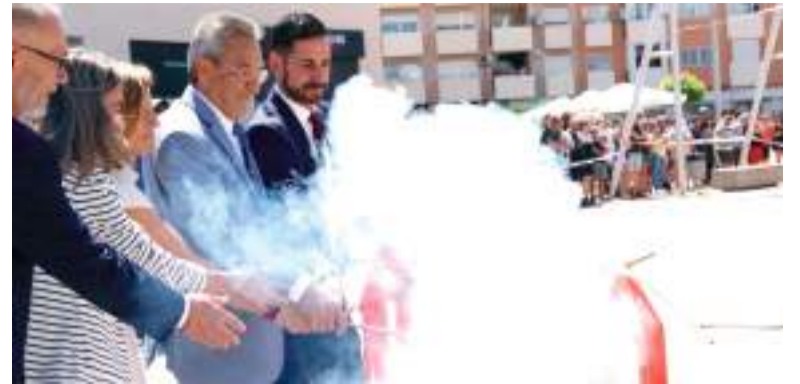
Gran 'mascletà' a les festes de Mislata