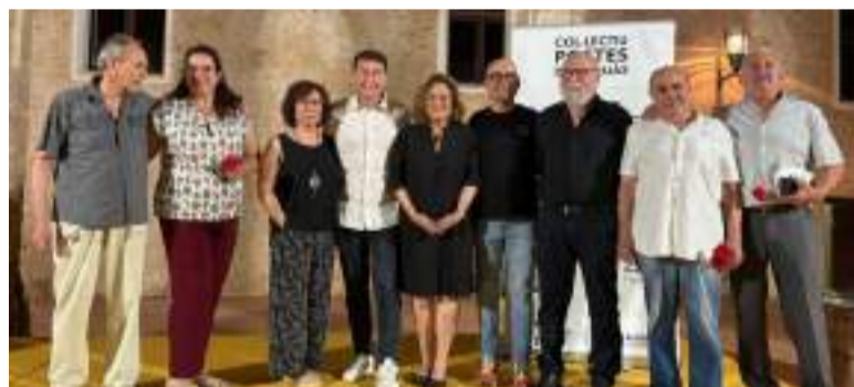
Festa i Poesia a les Festes Majors d'Alaquàs 2025

A continuació van desfilat les tropes cristianes, desfilada que va ser tancada per la Capitania Cristiana d'enguany, la Comparsa Cristiana Valkiria, amb un espectacle centrat en el seu significat: "les dones de la mort" i les deesses de la batalla". Una posada en escena que va donar a conèixer com entre batalla i batalla, aquest poble mediava i pactava amb la mort quins eren els guerrers que havien de viure o de morir.