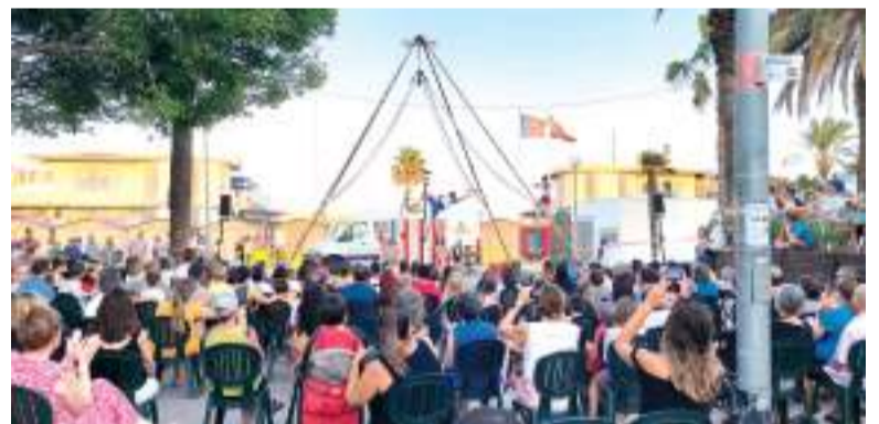
Espectacle a la Plaça Corts Valencianes

Les valoracions recollides en el formulari de satisfacció destaquen especialment la qualitat dels espectacles de circ i música, amb comentaris destacats entre les persones usuàries com ara "M'encanta això que feu" o "La