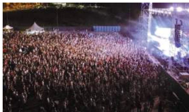
Gran èxit dels concerts

Més enllà de les novetats, cal destacar l'aposta i reforç per les tradicions més genuïnes com ara el concurs de pilota dolça, plat típic picassentí, el concurs de fanalets amb la participació de més de 200 famílies, el correfoc amb un acompanyament multitudinari, el Cant de la Carxofa o les carres de joies.