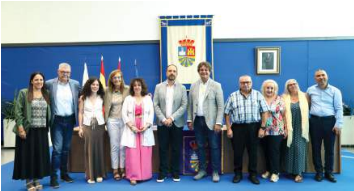
Recepció d'Aldaia a Fuenlabrada