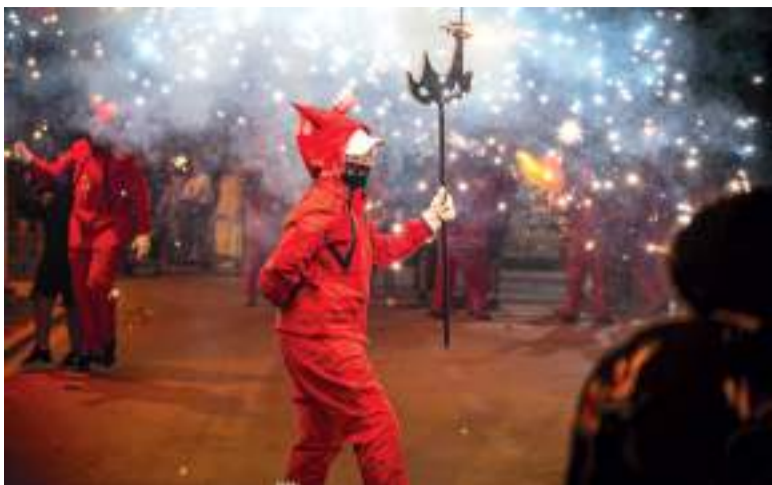
Correfoc a les festes de Moncada