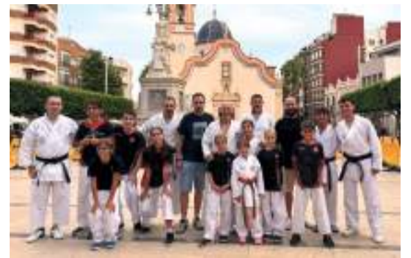
L'esport sempre present a les festes d'Alfatar