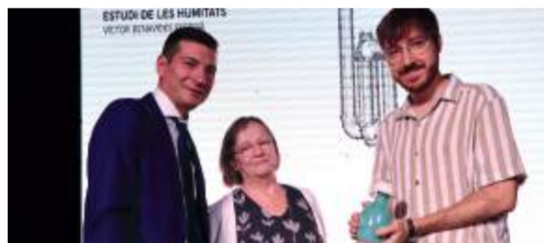
Benavides arreplegant el premi

Finalment, la directora general ha destacat que esta important iniciativa "no només millorarà la connectivitat entre les poblacions de Museros i Massalfassar, així com el seu accés a la platja, sinó que també respon a les necessitats de mobilitat sostenible en la regió".