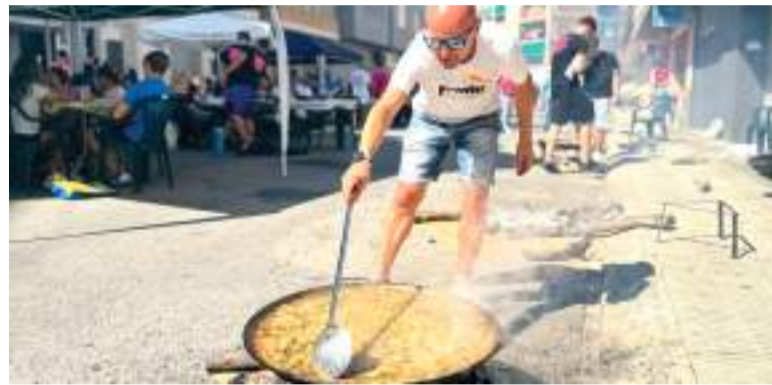
Imatges de les festes de Massamagrell l'any passat