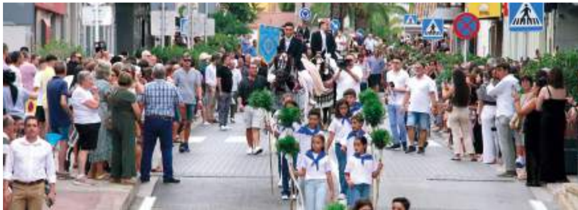
Els més xicotets participen en els actes més tradicionals de Puçol