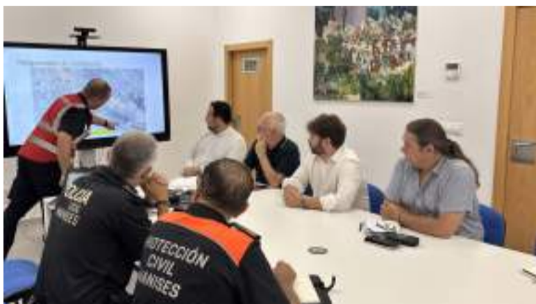
Reunió a Manises

Lauge dels baixos vivenda per la falta residencial també provoca la pèrdua de locals comercials. En eixe sentit, Rafelbunyol, municipi de l'Horta Nord, ha sigut un dels primers també a optar per denegar eixos canvis d'ús de comercial a vivenda.