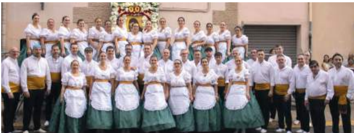
Ofrena de flors