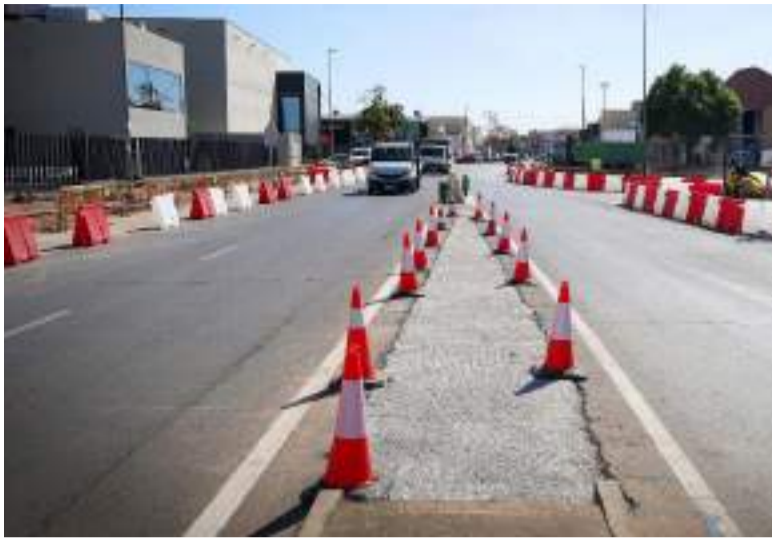
Obres a la zona de Torrent