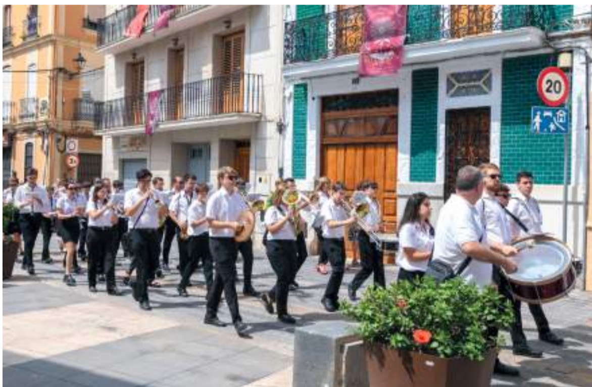
La música sempre present en les festes d'Almàssera