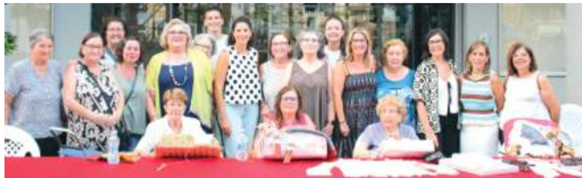
Activitats per a totes les edats en les festes de Quart de Poblet