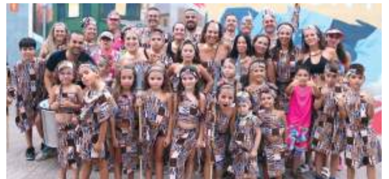
Disfresses a Rafelbunyol