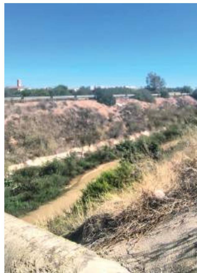
Carraixet per l'Horta Nord

Per tant, els tres punts a destacar en la neteja dels barrancs