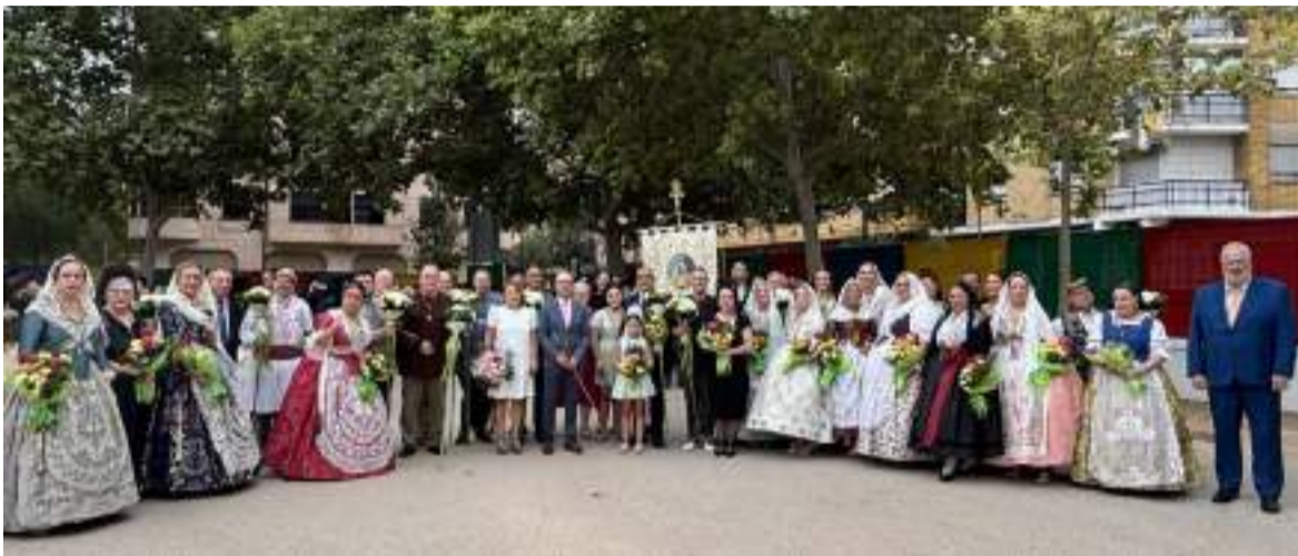
Ofrena de flors