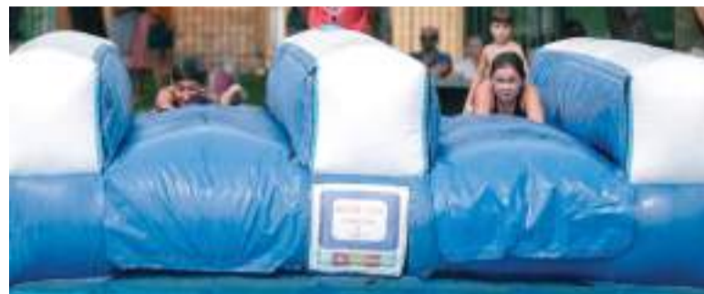
Dia de xiquets amb activitats aquàtiques