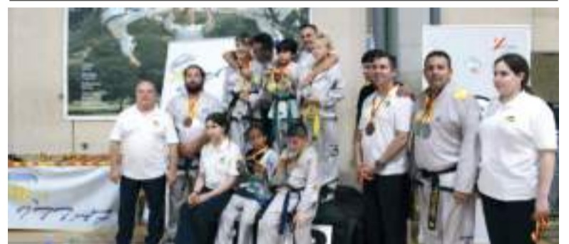
Club Won Almàssera

Així mateix, Gómez ha volgut dirigir-se a la ciutadania amb un missatge de responsabilitat: "Des de l'Ajuntament posem els recursos a la disposició de totes i tots, però necessitem la col·laboració veïnal per a evitar que es repetisquen situacions com esta. El futur d'un Massamagrell més net i cura depén també de la implicació de cada ciutadà". Amb esta actuació, l'Ajuntament reafirma el seu compromís amb la millora dels espais públics i amb el manteniment d'unes condicions adequades tant en el nucli urbà com en les àrees industrials del municipi.