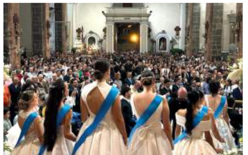
Representants de les festes d'enguany durant els actes religiosos