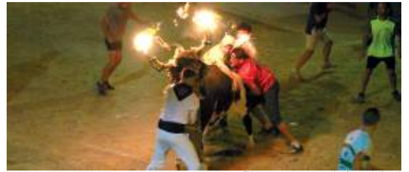
El bou, sempre present a les festes de Puçol

L'Ofrena de Flors d'enguany va ser un acte més especial si cap, ja que va comptar amb la participació de fusters d'anys anteriors. En definitiva, han sigut moments únics que amb tota seguretat quedaran gravats en els records dels veïns i veïnes de Puçol.