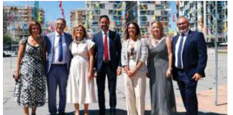
La delegada del Govern, la consellera i la presidenta de la FVMP junt l'alcalde de Mislata i regidors