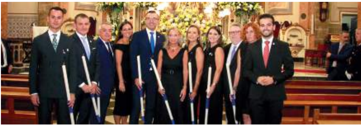
El president de la Diputació va estar present en els actes religiosos de la població