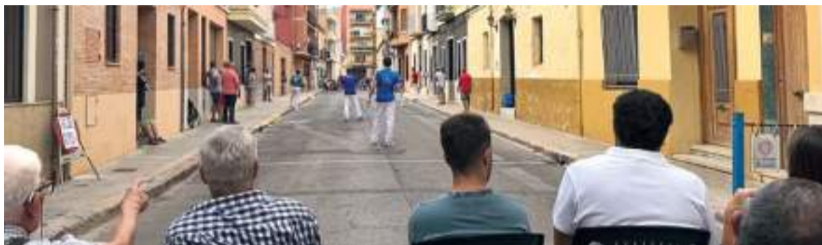
Partida de pilota als carrers de la població

protagonisme amb actuacions com la de l'orquestra Panorama, la millor d'Espanya, que no va deixar indiferent a ningú. Enguany l'Ajuntament ha recuperat una tradició molt arrelada en la localitat, la Nit dels Fanalets, fomentant la convivència i la creativitat infantil i transmetent un costum local a les noves generacions. En definitiva, les de 2025, han sigut unes festes inoblidables amb gran acolliment i participació, i que a ben segur han gaudit tots els que s'han deixat caure per aquest municipi de l'Horta Nord.