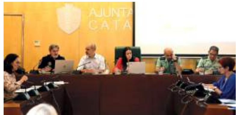
Reunió Junta Local de Seguretat

"Tinguem la festa en pau" és el lema triat per a la campanya municipal contra les violències masclistes durant les Festes. Els concerts principals compten amb un punt violeta dins del recinte amb