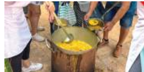
Tradicional Caldera de Moncada