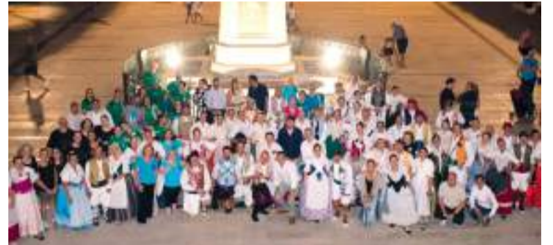
Festa de la Font