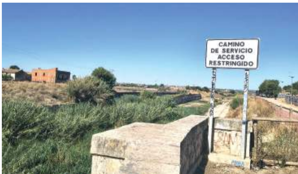
Barranc del Carraixet, accés restringit

Els barrancs són part del terreny de l'Horta i del secà i és de gran interès mantindre'ls nets i cures per a evitar el que a molts ens dol recordar.