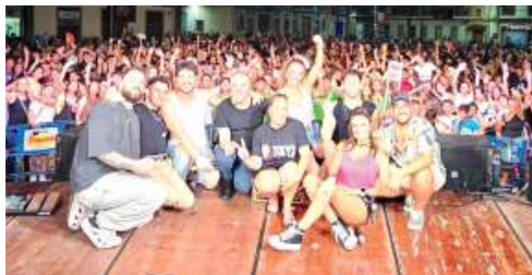
Nit de música

bres de l'associació Gent de Poble, organitzadors de l'acte. A més, s'han seguit amb devoció els actes religiosos i les processons a la població, on els veïns i veïnes de la localitat amb mostrat la seua fe al Corpus, a la Mare de Déu d'Agost i al Crist de la Fe i la Providència.