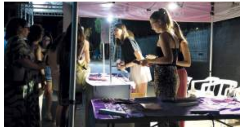
Punts violeta a les festes de Catarroja

il·luminació, que comença mitja hora abans de l'espectacle i tanca mitja hora després. Aquests punts estan atesos per professionals que informen, sensibilitzen i acompanyen la ciutadania que s'apropa, i que actuen en tot moment en coordinació amb les forces i cossos de seguretat.