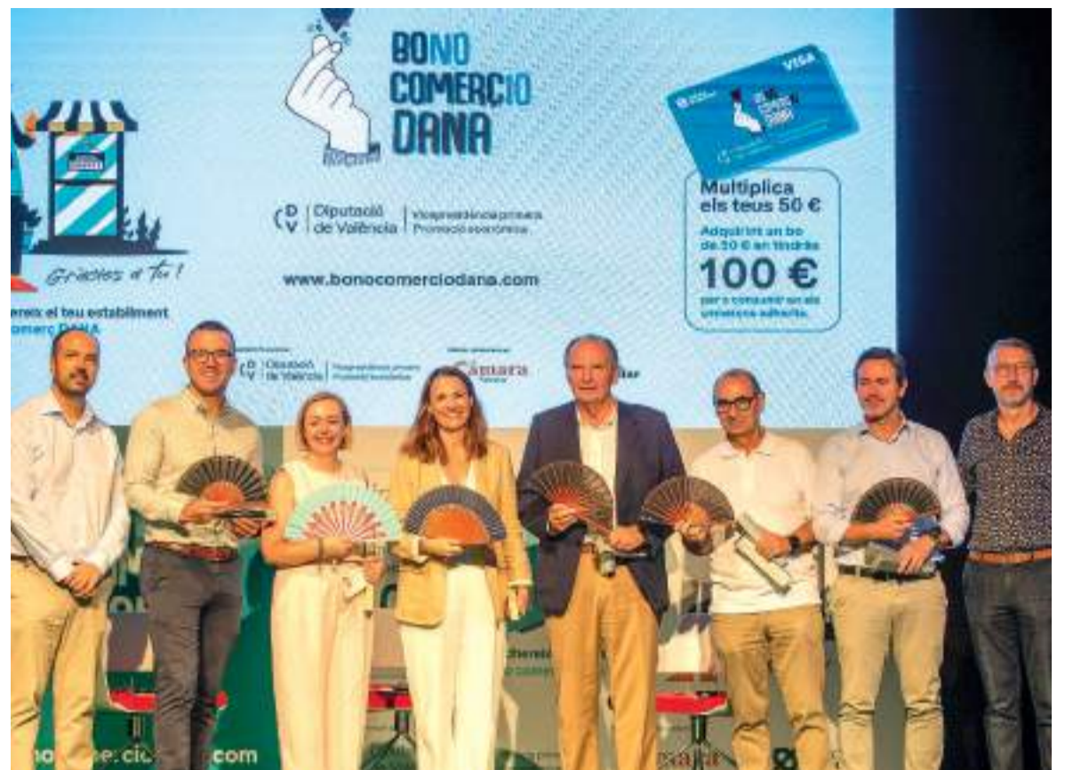
Presentació a Aldaia dels Bo Comerç Dana

El màxim responsable provincial considera que la burocràcia "s'ha