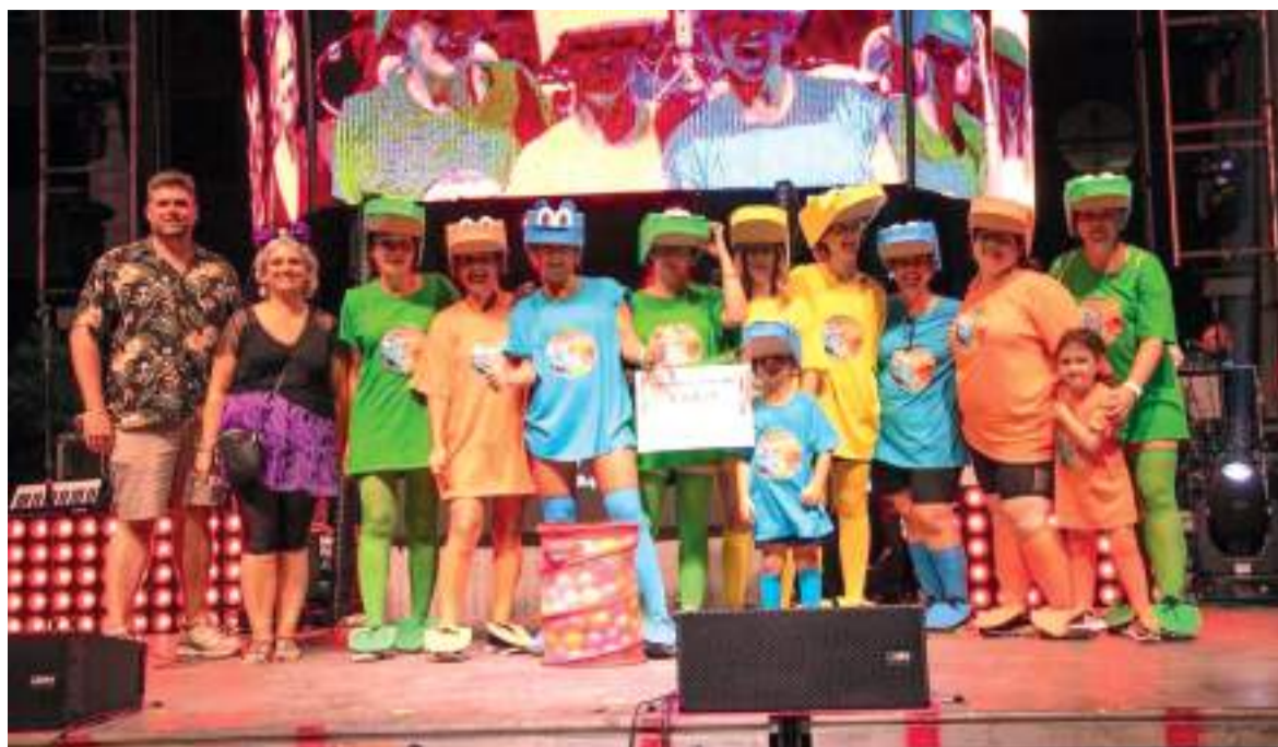
Divertida nit de disfresses a Alfara del Patriarca