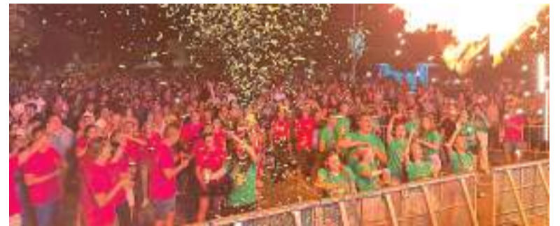
Gran participació en les festes