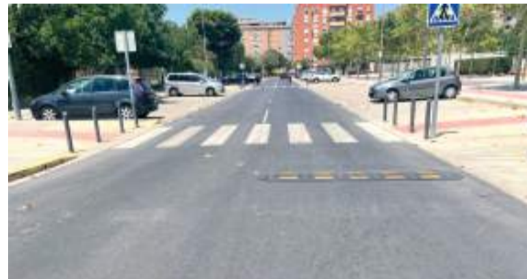
Reductors de velocitat a un carrer d'Alaquàs

"L'educació és la base de la igualtat d'oportunitats i des del consistori treballarem perquè tots els xiquets, xiquetes i joves de Xirivella disposen dels recursos necessaris per a aprendre, créixer i construir el seu futur en les millors condicions", ha finalitzat l'alcaldeessa de Xirivella.