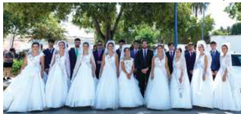
Regina i dames d'este 2025 juntament amb l'alcalde