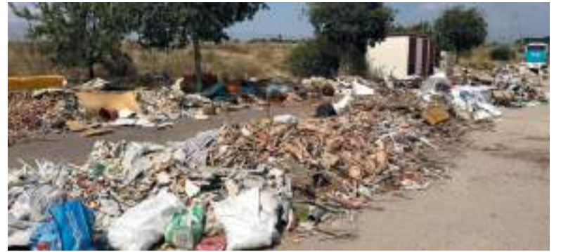
Enderrocs al polígon Bovalar

En la seua intervenció, Benavides va manifestar sentir-se especialment orgullós per haver sigut mereixedor d'un premi amb el nom de Vicent Andrés Estellés per bandera, màximament en 2024, any d'intenses celebracions a propòsit del centenari del naixement d'un poeta que no va desistir de la seua obstinació de reivindicar el poder de la paraula i la necessitat honrar la memòria col·lectiva.