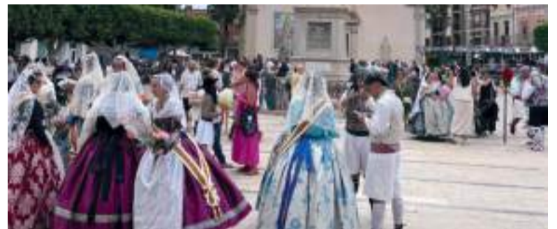
Ofrena de flors