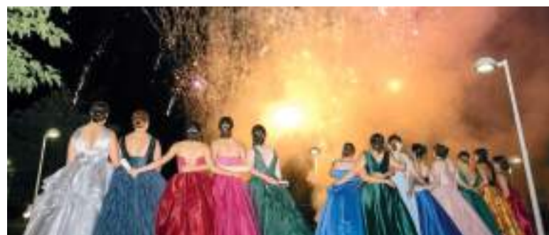
Nit màgica amb els focs artificials