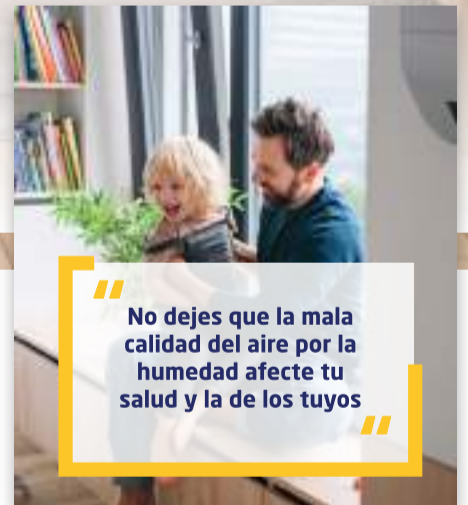
CALIDAD DEL AIRE

“ No dejes que la mala calidad del aire por la humedad afecte tu salud y la de los tuyos ”