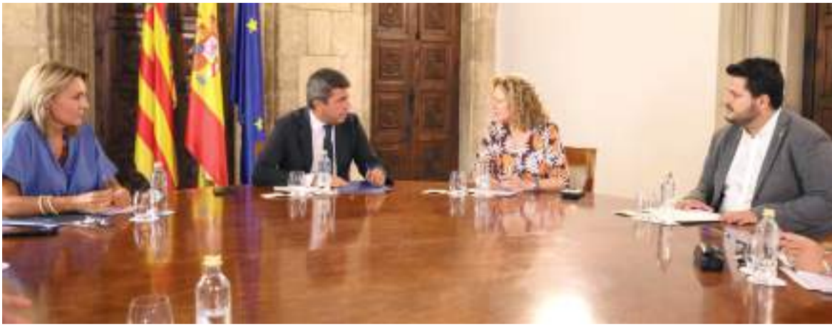
Reunió dels alcaldes amb Mazón i Camarero