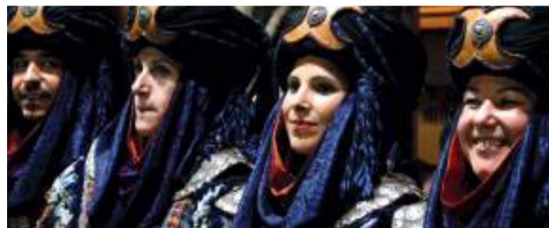
L'alcaldeessa va participar en les festes de Moros i Cristians