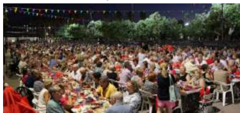
Sopar dels Majors