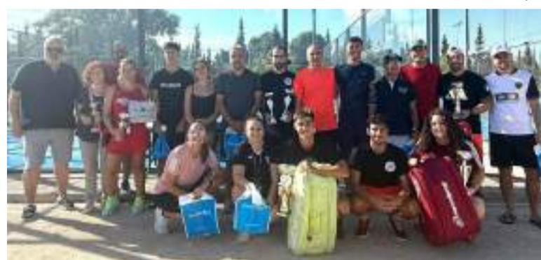
Torneig de Festes de Pàdel Absolut Masculí i Mixt i de Tennis Absolut