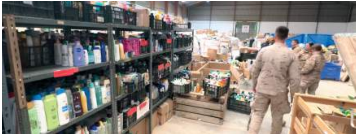
Sistema de distribució d'ajuda humanitària

"Este reconeixement internacional és fruit de l'esforç col·lectiu del personal municipal, les entitats socials i la ciutadania i el volun-