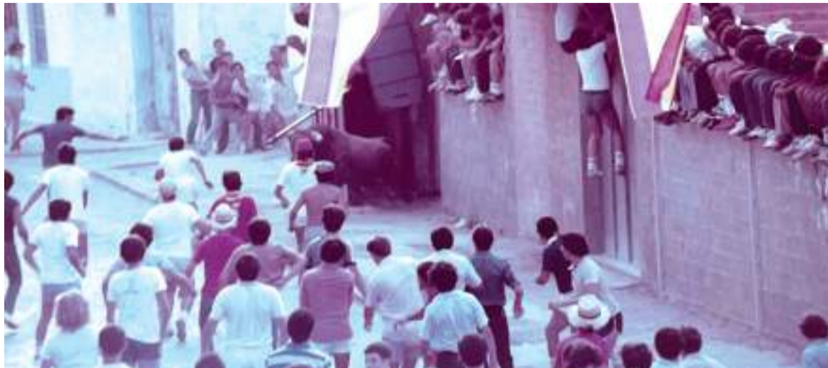
Eixida del bou 'El Guerrillero', 14 d'agost de 1982.

Text: Jesús Piquer Bestuer. Cronista Local.