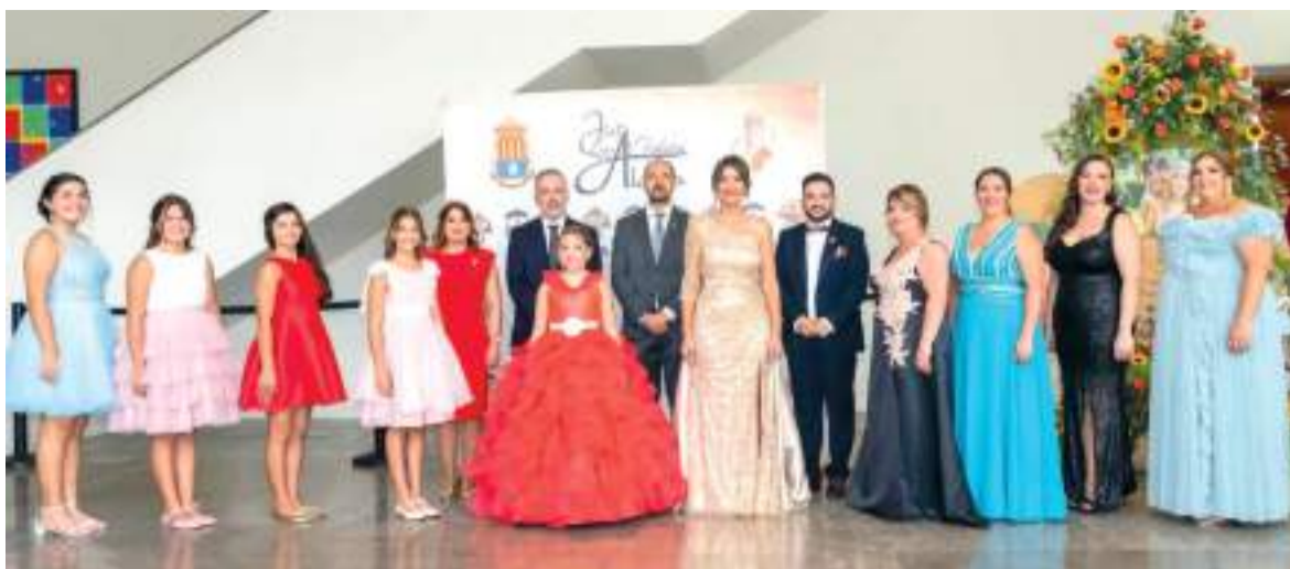
Les Falleres Majors d'Aldaia junt a les seues Corts d'Honor i autoritats locals

El consistori ha destinat íntegrament esta quantitat a través d'ajudes directes, garantint que els fons estatals s'utilitzen de manera immediata en la recuperació de les famílies afectades. D'esta manera, l'Ajuntament d'Aldaia justifica la utilització dels fons atorgats pel Ministeri, reforçant el seu compromís amb la transparència i amb l'atenció a les necessitats urgents de la ciutadania.