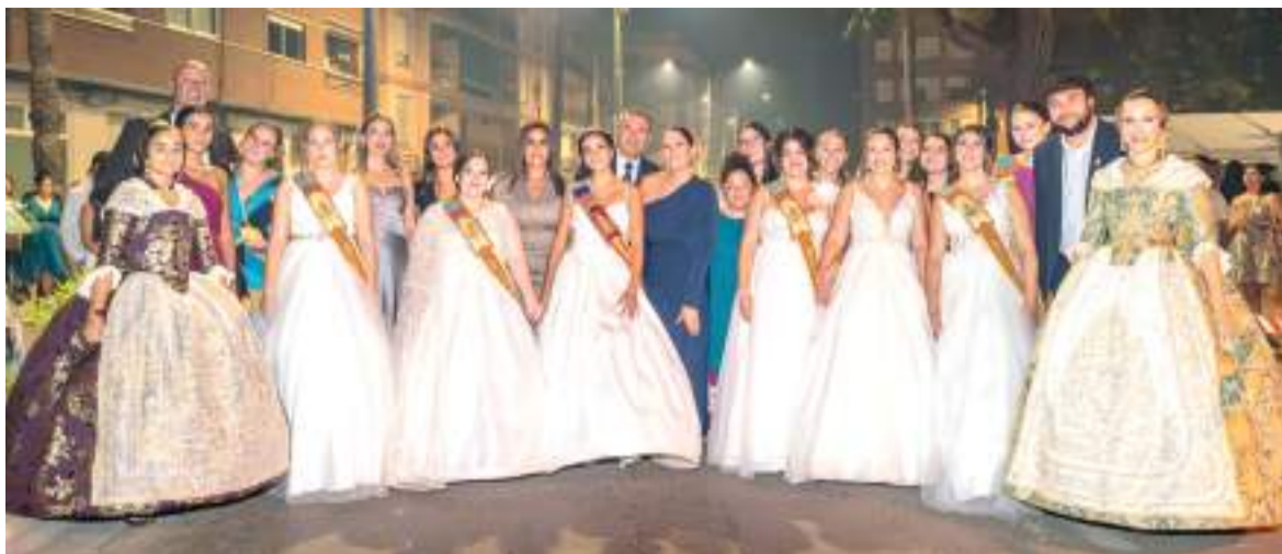
Alcaldesa i Reina i Cort d'Honor amb falleres majors i regidors.