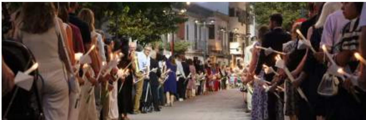
Processó General i Cant de la Carxofa a la Mare de Déu de l'Olivar