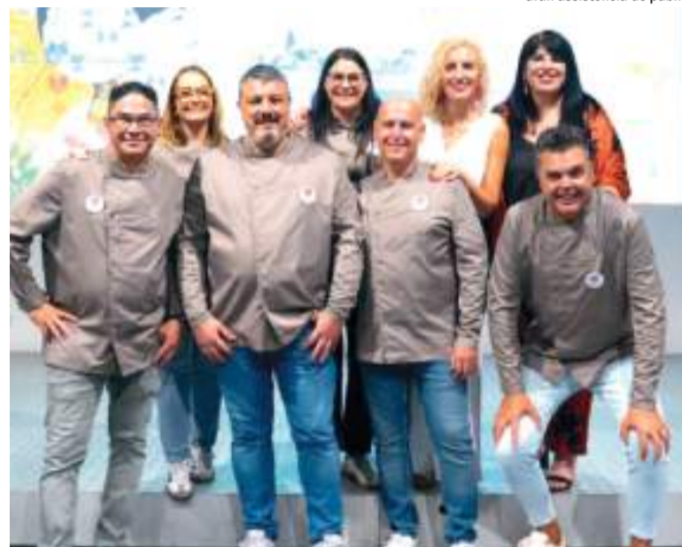
Membres del Club de Producte de Meliana també van acudir a l'acte

Una fira que es fa gràcies a "la voluntat institucional però, sobretot, a la col·laboració mútua de