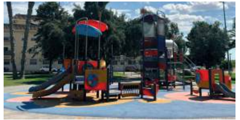
Parc al barri de Santa Rita

El punt i final de la programació d'esta setmana arribarà el dilluns, 22 de setembre, amb la reivindicació del Dia Europeu sense Cotxes, sota el lema "Paterna sense cotxes".