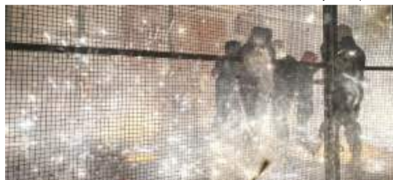
Correfocs a les festes d'Alaquàs