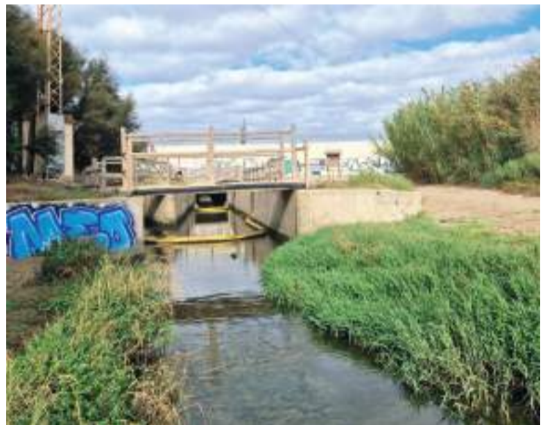
Séquia de Sant Vicent

Si bé encara no hi ha data fixada, l'Ajuntament d'Alboraià sumarà dues accions a escala municipal en les pròximes setmanes: el desviament de la séquia de 150 metres al nord del càmping de Pei-