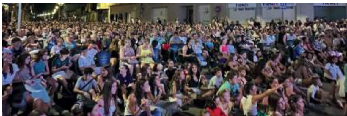
Molt de públic en les actuacions