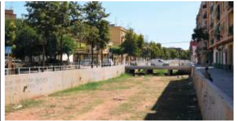
Barranc La Saleta a Aldaia

Amb este gest, Fuenlabrada i Aldaia consoliden una relació de cooperació basada en la solidaritat, la convivència i el suport mutu en moments de dificultat.