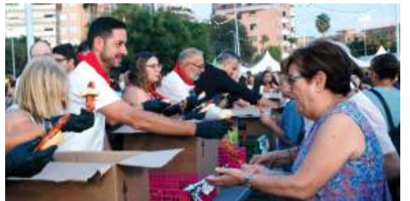
Vesprada de pintxos