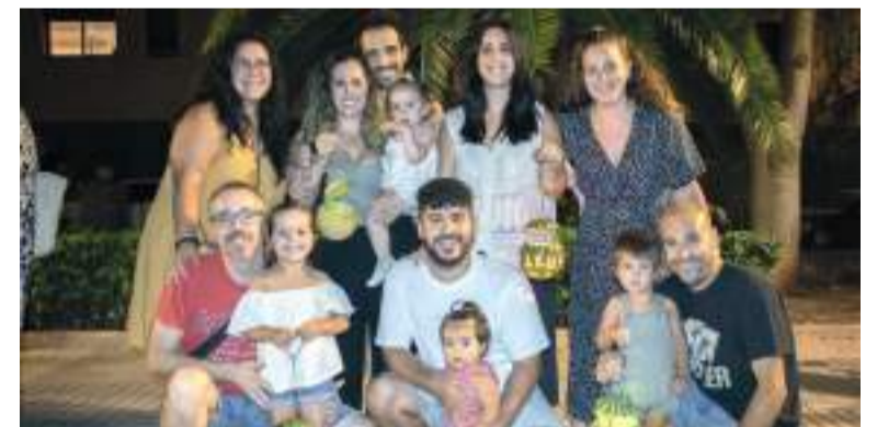
Nit dels 'farolets'