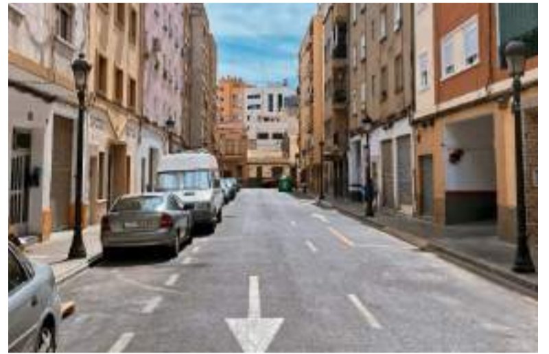
Carrer de Mislata

Durant la reunió s'han analitzat els riscos i les zones vulnerables i s'ha revisat el pla d'actuació, així com s'ha abordat la coordinació entre cossos d'emergència i serveis municipals i els protocols d'informació a la ciutadania.