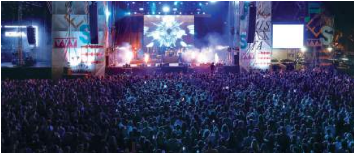
Milers de persones van disfrutar dels concerts