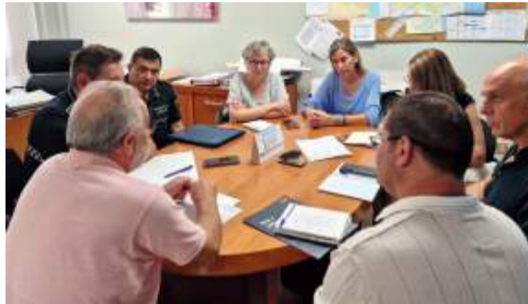
Reunió a Alboraia

Ja amb la llum verda del mateix Ajuntament i de la Generalitat Valenciana, la zona abandonarà un polígon en desús per a donar pas a