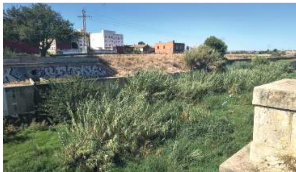
Estat actual del Carraixet