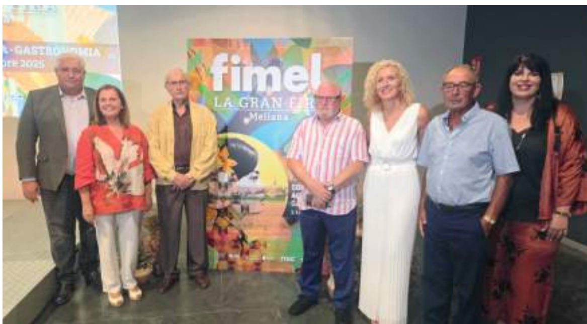
Alcaldeessa, diputats i regidora de Fimel amb els premiats d'enguany