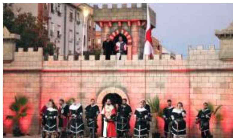
Gran espectacle de les festes de Moros i Cristians a Quart de Poblet

El consistori també ha volgut ressaltar que Quart és un poble que "demostra que és capaç d'unir-se com una gran família per a viure moments únics", han afirmat des de l'Ajuntament.