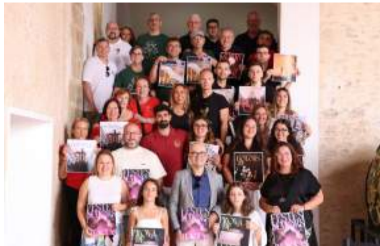
Festers, clavaris i entitats de les festes d'Alaquàs durant la presentació de la programació