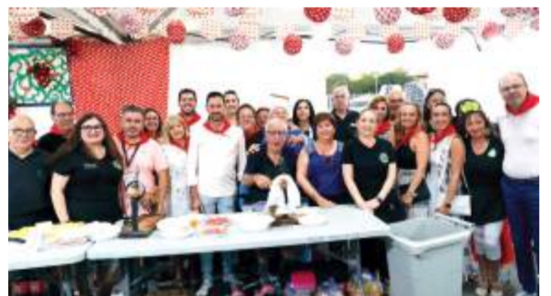
Les entitats locals també van participar en les festes