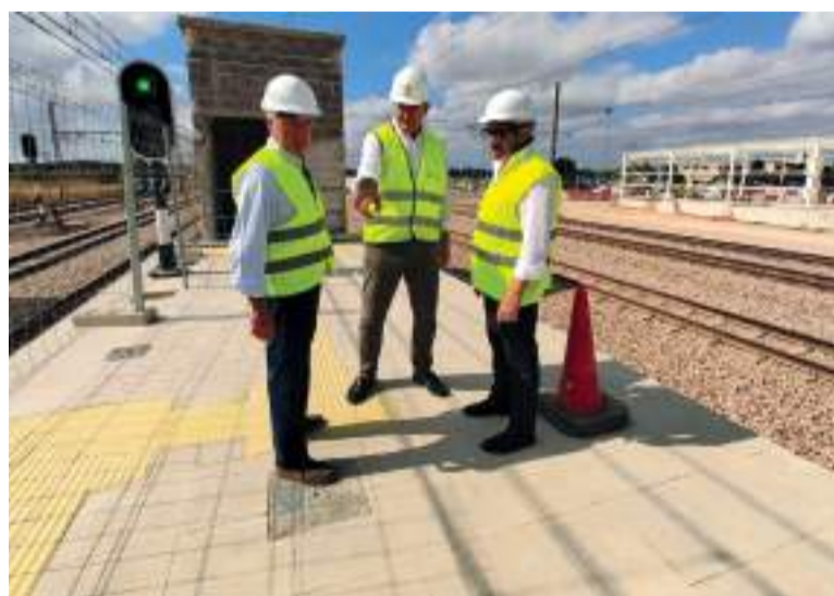
El conseller va visitar les obres

més, "València Sud es convertirà en un important eix intermodal amb accés directe a la zona d'aparcament dissuasiu gratuït de 506 places, 14 destinades a persones de mobilitat reduïda, i tindrà una connexió ciclopedestre, així com un ràpid accés a les Línies 1, 2 i 7 del metre".