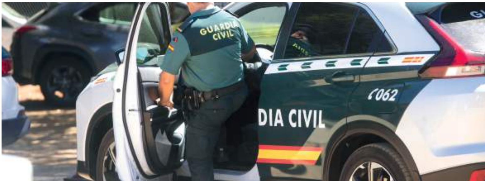
Vehicle de la Guardia Civil