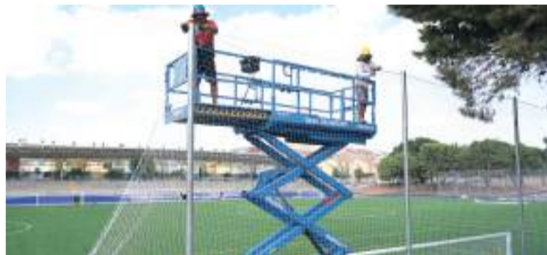
Treballs al camp de futbol de Paiporta

A més, Creu Roja i la marca esportiva Sprinter han fet possible, a través d'una subvenció donada a un dels clubs locals, el condicionament provisional d'un dels espais per al seu ús com a oficines i espai d'emmagatzematge de material, en benefici de tots els equips i de manera provisional.