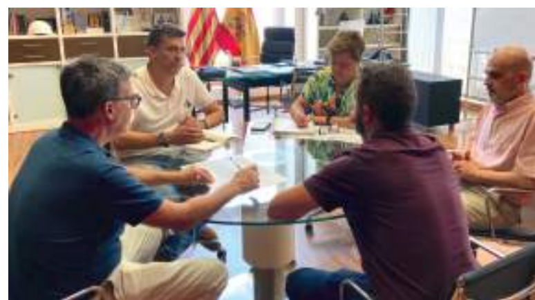
Reunió amb Hidraqua en l'Ajuntament

Gràcies a esta inversió, el municipi d'Alfatar enfortix la seua infraestructura hidràulica i s'anticipa a possibles desafiaments derivats de la variabilitat climàtica, la qual cosa assegura un subministrament fiable per a tota la ciutadania.