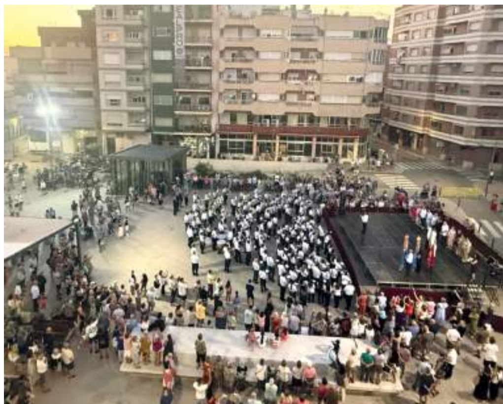
Festes a Sedaví