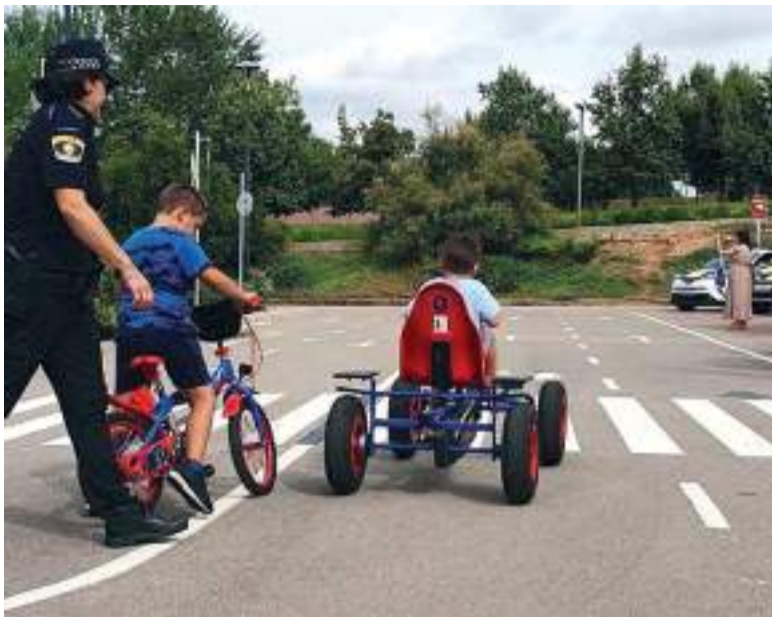
Imatge de l'any passat de les activitats