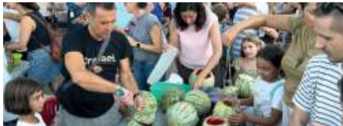
Activitats per a tots