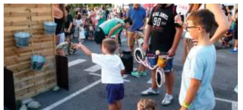
Activitats per als xiquets i xiquetes