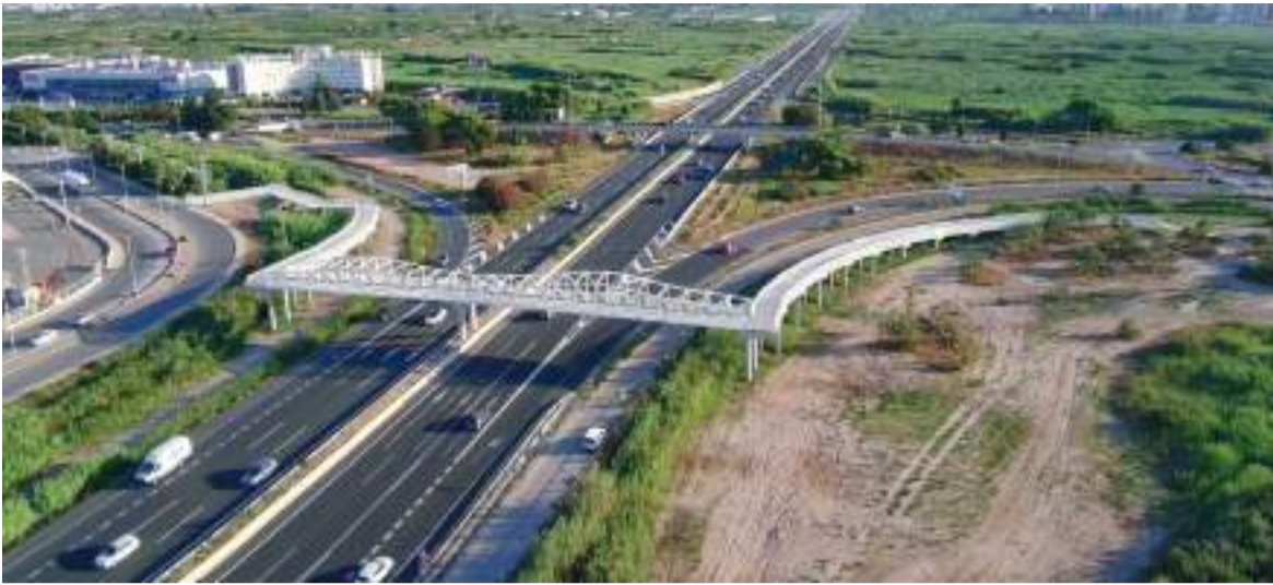
Passarel·la ciclopedestre de Massalfassar