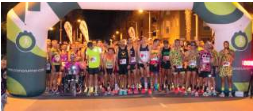
Gran Fons Nocturn