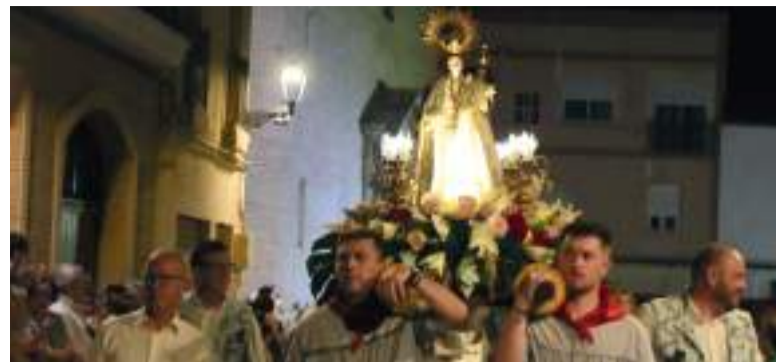
Processó en honor a la Mare de Déu de la Bona Mort