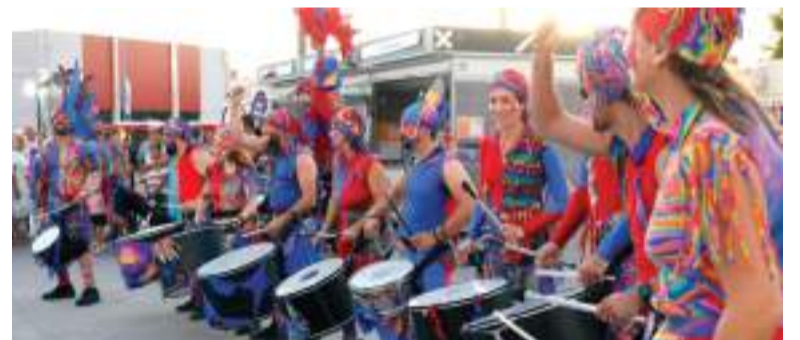
Gran festa d'inici de festes