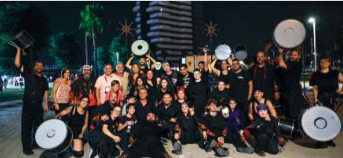
Correfocs a les festes de Mislata