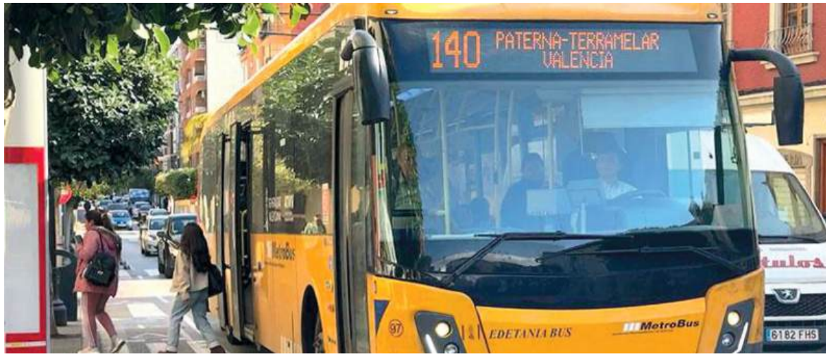
Bus 140 de Paterna

Una vegada finalitzada la xarrada, les i els presents podran també plantejar els seus dubtes als agents.