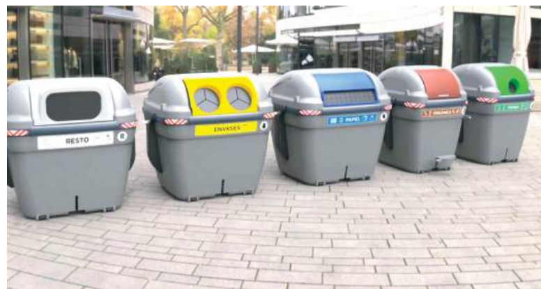
Imatges dels nous models de contenidors

L'Ajuntament preveu instal·lar-los després de l'eliminació de tots els fossats de contenidors soterrats destruïts després de la DANA, en un termini de 3 mesos.