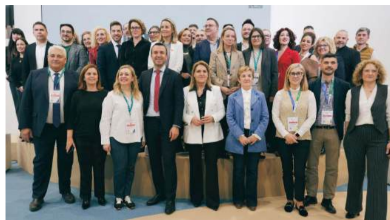
Presentació del potencial turístic de la província de València