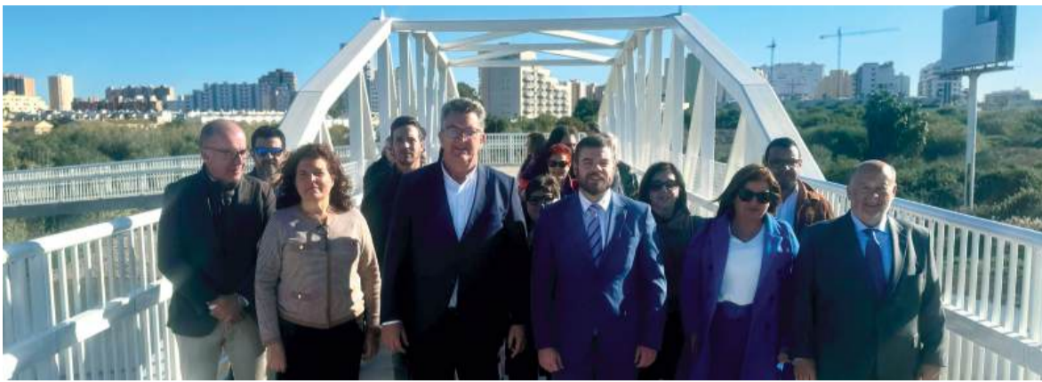
Obertura de la passarel·la