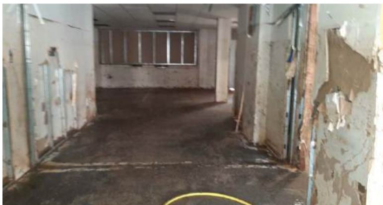
Com va quedar el centre després de la Dana