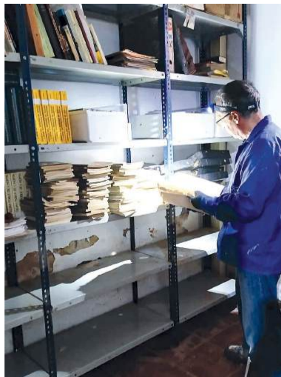
Recopilant documents d'una productora de cinema en Sedaví