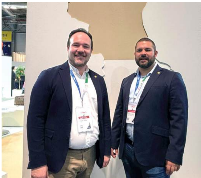
L'alcalde i el regidor de Turisme de Manises a Fitur