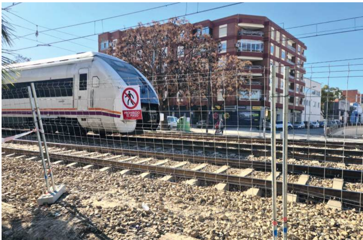
Imatge del tren entre Alfagar i Benetússer en l'actualitat

L'ALCALDE DEMANA SEGURETAT EN LES VIES DEL TREN QUE NOMÉS ESTAN SEPARADES DE LA POBLACIÓ AMB TANQUES