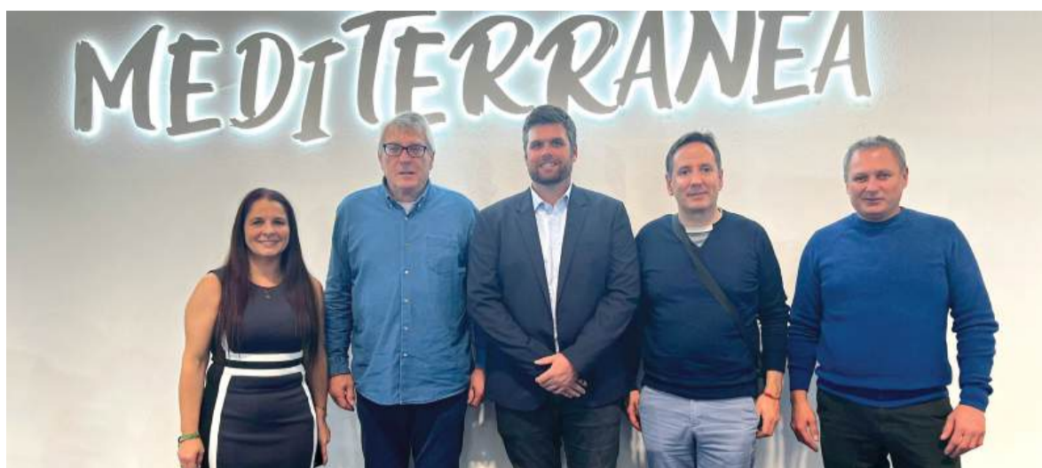
Presentació a la campanya a Fitur