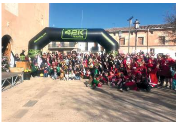
San Silvestre en Albalat dels Sorells