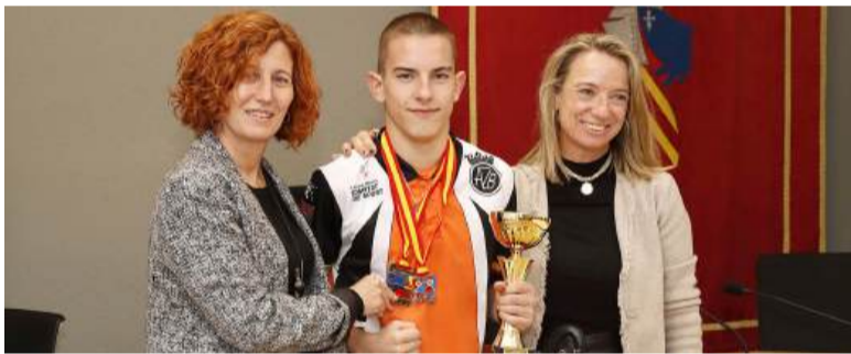
Héctor amb l'alcaldesa i la regidora