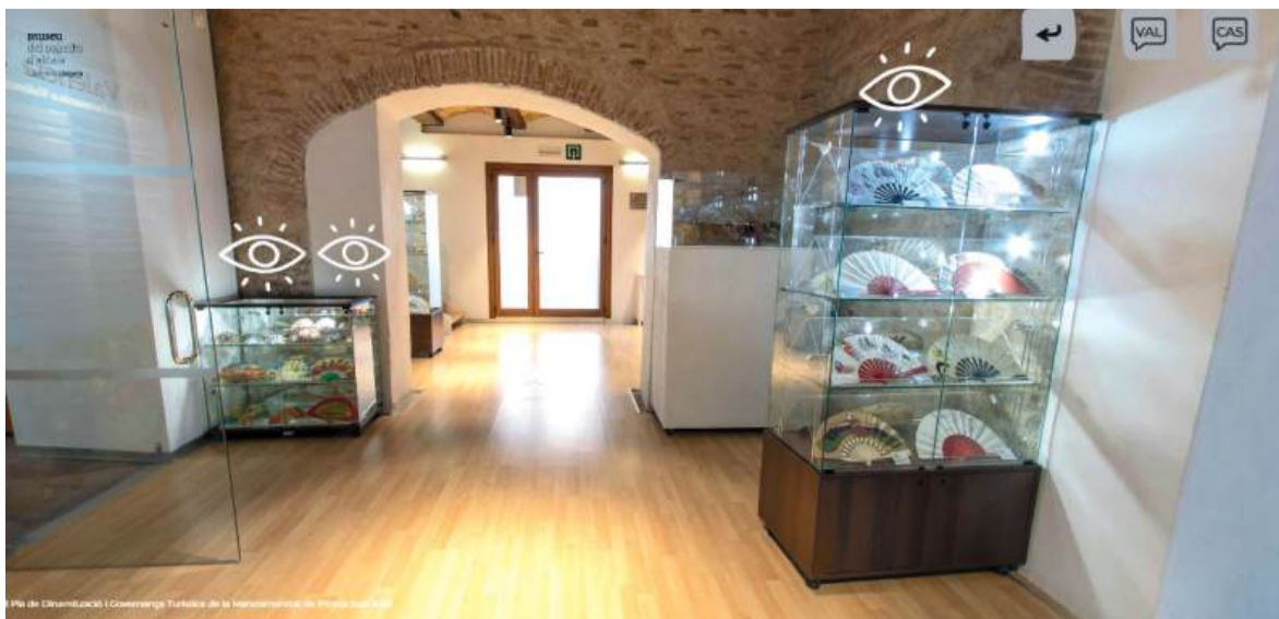
Així era la planta baixa del Museu del Margalló, ara destrossat per la Dana