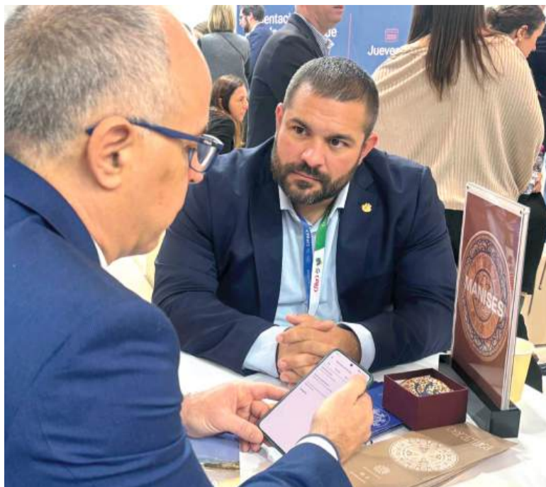
Durant la fira s'han realitzat diferents reunions per a presentar l'oferta turística de Manises