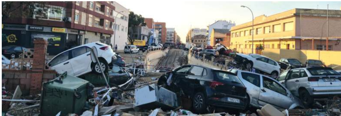
Benetússer, dies després de la Dana

L'IMPACTE DE LES INUNDACIONS SERÀ MOLT MÉS ELEVAT QUE EL QUE ES REFLECTIRÀ EN LA CAIGUDA DEL PIB INICIAL