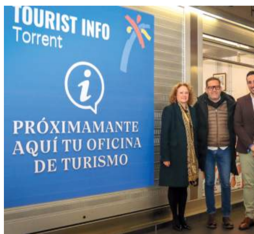
A Torrent, presentant l'oficina de turisme