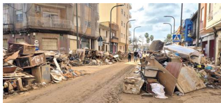
Massanassa, després de la Dana (imatge de novembre)

litzten tècnics de la Diputació de València. Està recuperant peces dels museus de Paiporta, Aldaia i també Algemesí.