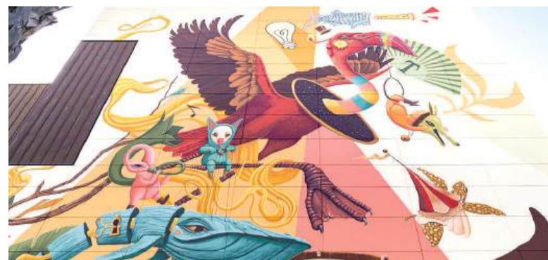
Mural al TAMA d'Aldaia