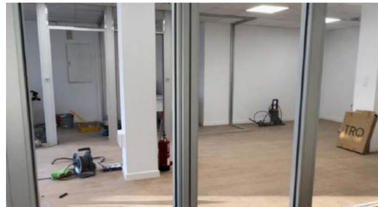
Obres després de la Dana

mitar les imprescindibles ajudes econòmiques.