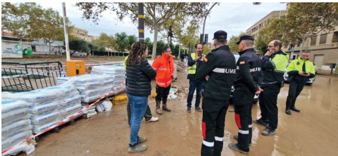
L'alcalde d'Aldaia i membres de la UME al costat del barranc, amb les portes trencades des del 29 d'octubre