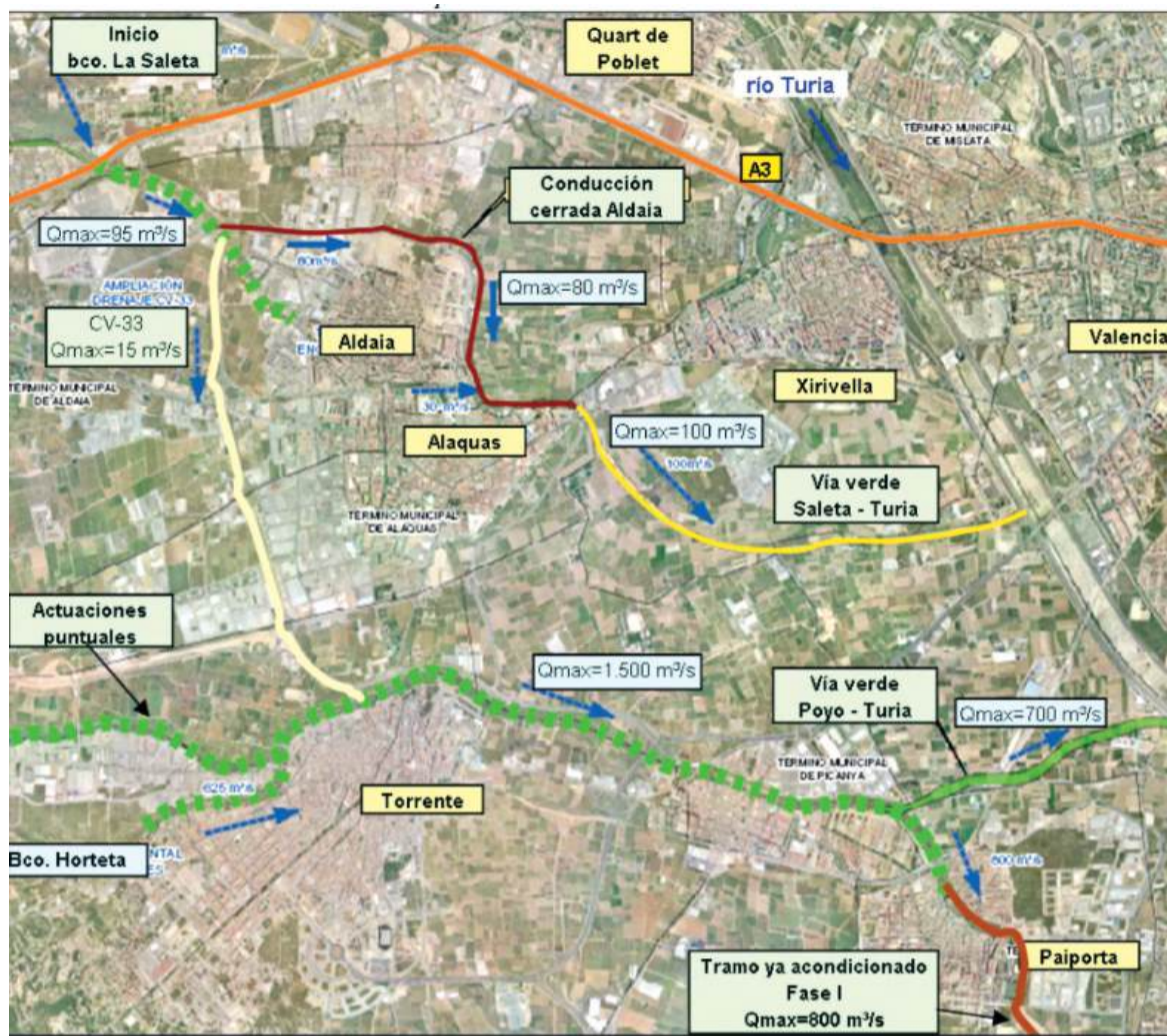
Esquema de la solució en la conca baixa del barranc de Poyo (CHJ).