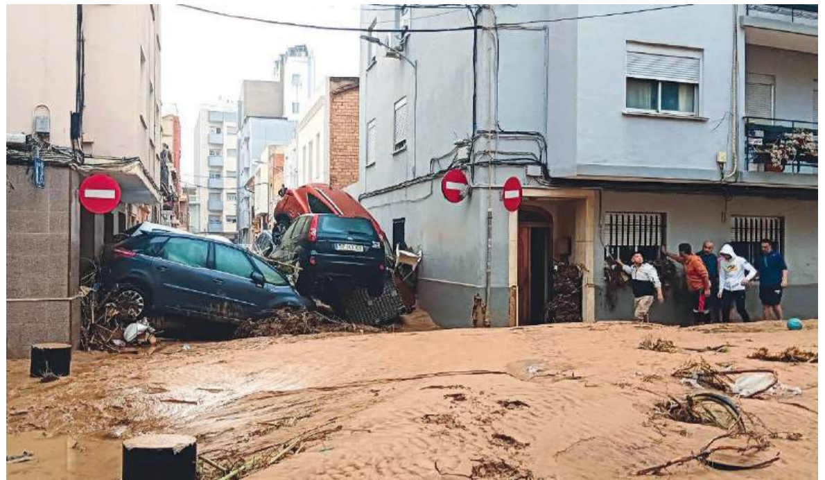
Fotos del cronista de Massanassa després de la riuada