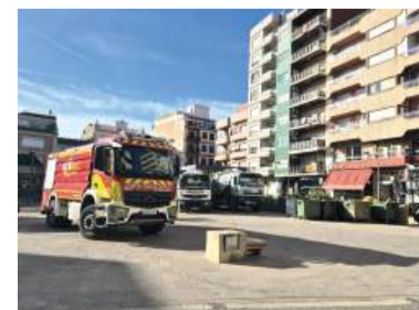
Plaça de l'Ajuntament

Malgrat la situació Sedaví és un dels pobles més avançats en la seua reconstrucció. S'han retirat la majoria dels cotxes de la campa. Els carrers estan nets i s'han retirats els enderrocs de murs.