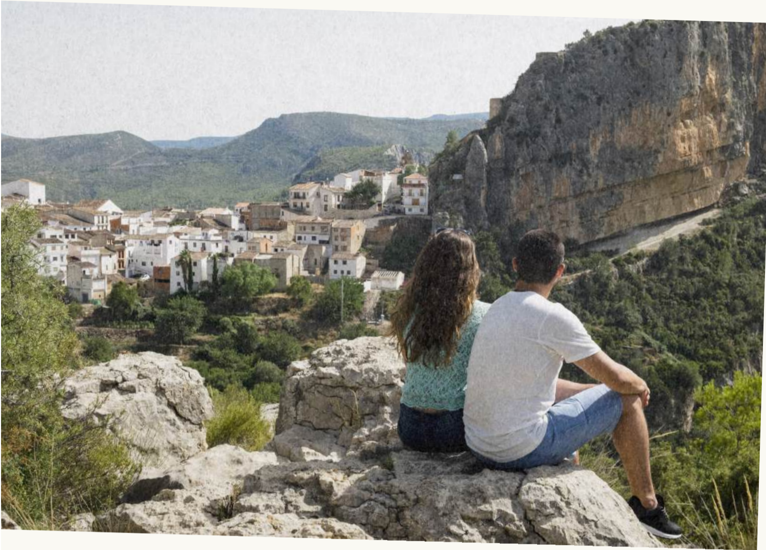
Pueblos del interior VALENCIA