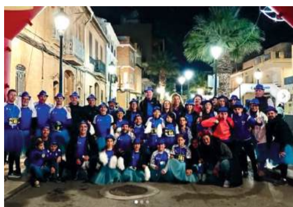
Organitzadors de la carrera en Albuixech