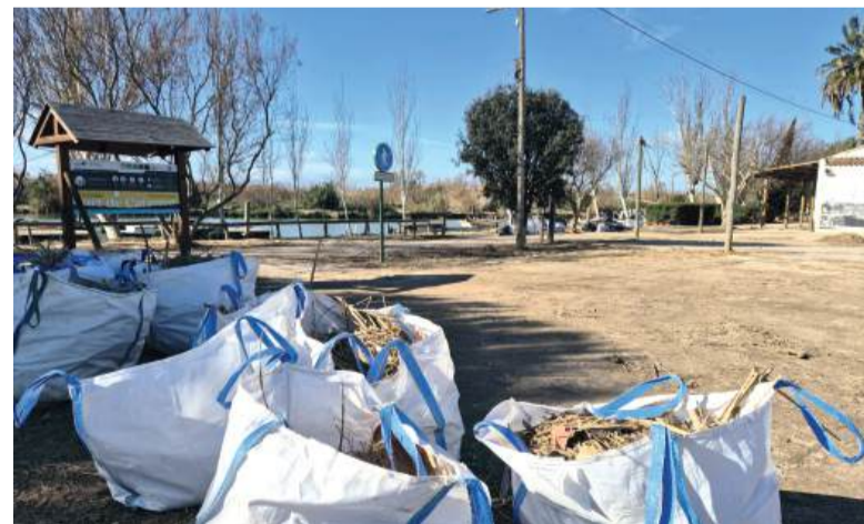
Port de Catarroja (10 de gener de 2025)

D'una banda, s'ha procedit a la retirada de residus voluminosos, estris i plàstics, que van anar a parar a este entorn natural. A més, també es van realitzar labors tant amb operaris com amb maquinària per a la retirada de canyes. S'han trobat bombones