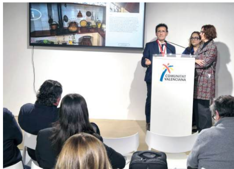
Presentació a Fitur