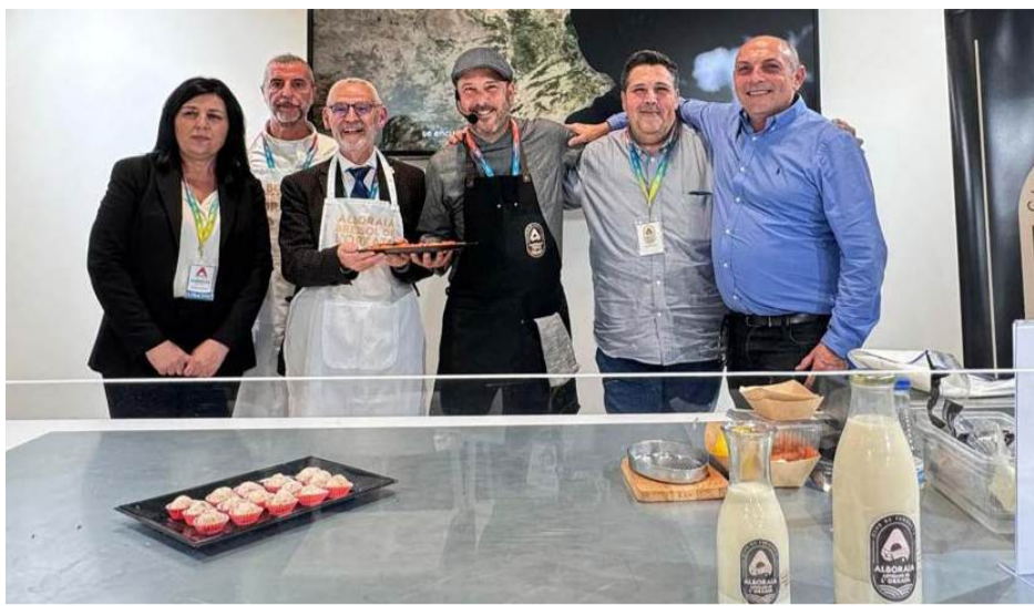
Al show cooking en directe es van elaborar plats amb orxata