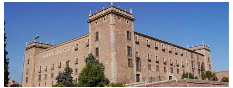
Monestir del Puig

Aquest projecte forma part del Pla de Sostenibilitat Turística en Destí (PSTD) i està finançat per la Unió Europea a través dels fons Next Generation-UE. Amb una inver-