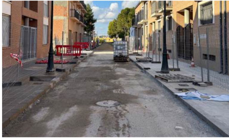
Carrer a Albuixech en obres

Esta actuació suposa una inversió de 483.606,04 €, en línia amb els Objectius de Desenvolupament Sostenible ( ODS ) que permetran realitzar importants millores en la infraestructura urbana creant un entorn més sostenible i accessible per a la ciutadania millorant així la qualitat de vida en el municipi d'Albuixech.