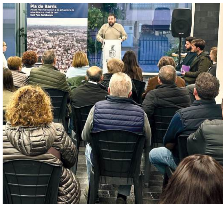
L'alcalde durant la presentació de l'oficina

Esta oficina, que ha suposat una inversió de 240.088,2 €, està situada a l'Auditori Municipal i donarà servici els dilluns, dimarts, dijous i divendres de 9h a 13h i dimarts i dimecres de 16h a 20h.