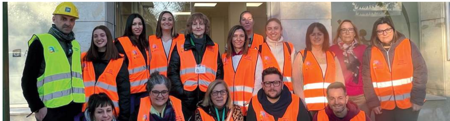
Treballadors de servicis socials i SAC d'Alfajar

L'objectiu és que les instal·lacions pogueren centralitzar la detecció de necessitats i l'organització d'ajuda a la població del barri, així com canalitzar l'atenció als col·lectius de població més vulnerables i específicament, prestar suport als damnificats per a tra-