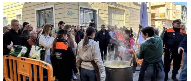
Es van servir 7.000 racions generoses elaborades en 35 calderes

Les obres es van iniciar el 8 de juny de 2023 i el termini d'execució ha sigut de 17 mesos. A més, l'actuació ha sigut finançada per la Unió Europea-Next Generation EU, a través del Pla de Recuperació, Transformació i Resiliència.