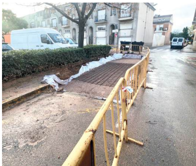
Treballs que s'estan realitzant per a tapar els soterrats