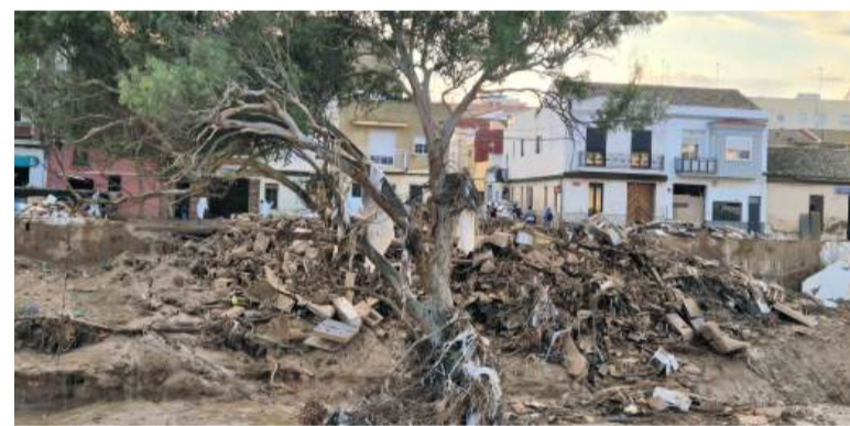
Barrancada del Poyo a Paiporta

La prioritat de l'actuació passa per reparar, reconstruir i reforçar els talussos més vulnerables amb l'objectiu de millorar el seu comportament enfront de futures