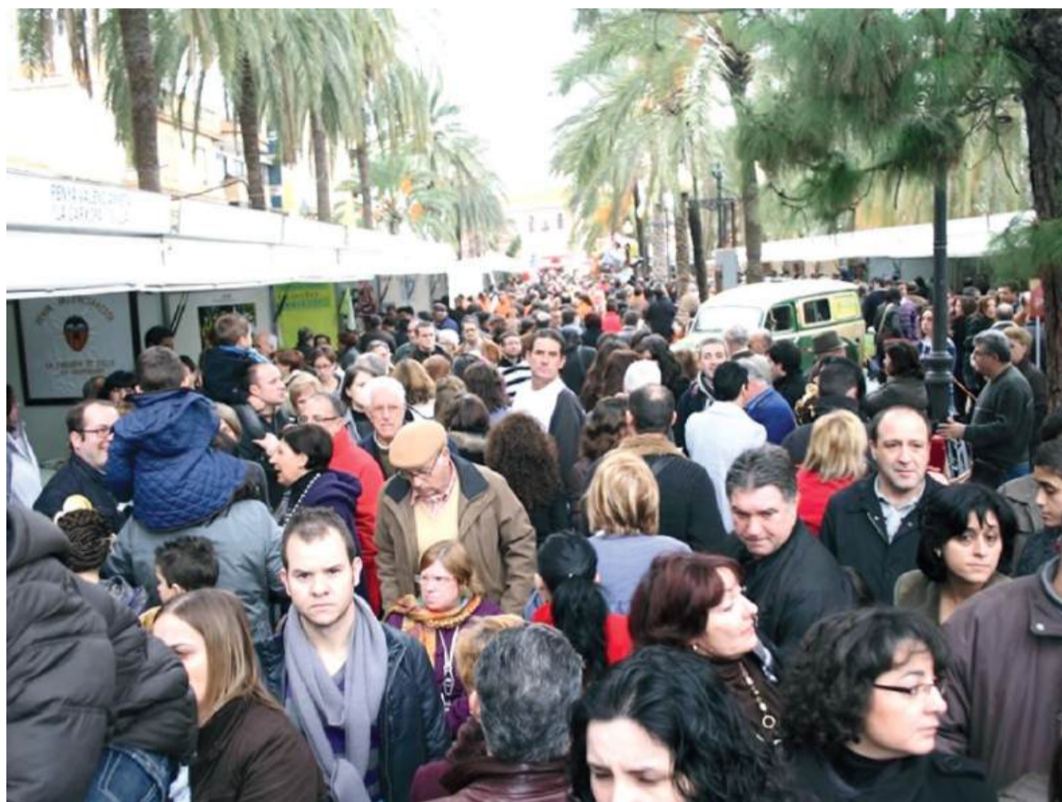
Imatge de la fira l'any passat

SILLA ES PREPARA PER A TRES DIES DE CELEBRACIÓ AMB LA 24A EDICIÓ DE LA SEUA EMBLEMÀTICA FIRA, OFERINT UNA RICA PROGRAMACIÓ CULTURAL, COMERCIAL I GASTRONÒMICA