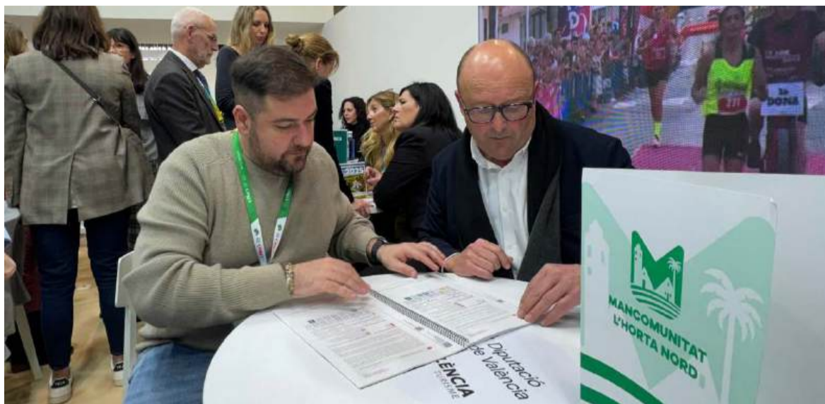
El president de la Mancomunitat va tindre diferents reunions per a presentar el pla turístic