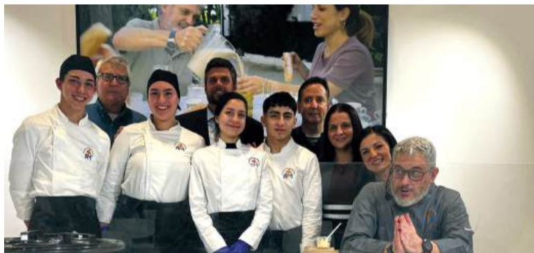
Show cooking a Fitur amb productes km 0

Després de l'eixida de Turisme Carraixet l'any passat de Meliana i Almàssera, el projecte s'ha hagut de redissenyar, "hi ha diversos factors que han fet redissenyar el projecte. Un d'ells va ser l'eixida de Meliana i Almàssera i, d'altra banda, la falta de suport econòmic de la Generalitat després de finalitzar