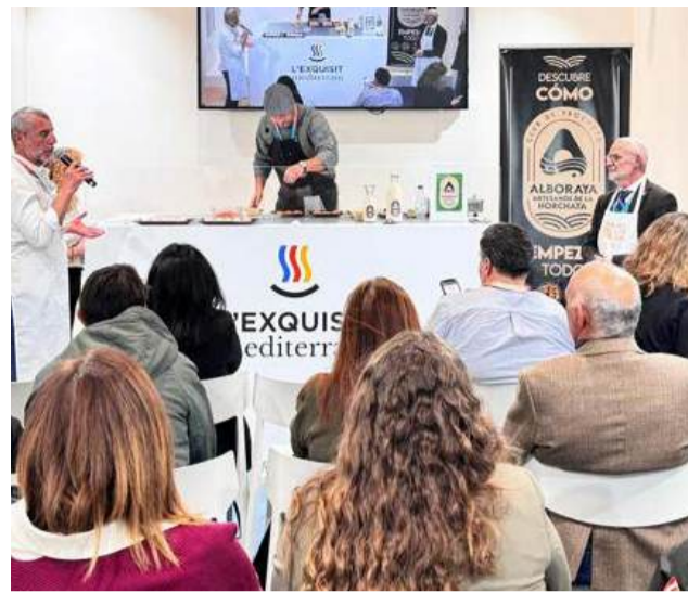
Show cooking a Fitur